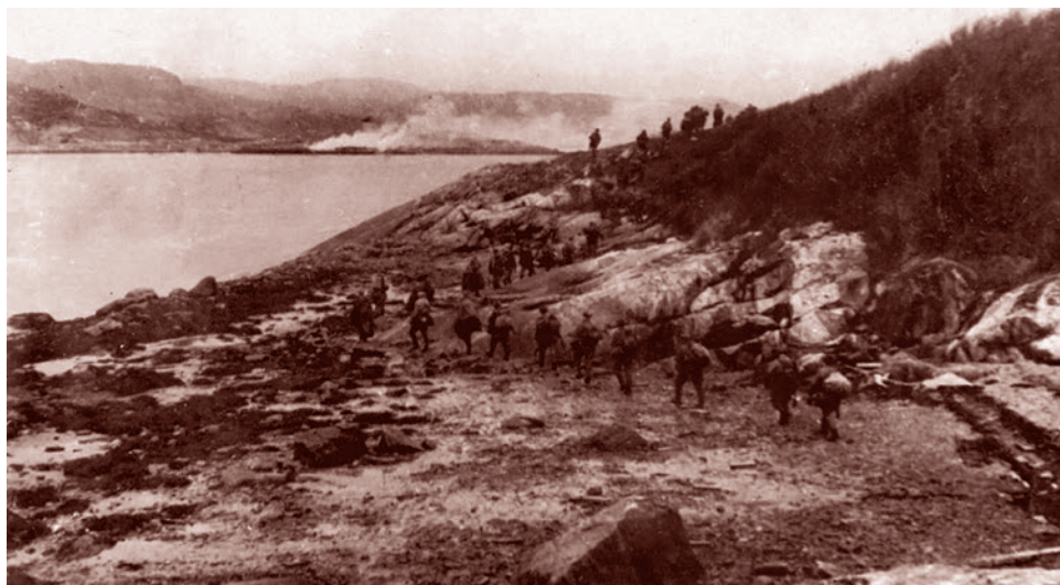
Советские войска на ближних подступах к Петсамо. Октябрь 1944 г.

ном ракурсе, то становится более понятным и неблагоприятное отношение стран, в частности Восточной Европы, к России сегодня. В те годы они не очень рвались, чтобы их «освобождали», — и в наши дни вполне радостно и добровольно приняли на себя роль антироссийского буфера НАТО.