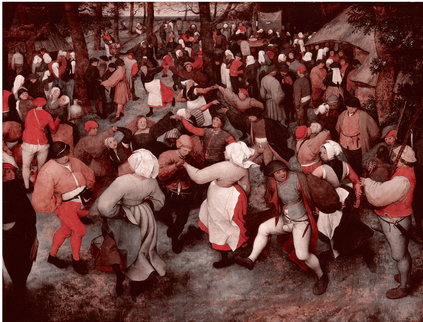
Питер Брейгель Старший. Свадебный танец. Ок. 1566

Обстоятельство № 2 — сам Людовик XVI очень хорошо был осведомлен