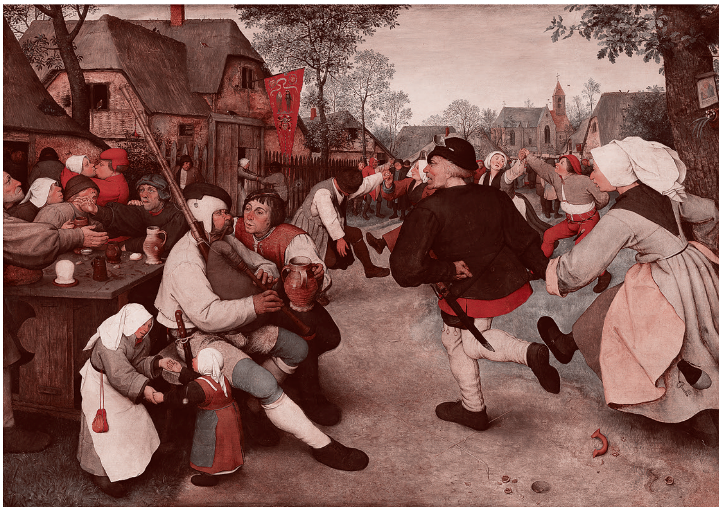
Питер Брейгель Старший. Крестьянский танец. 1568

Значит, очевидным образом даже самая элементарная благодать в советском образе жизни была. И к ней ведь всё не сводилось. Было и многое другое, реально реализуемое и не существовавшее ранее