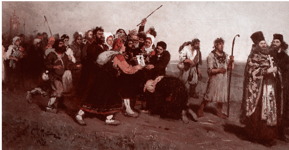
Илья Репин. Крестный ход (эскиз). 1877

Газета «Суть времени» зарегистрирована Федеральной службой по надзору в сфере связи, информационных технологий и массовых коммуникаций (Роскомнадзор) Свидетельство ПИ № ФС77-50554 от 9 июля 2012 года