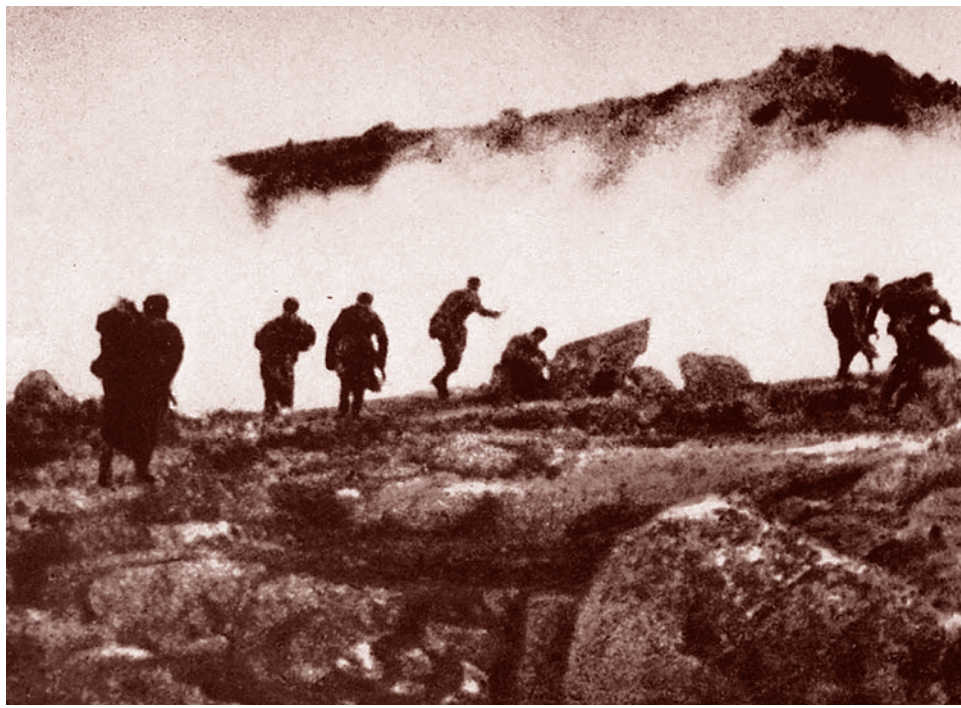
Советские бойцы атакуют противника в районе Петсамо. Октябрь 1944 г.

Итак, если рассматривать ситуацию конца войны в Европе в таком неделикат-