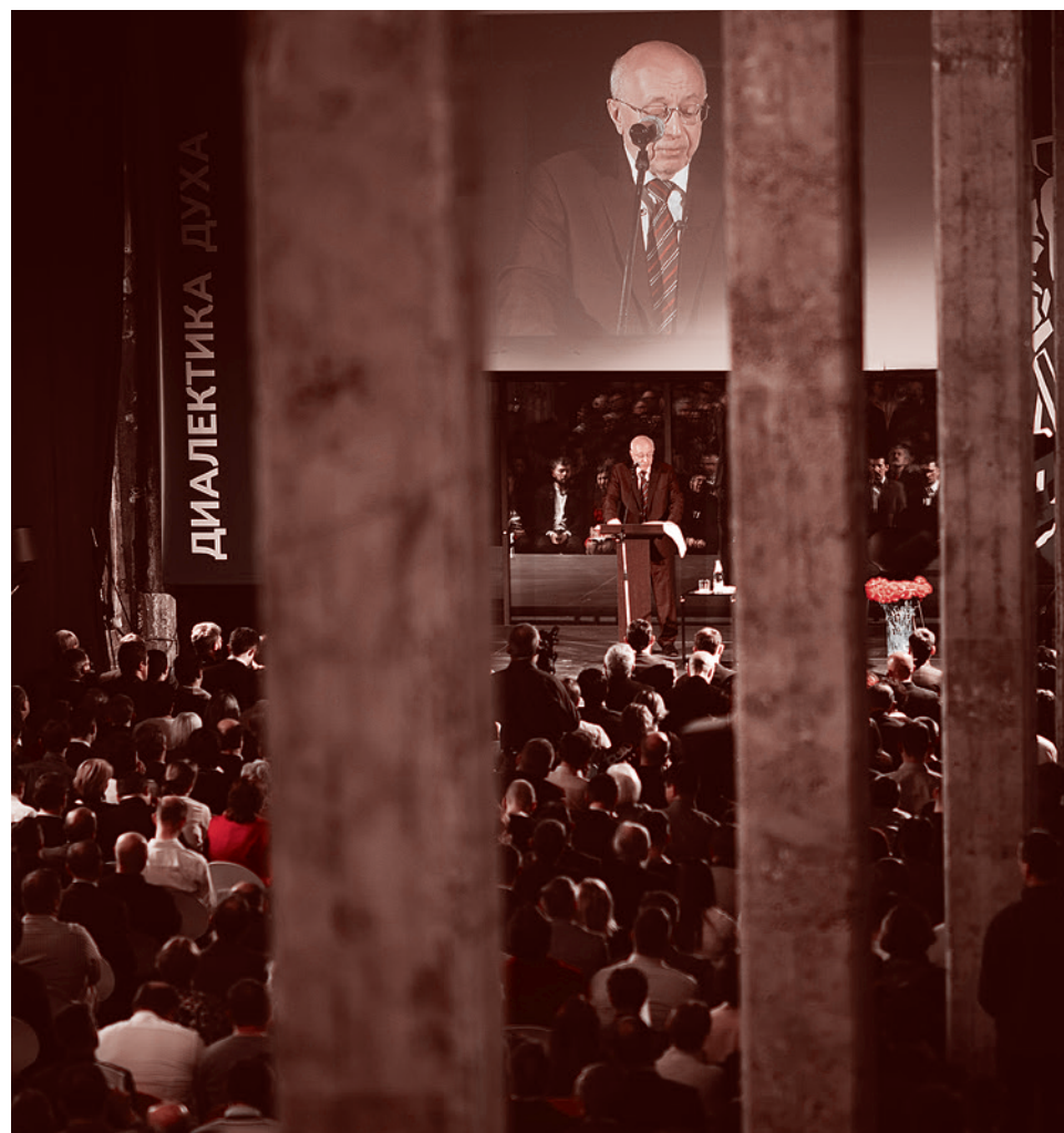
Конференция движения «Суть времени» 16 ноября 2019 года

Жизнь не стоит на месте. Появляются новые знания об окружающем мире и новый исторический опыт. Этот опыт осмысливается людьми, желающими влиять на развитие, и учитывается при достижении к целям. Те, кто, как и Маркс, хочет развития человеческих сил, освобождения человеческой сущности от оков материальной необходимости, не могут не учитывать факт разрушения Советского Союза — первого в мире государства, в котором коммунистический манифест был ориентиром. Невозможно не учитывать факт того, что выросшие в советское время люди либо ставили приоритетом материальные блага, либо отстранялись от участия в судьбе страны и своим бездействием допустили отказ государства от коммунистических целей. А это значит, что идеи Маркса о движущих силах развития человечества на сегодняшний день требуют обновления и дополнения с учетом новых данных, если мы хотим не просто возмущаться нынешним устройством общества, а менять мир.