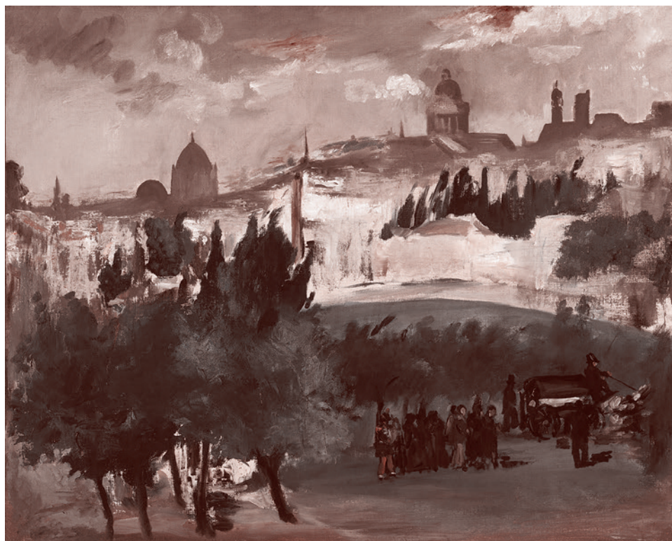
Эдуард Мане. Похороны. Ок. 1867