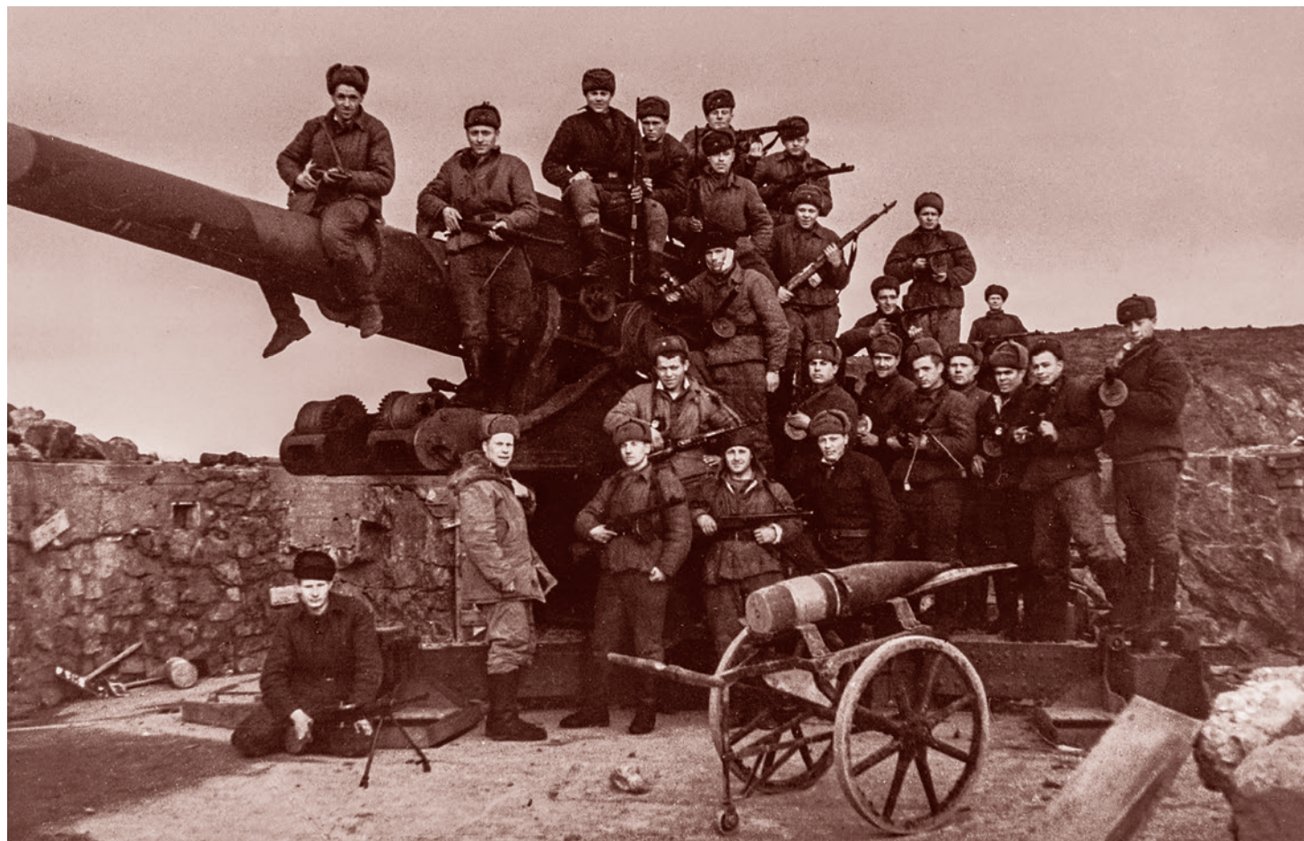
Бойцы 12-й бригады морской пехоты Северного флота на огневой позиции захваченной немецкой береговой батареи Н.К.В. 2.-773 в Лиинахамари (Петсамо-фиорд). Октябрь 1944 г.