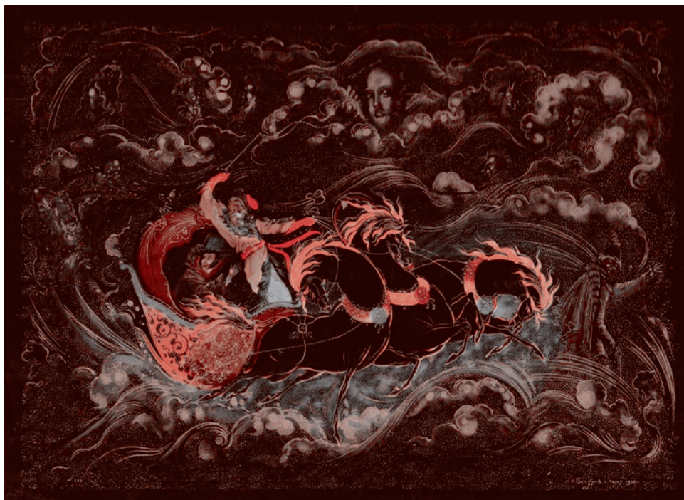
Иван Вакуров. Бесы. Шкатулка. 1935