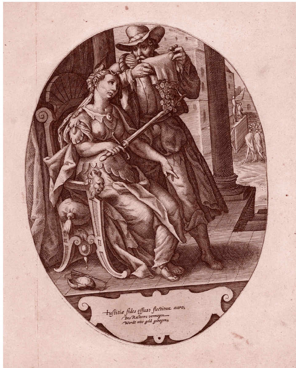
Ламберт Корнелис. Аллегория о Юстиции и ловушках Коррупции. 1590–1630

В итоге информационный фон, созданный медиа, оказал давление на законо-