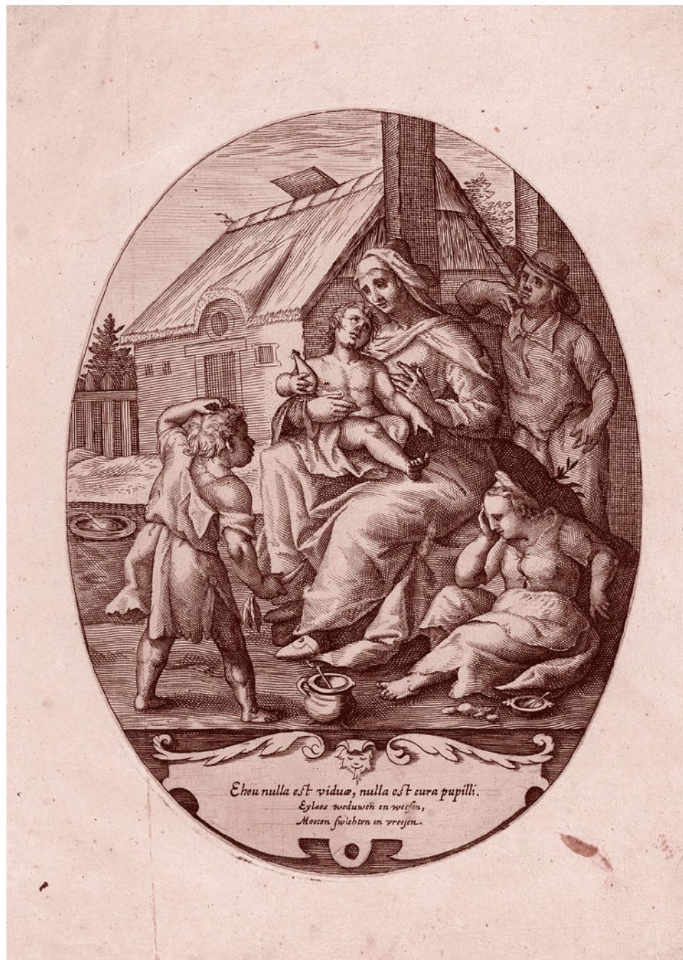
Ламберт Корнелис. Аллегория Вдовства и Сиротства. 1590–1630

3) Что мы получим с точки зрения реальной «профилактики» насильственной преступности? Только проблемы. Профилактика — это в первую очередь искоренение причин преступного насилия (пьянство, безработица, заполненное развратом и пошлостью информационное пространство, разрушенный образовательно-воспитательный процесс и др.). Поэтому и название закона — ложь.