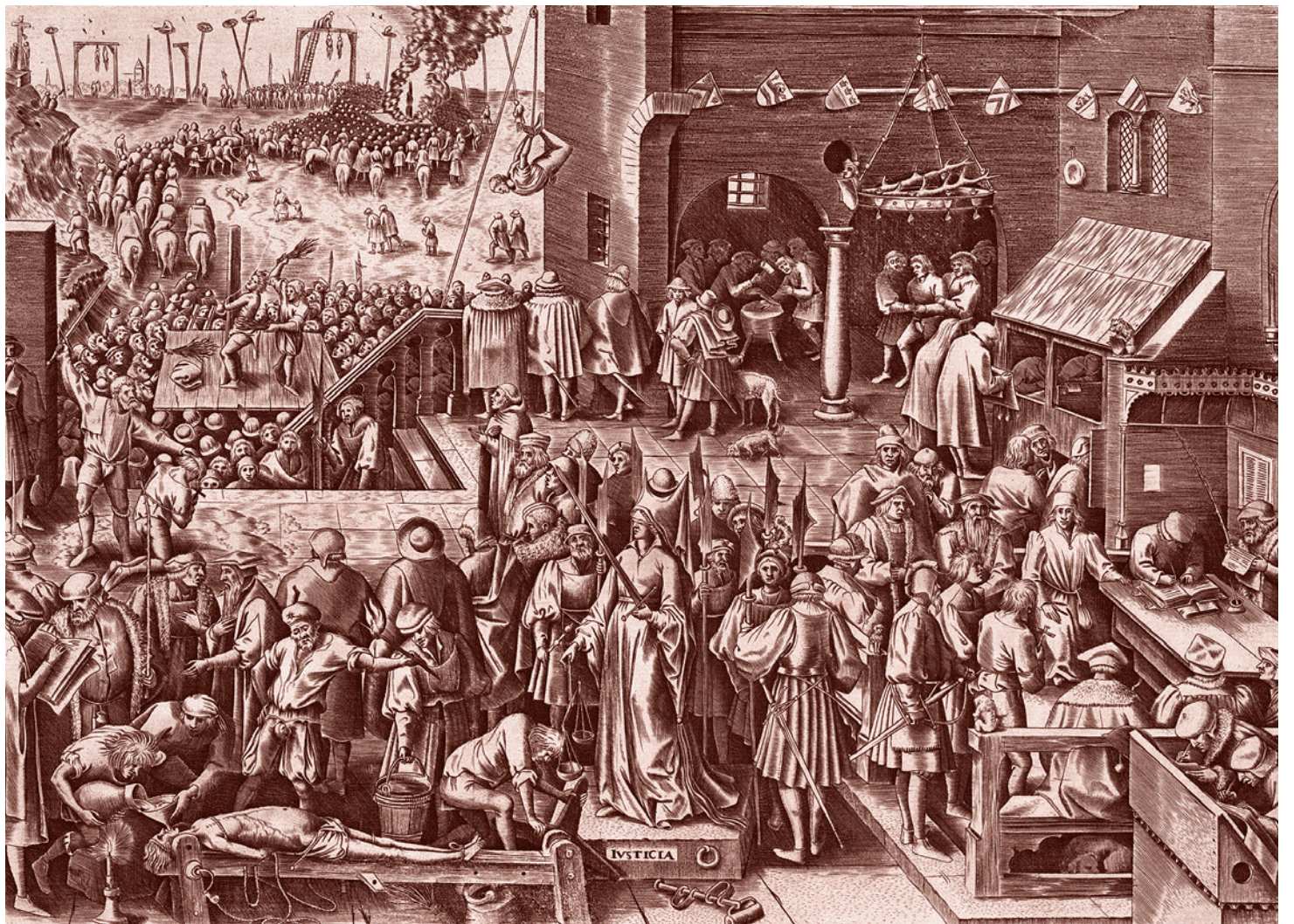
Филипп Галле. Юстиция, из Добродетелей. Ок. 1559–1560 гг.

Какие доказательства? Любая супружеская пара, со дня свадьбы, в первую очередь старается отделиться от родителей.