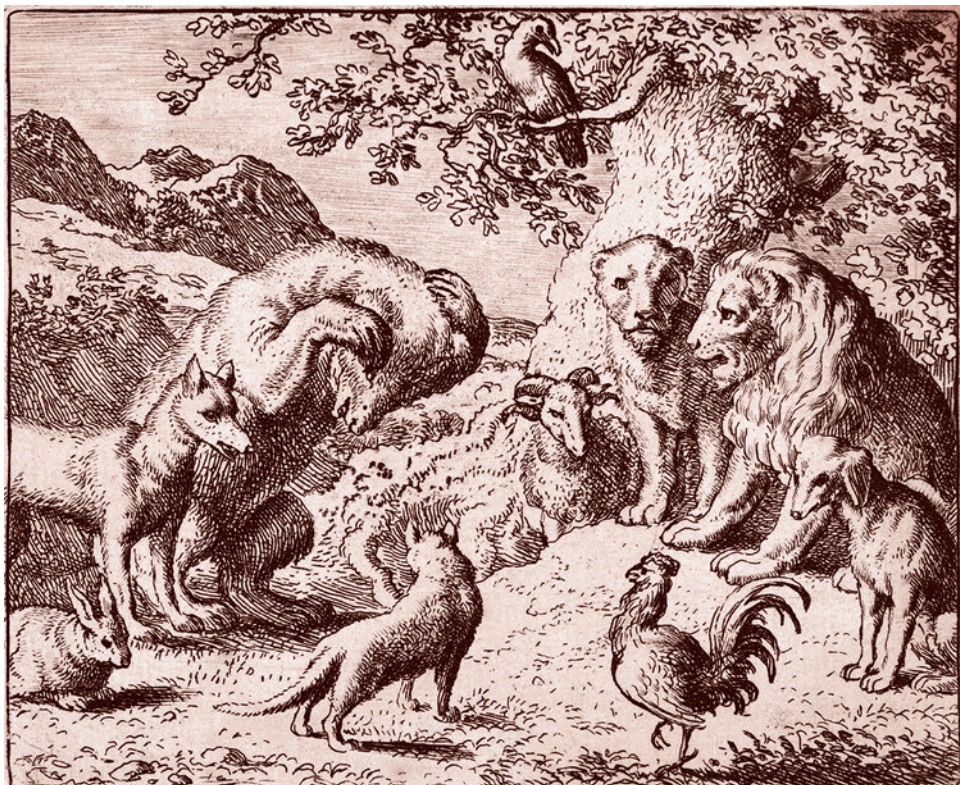
Алларт ван Эбердинген. Медведь ищет правосудия у Льва против Лиса и Кролика. 1650–1675