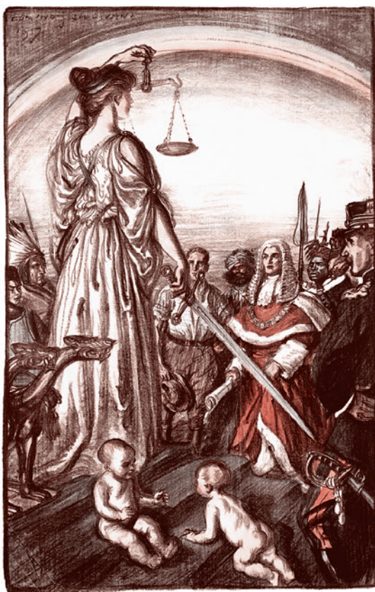
Эдмунд Дж. Салливан. Царство правосудия. 1917

Субъективность толкования термина является, как известно, коррупциогенным фактором. Введение термина «психологическое насилие» может повлечь колоссальные злоупотребления не только со стороны чиновников, но и со стороны недобросовестных заявителей (в том числе представителей НКО, которым законом делегируется существенный объем прав по выявлению семейного насилия), рост коррупции, массовые изъятия детей, разводы, а также незаконное отчуждение собственности (законопроект регламентирует, что на основе судебного защитного предписания « семейный нарушитель » может быть обязан покинуть жилое помещение, в котором он проживает, даже если он является его собственником). А замена «заявительного порядка» обращений на «выявительный», когда сообщать о факте любого, даже неявного психологического насилия смогут любые анонимные «доброжелатели», повлечет за собой массовые обвинения невиновных людей и незаслуженные наказания, учитывая, что отдельные меры принуждения к «наильнику» предполагается применять до вынесения судом решения о его виновности.