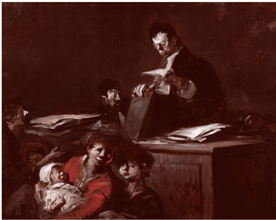
Жан-Луи Форейн. Адвокат и обвиняемый. 1908

Процедура привлечения виновного к ответственности упростилась, ускорилась. После задержания в течение двух суток может быть составлен административный протокол, проведено расследование, после чего материал должен направляться судье для рассмотрения. Тот в свою очередь вправе принять постановление о назначении виновному меры наказания в виде ареста вплоть до 15 суток. За это время потерпевший может принять меры для самосохранения: найти безопасное место