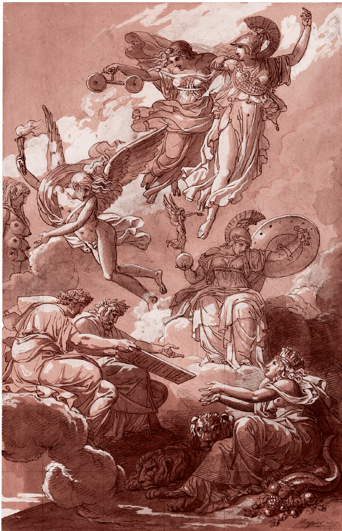
Шарль Менье. Императоры Адриан и Юстиан передают Земле свод римского права. 1802–1803

С 1997 г. центр «АННА» финансировался фондом Форда (перечислил свыше $2 млн). Специалистам хорошо известно