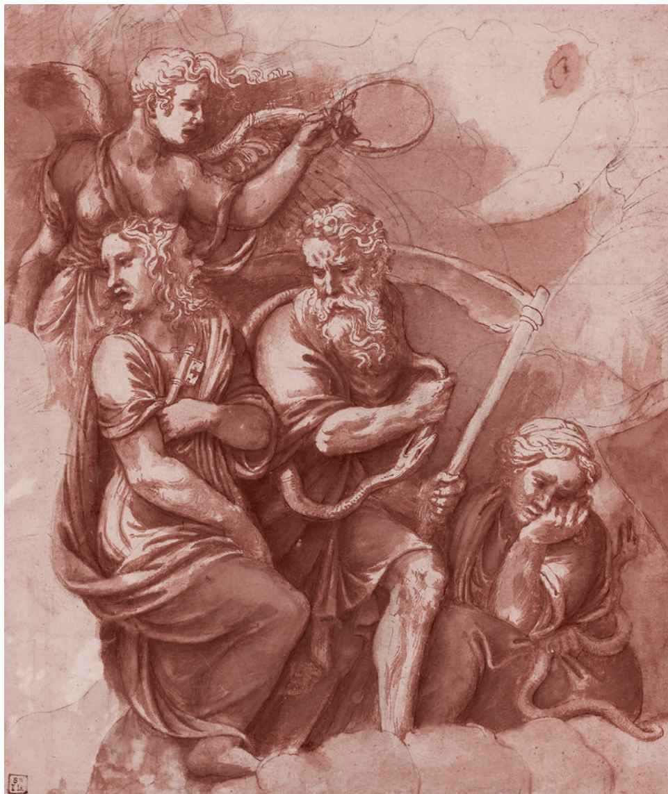
Джулио Романо. Победа, Янус, Хронос и Гайя. 1532–1534

Значит, дело в том, что у Лилит в XXI веке есть почитатели и почитательницы. Много их или мало — отдельный очень важный вопрос. Но сначала мы должны установить, что таковые имеются. Возможно, они были всегда. Но у тяготеющих к Лилит было много причин для того, чтобы сдерживать подобное тяготение. Одной из таких