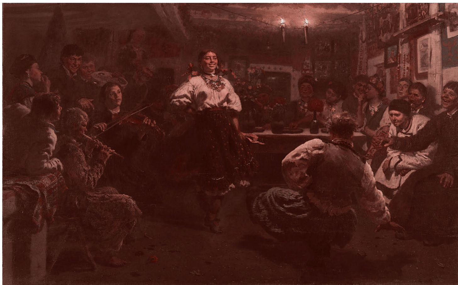
Илья Репин. Вечорниця. 1881