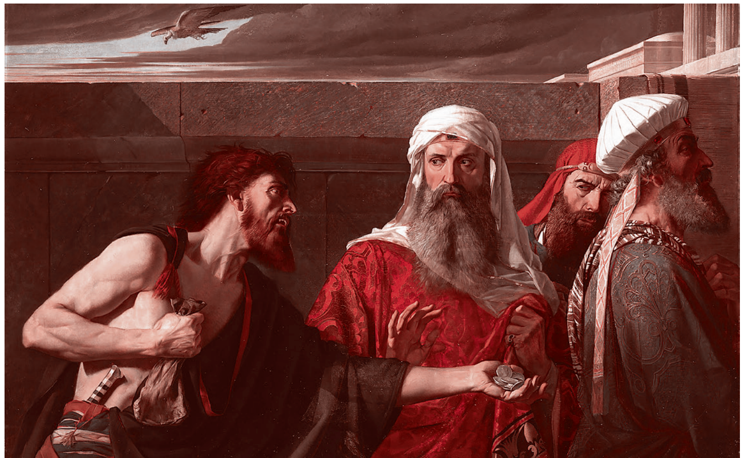
Эдвард Армитидж. Раскаивание Иуды. 1866

Я возвращаюсь к фигуре Мережковского и его размышлениям о мещанстве вовсе не потому, что эти размышления мне кажутся особо мудрыми и глубокими, а потому, что, будучи и злобно-антисоветскими, и рафинированными в худшем смысле этого слова, и близкими к фашизму, эти размышления являются еще и оскорбительно справедливыми.