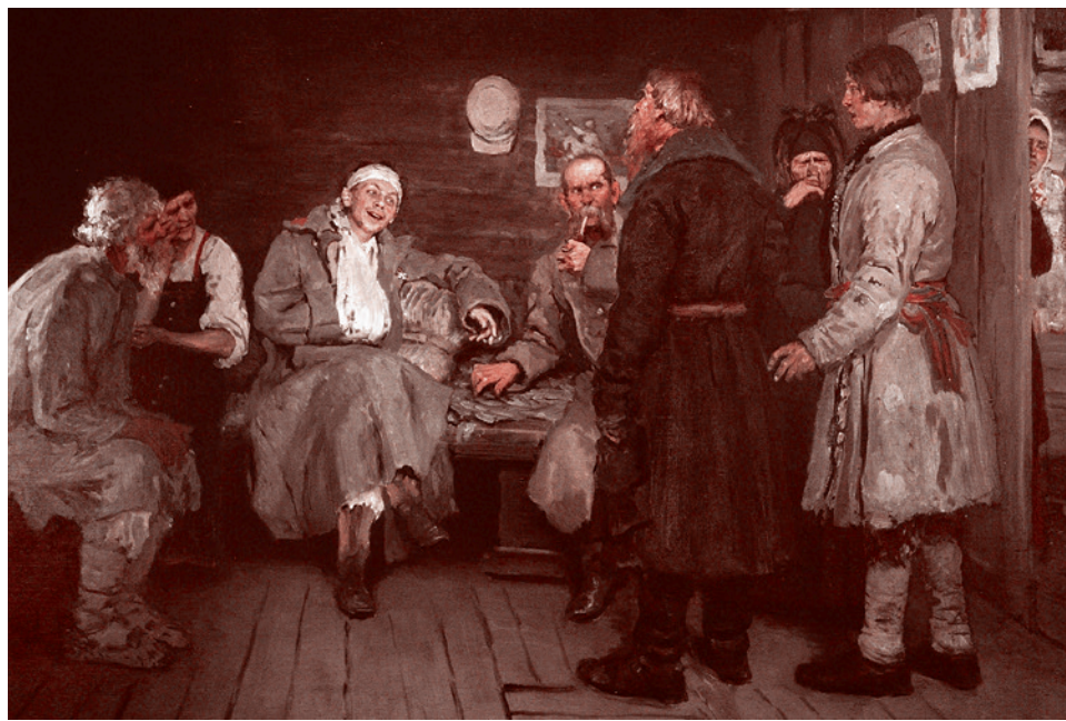
Илья Репин. Вернулся. 1877

После недолгого пребывания в Петербурге и (проезде) Москве, встреч с друзьями и хорошими знакомыми (Крамским, Стасовым, Мусоргским, Третьяковым и др.), осенью 1876 года Репин направил-