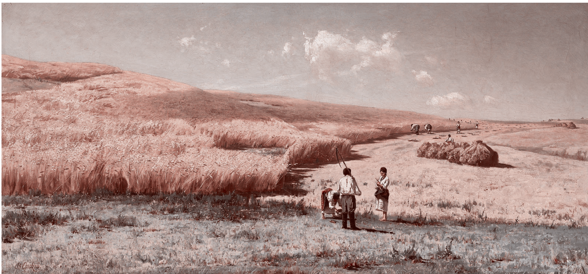
Владимир Орловский. Урожай на Украине. 1880

Н а Украине в октябре 2020 года (уже через год!) планируется открыть рынок земли. Это означает, что земли сельскохозяйственного назначения (этот тип земель отличается от земель для строительства, они оформляются разными актами и регулируются разными законами) будут продаваться любому физическому и юридическому лицу — иного мнения на этот счет у текущей власти нет.