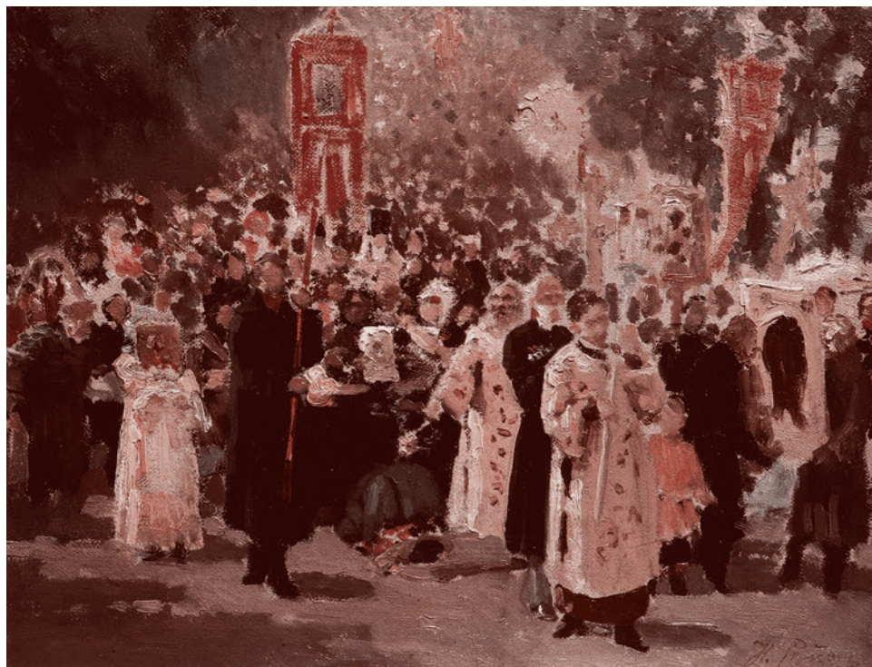
Илья Репин. Крестный ход в дубовом лесу. Явленная икона. 1878

Первая часть замысла была реализована в двух вариантах — эскизе «Крестный ход» (1877) и картине «Крестный ход в дубовом лесу. Явленная икона» (1877–1924) — к которой он не раз возвращался, в том числе в послереволюционный период. В этих вариантах художник в каком-то смысле ближе к картине Перова, подчеркивая в забитой и еще однородной массе крестьян начала темноты и суеверия. Если сытые и равнодушные попы исполняют