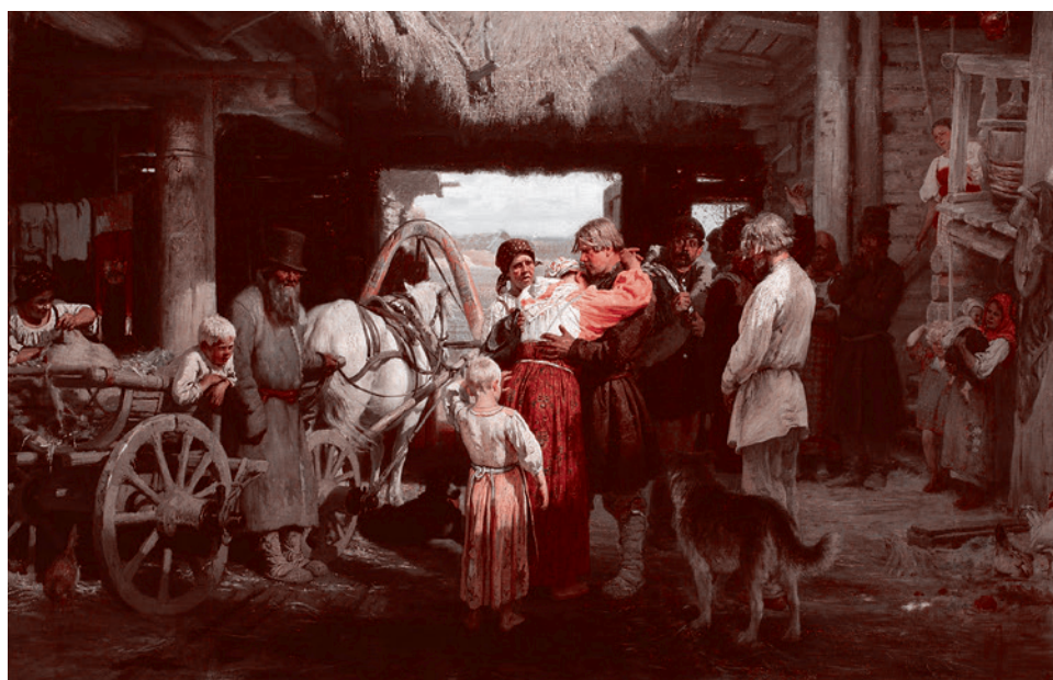
Илья Репин. Проводы новобранца. 1879

ся на малую родину, в Чугуев, где за полтора года создал много картин, рисунков, этюдов и эскизов, над сюжетами которых работал и позже. Во второй половине 1877 года он переехал в Москву, где жил до 1882 года, проводя летние месяцы в Abramceve и его окрестностях, а также посетил в начале 1880-х годов Курскую губернию и Украину (вместе со своим учеником В. Серовым).