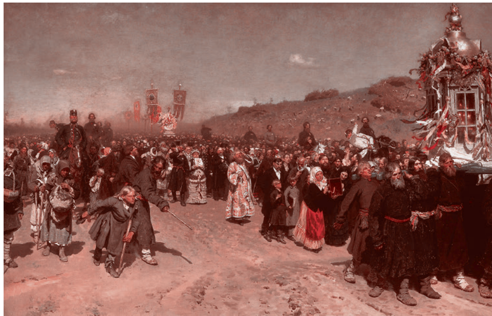
Илья Репин. Крестный ход в Курской губернии. 1880–1883

свою «пастырскую» миссию равнодушно и чужды «пастве», то последняя доходит до экзальтации. Впереди идущие отталкивают друг друга, чтобы быть поближе к святыне, кто-то старается коснуться иконы или даже подлезть под нее.