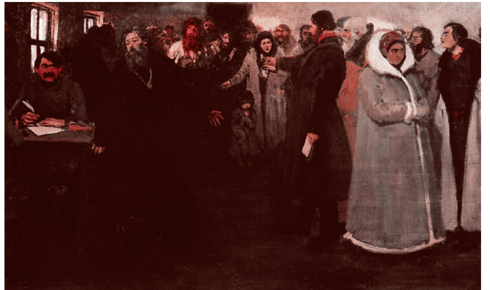
Илья Репин. В волостном правлении. 1877