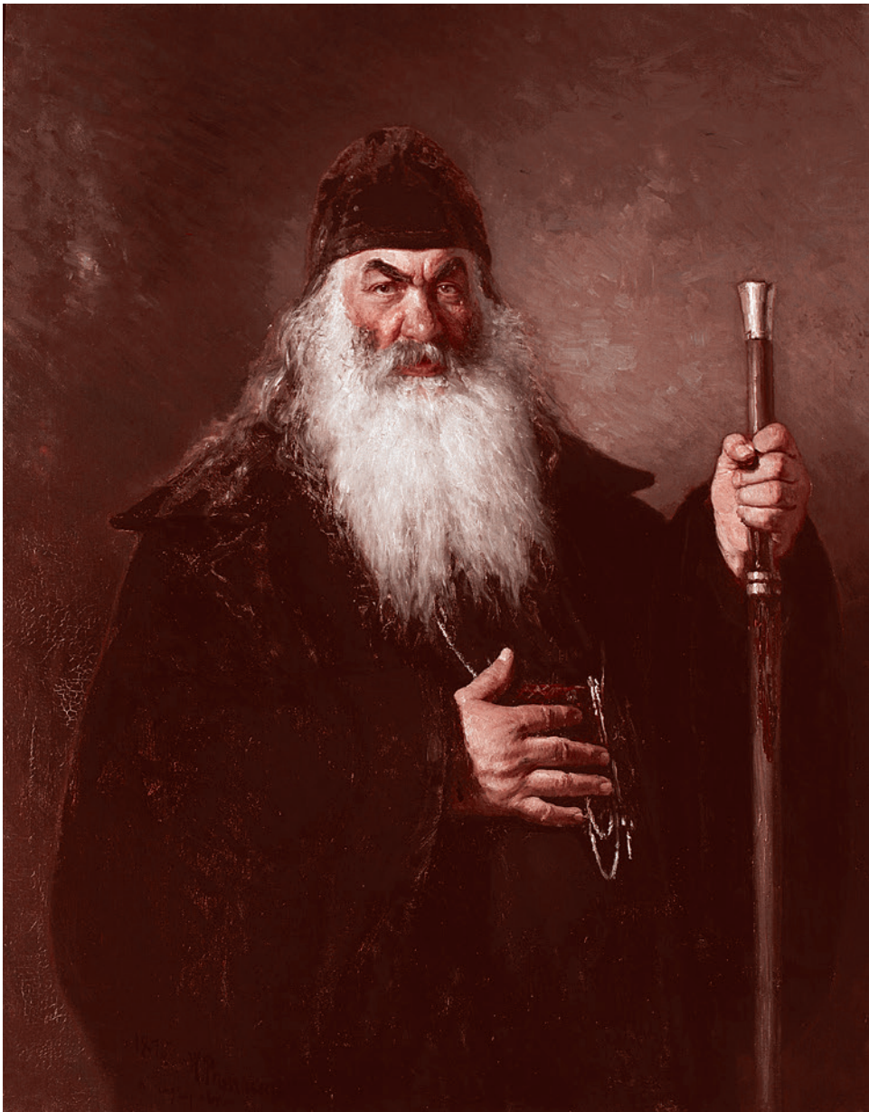
Илья Репин. Протодиякон. 1877

Так, Д. Сарабьянов справедливо отмечал, что картина Репина «В волостном правлении» (1877, на выставке отсутствует), очень близка одному из эпизодов дневника народника Г. Успенского «Из деревенской жизни» (1877–1880), описывавшего неравный спор кулаков-мироедов и бедняков. «Главные заправилы деревенского мира — староста, поп и писарь — выдвинуты на первый план; сзади у входа толпятся измученные, забитые и загнанные бедняки» (Д. Сарабьянов). Одного из этих бедняков — затравленного, озлобленного, но бессильного, Репин с удивительной психологической глубиной и точностью запечатлел крупным планом («Мужичок из робких», 1877). А в портрете «Мужик с дурным глазом» (1877) художник подчеркнул «хитрость, смекалку. Это человек «себе на уме», с кулацкой повадкой, способный обмануть и продать» (Д. Сарабьянов).