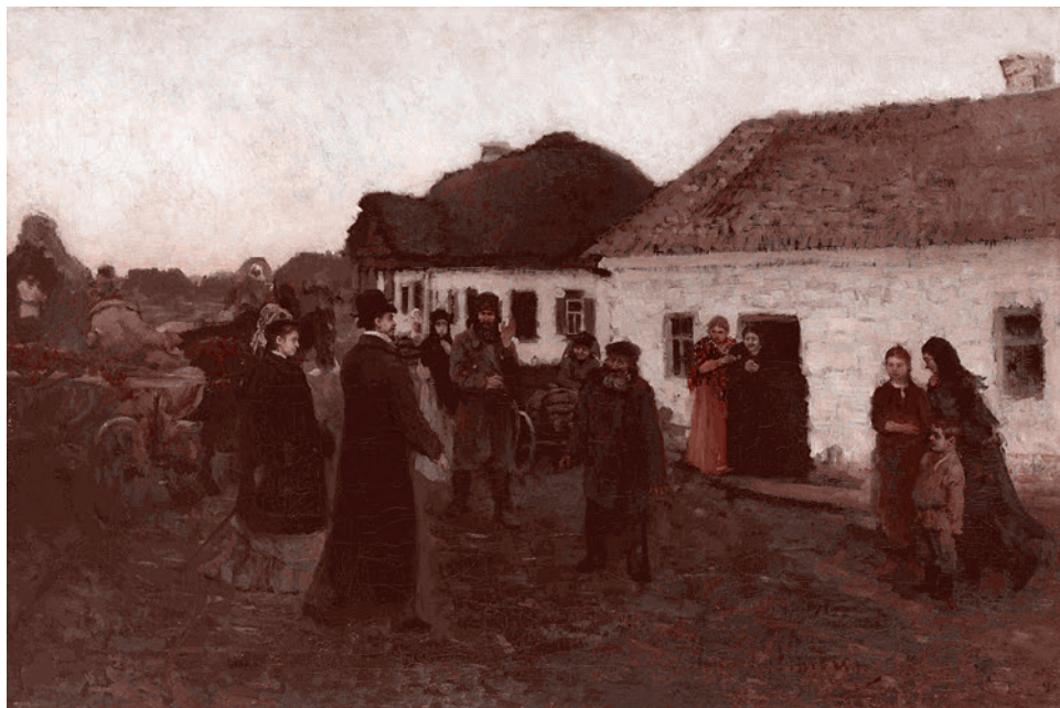
Илья Репин. Возвращение в отчий дом. 1876

Поговорим мы и о судьбе Репина и его наследия в советское время, в том числе о действительном соотношении «официально-догматичного» и подлинно-творческого в восприятии и осмыслении его личности и творчества в искусстве и искусствознании 1930—1990-х годов, также во многом шельмуемых в наши дни.