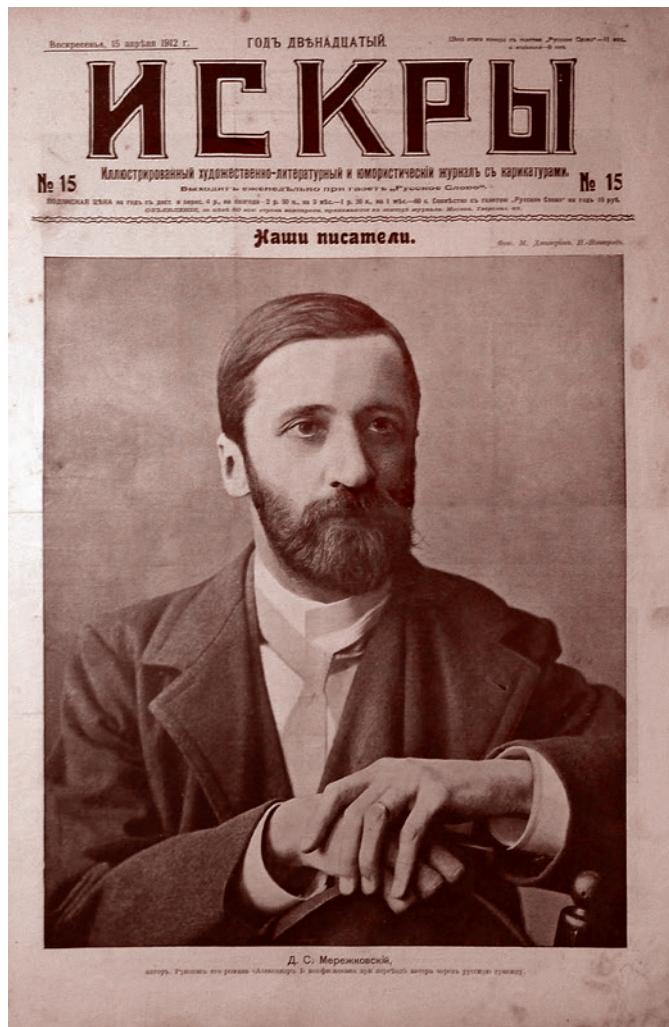
Портрет Мережковского на первой странице журнала «Искры» от 15 апреля 1912 года

Никто из великих людей восславить эту победу не мог. А Мережковский — мог. Мережковский нагло брешет по поводу того, что он ненавидит мещанина. Это Герцен ненавидит мещанина. А Мережковский — нет. Мережковский мещанином любит, потому что он сам мещанин. Но он не обычный мещанин. Потому что обычный мещанин не любит своей низостью — обычный мещанин любит своей добродетельностью. А низость свою приберегает для конкретного инстинктивного поведения, оно же — хватательный рефлекс. Цапнув что-нибудь при помощи