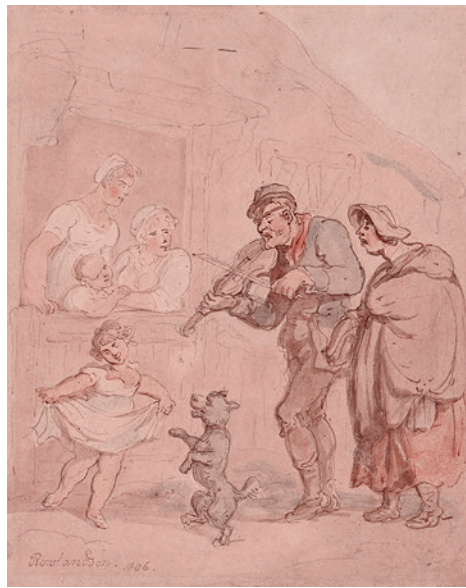
Томас Роуэлдсон. Слепой скрипач. 1806

Для начала доктор предложил «утилизировать» высвободившуюся рабочую си-