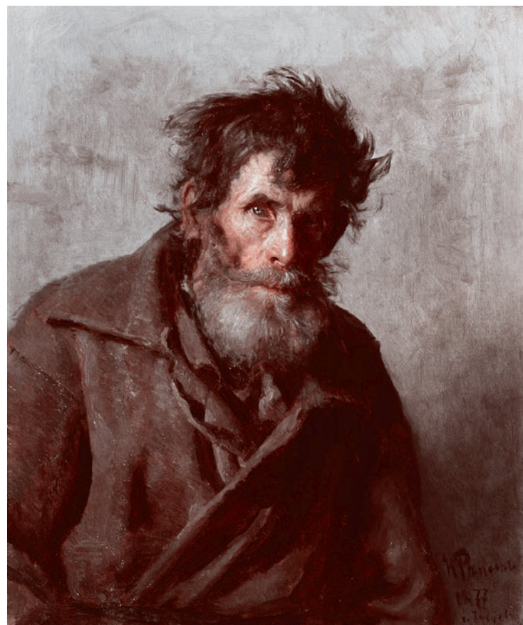
Илья Репин. Мужичок из робких. 1877

не полагается ничего духовного, — весь он плоть и кровь, лупоглазие, зев и рев, рев бессмысленный, но торжественный и сильный, как сам обряд в большинстве случаев». Мощный, властный, с багровым носом и щеками, он держит в одной толстопальцевой руке посох, а другую возложил на обширное «чрево» (центр композиции), явно не будучи чужд грехам «угождения плоти» (чревоугодию и пьянству) и мирским интересам. Позже Репин вспоминал, что протодиякон, кроме всего прочего, вел крупные операции по скупке леса, был пайщиком в кожевенном деле и занимался какими-то банковскими аферами.