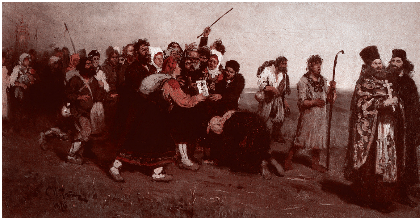
Илья Репин. Крестный ход (эскиз). 1877

изображение современного, пореформенного «Крестного хода в Курской губернии» (1881–1883). В картине, в которой (по мнению Трегуловой и Юденковой) он якобы и «не думал о пороках капиталистического строя и его пагубном влиянии на судьбы народа». Между тем суть замысла художника во многом и состояла в демонстрации социального расслоения деревни на бедноту и поддерживающих власти кулаков-«мироедов». Абсурдна и ситуация, когда молитвы к Богородице о ниспослании дождя звучат среди вырубленных «эксплуататорами края» лесов (признаки