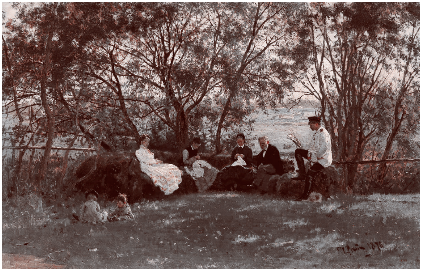
Илья Репин. На дериновой скамье. Красное село. 1876

К сожалению, во всей этой профанации активно участвуют и «профессиональные» критики и искусствоведы, тексты которых порой заставляют вспоминать слова писателя Н. Лескова из письма Репину (от 18.08.1889 г.) об омещанившейся интеллигенции: «<...> Так падать, как падает эта среда, — это признак полной гадостности. Это какие-то добровольцы оподления, с которыми уже невоз-