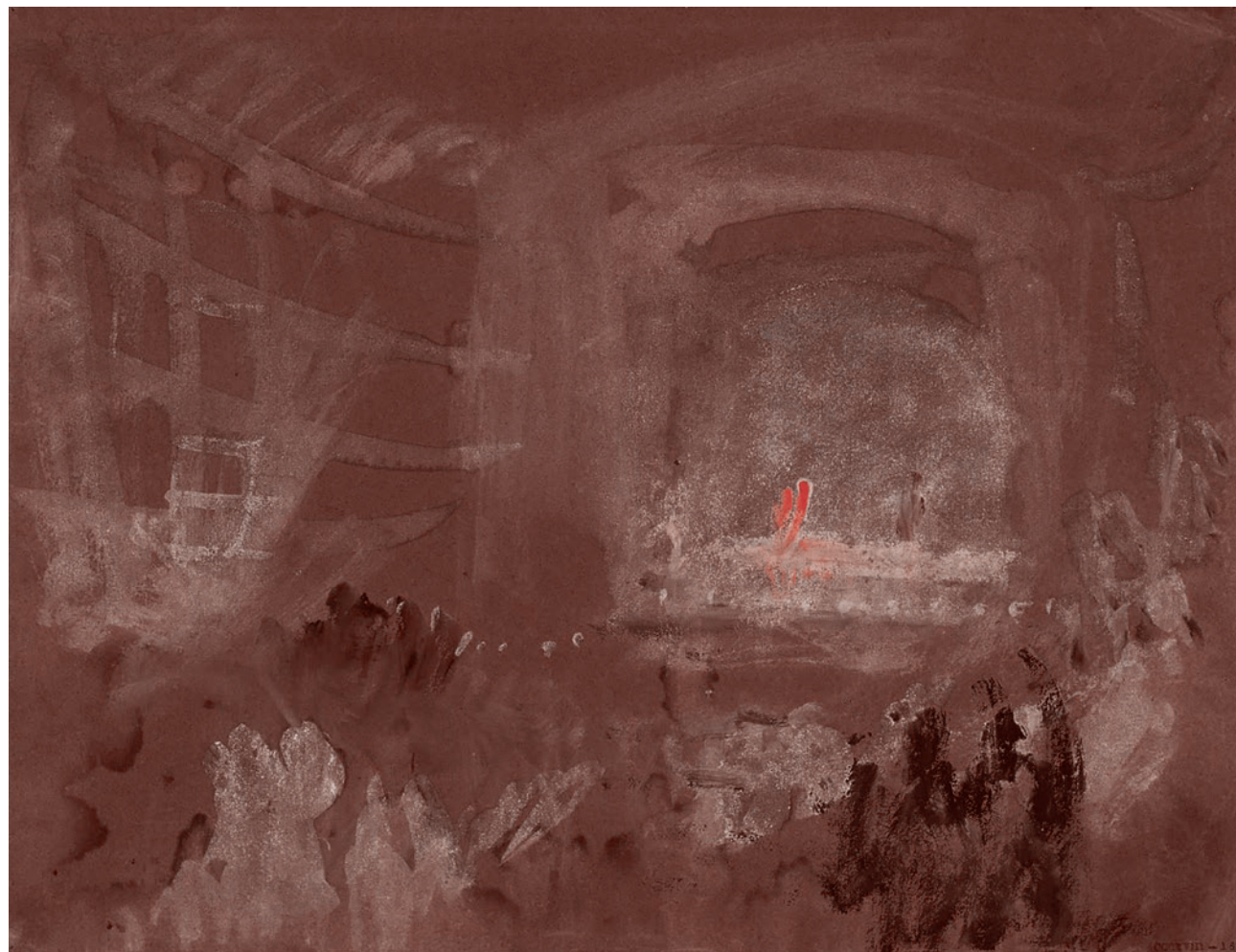
Уильям Тёрнер. Венеция, интерьер театра. Ок. 1840

Конечно, впечатлила концовка, в которой персонажи, являющие собой разные части личности героя, предстают как стая бесов, которую спаситель вогнал в свиней