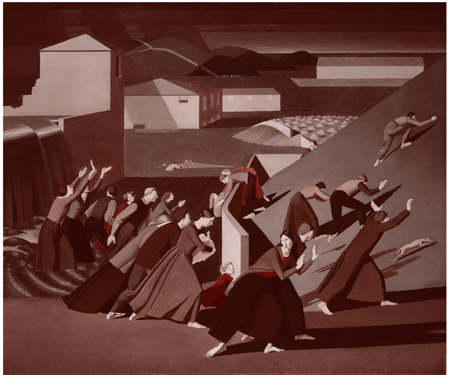
Ульфред Найтс. Потом. 1920

Все это сулило некий разумный вариант «золотого века», пусть и небезупречного, но способного шаг за шагом уменьшать свое несовершенство, а главное — лиш-