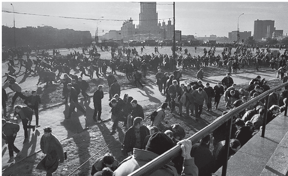
У Белого дома. Октябрь 1993 года

— Позор! Позор! Позор! — скандировала колонна, накатываясь на них. И с грохотом ударила в щиты. Милицейская цепь подалась, и мы полезли на грузовики. А милиционеров тем временем провожали