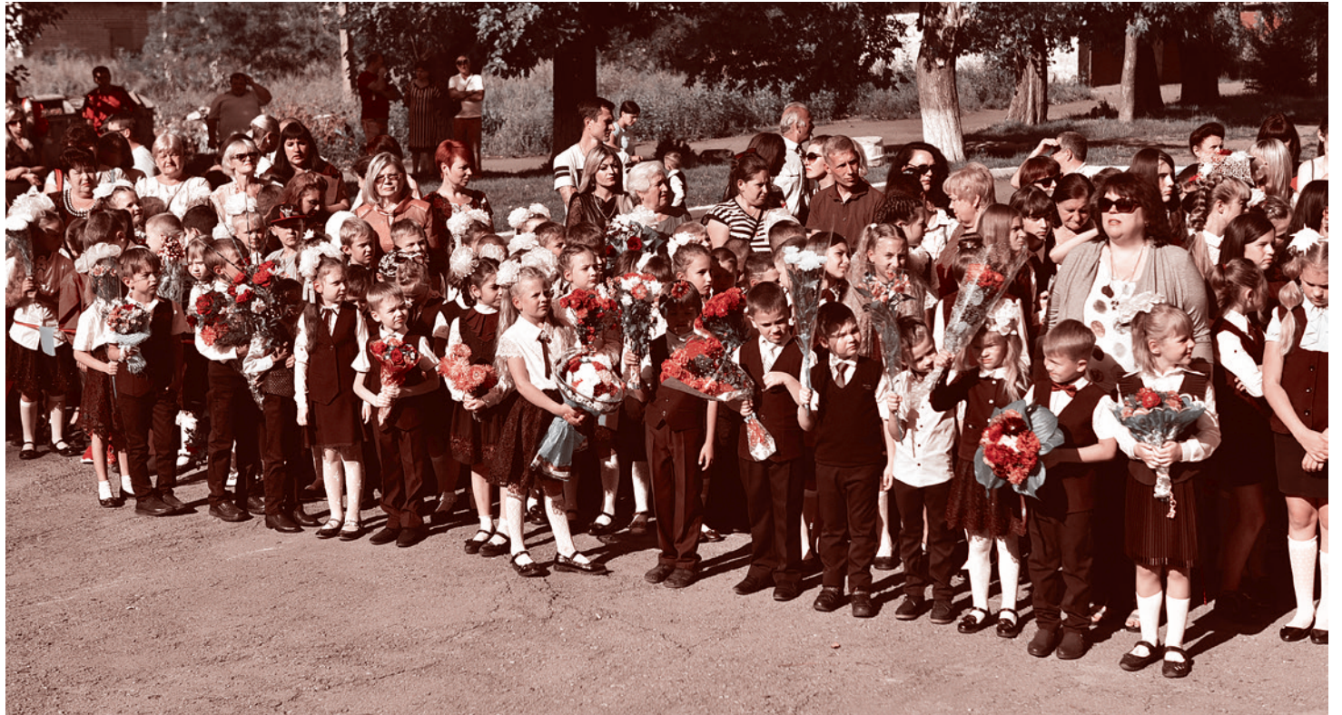
День Знаний в Красном Луче. 2019 г.

Нас очень тепло встретили на торжественной линейке, посвященной Дню знаний, в 11-й школе Красного Луча. Уже после всех мероприятий директор школы с