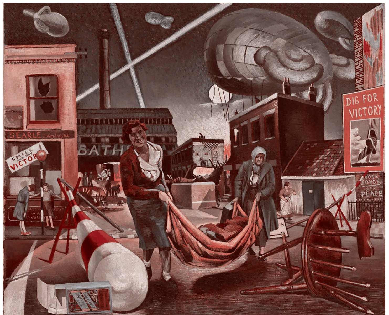
Клайв Брэнсон. Разбомбленные и прожесточенные. 1940