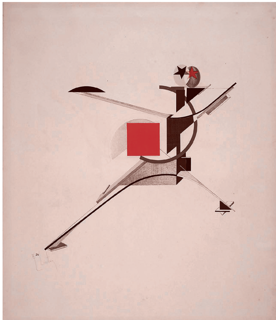
Эль Лисицкий. 10. Новый человек. 1923

Владимир Соловьев: Никакая идеология не существует без великого прошлого. То, что существует без великого прошлого, называется утопией. Советский Союз жил имперской идеей, был успешен. Современная Россия двадцать лет жила идеей западного капитализма. Сегодня Запад остановился, он больше никуда не идет. Идеи постмодернизма скорее тормозят развитие, а не ускоряют его.