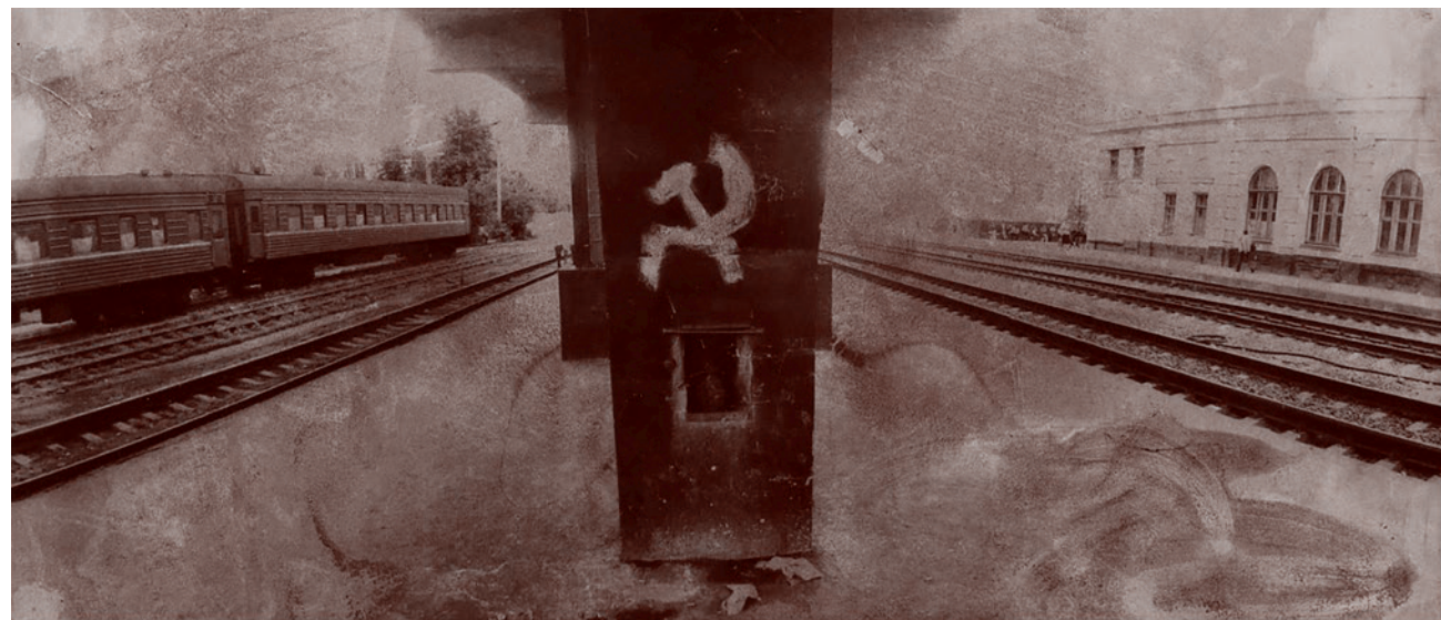
Борис Михайлов. На закате. 1993

Значит, нужно сказать честно, что в эти глобальные тенденции мы вписать-