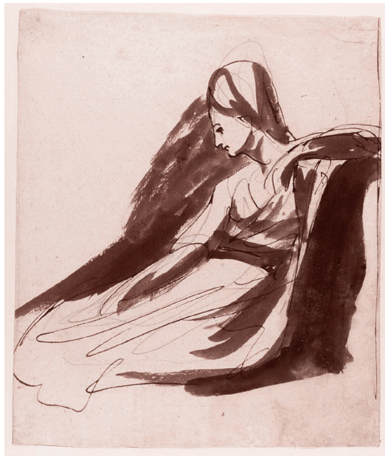
Джордж Ромни. Серена в лодке Апатчи. Конец XVIII в.

«Умное голосование» сработало на выборах в Мосгордуму. У оппозиции теперь 20 мест вместо 5 депутатов от КПрФ, которые были раньше. Во многих округах, где единокорсы-самовыдвиженцы все-таки по-