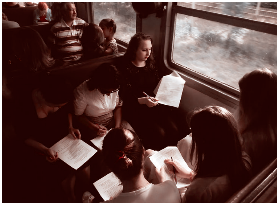
Пассажиры электрички участвуют в опросе АКЦИО

Нам вчера в электричке мужик отказался заполнять анкету со словами: «Это бесполезно, вон «Суть времени» миллион подписей собрала, и не помогло». Ну и дальше леваческие мантры про «челобитную», правда, без должной экзальтации.