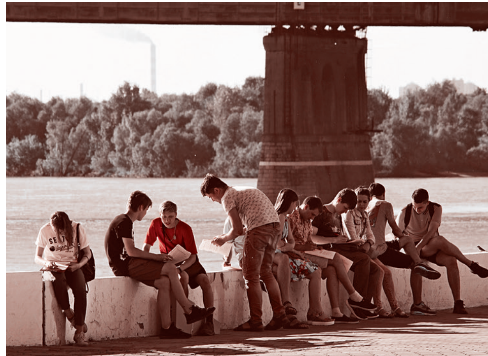
Активисты АКЦИО Омске

Наш товарищ уехал в деревню к родителям и там собирает анкеты.