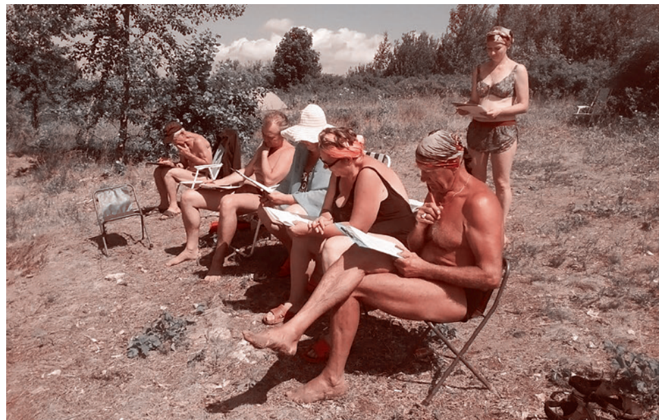
Отдыхающие на пляже с анкетами АКЦИО