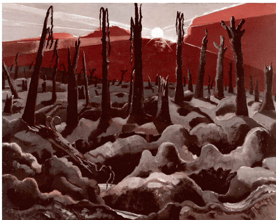
Пол Нэш. Мы создаём новый мир. 1918

Мережковский негодует по поводу того, что царство божье заменяется царством человеческим. И утверждает, что сама такая замена неизбежно породит фатальную человеческую деградацию, она же — превращение человечества в некую паюсную икру мещанской мелкотравчатости.