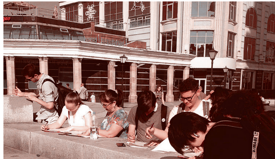
Граждане заполняют анкеты АКЦИО в Казани