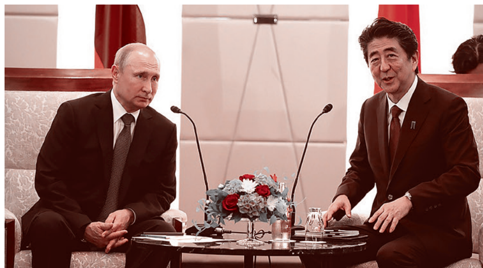
Владимир Путин с премьер-министром Японии Синдзо Абэ. 29 июня 2019 г.

«Надо быть более лояльными друг к другу, более открытыми и транспарентными, ничего здесь такого я не сказал необычного. Надо уважать всех, это правда. Но нельзя силовым методом навязывать свою точку зрения, а представители либеральной так называемой идеи, они в последнее время просто навязывают, в школах прямо диктуют необходимость определенного так называемого сексуального воспитания. Родители