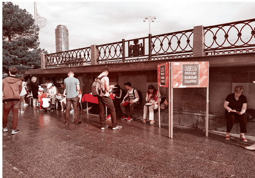
АКЦИО, «Здесь проходит важный социальный опрос». Екатеринбург