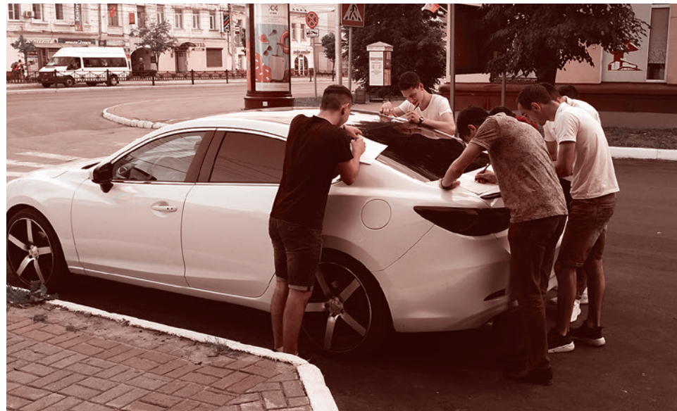
Молодые люди участвуют в соцопросе АКЦИО в Калуге

Где-то на 50 респондентов обязательно встречается один, кто похвалит. Вчера одна женщина, которая работает в регистратуре частной клиники, долго хвалила нас за то, что мы этот опрос проводим. Ей очень понравились вопросы анкеты. Попросила дать ей анкету для мужа. Мы, в свою очередь, пообещали занести результаты.