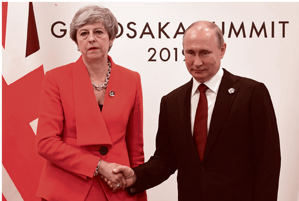
Владимир Путин с премьер-министром Великобритании Терезой Мэй. 28 июня 2019 г.

«Секретные непроверяемые доказательства», которые нельзя даже предъявить в суде, — это новая мода в мировой политике, которую впервые ввела Британия. Мэй не намерена отказываться ни от авторства, ни от несомненной полезности этой новой моды. Но понимает ли она, что такую дубинку способны удержать в руках только самые сильные?..