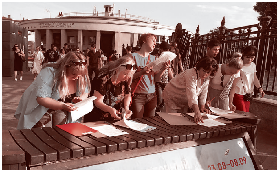
Опрос АКЦИО в Москве