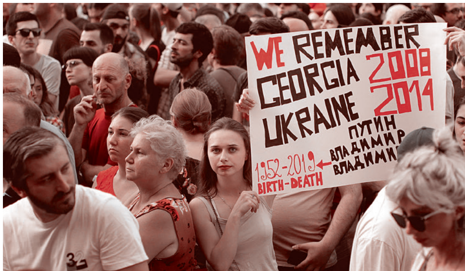
Протестующие перед зданием парламента Грузии. 22 июня 2019

Президент также поручил правительству обеспечить помощь в возвращении