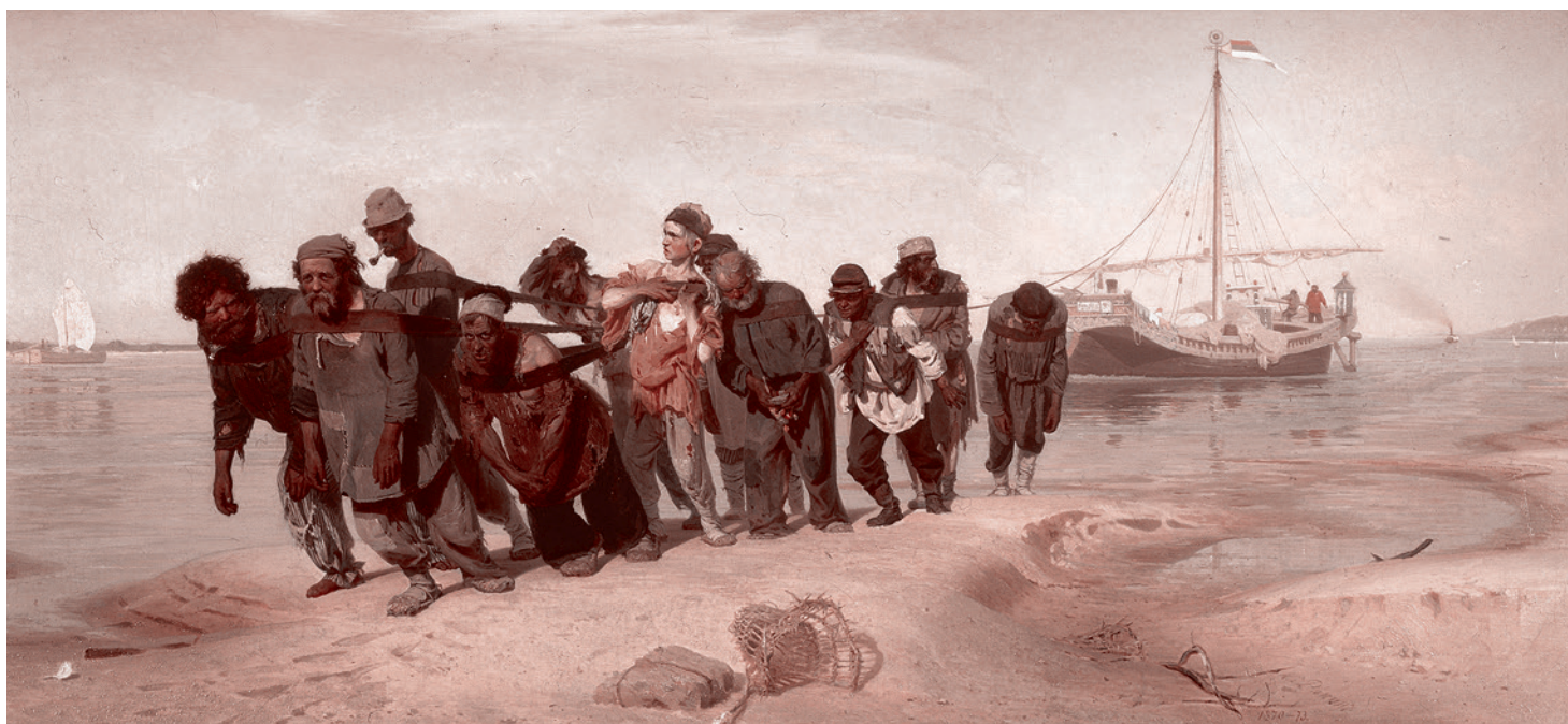
Илья Репин. Бурлаки на Волге. 1872–1873

Так, Ф. Достоевский в «Дневнике писателя» за 1873 год восхищался тем, что Репин избежал в картине излишнего подчеркивания «известной социальной мысли о неоплатном долге высших классов народу», а показал «настоящих живых бурлаков», но показал так, «что нельзя не полюбить их... Эта бурлацкая «партия» будет сниться потом во сне... через пять-шесть лет вспомнится».