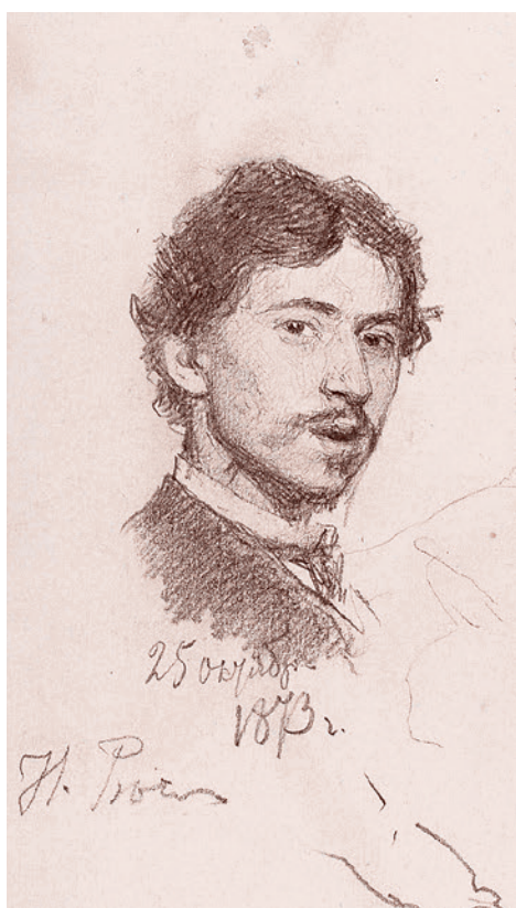
Илья Репин. Автопортрет. 1873

Его эстетика и его этика вытекают не из мозговизма его, не из односторонности его, а как раз из мощности, огромной страстности и многогранности его, из реализма, который нужно понимать именно как любовь к жизни, как наличие в самом Чернышевском колоссальных жизненных сил... Материалист такого типа, как Чернышевский, — это человек, который, можно сказать, бешено, всеми фибрами, всеми клетками организма влюблен в природу, в действительность, в жизнь... Но это вовсе не значит, чтобы он принимал ее беспрекословно. Наоборот: потому, что он любит жизнь, любит ее развитие, любит положительное, он видит, что жизнь в природе и в особенности в обществе поставлена в ненормальные условия. Во имя этой любви