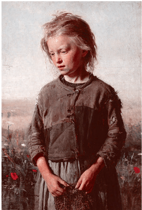
Илья Репин. Девочка-рыбачка. Вель. 1874

Но самым художественно продуктивным стало пребывание Репина летом 1874 года в Северной Нормандии — в облюбованном русскими художниками рыбацком городке Вель, расположенном на берегу Ла-Манша вдоль речки, усеянной маленькими водяными мельницами. Местные люди и природа (напомнившая Репину Малороссию) очень понравились живописцу, написавшему здесь ряд пейзажей, в которых отразился его далеко не случайный интерес к творчеству «живописцев солнца» — импрессионистов (ведь «Бурлаки на Волге» были признаны на Венской Всемирной выставке «самой солнечной картиной»).