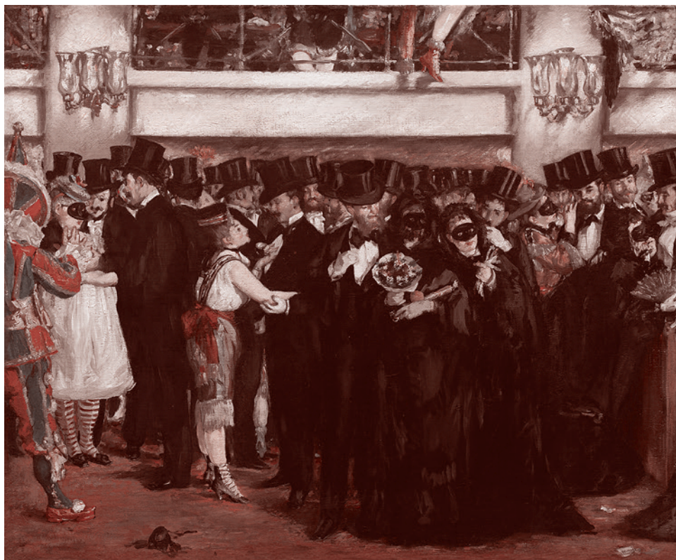
Эдуар Мане. Бал-маскарад в опере. 1873

Впрочем, при высокой оценке Репиным искусства импрессионистов, присущая им мера «отключения памяти», растворения в многоцветном мерцании света и воздуха показалась ему (как и работавшему тогда же во Франции Полену) не соответствующей насущным потребностям и задачам русской живописи.