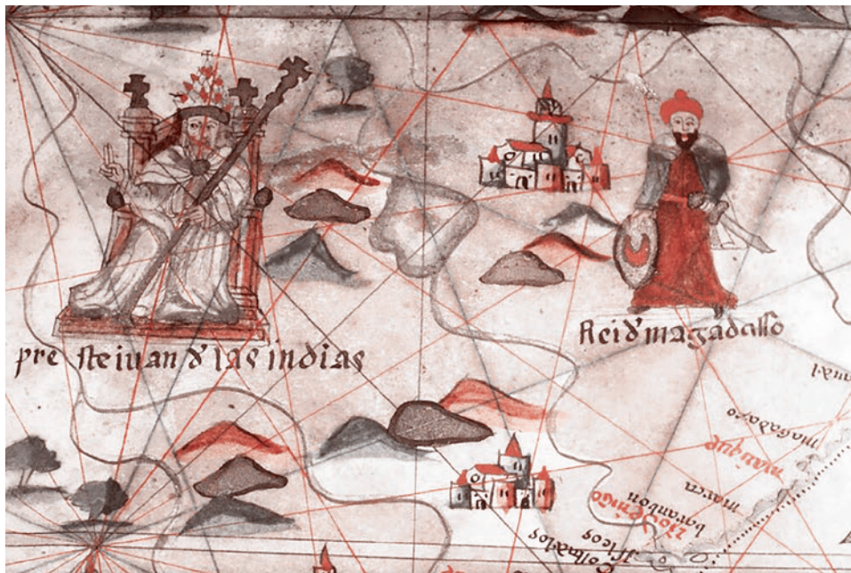
Пресвитер Иоанн на портулане конца XVI в.

Но женщина таким прогнозом не ограничивалась. Она угадывала, когда именно я буду возвращаться, и встречала меня с перекинутой через плечо берданкой. Потому что считала, что я хороший хлопец и должен вернуться к матери, которая ждет меня в Москве. У женщины было пятеро сыновей. А у сыновей были жены. У одного из сыновей жена была совсем неблагополучная. И опять же, не буду подробно описывать, что значит «неблагополучная» — неблагополучная и всё тут. И это была самая интересная из жен. Жена другого сына была, напротив, очень благополучная. То есть негулящая, непьющая и с большим