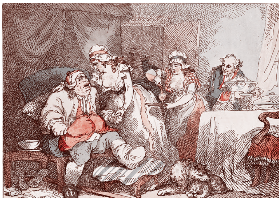
Томас Роулендсон. Комфорт во время подгары. 1 июля 1802 г.

На вопрос же, а решают ли жители Канады или Южной Кореи, которые были поставлены в пример свободных стран, судьбу своей страны и путь ее развития, он ответил, что они решают свою судьбу, очевидно понимая, что они ни на что по существу не влияют и живут в своем «отдельном счастье» потребителя, которое будет отнято так же, как и было даровано.