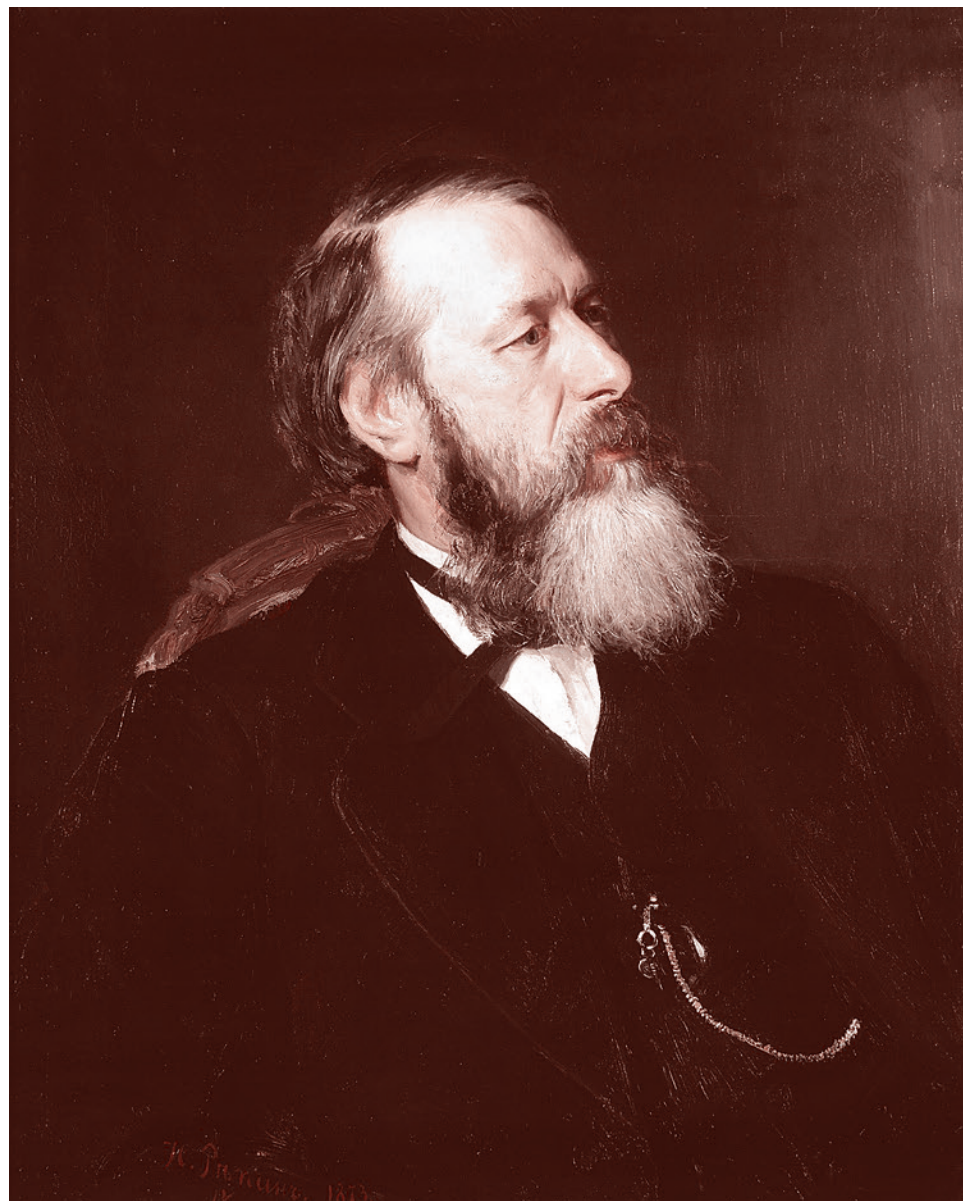
Илья Репин. Портрет Владимира Стасова. 1873

Специально для организаторов выставки в «Новой Третьяковке» напомним, что Стасов, хотя и не занимался непо-