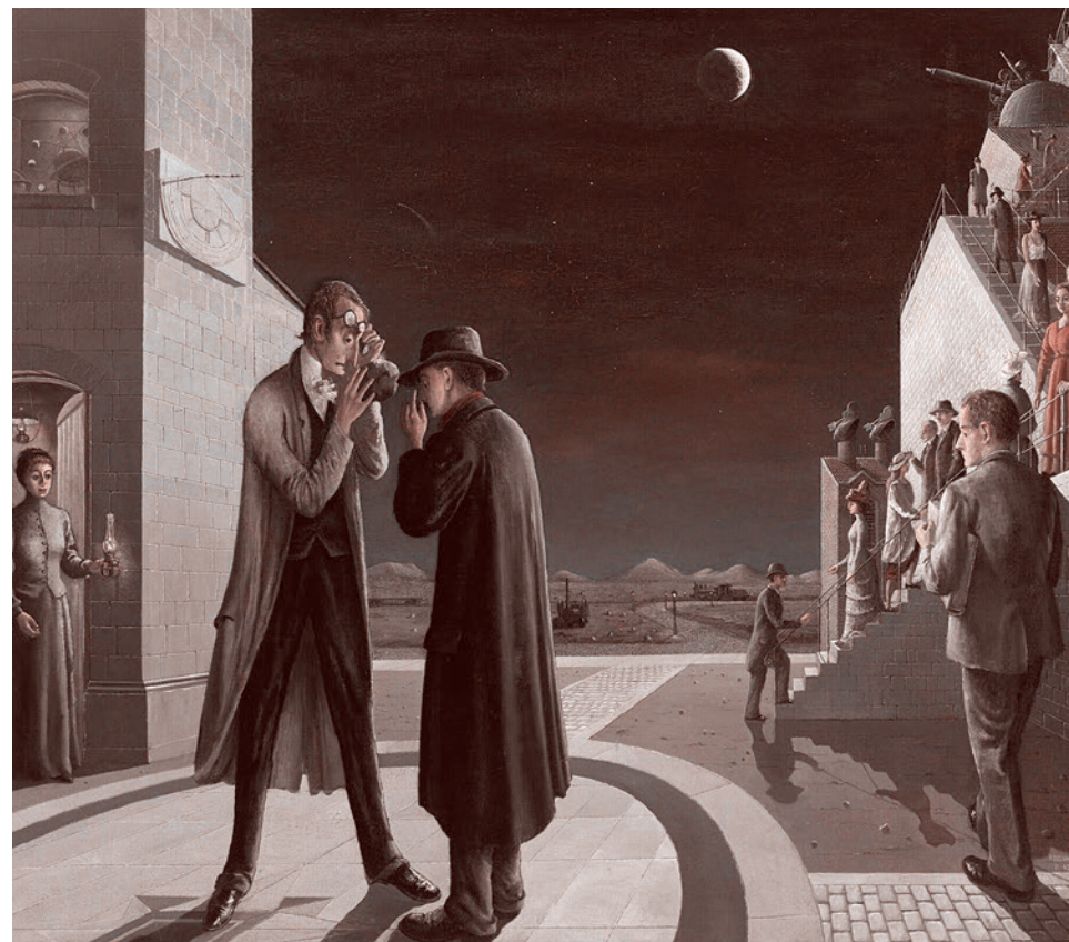
Поль Дельво. Фазы Луны III. 1973

Мне скажут, что противопоставление обывателя человеку слишком высокомерно.