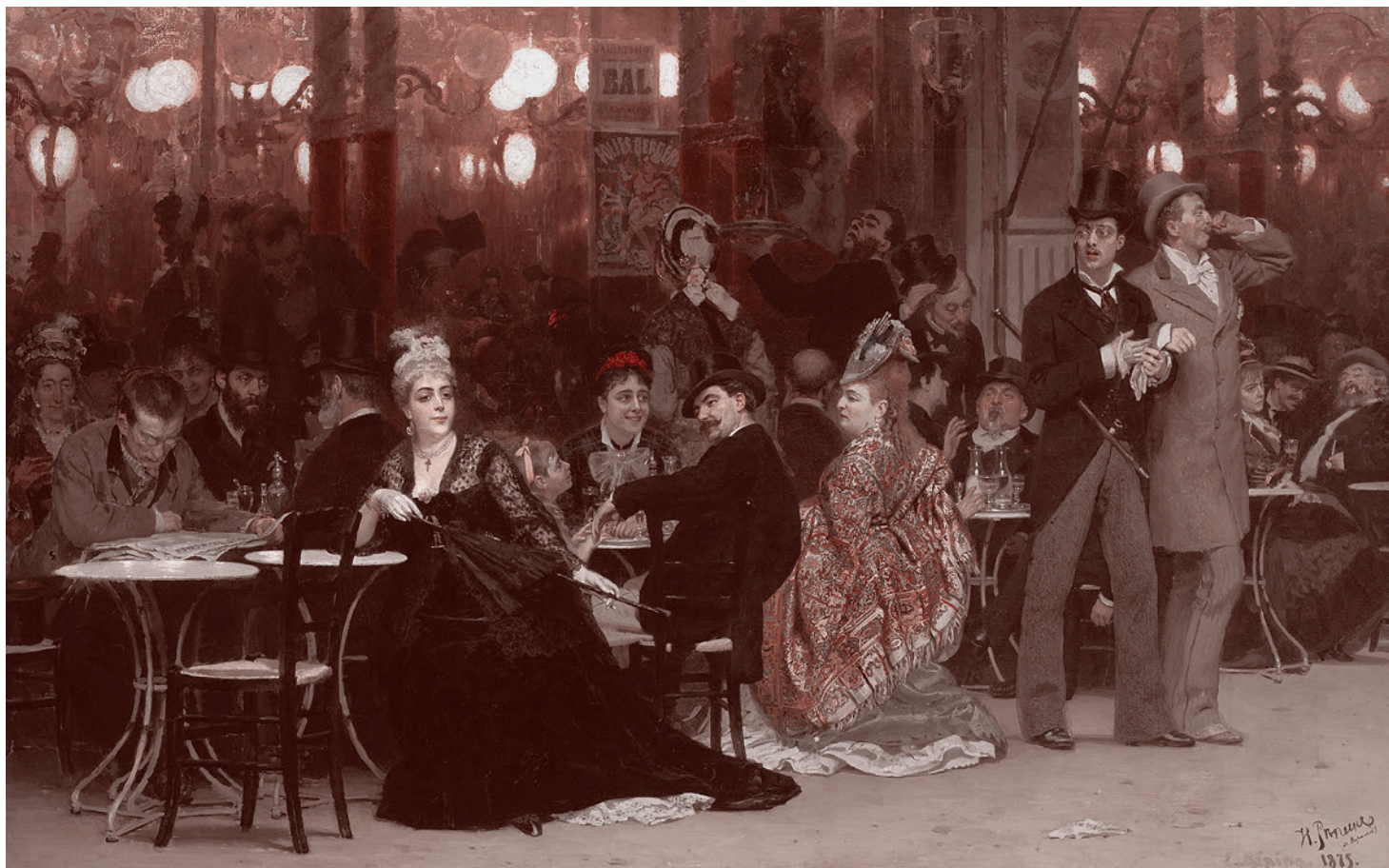
Илья Репин. Парижское кафе. 1885