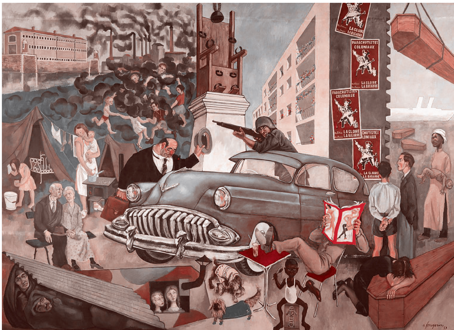
Андре Фужерон. Атлантическая цивилизация. 1953

потребления, которое только и нужно, чтобы купировать всю энергетику социально-экономической и социально-политической фрустрации), при том, что действительно некто ущемляет отдельные категории граждан по полной? А ну как окажется, что такое ущемление преступно и эти отдельные категории граждан нуждаются в защите?