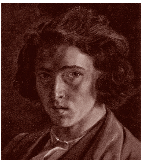
Илья Репин. Автопортрет. 1863

Особенно важны для понимания истоков личности Репина страницы, где он рассказывает о «самых интересных моментах жизни», «восторгах» (одна из частей воспоминаний так и называется — «Мои