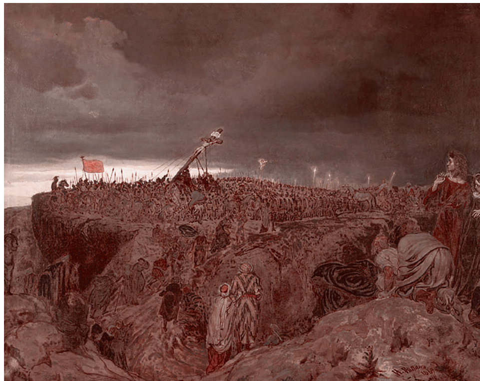
Илья Репин. Голгофа (Распятие Христа). 1869