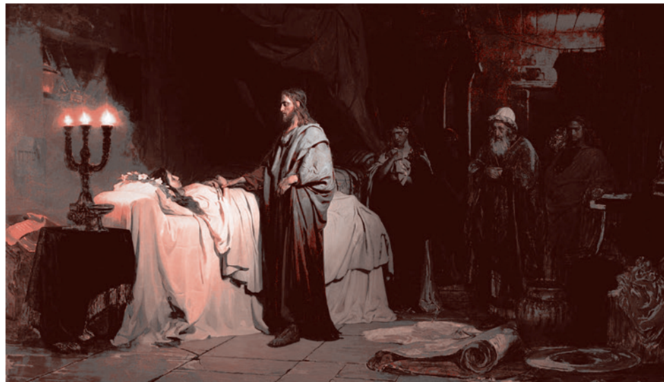
Илья Репин. Воскрешение дочери Иаира. 1871