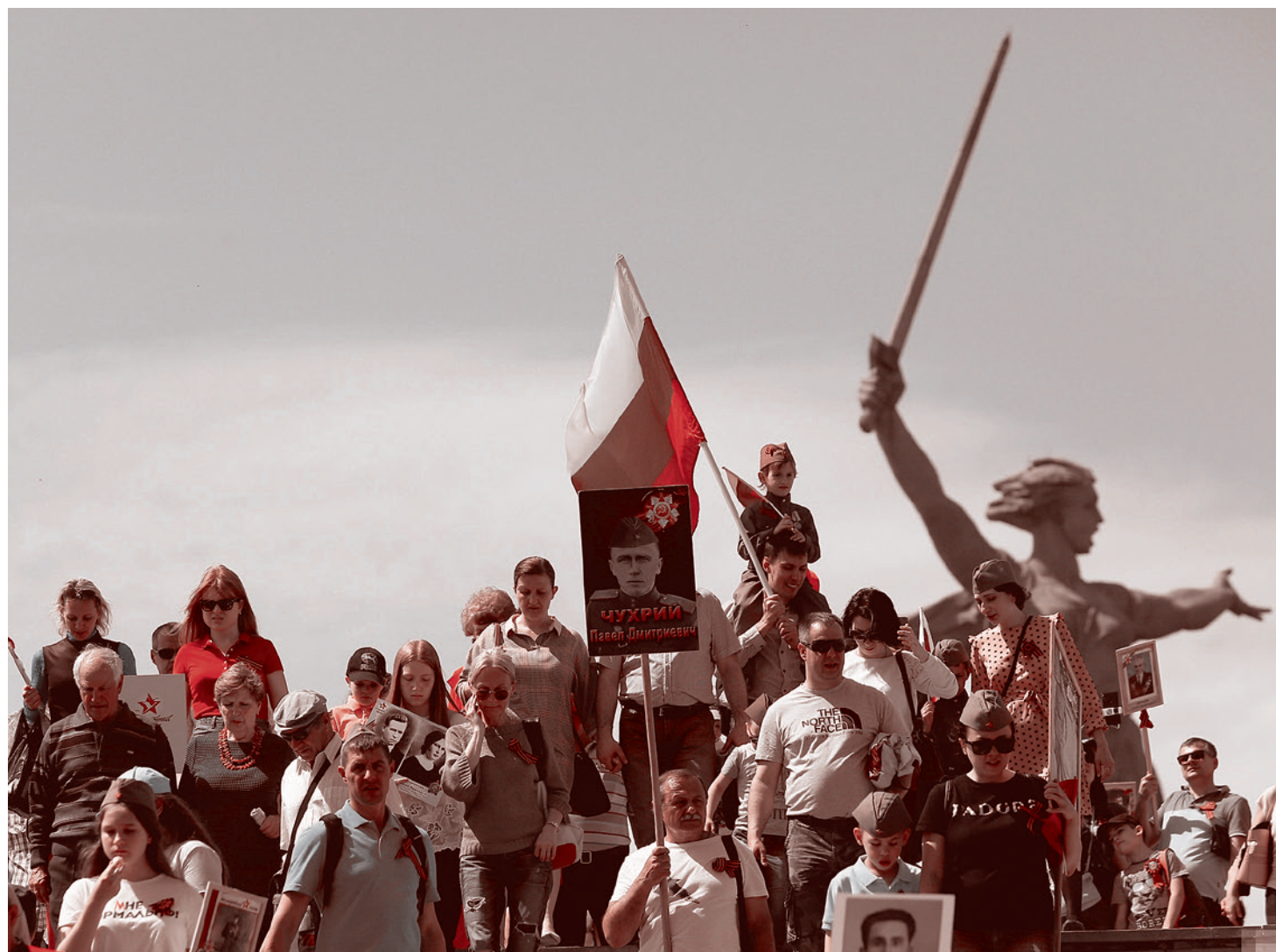
Мамаев курган в День Победы. 2019

У отвечающих даже не возникало сомнения в том, что героизм советского солдата был не только частью его коллективного бессознательного, но и результатом огромной просветительско-пропагандистской, воспитательной и, в конце концов, организационной работы партии и государства. Ведь героизм матросов крейсера