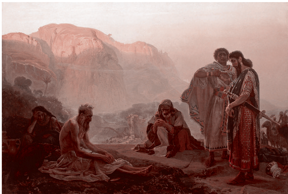
Илья Репин. Иов и его друзья. 1869

в «робком... непредприимчивом» юноше, каким он тогда был, «тайная титаническая гордость», острота и глубина сочувствия к человеческим страданиям, ощущения вечного борения света и тьмы, жизни и смерти. Эти качества присутствовали уже в таких «учебных» эскизах 1865 года, как «Сон Иакова», «Пророк Иеремия на развалинах Иерусалима» и «Ангел смерти истребляет первенцев египетских».