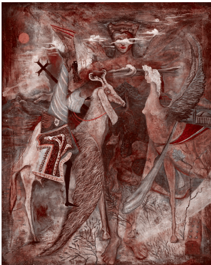
Леонора Каррингтон. Путешествие пресвитер Иоанна. 1953

кто, увидев это, быстро — так, чтобы земля над ним не сомкнулась, — прыгнет в ту реку, схватит что попало и сразу же вынесет, то камень оказывается драгоценным камнем, а песок — крупным жемчугом. Эта река течет в большую реку; люди той земли ходят на устье реки и собирают драгоценные камни и отборный жемчуг. А детей своих они кормят сырыми рыбами. В ту реку ныряют некоторые на три месяца, некоторые на четыре, — ищут камни драгоценные. В одном дне пути за той рекой есть высокие и мощные горы, на которые человеку нельзя смотреть. В этих горах по многим местам пылает огонь, и в том огне живут черви, а без огня они не могут жить, как рыбы без воды. И те черви точат из себя нити, как шелк, а из тех нитей наши жены делают нам одежду. И когда та одежда загрязнится, воду ее не моют: бросают в огонь; и как только раскалится, вновь становится чистой. Есть у меня в иной стране звезда именем Лувияяр.