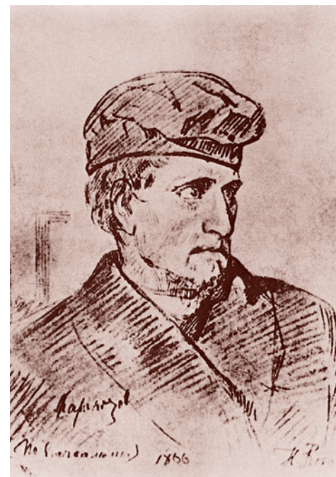
Илья Репин. Портрет Каракозова перед казнью. 1866

Этому эпизоду Репин даже посвятил отдельную главу своих воспоминаний, где очень выразительно описал последние минуты казненного: « вот он... истово, по-русски, не торопясь, поклонился на все четыре стороны всему народу. Этот поклон сразу перевернул все это многоголовое поле, оно стало родным и близким этому чуждому, странному существу, на которого сбежалась смотреть толпа, как на чудо. Может быть, только в эту минуту и сам «преступник» живо почувствовал значение момента — прощание навсегда с миром и вселенскую связь с ним ». Известен и натурный рисунок Репина, запечатлевший Каракозова.