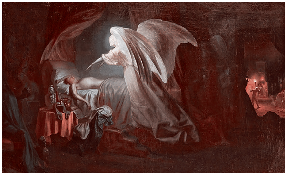
Илья Репин. Ангел смерти истребляет первенцев египетских. 1865