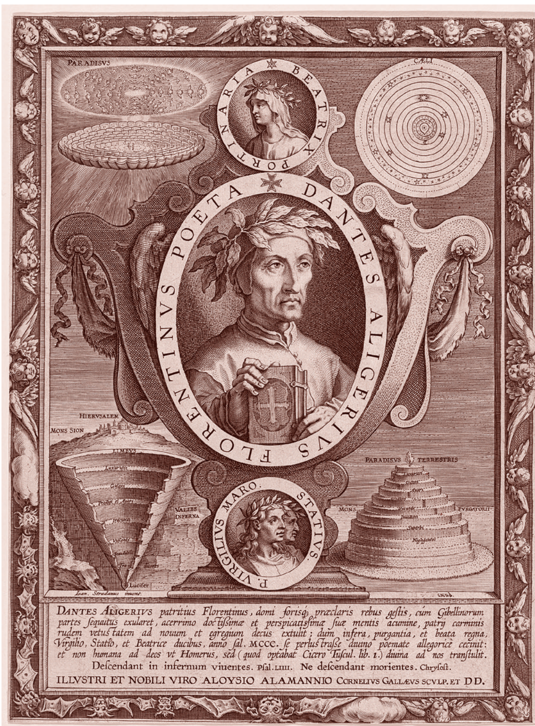
После Яна ван дер Страта (Страданус). Портрет Данте Алигьери. Ок. 1595

Пусть фьезольские твари, как солому, Пожрут себя, не трогая фюсток, Коль в их навозе место есть такому, Который семя чистое сберег Тех римлян, что когда-то основались В гнездилище неправды и тревог.