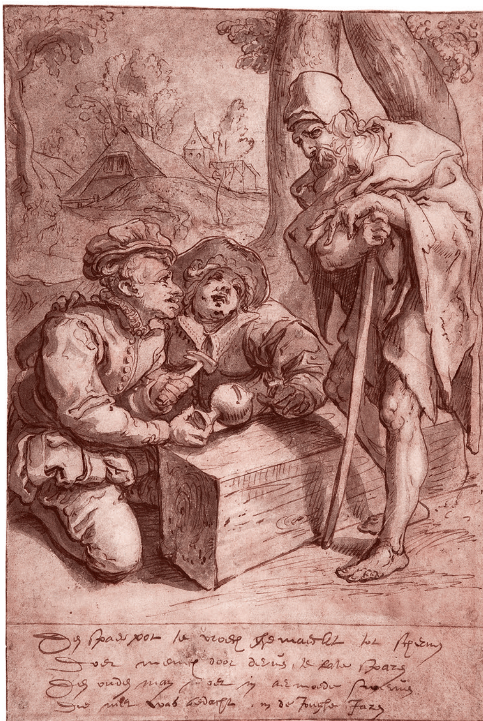
Карел ван Мандер I. Богатство и бедность. Середина XVI — начало XVII вв.

Нельзя сказать, что пенсионное обеспечение не существовало. Оно существовало для отдельных категорий граждан, которые уже к периоду средних лет не могли как следует заниматься своим ремеслом. В Англии, например, уже на рубеже XVI–XVII столетия (в 1597–1601 гг.) для военных было введено пенсионное обеспечение. Во Франции в 1673 году ввели пенсию для морских офицеров. В Англии в 1759 году «Актом о помощи и поддержке морякам» было установлено ежемесячное содержание в размере 6 пенсов в месяц для служивших во флоте Его Величества и для их вдов — очень скромное, но хотя бы гарантированное. В 1762 году такое обеспечение было введено в Испании указом