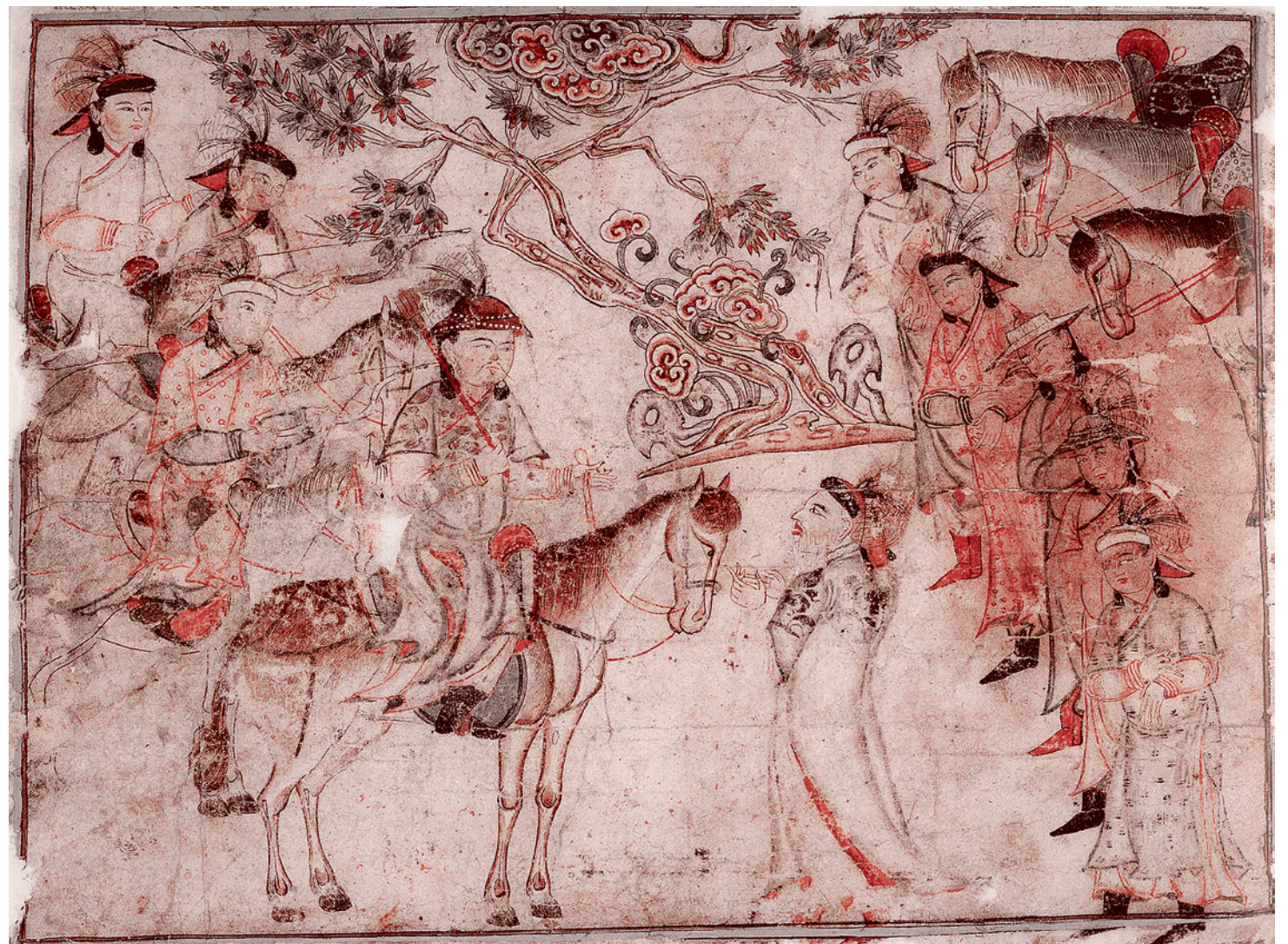
Переговоры. Иллюстрация из «Сборника летописей» Рашид-ад-Дина. Начало XIV в.

Итак, Байджу сначала разгромил сельджуков, а потом они худо-бедно обезопасились от Байджу, заручившись поддержкой сначала Бату, а потом и Берке. Что же касается Байджу, то он благосклонно воспринял обращение к нему царя Киликийской Армении Хетума I, который обязался оказывать монгольскому войску Байджу всяческую помощь. В ответ Байджу обя-