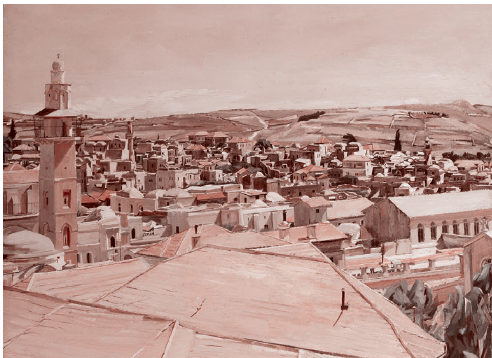
Дэвид Бомберг. Иерусалим, Гора Скопус. 1925

Объявив Фридриха II низложенным, участники Собора сквозь зубы все-таки сказали о необходимости организации нового крестового похода, а также о необходимости преодоления противоречия между православными и католиками.