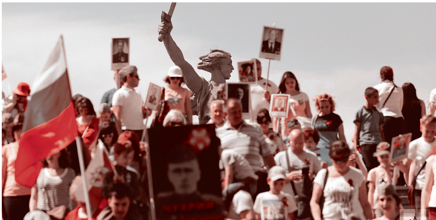
Мамаев курган в День Победы. 2019

С нашим обществом начинают играть в слова: «В случае чего, мы снова одержим победу!» — говорят одни. «Никогда больше!» — отвечают другие. Предупреждение «Можем повторить», которое фактически означает «Не сдадимся, лучше не лезьте, получите отпор», просто стало красной тряпкой для быка. Его требуют заменить на якобы пацифистское «Никогда больше». «Никогда больше. Во имя Великой Победы сотрите надпись «Можем повторить!». Самой мысли о возможности любой новой войны нет места ни в праздники, ни в будни», — призывает «Новая газета». Свое предложение устраивать День тишины вместо Дня Победы Максим Виторган публикует в инстаграмме на фоне картинки с красным маком и словами «Никогда