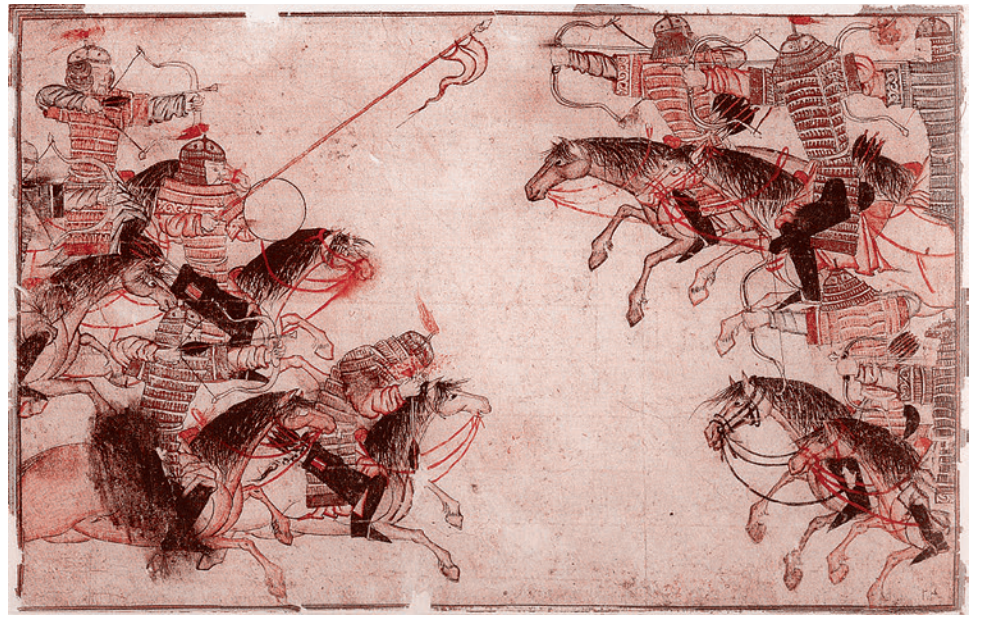
Бой между конными лучниками. Иллюстрация из «Сборника летописей» Рашид-ад-Дина. Начало XIV

Великий хан Угэдэй скончался в конце 1241 года. Он завещал избрать преемником своего любимого внука Ширамуна. Но Дорегене, вдова хана Угэдэя, начала борьбу за избрание Гуюка. Того самого Гуюка, которому адресованы горькие слова Угэдэя. Воз-