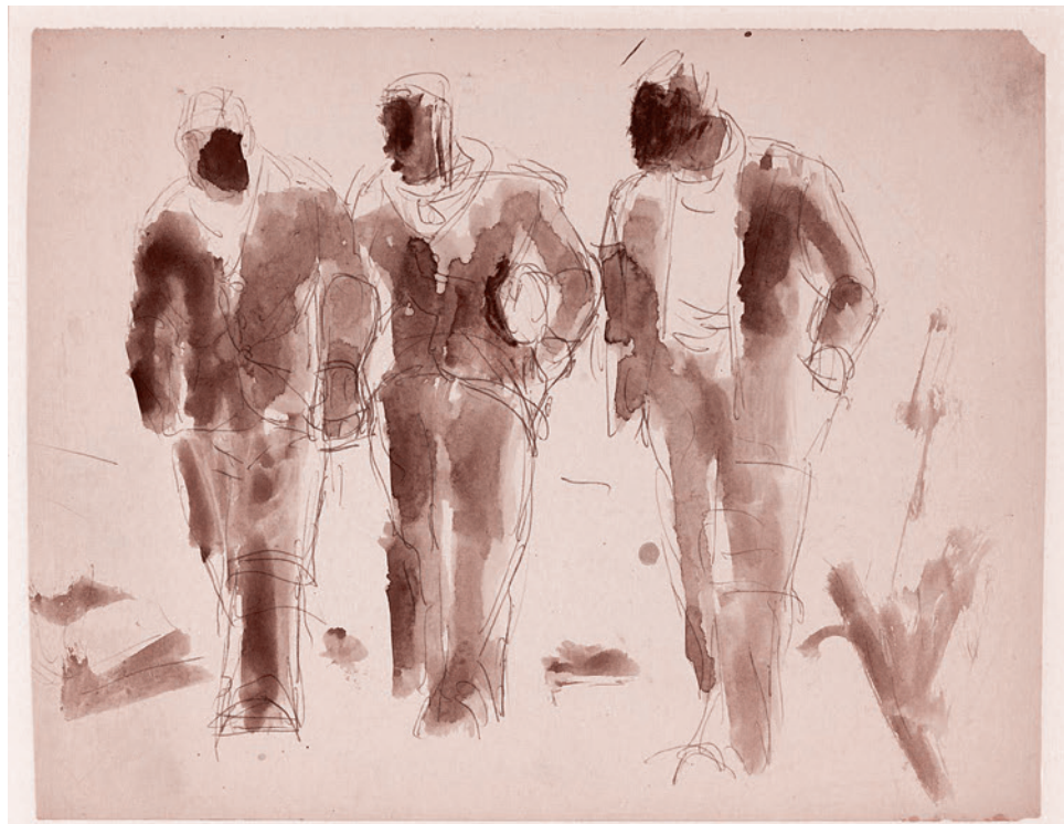
Йозеф Герман. Три шахтера по дороге домой. Эскиз. 1954–1955

Да и в целом экстремальные условия для выживания логически предполагают приложение усилий для базового обеспечения жизнедеятельности — пища, кров, может быть, какой-нибудь даже досуг. Здесь человек еще может проявить изобретательность (но не силу же, в самом деле?) и как-то к ситуации адаптироваться. Не будем отрицать, что кто-то вполне себе смирился и жил более-менее приемлемо и в условиях оккупации? А кто-то — выживал и за счет других, уходя в подполье. Ведь не их же дела вызывают восхищение и даже зависть у ныне живущих, а именно дела тех, кто даже в безысходной ситуации сражался до последнего вздоха.