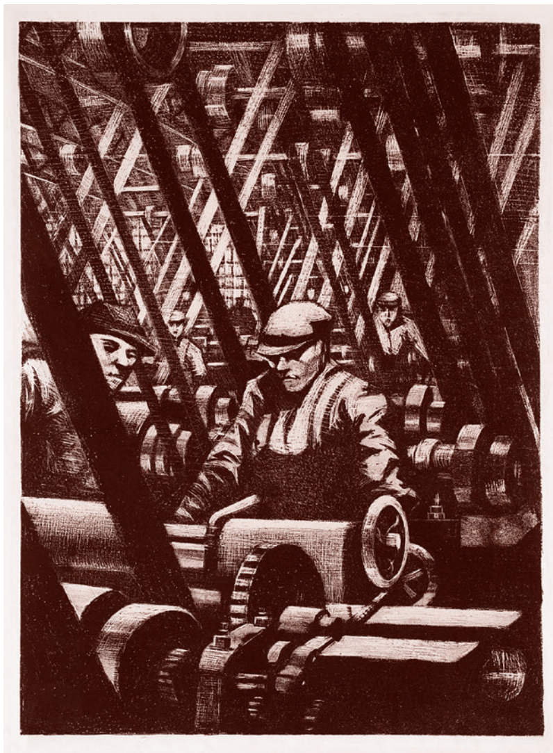
Кристофер Невинсон. Создание двигателя. 1917

Газета «Суть времени» зарегистрирована Федеральной службой по надзору в сфере связи, информационных технологий и массовых коммуникаций (Роскомнадзор) Свидетельство ПИ № ФС77-50554 от 9 июля 2012 года