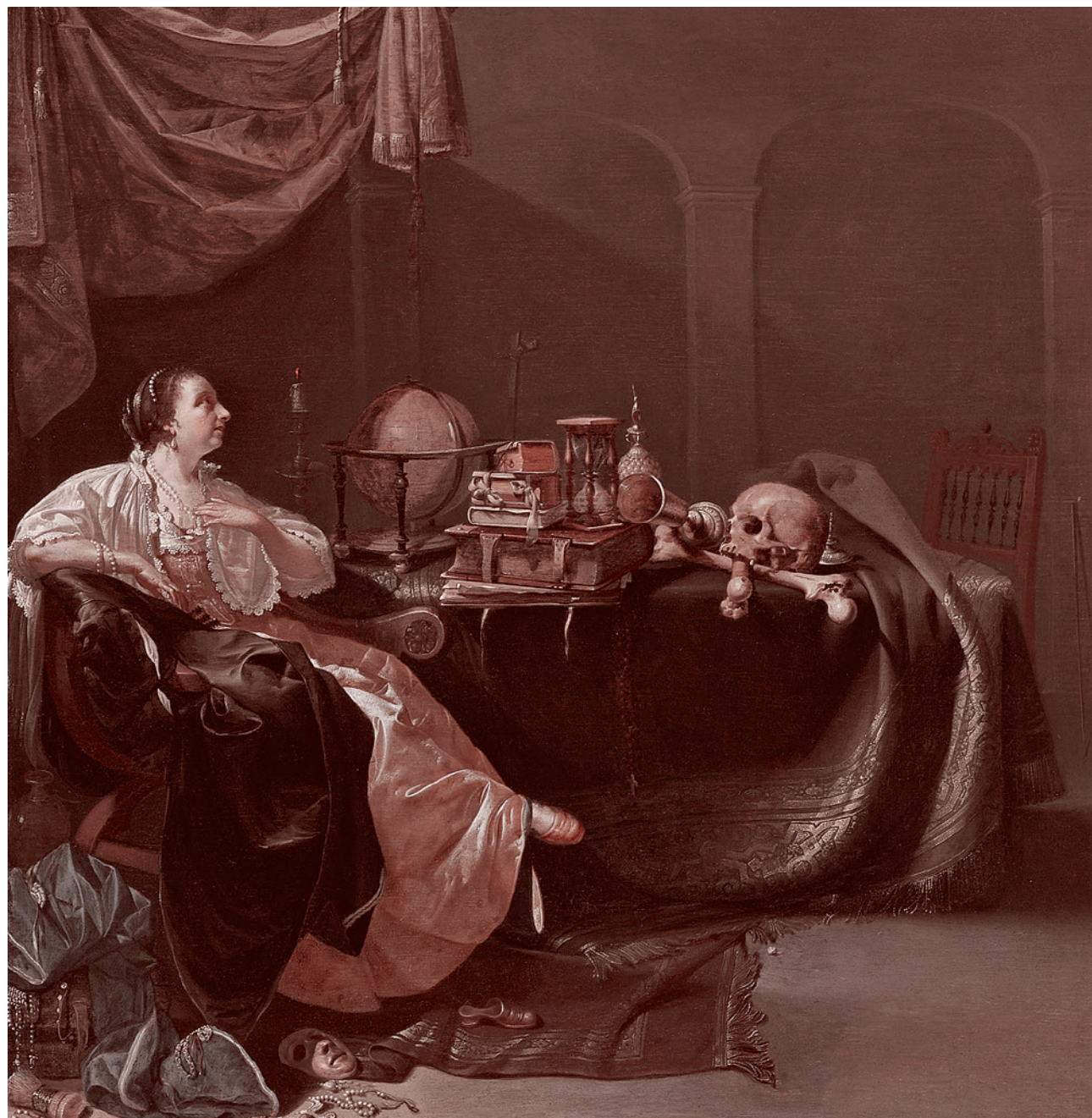
Якоб Дук. Аллегория веры. XVII в.

Платон также размышляет над тем, как необходимо воспитывать молодых людей, чтобы они обрели особое зрение, позволяющее увидеть мир идей. И попыт-