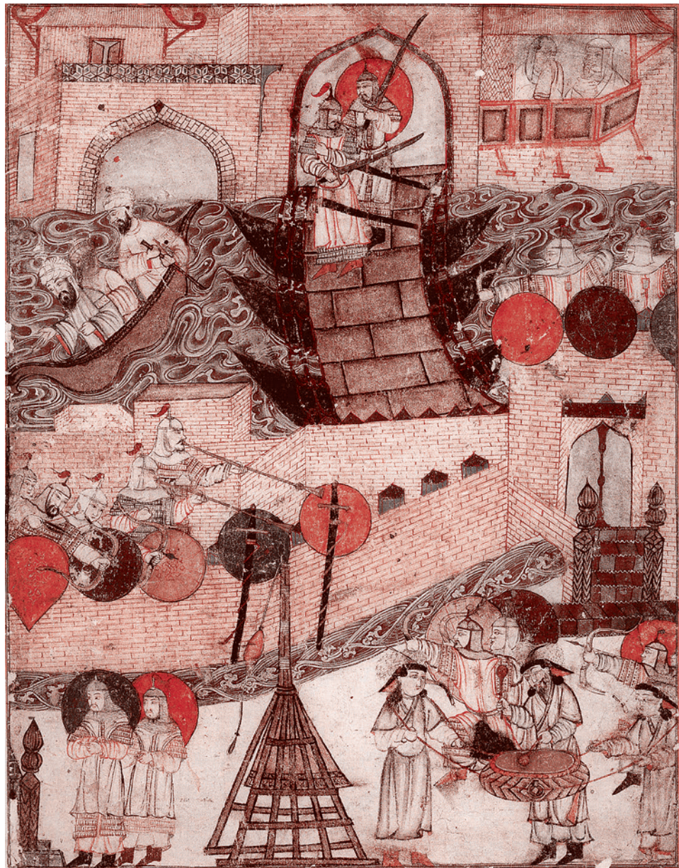
Осада Багдада монголами в 1258 г. Иллюстрация из «Сборника летописей» Рашид-ад-Дина. Начало XIV в.

Скорее всего, Мункэ использовал эти жалобы именно в качестве предлога. Потому что его брат Хулагу, завоевывая Ближний Восток, с очень большой жестокостью искоренял не только исмаилитов, но и ислам в любой его модификации. Но ведь были и какие-то основания для того, чтобы так жаловаться именно на исмаилитов. И эти основания монголы должны были принять для того, чтобы свирепо сокрушать все исмаилитские замки, включая знаменитый Аламут. И что же это были за основания?