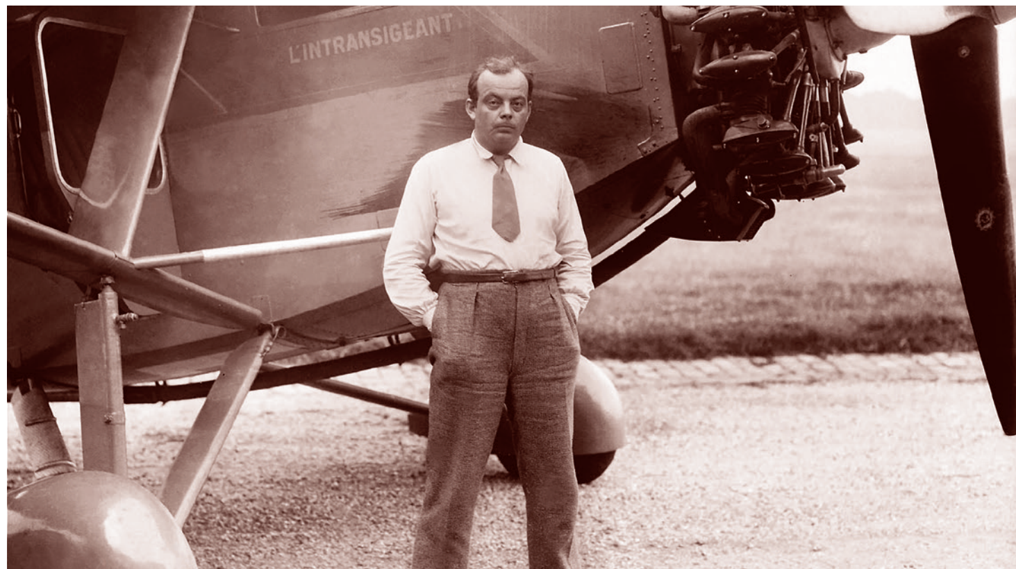
Антуан де Сент-Экзюпери

Позорность коммунистической капитуляции может быть явлена тем, кто хочет ее пережить, не только в самом факте этой капитуляции: ни один танк не сдвинулся с места, ни один самолет не взлетел, а разгром оказался полным. Эта позорность может быть явлена и на уровне сопоставлений с врагами коммунизма. И с белогвардейцами, которые как-никак дергались, пусть и очень специфическим образом. И с