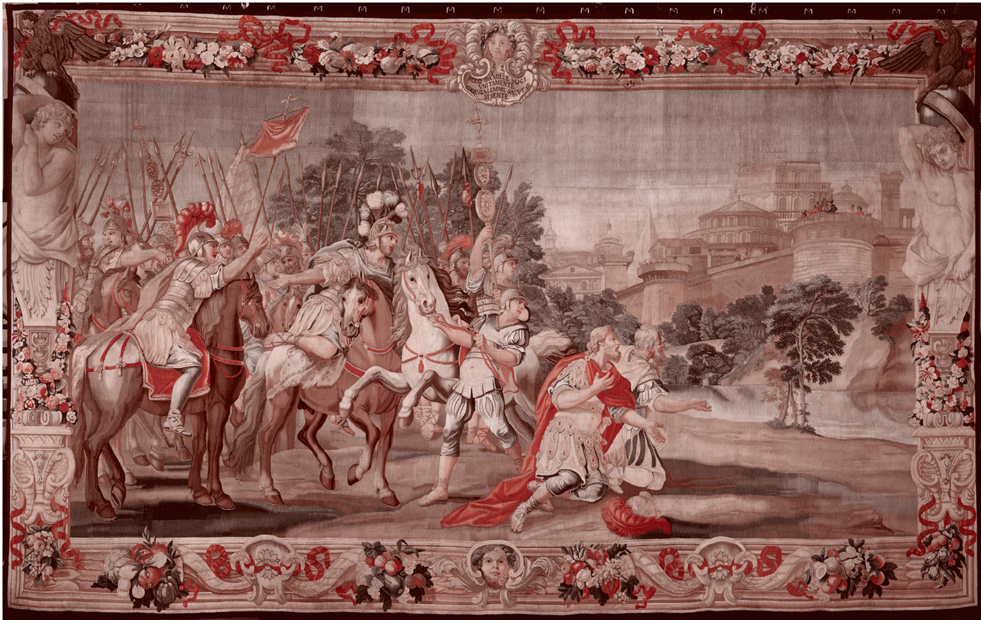
По эскизу Доменико Парадизи. Крестоносцы дошли до Иерусалима. Рисунок около 1689–1793, вышивка 1732–1739

И ерусалимское королевство крестоносцев возникло в 1099 году после завершения Первого крестового похода.