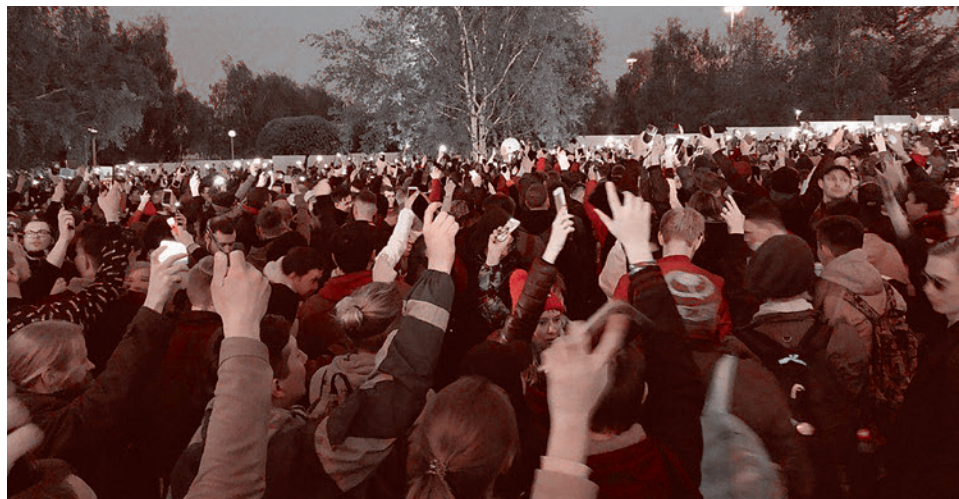
Протест против строительства храма в Екатеринбурге

Одновременно рядом с заграждением собирают подписи за сохранение сквера