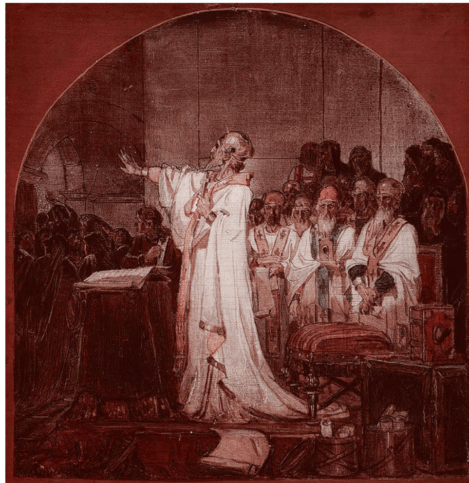
Василий Суриков. Третий Вселенский собор. Эскиз росписи для Храма Христа Спасителя. 1876

Именно по этой причине исламский мир Ближнего Востока не сумел поначалу отомобилизоваться против крестоносцев, порою даже путая их с византийцами.