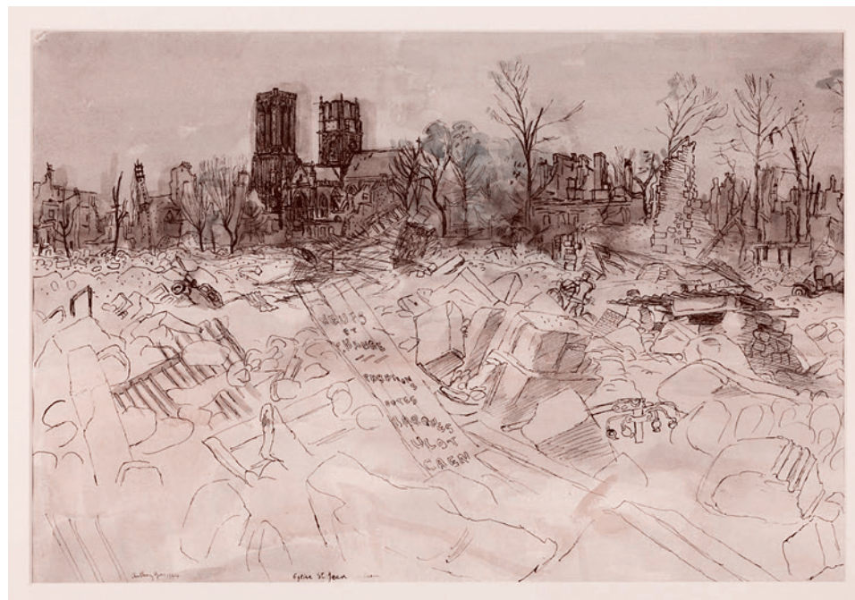
Антони Гросс. Освобождение Франции: Церковь в развалинах Кана, Нормандия. 1944

Казалось бы, очень абстрактный вопрос. Но Экзюпери он интересует в связи