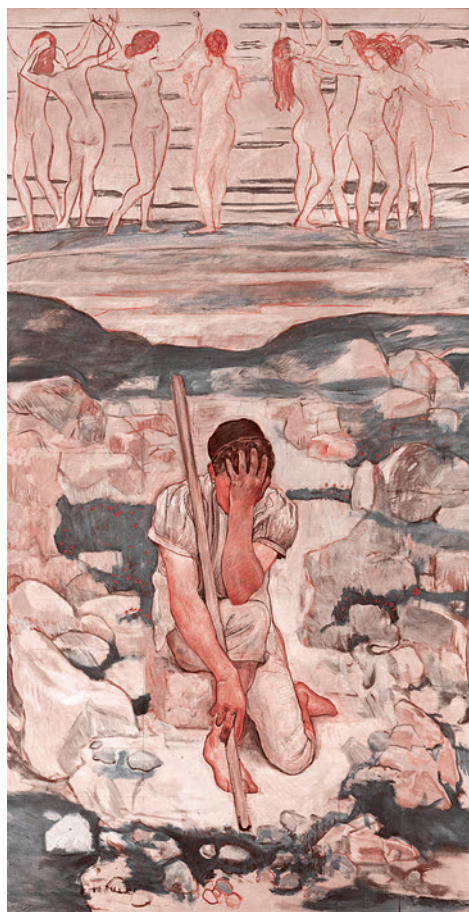
Фердинанд Ходлер. Сон пастуха. 1896

Также он экспериментально и теоретически разработал учение об аллометрии — закономерностях морфогенеза отдельных частей и роли генов в этом процессе. Тем самым в одном концептуальном ключе предстали морфоло-