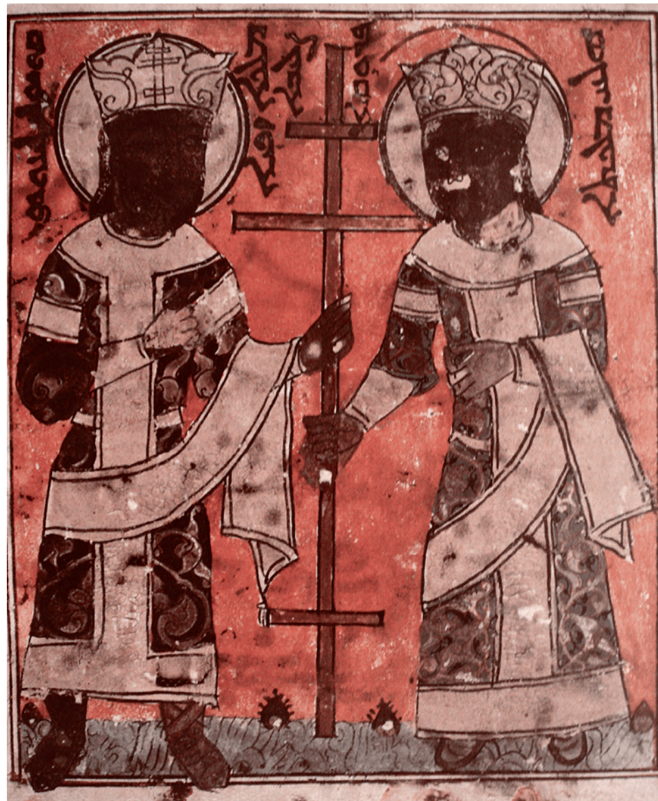
Хулагу и Докуз-хатун в Сирийской Библии. XIII в.