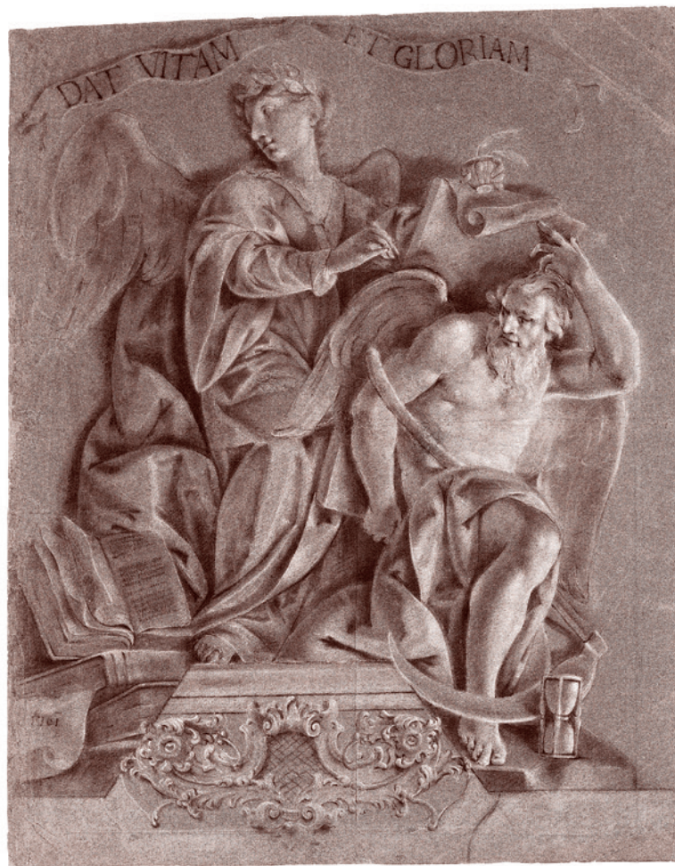
Витторино Мария Бигazzi. Аллегория истории со временем. 1761