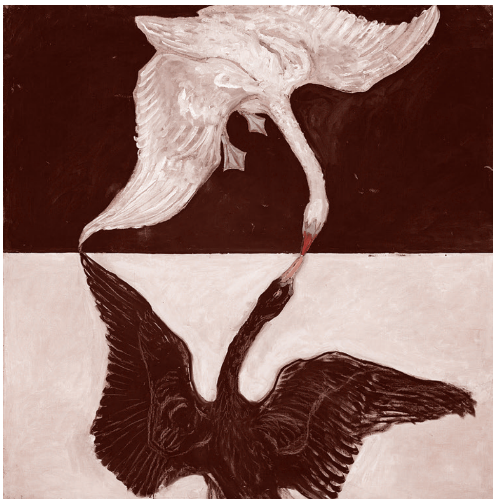
Хильма аф Клинт. Группа IX/SUW, Лебедь, № 1. 1915

Айслер вводит в оборот термин «культура господства» (Dominator culture) — описывая систему жесткой иерархии, свойственной патриархальным сообществам, основанную на силе и устрашении, и противопоставляет ее некоей «культуре партнерства», существовавшей якобы в доисторические времена. Ее носителем была, по Айслер, высокоразвитая цивилизация в южной Европе, но эта линия оказалась варварски прерванной нашествиями индоевропейцев, которые принесли с собой только войны, разрушение и насилие. Тем