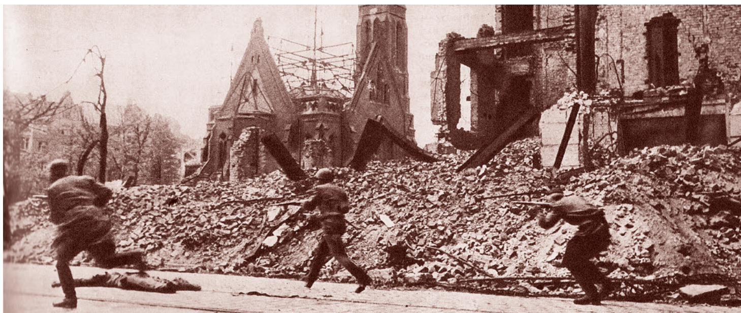
Владимир Гребнев. Красноармейцы бегут мимо разрушенной церкви на улице Берлина. Апрель 1945

На самом деле в этой остановке, конечно же, была жесткая военная логика, которую надо бы постичь всем, пишущим и рассуждающим о войне.