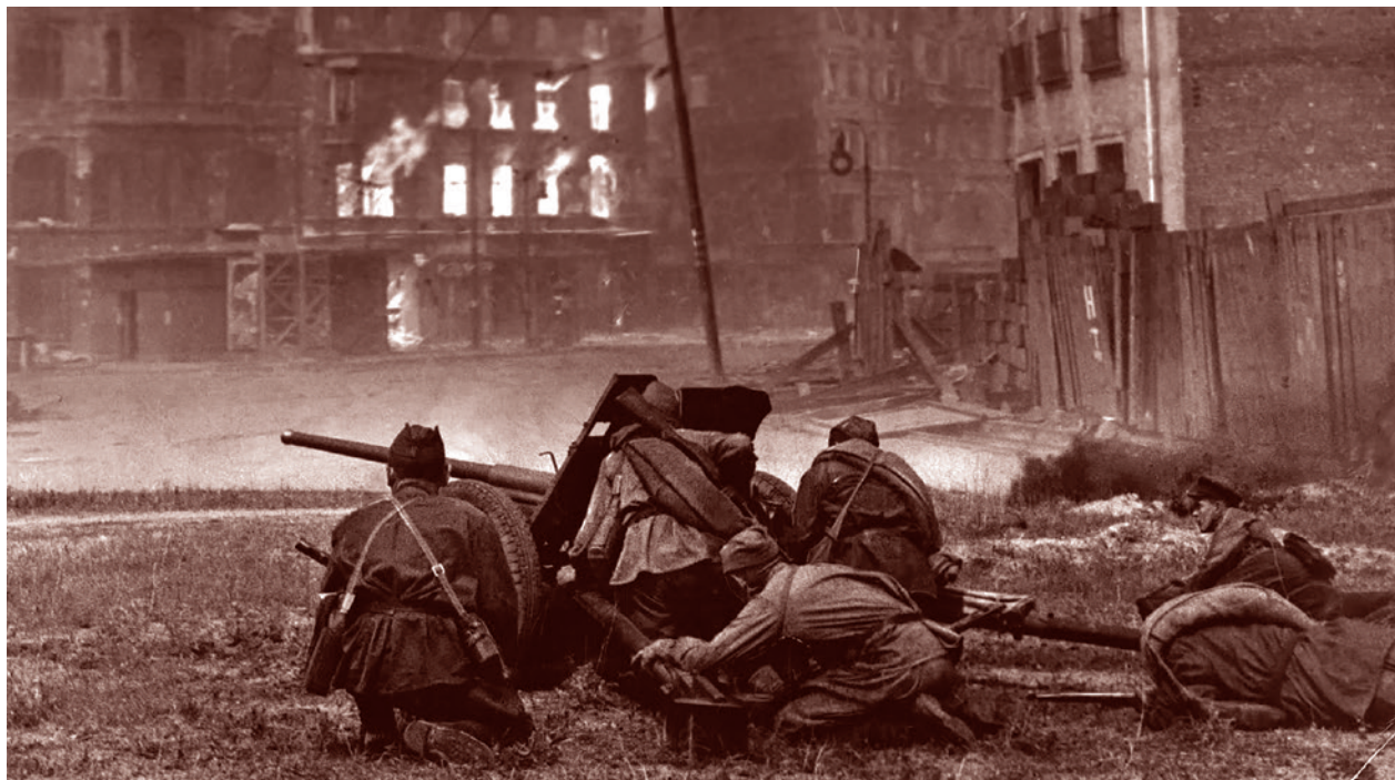
Советские бойцы ведут огонь из 45-мм противотанкового орудия образца 1942 года (М-42) на улице Берлина. Апрель-май 1945 г.