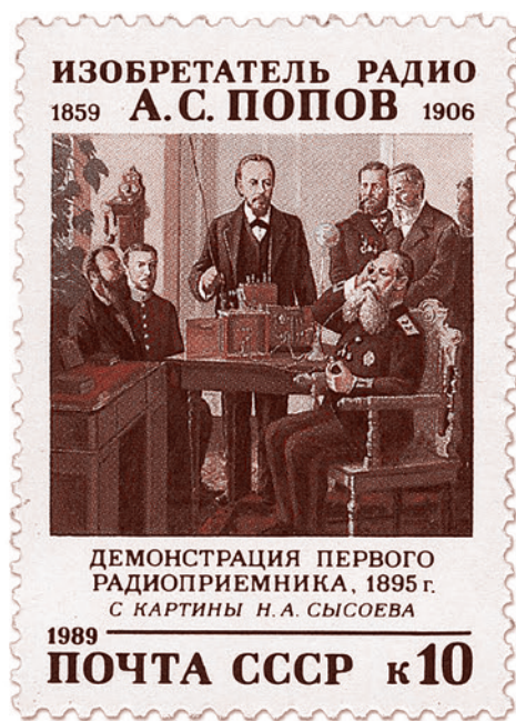
Почтовая марка СССР посвященная А. С. Попову. 1989

ком жизненно важном вопросе? И это при том, что людей, которые могли и хотели продолжать дело Попова, было достаточно. И технологии вполне позволяли это все изготавливать самим. Для своих первых приборов Александр Степанович практически все делал своими руками — выдувал стекло, столярничал, паял, т. е. для массового производства никаких непреодолимых трудностей технического характера просто не существовало. И, тем не менее, десятилетие, потерянное из-за сдачи рынка иностранцам, — это очень существенно. В период становления все меняется очень быстро.