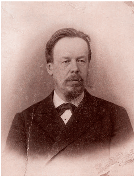
Александр Степанович Попов

7 мая (25 апреля по старому стилю) 1895 года на заседании физического отделения Русского физико-химического общества А. С. Попов выступил с докладом «Об отношении металлических порошков к электрическим колебаниям». Там же Попов демонстрирует работу своего прибора. В первом выпуске журнала Русского физико-химического общества за 1896 год в статье под названием «Прибор для обнаружения и регистрирования электромагнитных колебаний» печатается