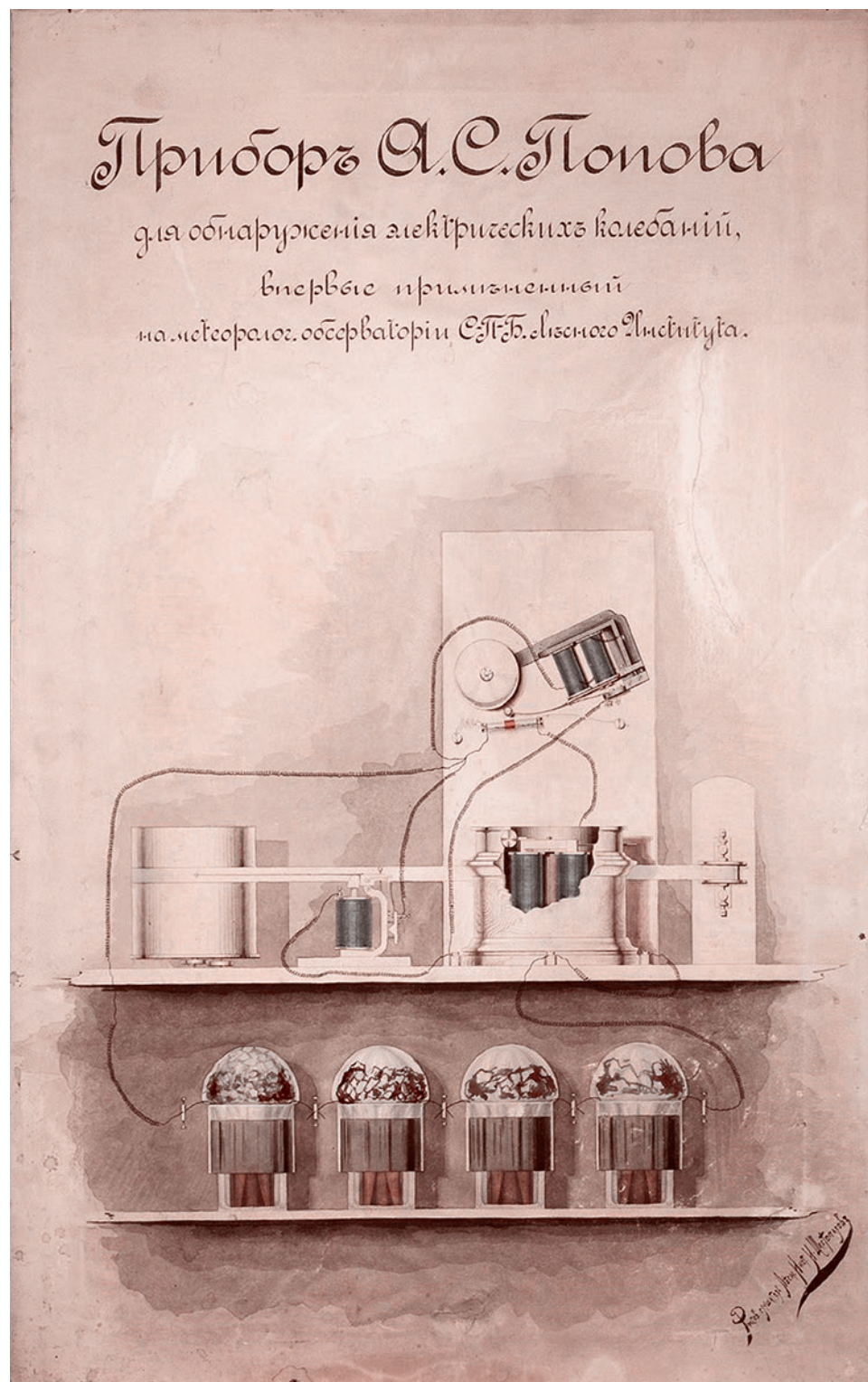
Прибор Попова А. С. для обнаружения электрических колебаний, впервые примененный на метеорологической обсерватории Санкт-Петербургского Лесного института