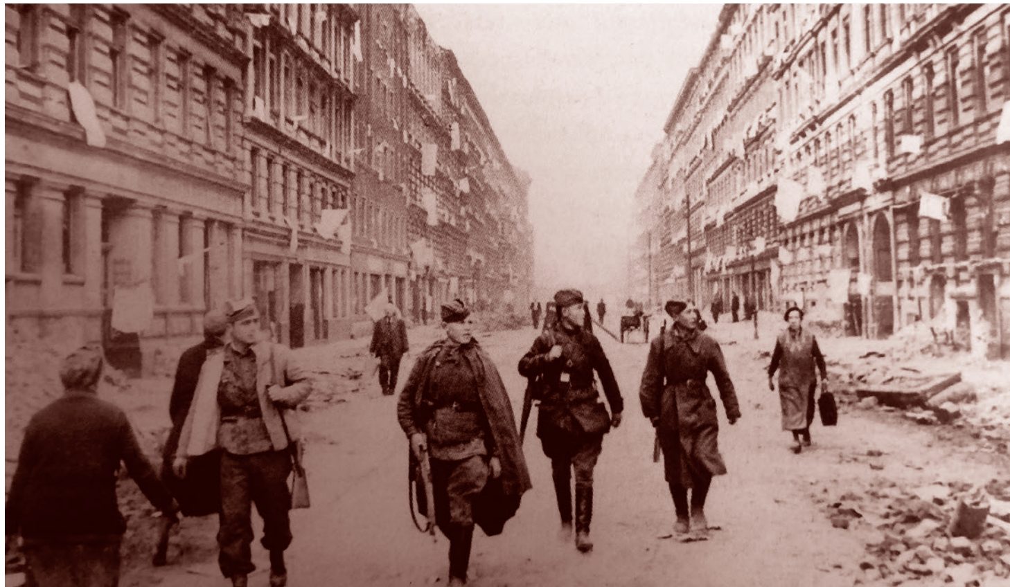
Красноармейцы и местные жители на улице Берлина после боев. Май 1945 г.

Н икогда не понимал, что значит не отличать победу от поражения. Между тем советский поэт Пастернак, который моим любимым поэтом отнюдь не является, но который, безусловно, был очень талантлив, говорил именно о таком неразличении.