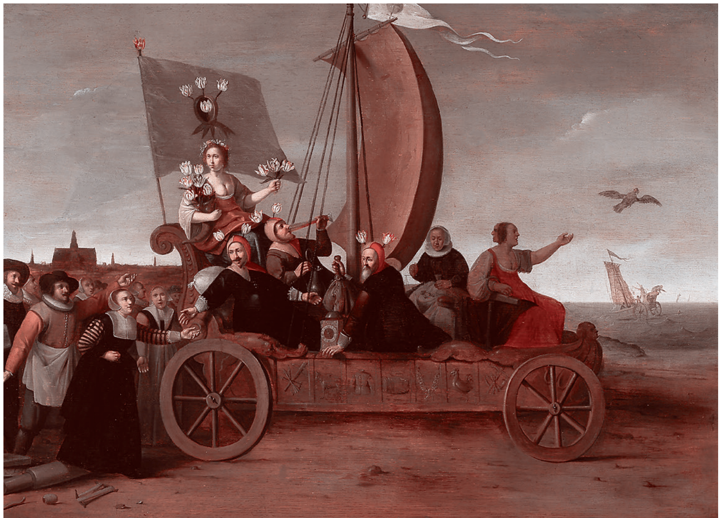
Хендрик Герфитс Пот. Телега дураков. 1637

Начиная с перестроечных времен, я упорно и не вполне безуспешно «вправлял» мозги патристическим антисоветчикам. Убеждать их в том, что Ленин или Сталин — великие сыны России, бессмысленно. И столь же бессмысленно убеждать их в том, что коммунизм спасителен для будущего человечества, что советская цивилизация является вершиной существования русской цивилизации и ее неотъемлемой частью. На то они и антисоветчики, чтобы отторгать с порога подобного рода просоветские аргументы. Они могут порадоваться победе в Великой Отечественной войне или величию советской сверхдержавы, контролировавшей половину Европы, важнейшую часть Азии, часть Африки и аж отдельные латиноамериканские государства, но и не более того.