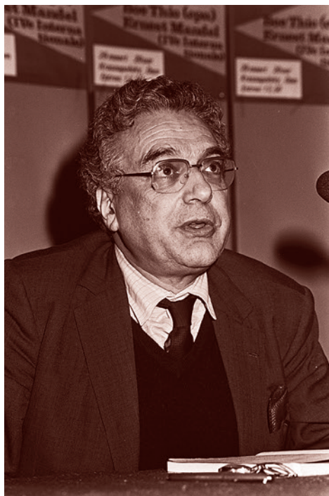
Эрнест Эзра Мандель

В целом Мандель в своем выступлении, спустя многие годы после окончания войны, продолжает проводить ту же линию, что и в манифесте Четвертого Интернационала от мая 1940 года. Он дока-