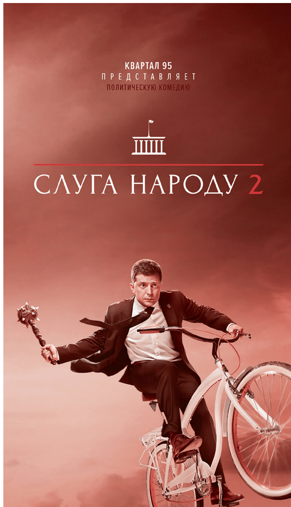
Афиша фильма «Слуга народа 2» с Владимиром Зеленским

Что начало выводиться из этого состояния немецкий народ хотя бы отчасти? Проповеди Томаса Манна? Прочувшееся нравственное чувство или