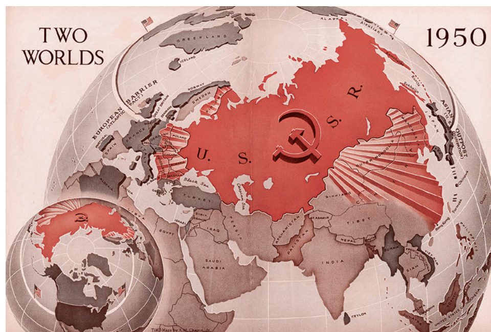
Роберт Чапин. Два мира. 1950

В связи с этим большую ценность представляет манифест «Империалистическая война и мировая пролетарская ре-