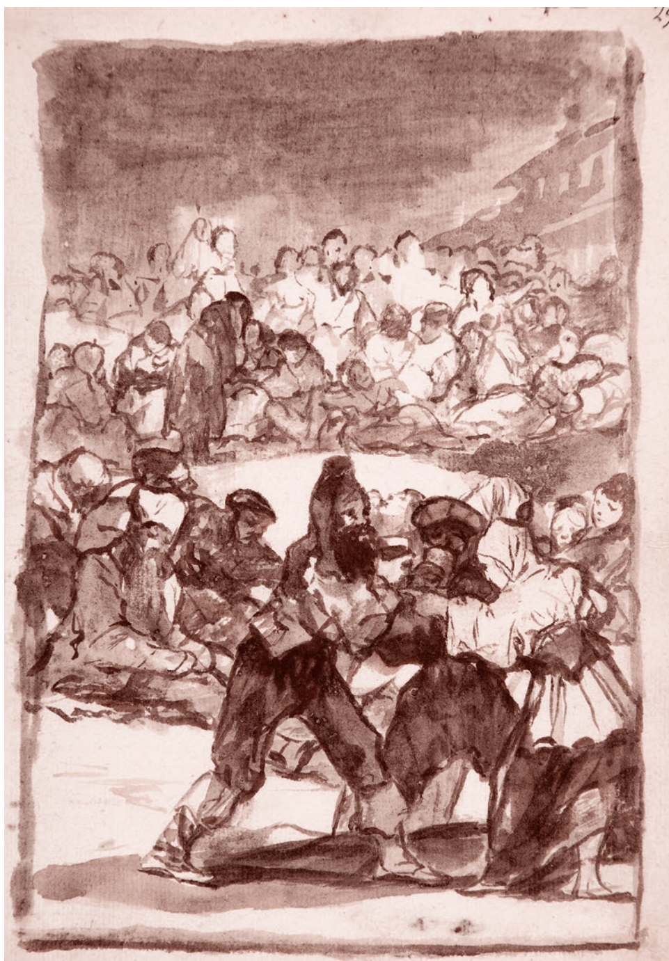
Франсиско Гойя. Толпа образует круг. Ок. 1812–1820

Эти все прибауточки и шуточки в итоге приведут к тому, что, как мне кажется, рядом с Зеленским окажется, как это ни странно, существенная часть первой команды майдана, первой генерации, которая была рядом с Порошенко. Эти люди присматриваются понемножку к Зеленскому, они обижены Порошенко, и, как мы помним, Порошенко начинал не при республи-