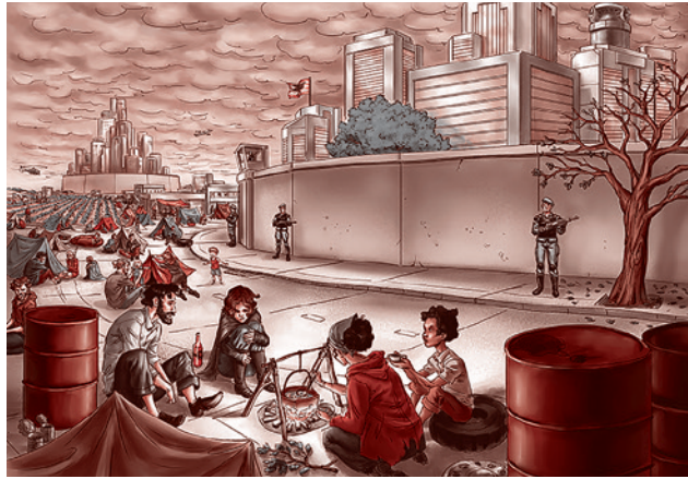
Мир крепостей («многоэтажное человечество»)