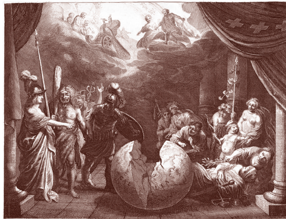
Питер Пауль Рубенс. Аллегория раздора во Франции. 1638

Сергей Кургинян: Украинская нация в ее сегодняшнем состоянии доведена до такого качества, в котором она не может сделать выбор. Здесь вот стоят люди, им говорят: «Давайте, ребята, сделаем выбор!» — значит, есть рациональное мышление, есть образ чего-то в сердце, есть понимание возможного и невозможного, есть гражданственность настоящего. С майдана начиная, а впрочем, и до этого, эту нацию вводили в состояние неадекватности — антирусской прежде всего — то есть потери себя.