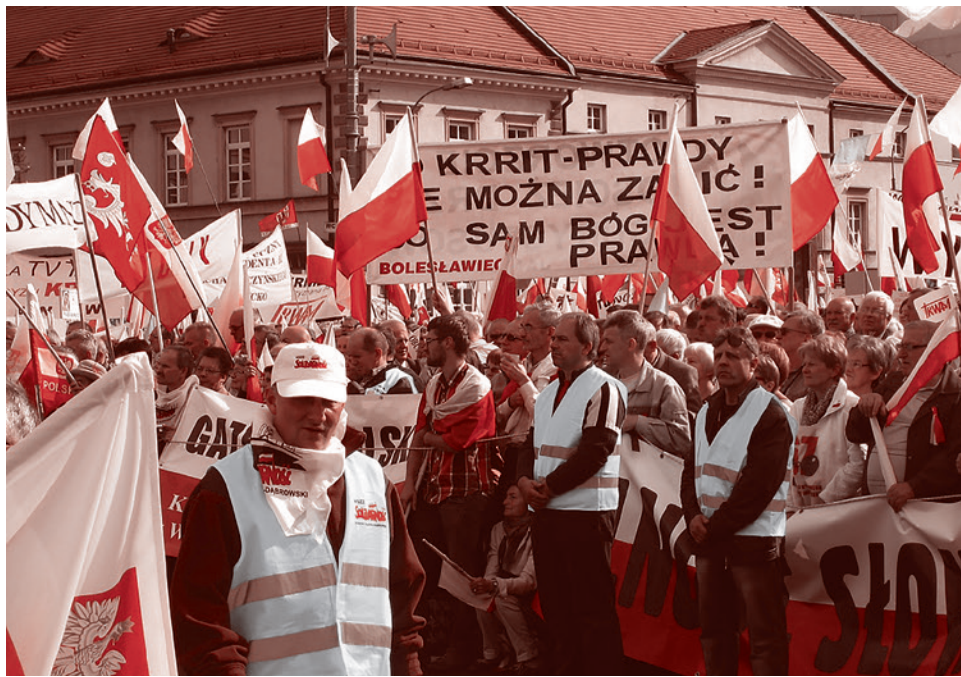
Демонстрация «Пробудись, Польша». Сентябрь 2012 г.

Первое. В сентябре 2015 года ЕС заставил Польшу принять квоту на несколько тысяч беженцев из Сирии. Это, может, и не вызвало бы особого возмущения в многомиллионной стране, если бы не предвыборная кампания. Наибольшее внимание к себе привлек Ярослав Качиньский, высказавшись нелестно о мигрантах, разносящих в Европе очень опасные болезни. Электорат PiS, для которого Евросоюз — не польский, а франко-германский проект, спокойно воспринимал такие заявления.