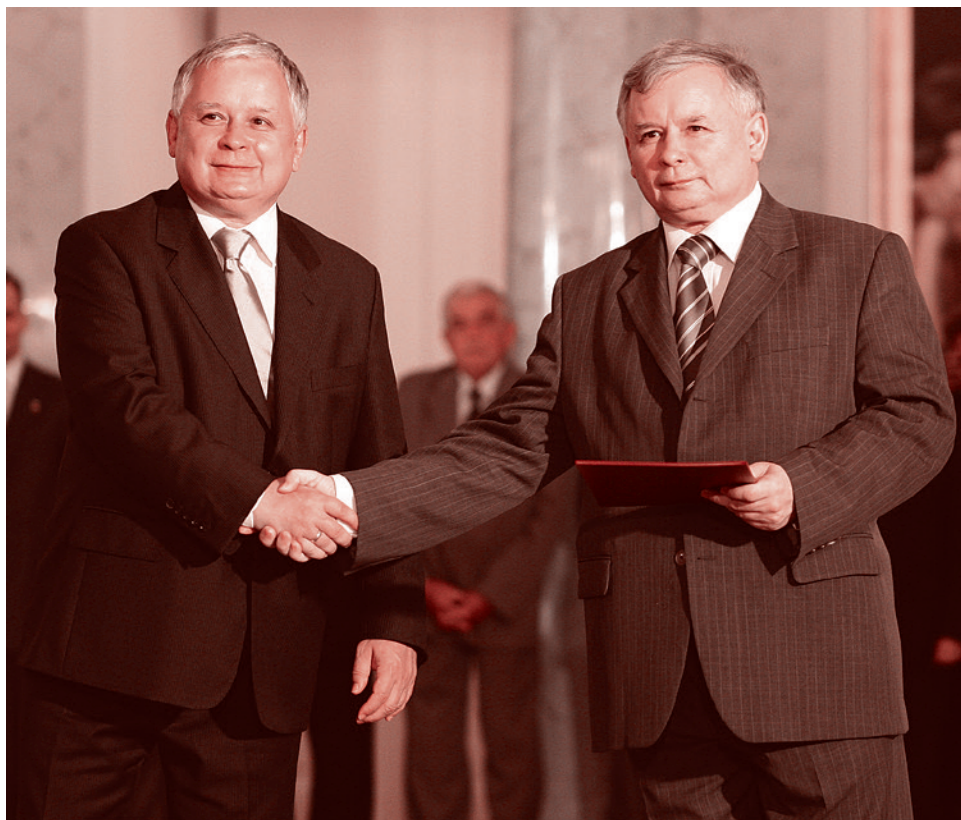
Лех и Ярослав Качиньские

Итог — в июне 2015 года Анджей Дуда, выдвигаясь от PiS, выигрывает президентские выборы. В октябре того же года парламентские выборы выигрывает PiS,