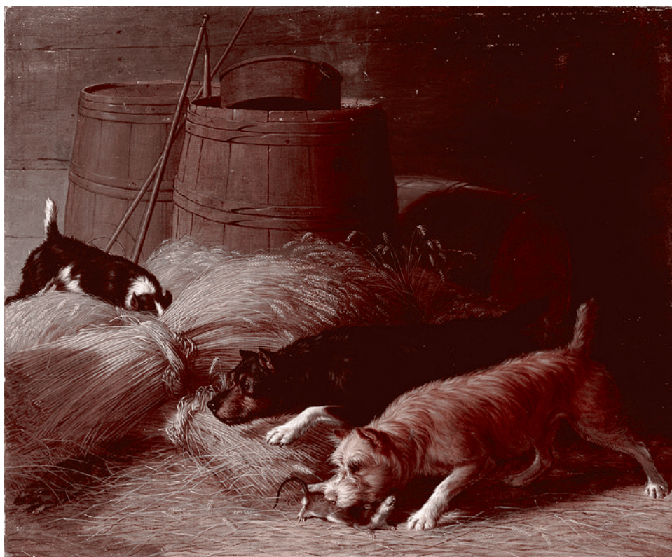
Томас Хьюз Хинкли. Крысы среди снопов ячменя. 1851

Так, в сентябре 2018 года в США была принята новая Стратегия безопасности в киберпространстве. Пока публично была представлена только несекретная выжимка из стратегии. Но презентовавший этот документ помощник президента Трампа по нацбезопасности Джон Болтон уже объявил, что соперники США в киберпространстве являются Россия, Северная Корея, Иран и Китай, и что Трамп расширил полномочия киберкомандования США, позволив ему проводить превентивные и наступательные операции в отношении враждебных государств: «Мы не будем задействовать только оборонные меры, мы намерены участвовать в наступательных операциях, и наши соперники должны иметь это в виду».