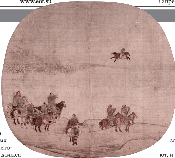
Кочевники с орлами на охоте. Начало XIII в.

Те же римляне были представителями очень оседлой цивилизации, добившейся большого восхождения по ступеням развития. Но их оружие было в целом ряде случаев хуже, чем оружие тех, кого они называли варварами. И римляне признавали это. Конфликт римского воина с воином-варваром не всегда, но, повторяю, зачастую был еще и конфликтом бронзы с железом. И, конечно же, железо побеждало бронзу на уровне отдельного столкновения. Другое дело, что организация армии у оседлых (цивилизованных) народов была выше, чем у кочевых (варварских) народов. Но если бы