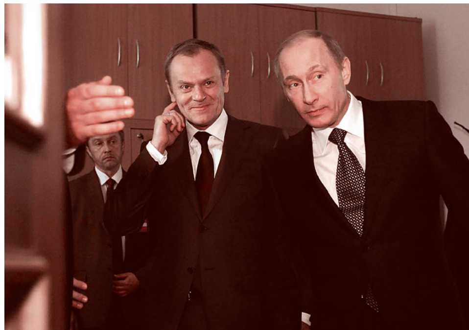
Дональд Туск и Владимир Путин

Любовь к переменам не помешала Польше до 1999 года пользоваться пенсионной системой советского типа. Мужчины уходили на пенсию в 60 лет, женщины — в 55. В 1999 году, в связи с нарастающей «заботой о благе народа», в антикоммунистическом правительстве премьер-министра Ежи Бузека созрели четыре реформы: местного самоуправления, здравоохранения, образования и пенсионной системы. Солидарная пенсионная система превратилась в накопительную, а пособие разделилось на базовую и накопительную составляющие. Была задумка избавить всех пенсионеров и от отраслевых привилегий, но она не удалась: для шахтеров, судей и прокуроров, силовиков,