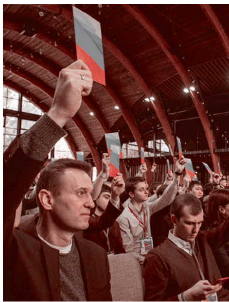
МОСКВА, 28 марта — navalny.com

Такие громкие дела с бывшими и нынешними представителями «партии власти» дают повод внесистемной оппозиции для поднятия своего рейтинга и объяснения своих (как они считают, пока временных) неудач.