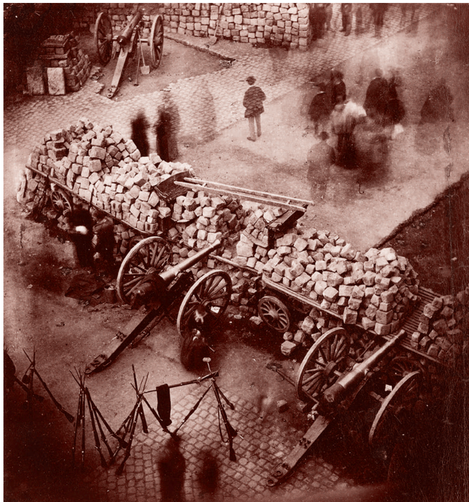
Пьер-Амброз Ричебург. Баррикады Парижской коммуны. Апрель 1871

Наконец, в 1871 году в Париже и ряде других городов Франции на волне серьезного экономического кризиса вспыхнула революция. На несколько недель в городе было установлено первое в новейшей истории народное правительство. Восстание получило название Парижской коммуны. И хотя оно было утоплено в крови