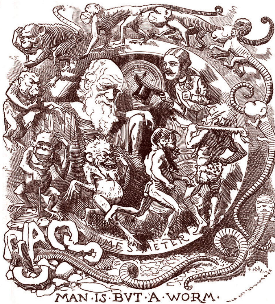
Карикатура теории Дарвина из альманаха журнала «Punch» за 1882 год

Для Ленина всё обстоит иначе. Сначала, говорю условно, новая мотыга, а потом — сеть каналов, которые такой мо-