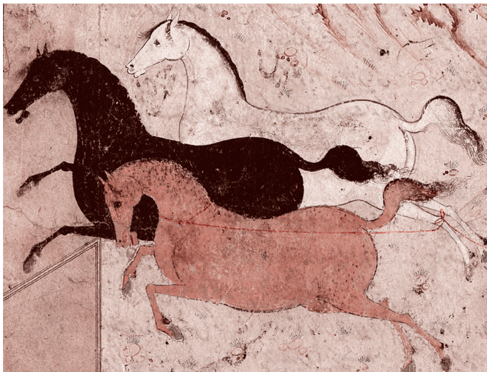
Три лошади в галопе. Персия, середина XVI в.

Но предположим, что мы прочтем всё, написанное по поводу христианской неканоничности тамплиеров. Что мы разберем каким-то образом всю полученную информацию. Что мы сумеем разобраться в том, какие показания на допросах, данные тамплиерами, порождены свирепыми инквизиторскими пытками и содержат в себе только напраслину, а какие содержат нечто, заслуживающее внимания. Ведь, в конце концов, удалось с неверо-