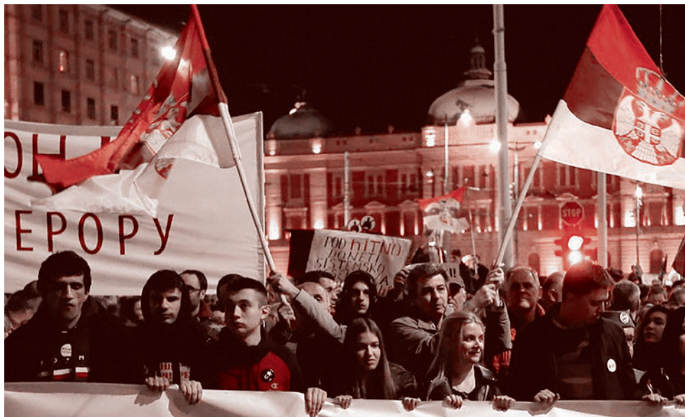
Протестующие в Белграде. 16 марта 2019 г.

«Сербия защитит свой народ в Косово и Метохии, если те, кто должен защищать сербов, не выполняют свою работу», — заявил Вучич. Сербский лидер напомнил, что защищать сербское население в Косове должны силы KFOR (Международные силы для Косова под командованием Североатлантического альянса). «В НАТО должны понимать, что их работа — защищать сербов, ожидаю, что они будут реагировать, если сербы окажутся под угрозой», — сказал он.