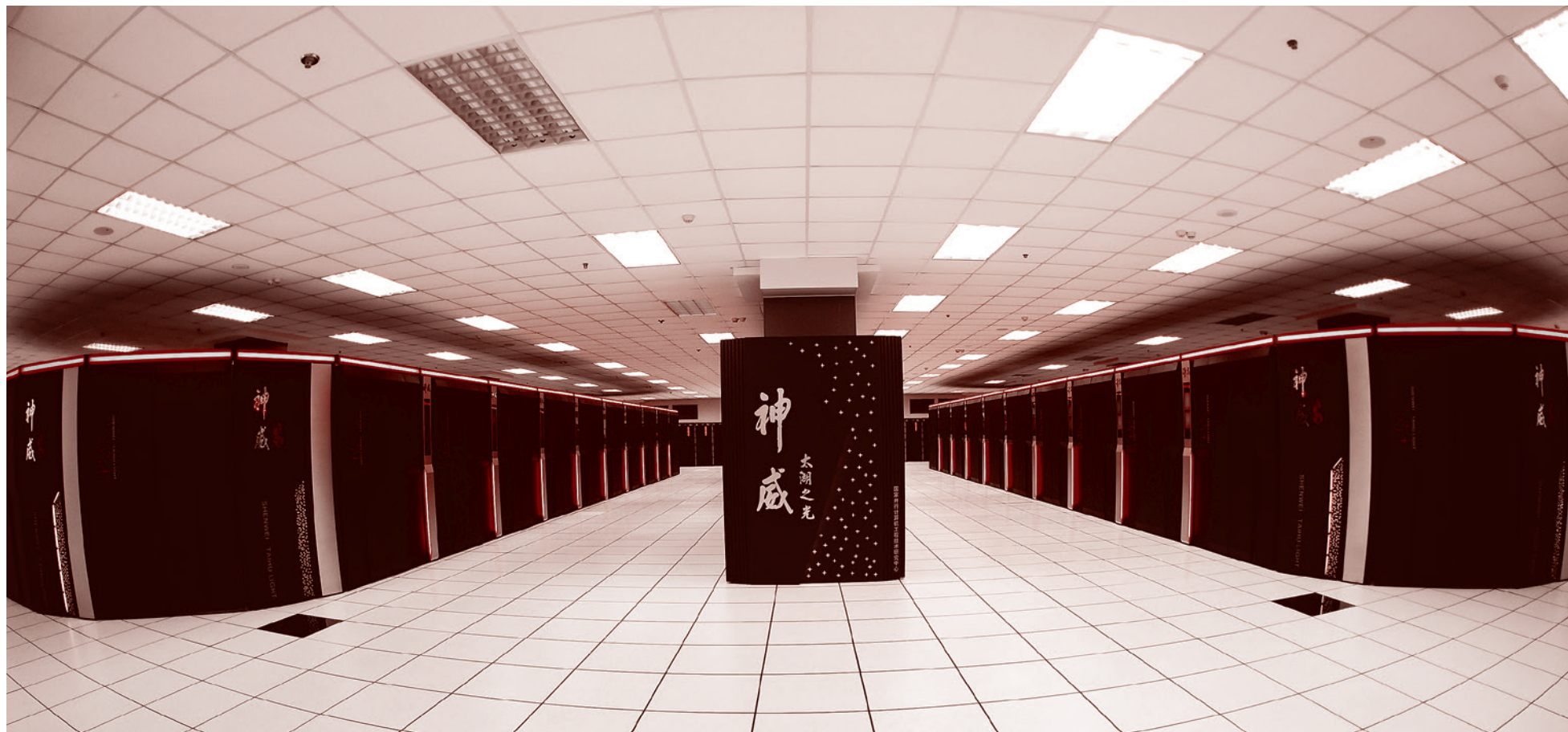
Суперкомпьютер Sunway TaihuLight