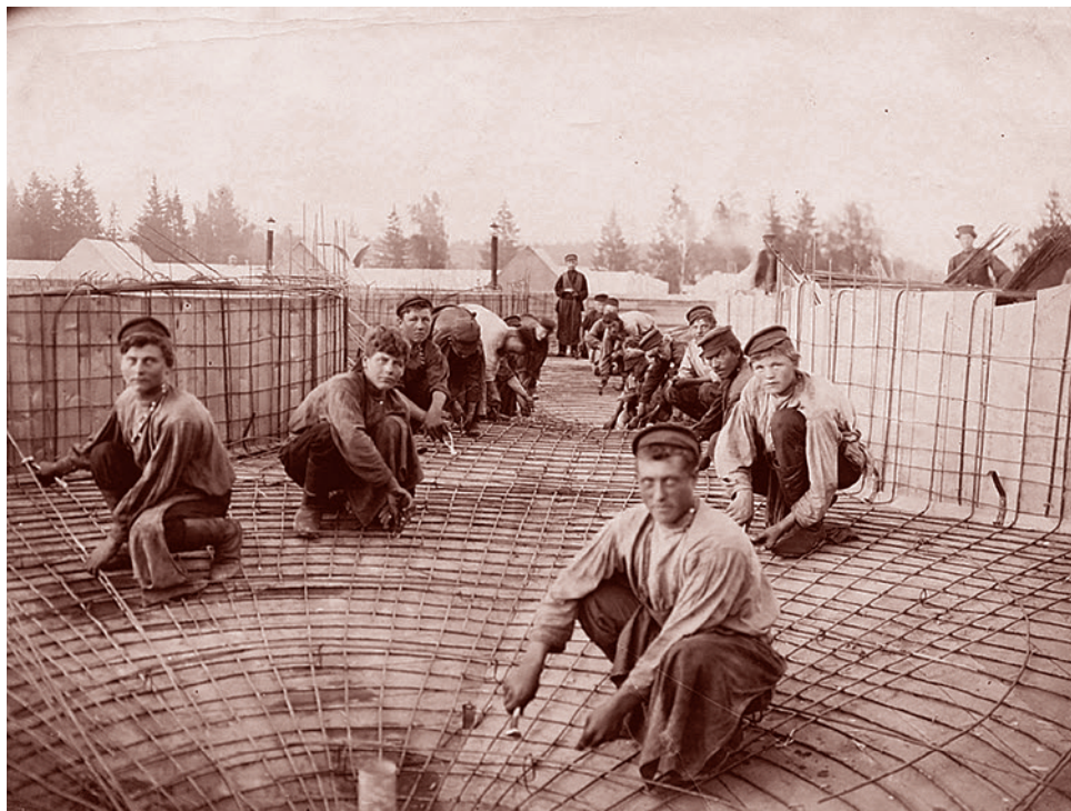
Закладка арматуры на крыше Ново-ткацкой фабрики в Богородске. 1907