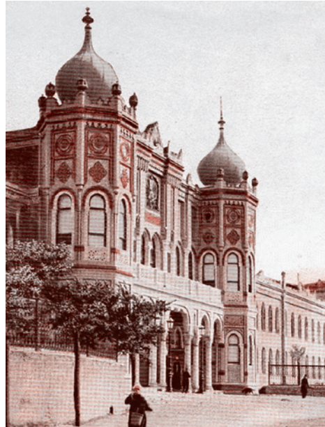
Казармы стамбульского гарнизона на площади Таксим

опасности Турции. На этой карте границы «Новой Турции» раздвинуты далеко на пределы нынешних границ государства и включают северную Сирию, Кипр, часть Ирака, часть Греции, а также часть Грузии и Азербайджана. Иными словами, значительно количество прежних османских земель.