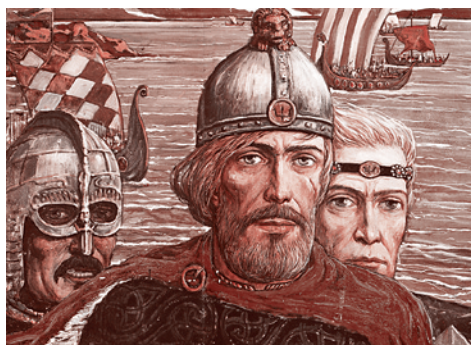
Илья Глазунов. Внуки Гостомысла: Рюрик, Трувор, Синеус.

Кто и когда начал пропагандировать в России неоязычество, причем с расчетом на успех этой пропаганды в широких народных массах?