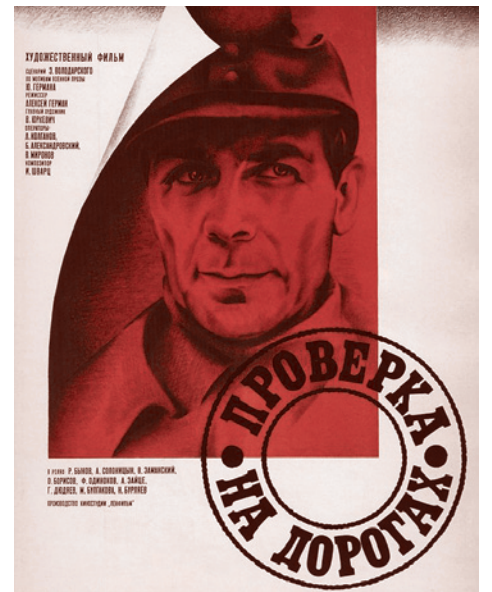
Постер фильма «Проверка на дорогах», 1971 г.

На фоне этой гнетущей атмосферы слова героя фильма «Мой друг Иван Лапшин» о том, что «здесь будет город-сад. И мы еще погуляем в этом саду», кажутся столь же неубедительными, как запуск ракеты и по-