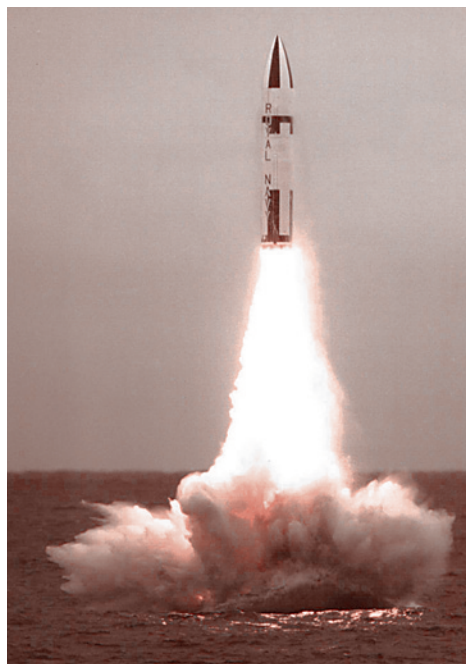
Пуск ракеты «Поларис» с борта британской ПЛАРБ HMS Revenge (S27)

Именно эта новая, бесконечно опасная для СССР, концепция США, а не оголтелость советского руководства, привела к невиданной гонке ядерных вооружений.