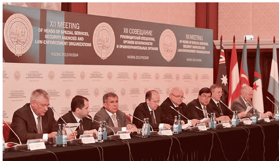
XII международное совещание руководителей спецслужб, органов безопасности и правопорядка

Подчеркнем, что главной целью «Исламской партии Туркестана» является возрождение «Великого исламского халифата» в Центральной Азии, а также на территории