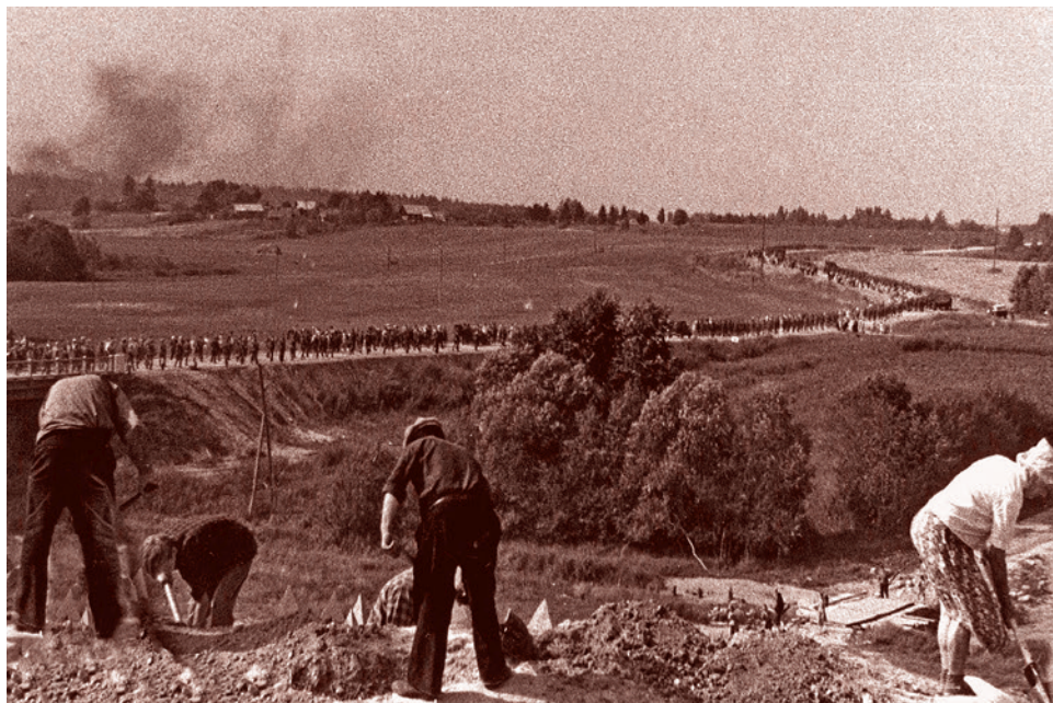
Ленинградцы на строительстве Лужского рубежа. Лето 1941 г.

Тем не менее, советские мехвойска при всем несовершенстве их организационной структуры были силой, позволявшей командованию Красной Армии быстро реагировать на действия противника. Массы танков даже без должного мотострелкового сопровождения и артиллерийской поддержки вынуждали германских военачальников действовать значительно осторожнее. По итогам первого месяца войны начальник штаба Верховного командования сухопутных войск Франц Гальдер 25 июля записал в своем дневнике: «Численность танковых войск у противника оказалась большей, чем предполагалось».