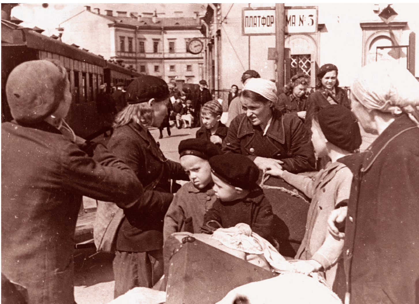
Эвакуация детей из Ленинграда