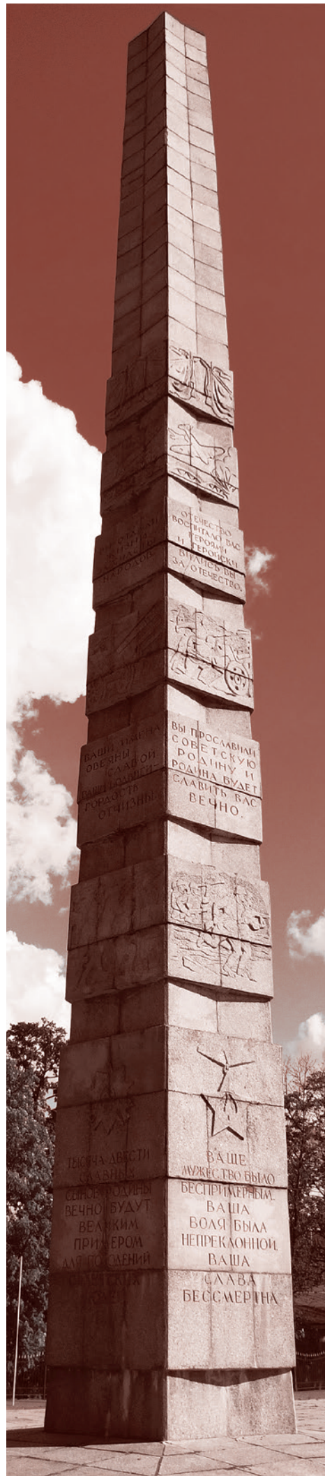
Памятник 1200 гвардейцам в Калининграде. 2014 г.

Алиханов, имея «доступ к определенной информации», убежден: «По результатам социологических исследований, которые проводятся в Калининграде, этого [влияния германизации] не видно». То есть она как бы есть, но беспокоиться по данному поводу не стоит, поскольку эффекта от нее почти нет. Но это, знаете ли, как посмотреть. Губернатору удобно сказать: раз большинство не выступает за германизацию, не просит европеизации и т. д., то результат этой германизации почти нулевой. А можно сказать, что раз большинство не выступает против этой германизации, раз оно не сопротивляется и даже не кричит о своем возмущении, значит, оно пассивно эту германизацию поддерживает и одобряет.