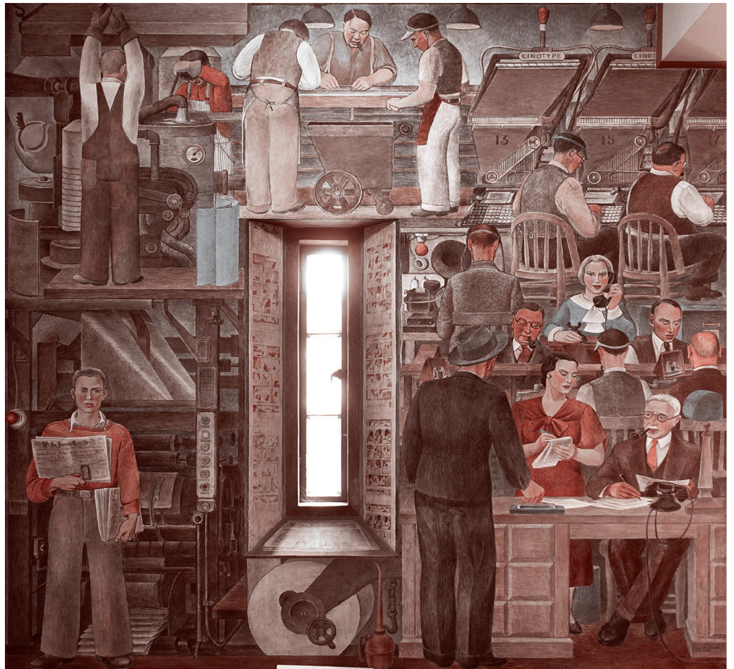
Сюзанна Шойфер. Сбор новостей. Фреска в Койт-Тауэр, Сан-Франциско. 1930-е

После 1945 года об этом стали говорить все победители без исключения. Разговор велся, говоря образно, на нескольких языках. То есть он и в буквальном смысле велся на всех языках мира: от русского и английского до китайского и индийского. Но я здесь хочу обсудить разговор на нескольких интеллектуальных уровнях, каждый из которых требует своего условного языка.