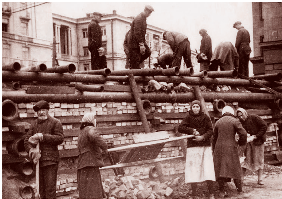
Постройка баррикады в Автovo. 24 сентября 1941 г.