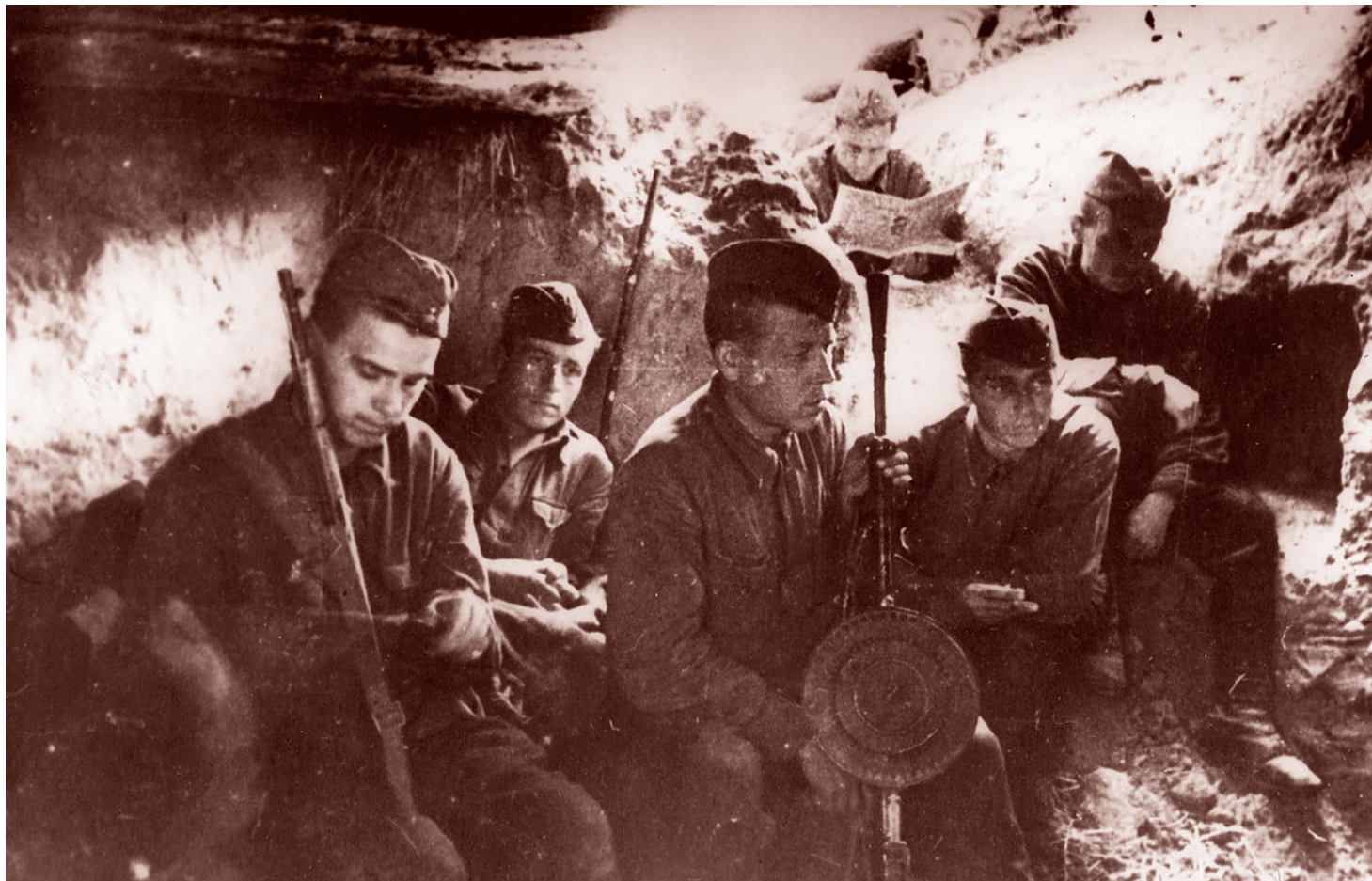
Ополченцы 1-го полка 1-й дивизии народного ополчения отдыхают в траншее на Лужском рубеже. Ленинградская область. 1941

Сформированные в 1940–1941 годах советские мехкорпуса состояли из танковых и моторизованных дивизий. Эти дивизии имели сравнительно мало мотопехоты и артиллерии, к тому же артиллерия, оснащенная медлительными маломощными тягачами, постоянно отставала на марше. Естественно, они не могли бороться на равных с аналогичными германскими дивизиями, которые, по характеристике генерал-майора Фридриха фон Меллентина, представляли «в высшей степени гибкие соединения всех родов войск, всегда, и в наступлении и в обороне, отиравшиеся на [свою] артиллерию».