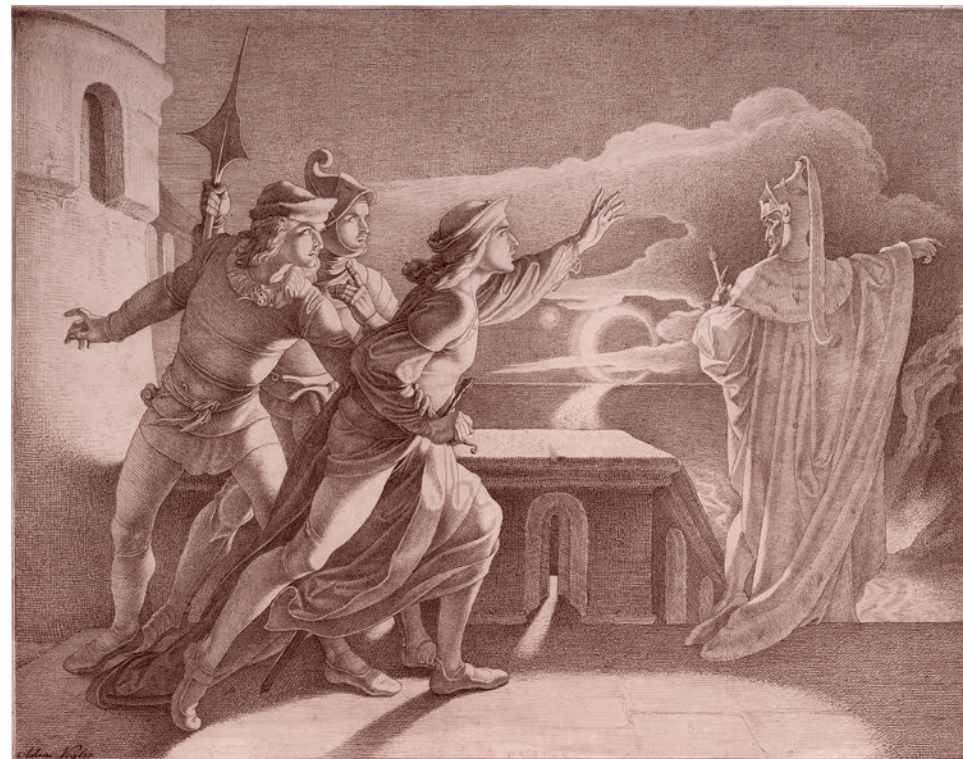
Адам Воглер. Гамлет и тень его отца. Середина XIX в.

Я не раз уже вспоминал об одной мо- ей встрече в конце 1980-х с крайне именитым философом, являвшимся тогда советником Горбачева. Встреча происходила в крохотном зале, находив- шемся в здании Политехнического музея. Философ был преисполнен самоуважения и ощущения политического могущества. Он утверждал, что все демократические движения, уже носившие откровенно ан- тивластный характер, находятся под кон- тролем власти, и сравнивал этот контроль с мудрой демиургией Создателя, позво- ляющего свободно действовать своим потомкам. В конце своего монолога философ сказал: «Мы сначала властно вклиниваемся в процесс и оказываем на него внешнее воздействие, а потом предоставляем все возможности живому творчеству масс».