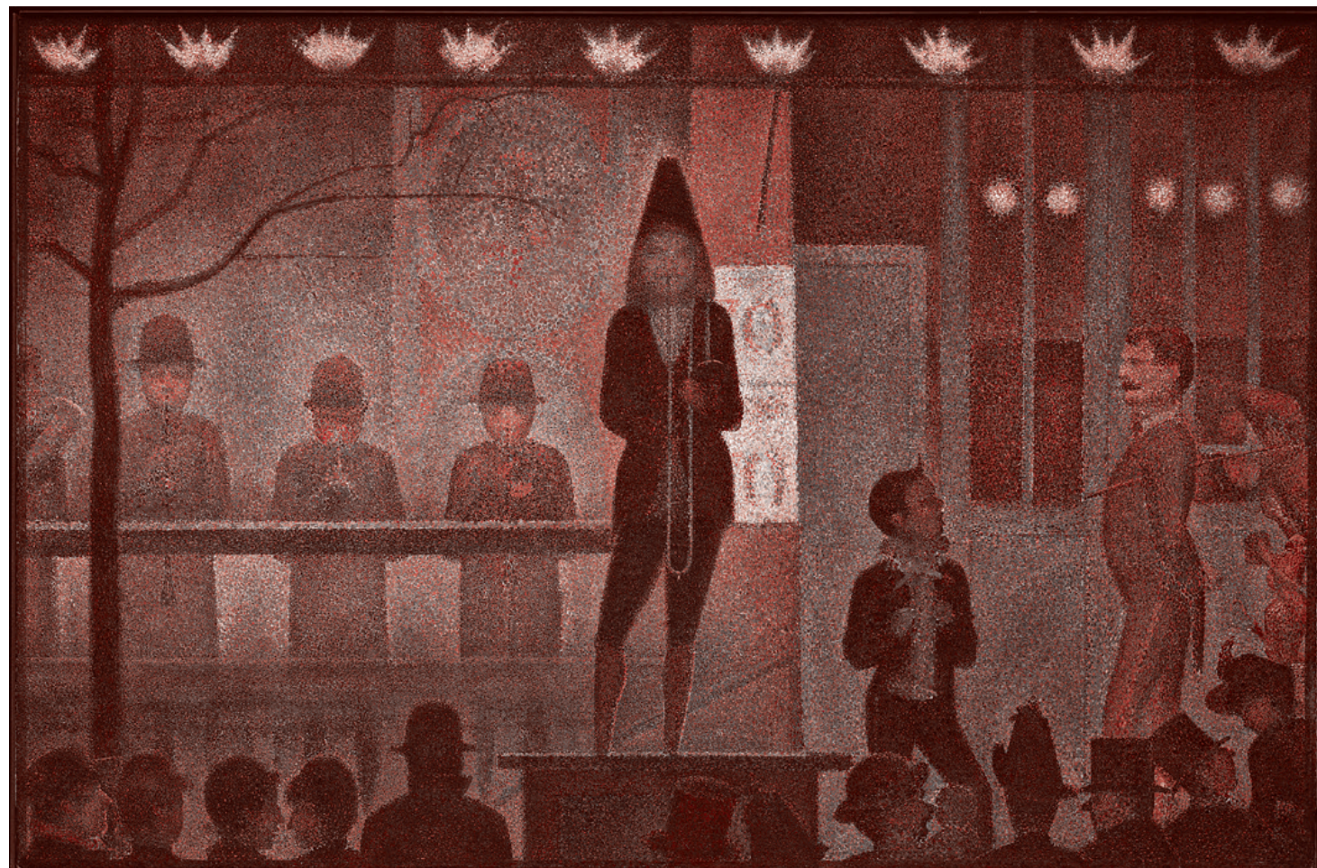
Жорж-Пьер Сёра. Цирковое сийдшоу 1887–1888

Пытаясь возглавить «протестную повестку дня» в регионах, сторонники Навального привлекают себе в помощь и западные СМИ.