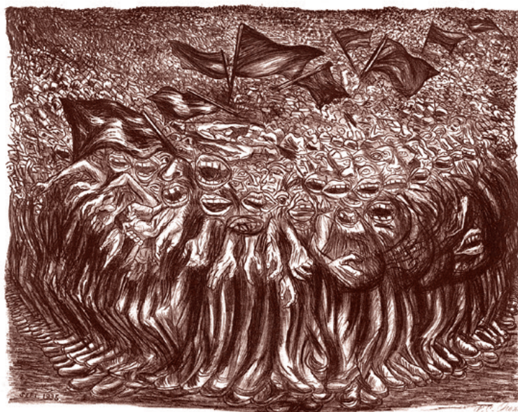
Хосе Клементе Орозко. Массы. 1935

Чем больше думаю, тем больше крепнет уверенность, что все эти разговоры о том, что погибшие за свободу Донбасса — обманутые дурачки, зря отдавшие свои жизни «за олигархов», о том, что «Суть времени» пиарится на их памяти — это никакая не «левая идейность», не «пролетарский интернационализм» и не «классовый подход». Это тоскливый шакалий вой, порожденный смертельной завистью. «Пузыри Интернета» в глубине души отлично знают себе цену. Никакая популярность, никакие десятки комментариев и тысячи подписчиков не могут заменить осмысленности жизни и реализации истинного мужского долга — защищать слабых, спасать гибнущих. Если угодно — быть рыцарем. Обзавестись семейством — еще не значит доказать, что ты мужчина. Можно утешаться тем, что Че Гевара то-