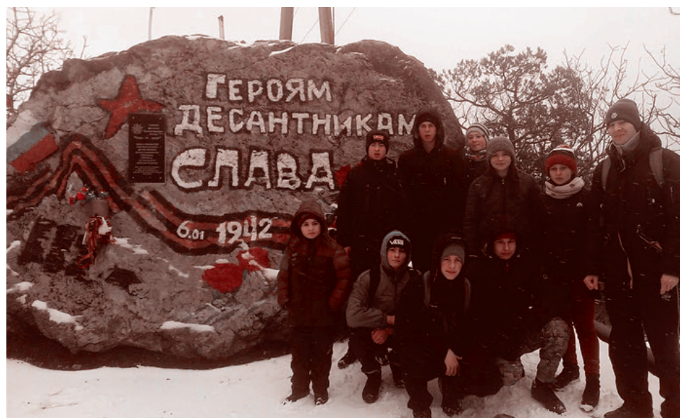
Дети из ЛНР в Крыму