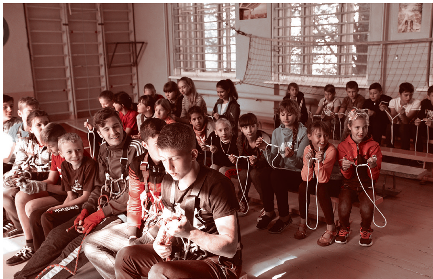
Дети из ЛНР на занятиях по альпинизму