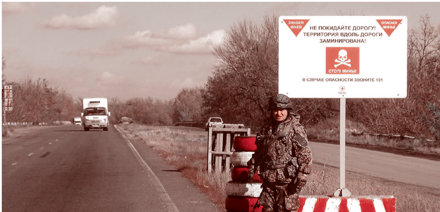
ДНР. «Территория вдоль дороги заминирована!». Октябрь 2018 г.

Особо примечательно то, что в этом своем видении ситуации в Донбассе леваки из ЛФ теснейшим образом сплелись с откровенной прозападной либеральной «пятой колонной». Например, в интервью «Радио Свобода» от 17 октября 2014 г. Илья Пономарев, обсуждая действия украинской «Борьбы» (филиал ЛФ в Украине), заявил: «Правительство на Украине абсолютно такое же, как и в России. До мелких деталей. Такой же неолиберал во главе кабинета министров, такие же неолибералы и национал-консерваторы внутри. Чем депутат Верховной рады Ирина Фарион отличается от министра культуры РФ Владимира Мединского, а премьер Дмитрий Медведев от премьера Арсения Яценюка?» Более того, по мнению Пономарева, «правый шабаш у нас ничуть не меньше, чем на Украине». Однако ключевым для нас в мысли Пономарева является следующий пассаж: