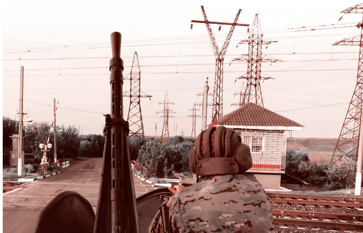
Вид с крыши БТР «Болгарин» отряда «Суть времени». Май 2018 г.