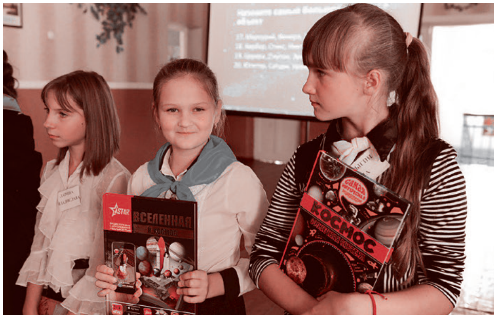
Ученицы школ Красного Луча с книгами про космос

В первые наши поездки мы привозили надежду и возможность выжить физически. Потом боевые действия отодвинулись от Красного Луча. Создалась ситуация шаткого, постоянно нарушаемого перемирия. И тут мы увидели, что от нас ждут уже не только помощи, но и ответа на вопрос, что дальше? Очевидно, что и мы обязаны себе на него ответить. Ответ о будущем важен, как никогда. Только он, на мой взгляд, позволит выстоять и победить.