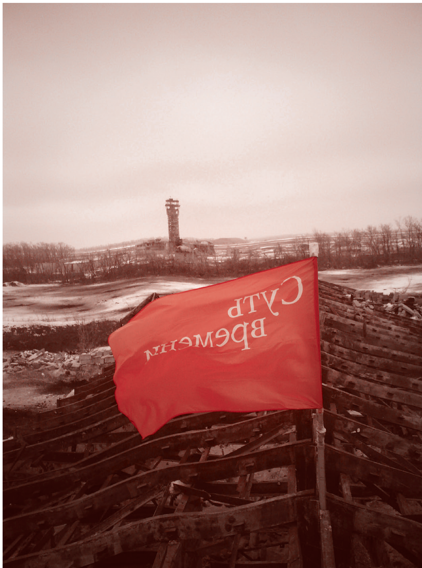
Вид на диспетчерскую вышку Донецкого аэропорта с позиции «Монастырь». Декабрь 2014 г.