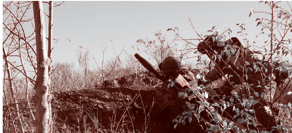
Отряд «Суть времени». Осень 2018 г.

Что постоянно нужно находиться в состоянии повышенной концентрации внимания и продумывать все и вся на несколько шагов вперед, что в обычной жизни делать не привык. Что отныне ты отвечаешь не только за себя и за тех, кто рядом с тобой, за своих бойцов, но и за тех, кого ты взялся защищать — гражданских, мирных жителей, оставшихся за линией фронта. Что твоя ошибка и малодушие будет стоить им жизни.