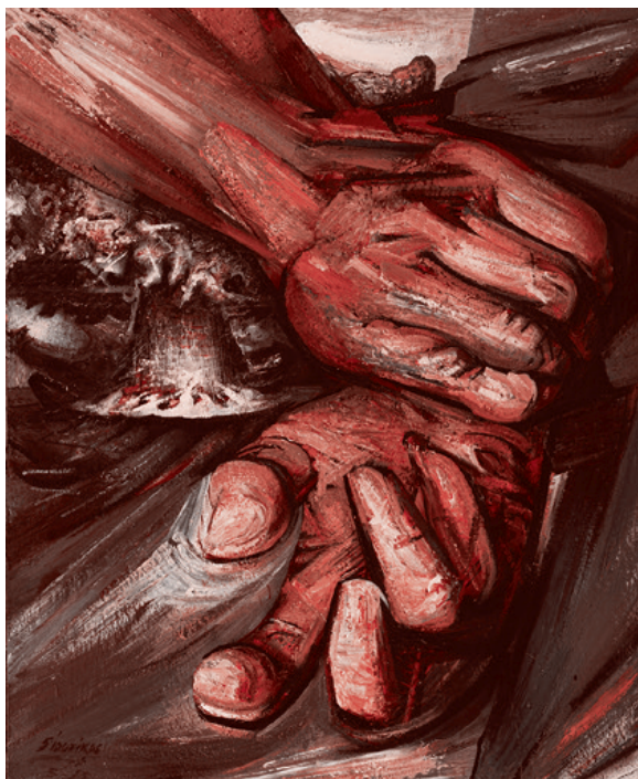
Давид Альфаро Сикейрос. Руки. 1949

По мне, так не о воскрешении или омолаживающем исцелении нашей Родины должны мы сейчас мечтать. Да, мы должны сделать всё возможное для этого воскре-