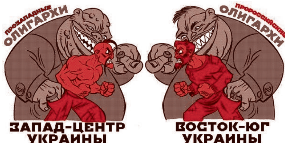
Пояснительная картинка