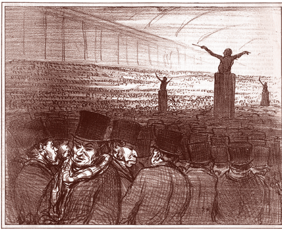
Оноре Домье. Союз телеграфа и музыки. 1859

«Открытая Россия» же на своей конференции в Праге огласила приверженность более политическому, а не политтехнологическому пути. «Открытая Россия» будет поддерживать кандидатов, разделяющих ценности движения и имеющих достаточную общественную поддержку. «В ситуации нестабильности власти правящего режима как никогда успешными могут быть политические коалиции и союзы. «Открытая Россия» поддерживает коалиционные политические инициативы, как на выборах, так и по локальным политическим вопросам и проблемам. Мы будем сотрудничать с политиками и активистами, разделяющими ценности и взгляды