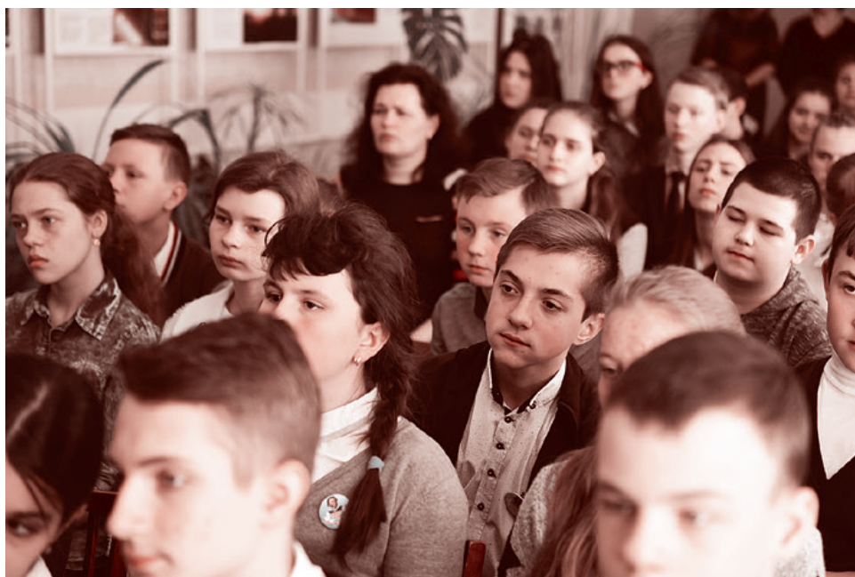
Ученицы школ Красного Луча

На протяжении зимы и весны с учениками 10-й школы Красного Луча активисты РВС и педагоги школы провели два конкурса чтецов: один по стихотворениям Пушкина, второй по стихотворениям поэтов-фронтовиков. В ходе подготовки к конкурсам чтецов с детьми онлайн работал профессиональный российский театральный режиссер. При современных доступных средствах связи и видеозапи-