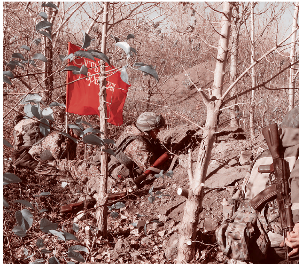
Отряд «Суть времени». Осень 2018 г.

Поэтому, когда после силовой узурпации киевской власти украинскими радикалами, почитающими нацистских преступников Бандеру и Шухевича, ряд регионов стал громче говорить о неприятии этой новой власти, даже в России не у всех было понимание того, что ситуация движется в сторону гражданской войны.