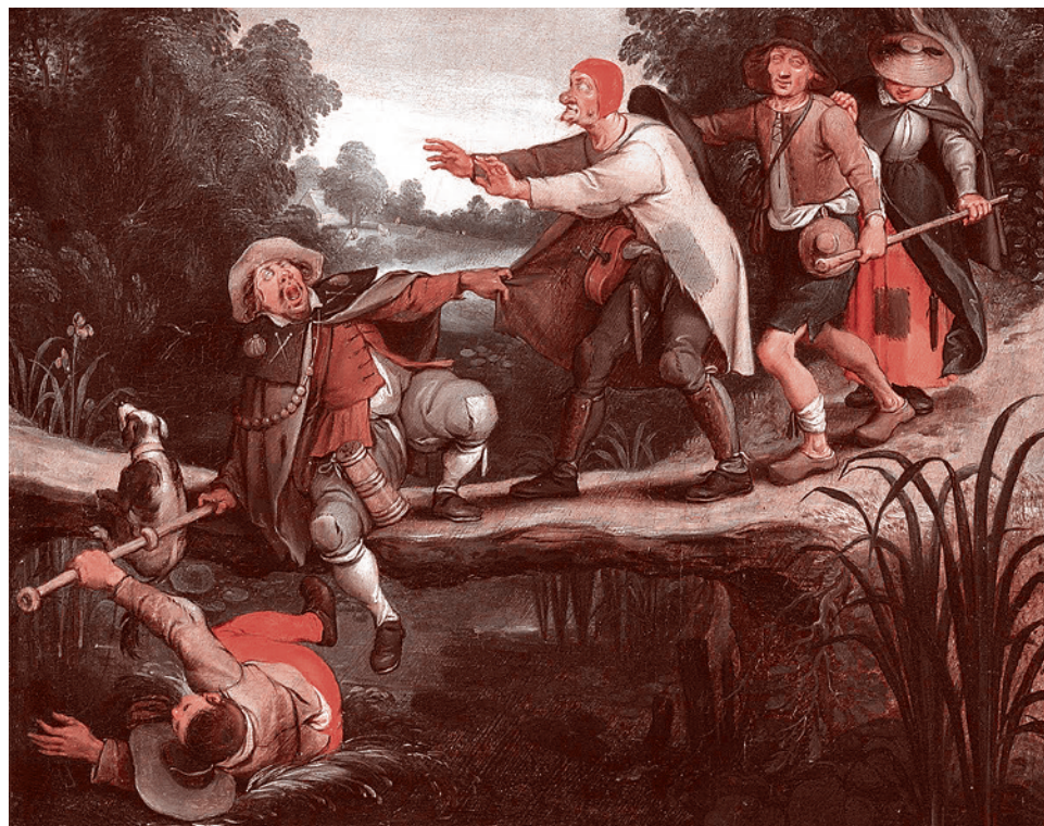
Себастьян Вранкс. Притча о слепых (фрагмент). XVII в.

С точки зрения драматургии, игнорирование Путиным 5-метрового баннера с вопросом про обращение миллиона граждан следовало бы считать одним из ключевых моментов всей пресс-конференции. И это молчание на встрече с широкой аудиторией является показателем того, насколько мощная рука, продвигающая процесс пенсионного реформирования. Она ничуть не слабее той, которая послала украинские катера в Керченский пролив с расчетом на международный скандал. Две руки играют вместе, а их «музыка» будет иметь трагические последствия для страны.