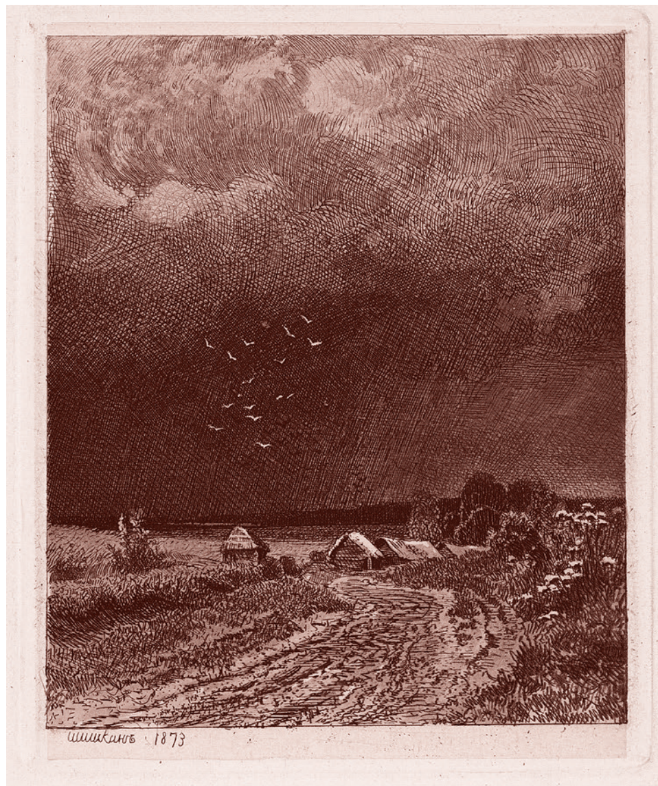
Иван Шишкин. Перед грозой. 1873

Но труп дорогого для нас СССР и коммунизма был не просто откинут на историческую обочину. Этот труп стал разлагаться, заражая трупным ядом не только, что ориентировалось на живой СССР и жи-