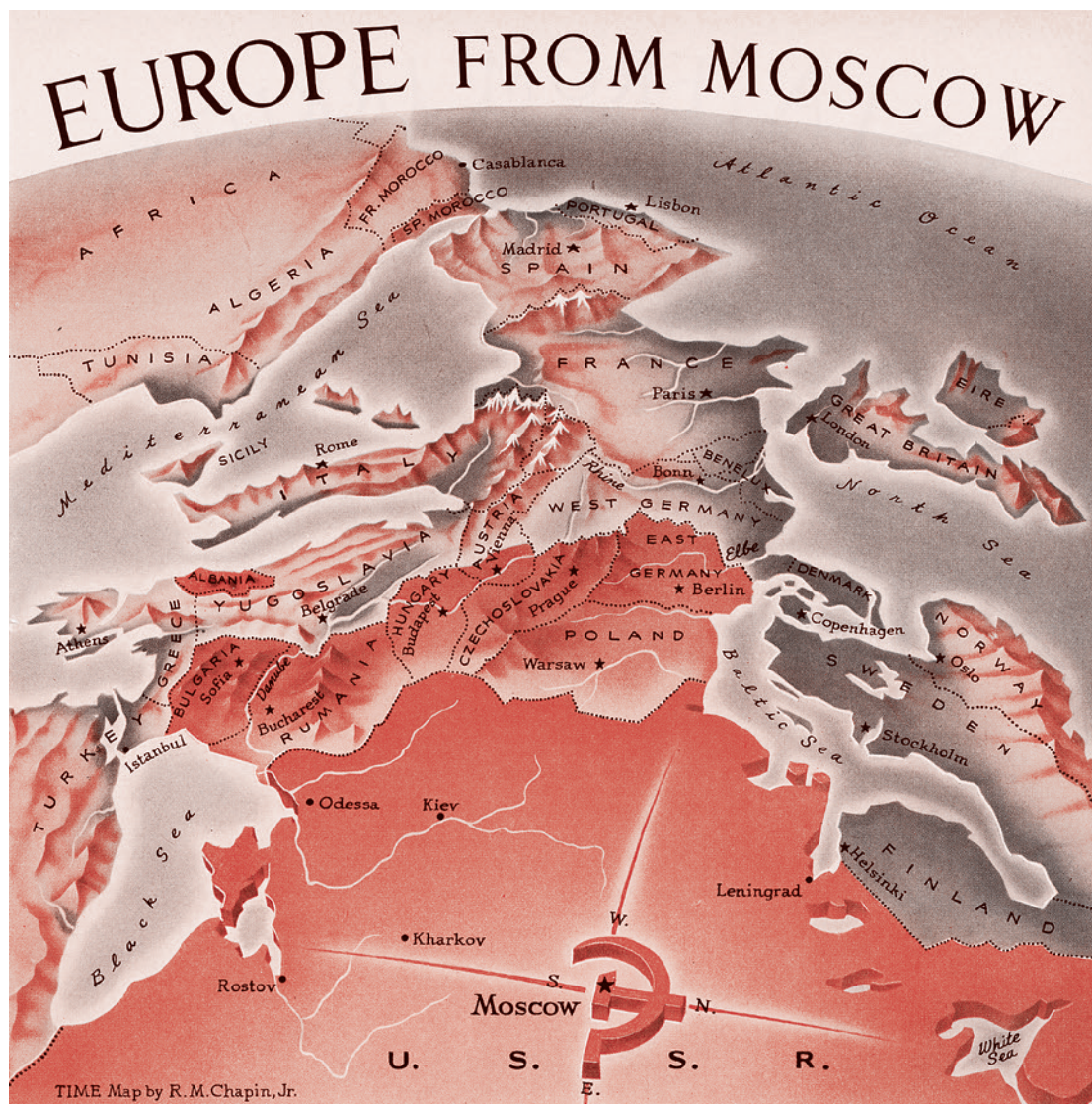
Р. М. Чапин. Вид на Европу из Москвы. 1952

Что она не сумела победить даже с трудом выбравшуюся из феодализма Японию.