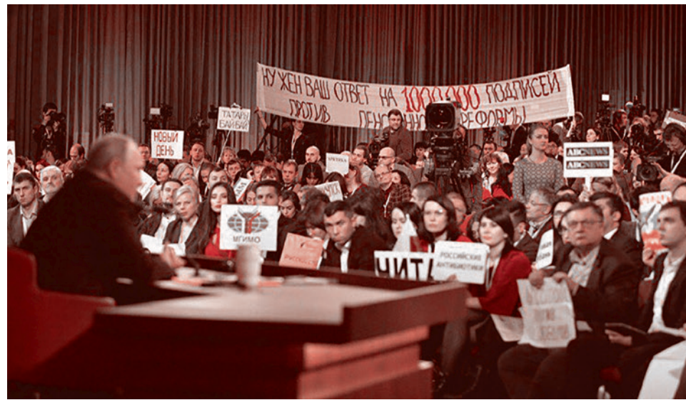
Транспарант на ежегодной пресс-конференции Владимира Путина. 20 декабря 2018 г.

Пятиметровый транспарант с надписью «Нужен ваш ответ на 1000000 подписей против пенсионной реформы» раз-