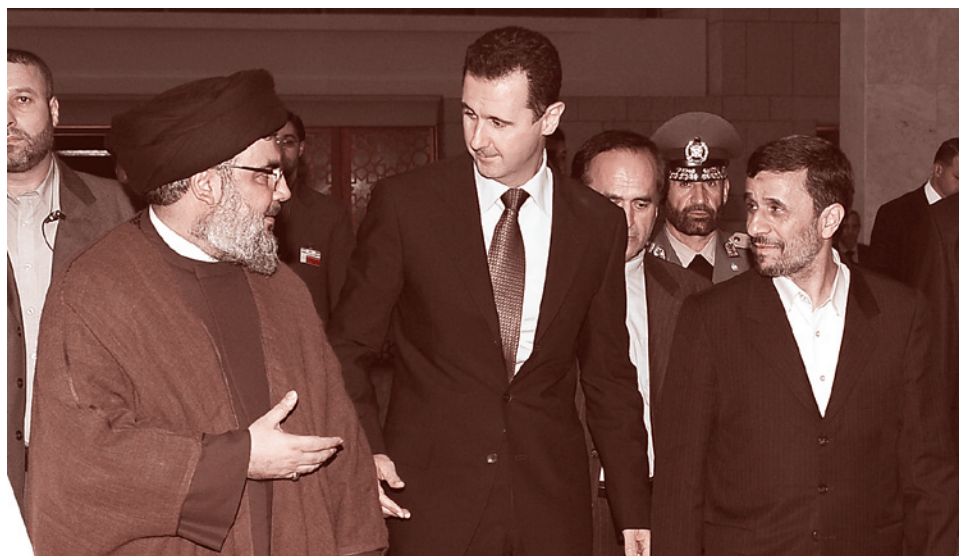
Хасан Насралла, Башар Асад и Махмуд Ахмадинежад

В этой обстановке в восточной части Йемена была проведена армейская операция против боевиков «Аль-Каиды» с задействованием сухопутных войск и авиации. Причем в результате боевых действий армейские части понесли потери.