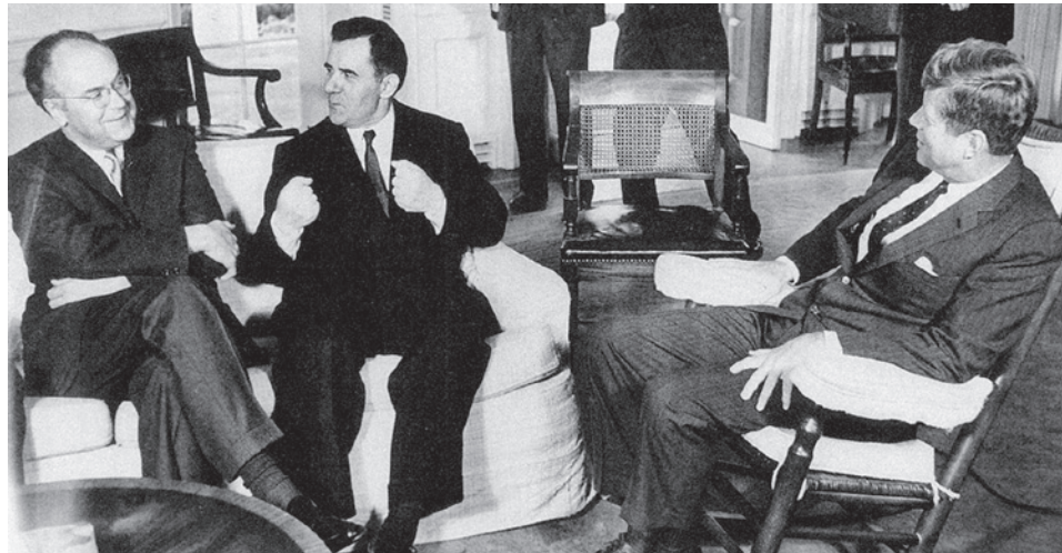
18 октября 1962 г., Белый Дом. Посол СССР в США Анатолий Добрынин (слева), министр иностранных дел СССР Андрей Громыко (в центре), президент США Джон Кеннеди (справа)

Тогда же президент США Д. Эйзенхауэр поставил перед ЦРУ задачу свержения нового кубинского режима. ЦРУ развернуло масштабные диверсионные и подрывные действия. На Фиделя Кастро было совершено несколько неудачных покушений. Шла подготовка вторжения на Кубу десанта из состава кубинских иммигрантов, вооруженных на деньги ЦРУ. 15 апреля 1961 года самолеты ВВС США подвергли бомбардировке Гавану, Сан-Антонио-де-лос-Баньос и Сантьяго-де-Куба, а 17 апреля в районе Плайя Хирон был высажен десант. И хотя он через 72 часа был уничтожен революционной армией Кубы, стало ясно, что интервенция со стороны США неизбежна.