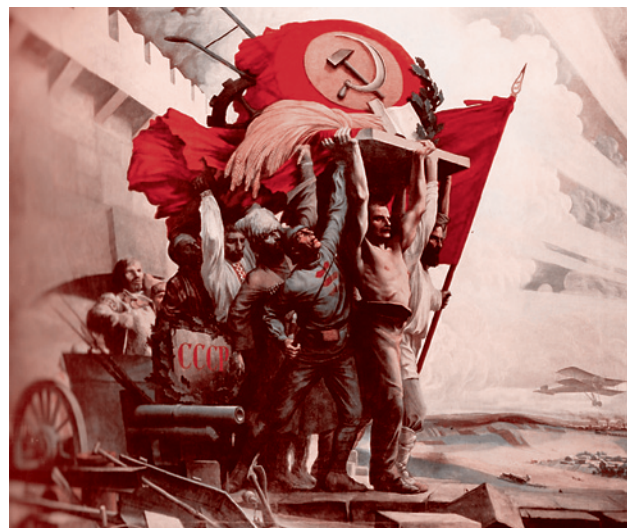
Карпов С.М. «СССР - оплот дружбы народов»