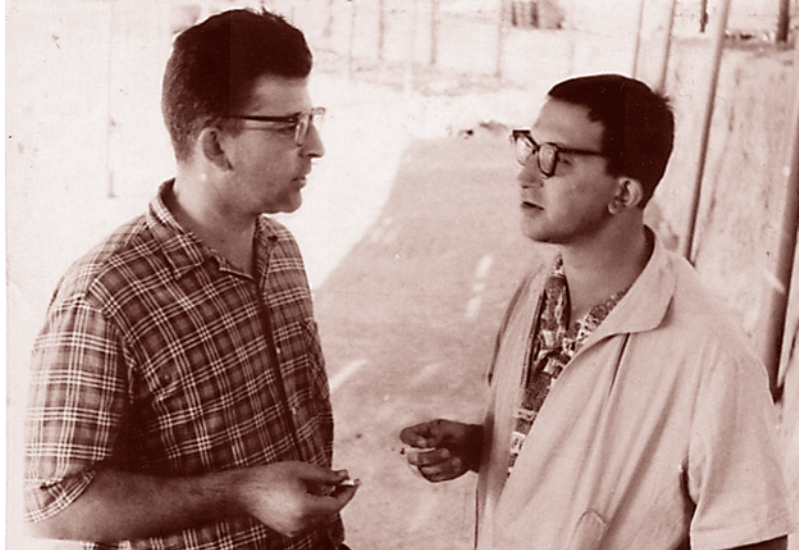
Молодые Аркадий и Борис Стругацкие

«Шестидесятническая» культура, к которой, безусловно, принадлежат братья Стругацкие, возникла «не абы как», а в климате только что прошедшего XX Съезда и порожденных им шока и идейной растерянности. Крайне идеалистическая советская молодежь той поры ждала теперь разрешения всех предельных чаяний через науку и свое участие в ней, политика же и идеология были серьезно скомпрометированы. Хотя коммунистический идеал по-прежнему согревал молодые души. Да и спрос на научную фантастику у молодого технократического поколения 60-х был закономерно высок. Еще бы! Полеты в космос, успехи науки, устремленность в коммунистическое завтра... Спрос этот не был удовлетворен по-настоящему до появления братьев Стругацких.