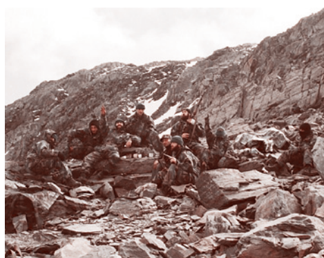
Боевики «Имарата Кавказ» в горах

В докладе РУМО также представлены планы «Аль-Каиды» в отношении Северного Кавказа и России: «Радикальные исламские режимы должны быть установлены и поддерживаться везде, ...включая Чечню, Дагестан, весь Северный Кавказ «от моря до моря», республики Центральной Азии, Татарстан, Башкортостан, всю Россию... Добровольцы из «благотворительных обществ» бен Ладена