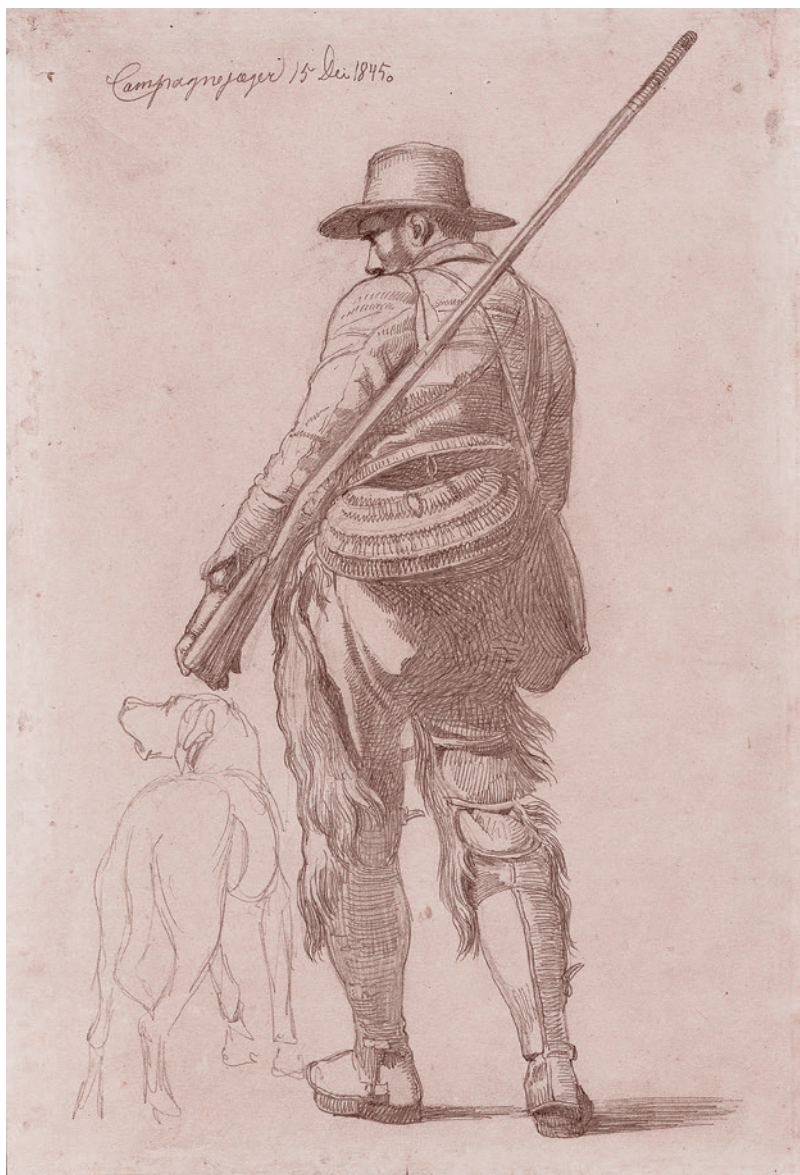
Иоанн Лундбю. Охотник с собакой. 1845