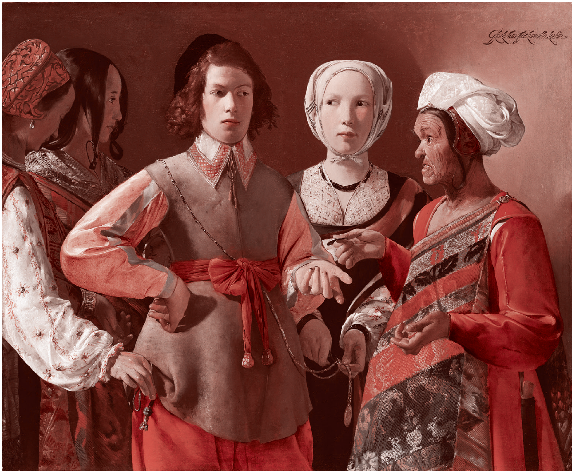
Жорж Дюмениль де Латур. Гадалка. Вероятно 1630-е

В октябре 2018 года россияне, большая часть которых пребывала к тому моменту в растерянности и злобе от неуклонной решимости властей ограбить их с особым цинизмом, а именно лишить пяти пенсионных лет, получили «уникальную» возможность заняться важным государственным делом. Им предложили придумывать и выбирать имена аэропортам! Оказывается, 47 аэропортов просто «кушать не могли», так хотели избавиться от своих скучных имен, данных некогда «по каким-то там деревням!» Оказывается, есть мировой тренд — давать аэропортам звучные имена прославленных соотечественников, и России стыдно быть не в тренде. Стыдно оставаться лапотниками деревенскими и держаться за свои Домодедовы, Кольцовы, Колпашевы и прочая. И даже за Пулково стыдно, даром, что имя напрямую отсылает к знаменитой обсерватории, действующей аж с 1838 года, а так-