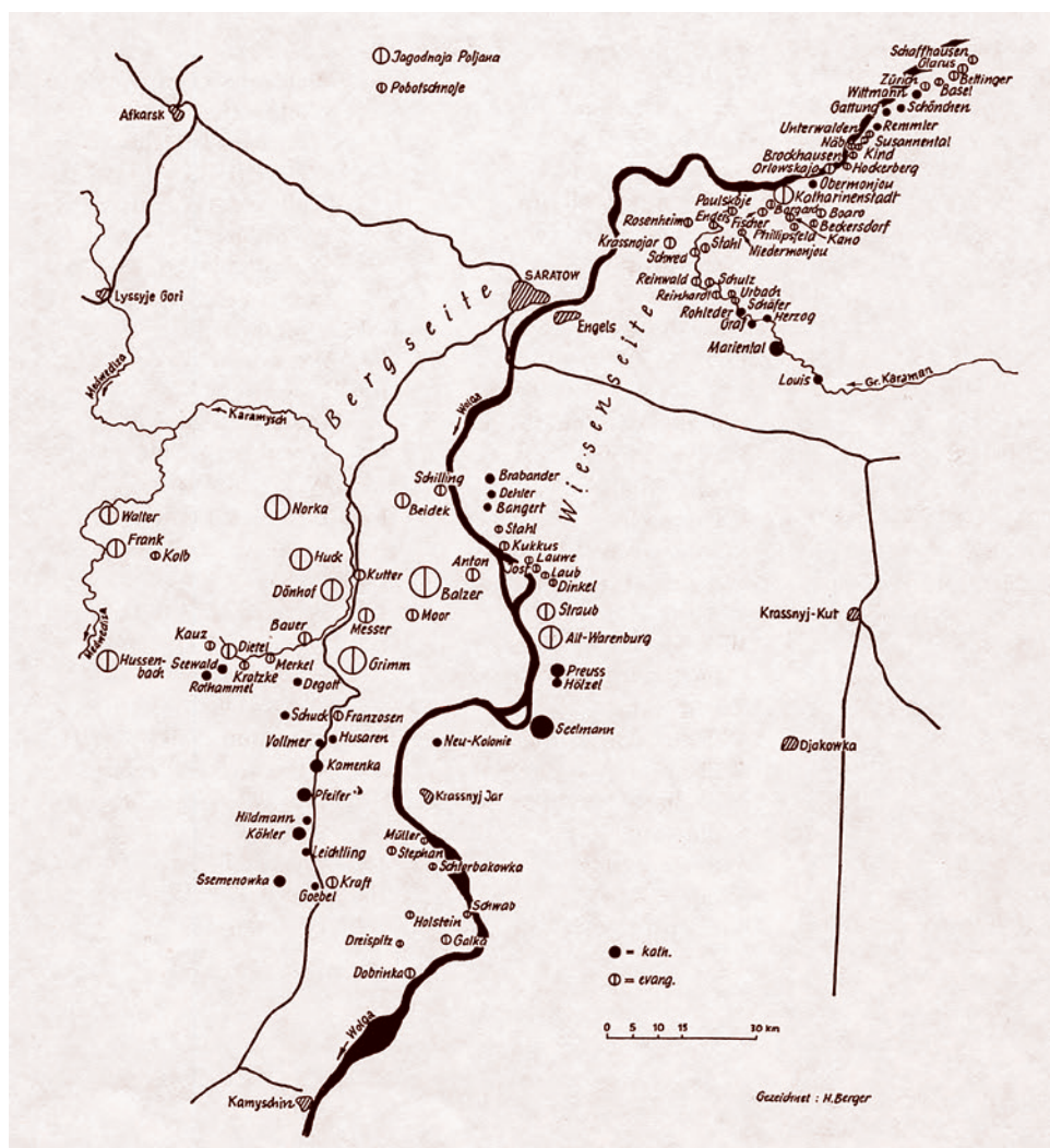
Карта немецких колоний на Волге

вый оборот между российским регионом и этой страной вырос (несмотря на западные санкции) на 66% и составил порядка 470 млн долларов.