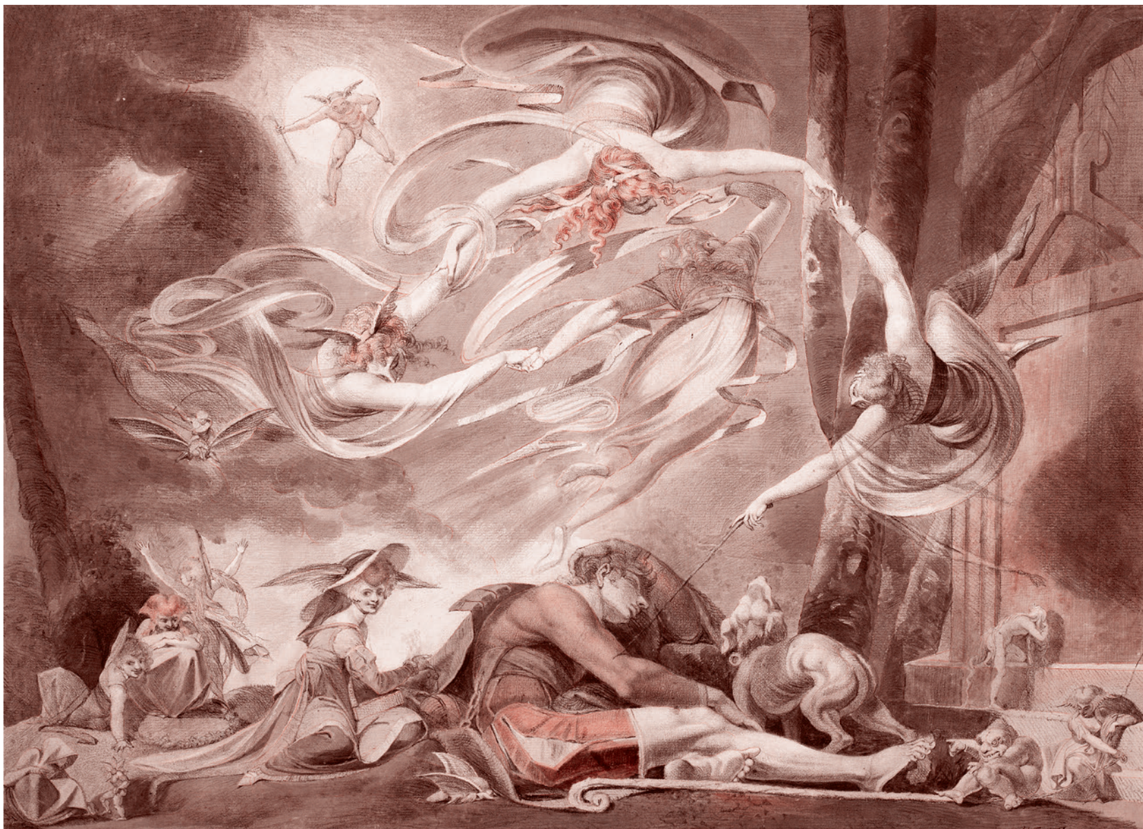
Иоганн Генрих Фюссли. Сон пастуха. 1786

В Северном Средиземноморье: в Греции, Италии, на юге Франции, на средиземноморском побережье Испании и т.д. — природа носит совершенно другой характер, нежели в свирепых джунглях Индостана. Да и в целом средиземноморская ойкумена настраивает на гораздо более примирительное отношение к природе. Из нее не хочется вырваться, причем с предельным усилием и с ориентацией на ее максимальное отбрасывание. Напротив, в ней хочется раствориться, в нее хочется погрузиться, с ней хочется построить максимально близкие отношения.