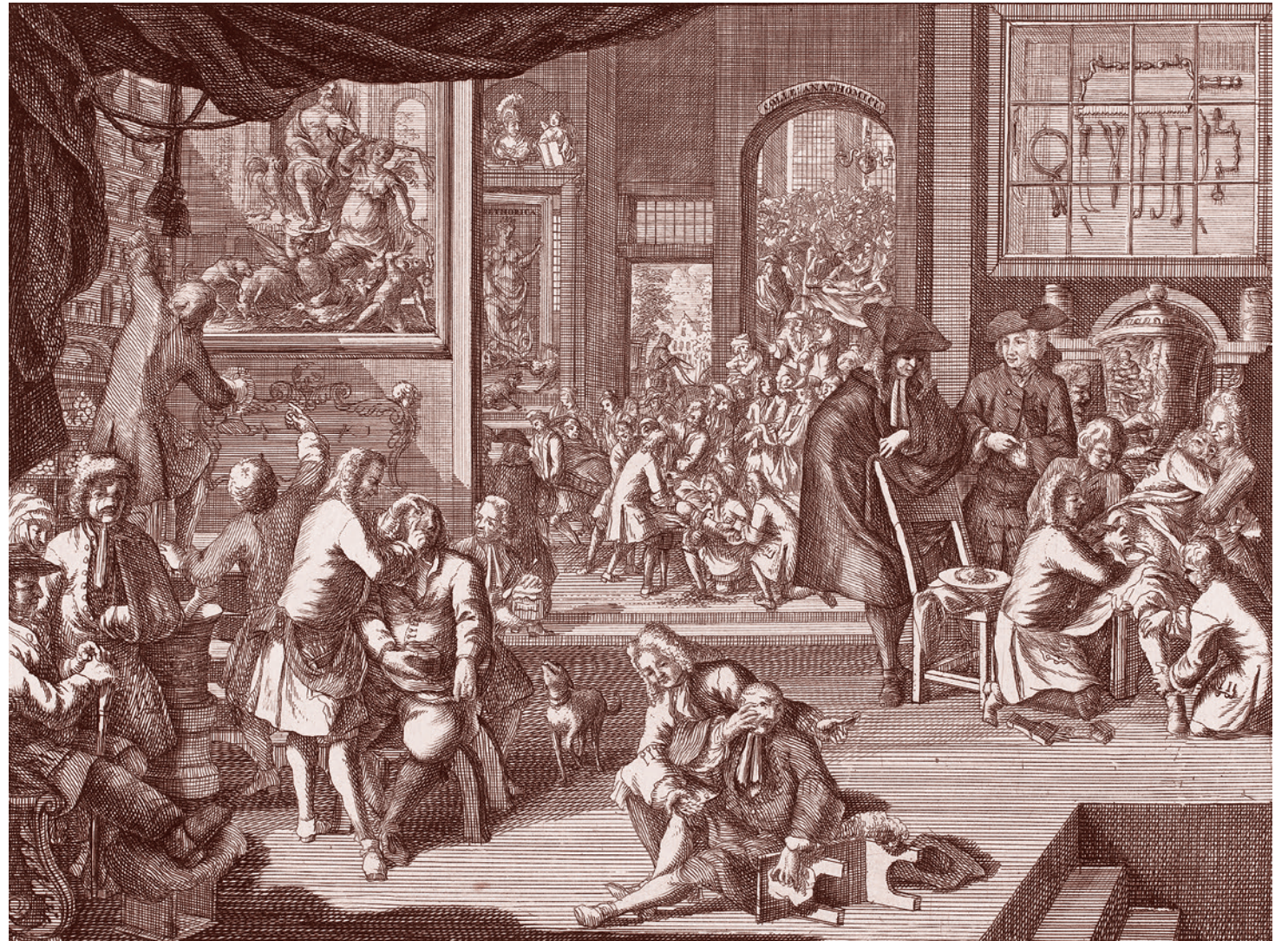
Абраам Зеeman. Рабочее место гильдии хирургов. 1731

«У нас дефицит врачей в стране приблизительно 22,5 тыс. человек. Это означает, что в отдельных регионах и в отдельных местах не хватает, на-