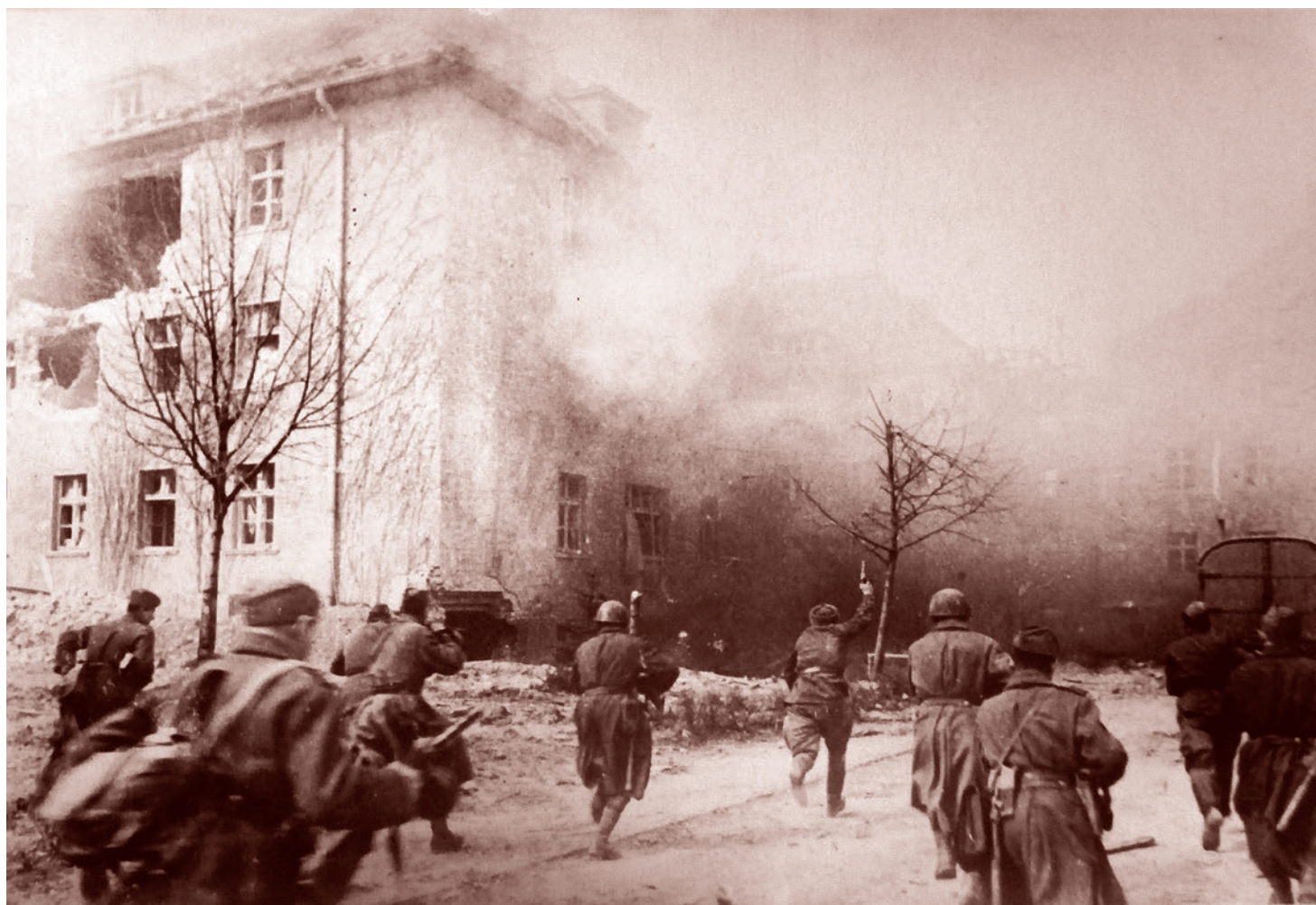
Советское подразделение в уличном бою в Кенигсберге. Апрель 1945

Подчеркнем, что на протяжении всего постсоветского периода Германия является главным зарубежным партнером Калининградской области в таких сферах, как экономика, образование, культура. И данное сотрудничество продолжает стремительно развиваться. Например, с июля 2017-го по июнь 2018-го внешнеторго-