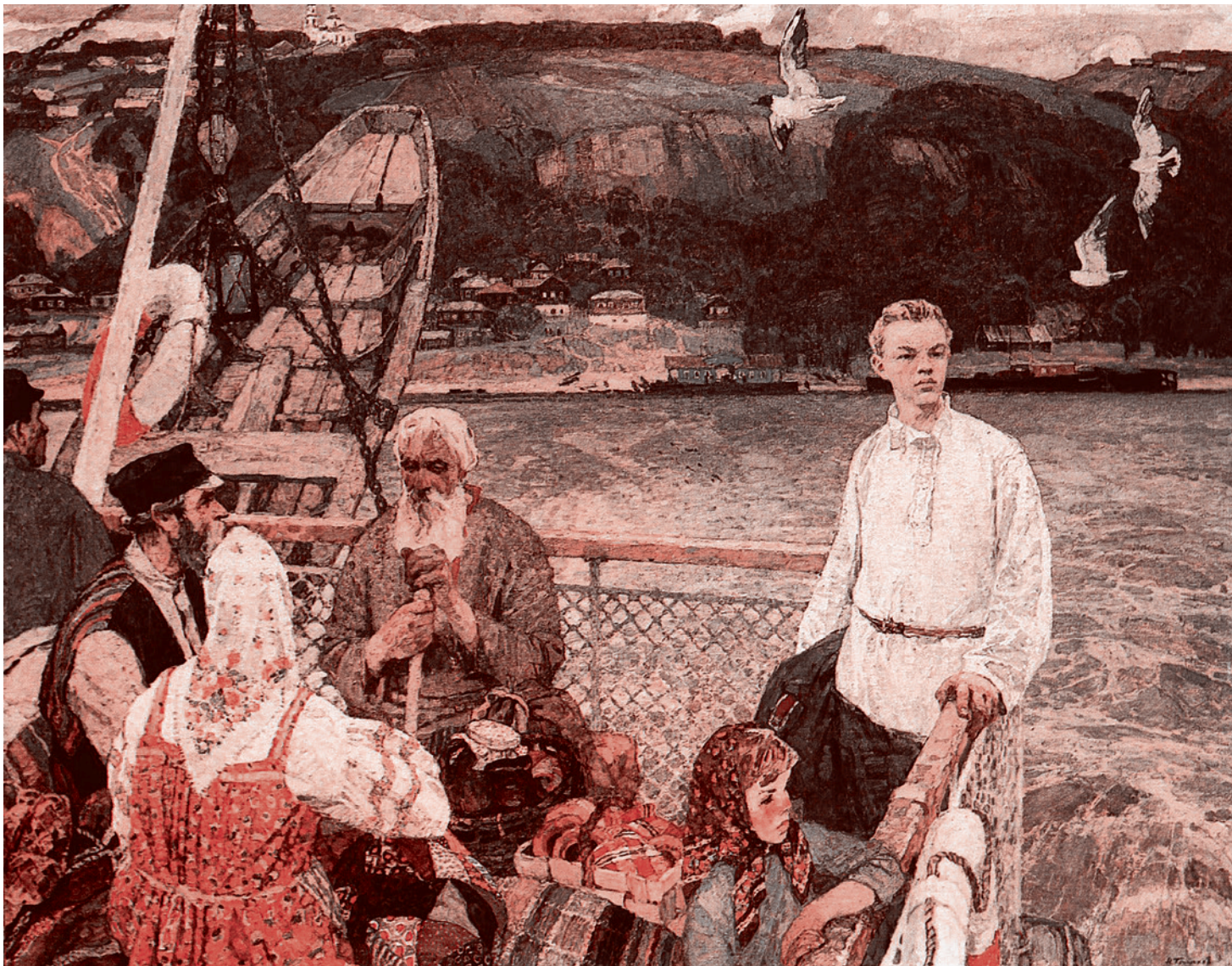
Николай Галахов. Ленин-студент на Волге. 1970