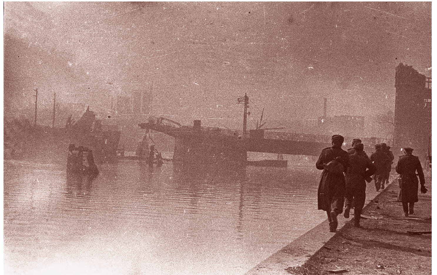
Михаил Савин. Советские солдаты идут по набережной разрушенного в боях Кенигсберга. Апрель 1945

Газета «Суть времени» зарегистрирована Федеральной службой по надзору в сфере связи, информационных технологий и массовых коммуникаций (Роскомнадзор) Свидетельство ПИ № ФС77-50554 от 9 июля 2012 года