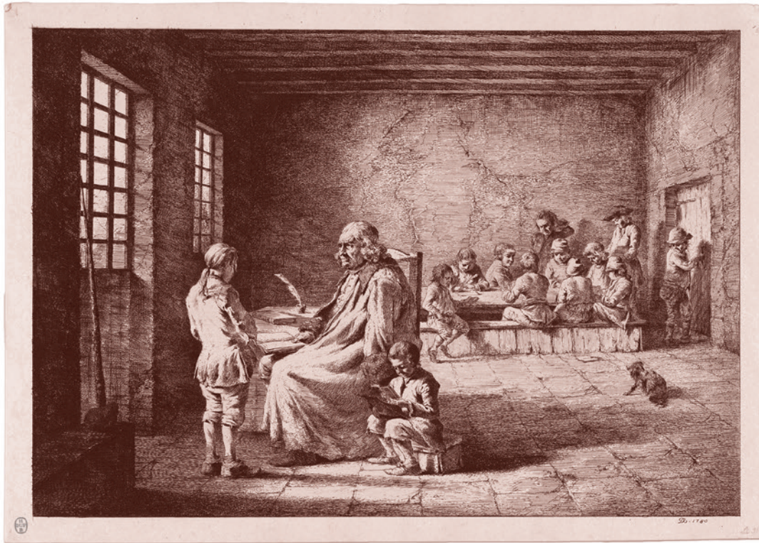
Жан-Жак де Буассье. Школьный учитель. 1780

Но, по большому счету, в понятие «хороший учитель» входит не только способность дать набор знаний и умений, но и способность учителя помочь формированию личности ребенка, умение дать