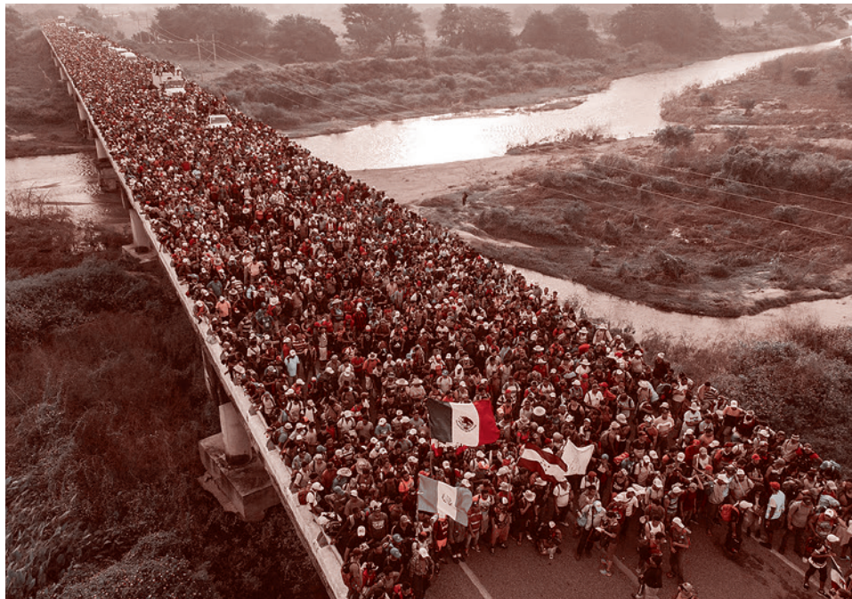
«Караван мигрантов» на юге Мексики. Октябрь 2018 г.

конодательство США: «Караваны являются позором Демократической партии. Измените иммиграционное законодательство сейчас же». А далее вновь высказал угрозы странам, которые не остановили «караван»: «Гватемала, Гондурас и Сальвадор не справились с работой по остановке потока людей, покидающих свои страны и нелегально прибывающих в США. С этого момента мы начнем прекращать или существенно сократить объем той большой помощи, которую мы им давали регулярно».