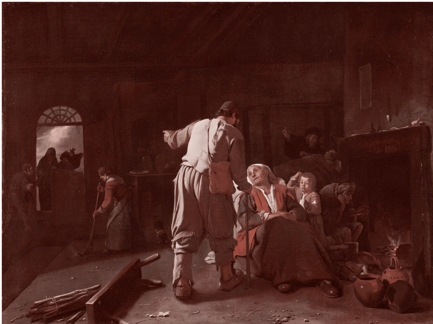
Михаэль Свертс. Посещение больного. Ок. 1646–1649

В этих странах расходы на душу населения ниже, чем в России, а продолжительность жизни — выше. Указанные факты позволяют предполагать, что в действующей российской модели здравоохранения есть не использованные резервы для повышения ее эффективности, а существующее положение дел увеличивает риски, связанные со здоровьем населения России.