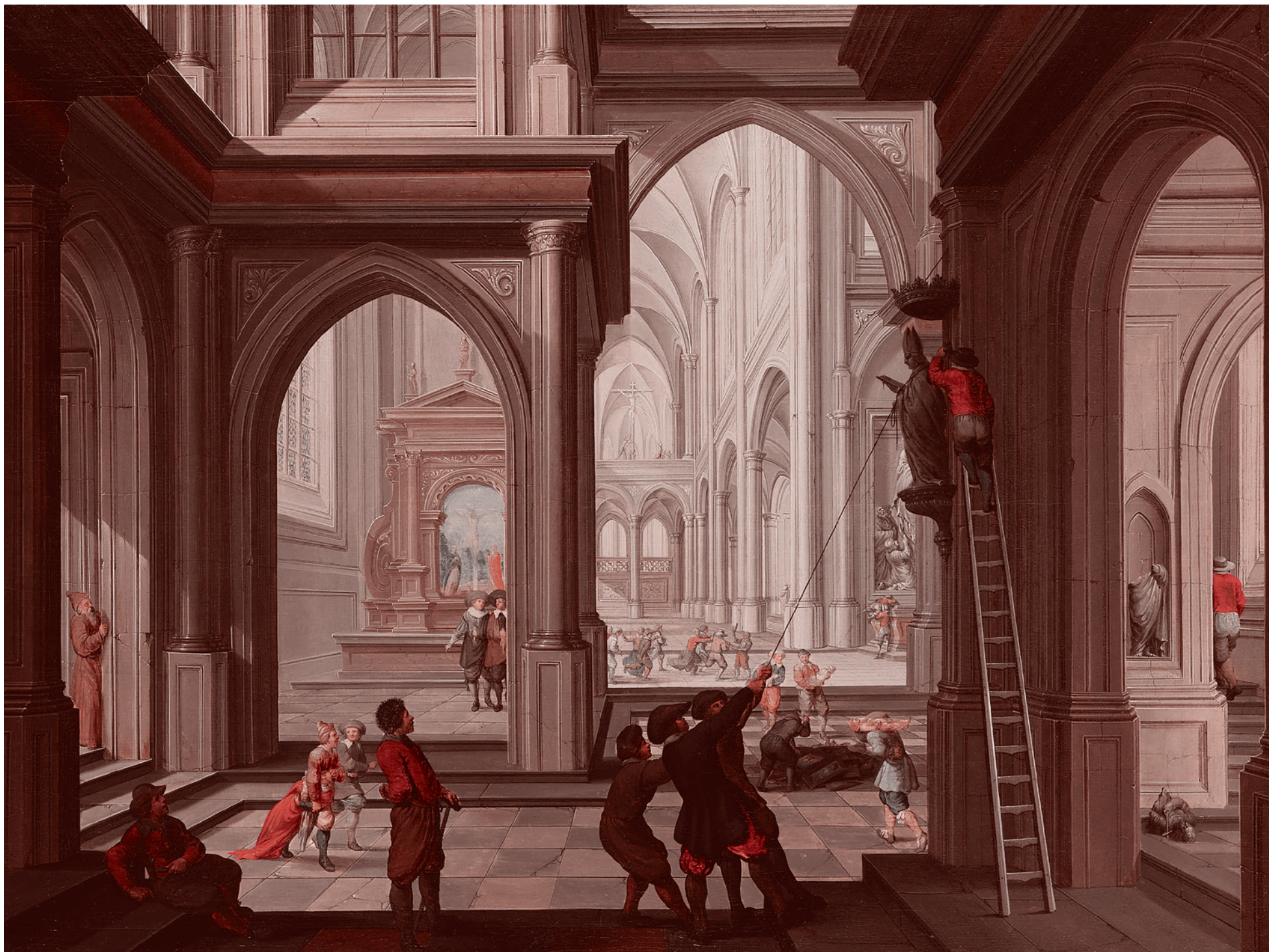
Дирк Ван Делен. Иконоборцы в церкви. 1630

Осуществляя гонение по отношению к создателям и почитателям икон, иконоборцы — причем, вполне себе православно-византийские — ссылались на ветхозаветные заповеди, на книгу Исход, в которой сказано: «Не делай себе кумира и никакого изображения того, что на небе вверху, и что на земле внизу, и что в воде ниже земли».