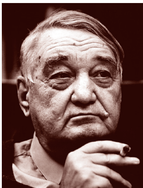
Лев Николаевич Гумилёв

Таким образом, подрыв советской истории подготовил благодатную почву для выхода на сцену одного за другим «гуру» псевдонауки, или «альтернативной истории».