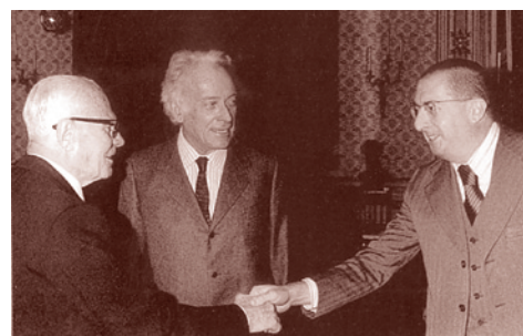
Витторио Страда, президент Итальянской Республики Сандро Пертини и издатель Джулио Эйнауди. Рим, Квиринальский дворец, 1981