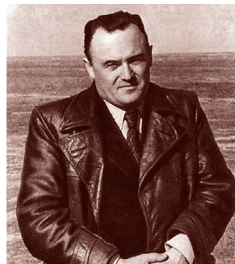
Сергей Павлович Королёв

Пока шла работа и над ядерной бомбой, и над ракетой как ее возможным носителем, было необходимо модернизировать имеющиеся средства доставки. А это были межконтинентальные бомбардировщики. В 1951 году была начата работа над новыми самолетами ЗМ и Ту-95, и они до начала 60-х годов оставались у СССР единственными стра-