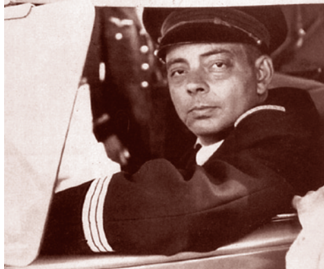
Антуан де Сент-Экзюпери

Незримый путь, начертанный силою тягести, освобождает камень. Незримые силы любви освобождают человека. Моя духовная культура стремилась сделать из каждого человека Посланца одного и того же владыки. Она рассматривала личность как путь или проявление воли того, кто выше ее; она