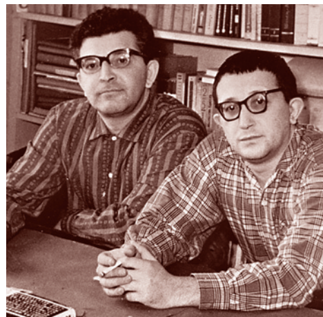
Аркадий и Борис Стругацкие

Стругацкими зачитывались с начала 60-х, они быстро оказались кумирами именно технической интеллигенции, ее культовыми авторами, на них выросло поколение активных участников перестройки. Для определенной группы авторитет братьев Стругацких был почти непререкаем, а главное, сформировалось поколение технической интеллигенции, довольно слабо образованной гуманитарно, но жадной до мысли, и оно впитывало эти интеллектуальные меседжи, как губка. Восприятие на веру, без должной критики, без возможности поставить «откровения», скажем, в серьезный философский контекст делало пылкий ум легкой добычей. Не буду утверждать, что это была спланированная ловушка для умов. Скорее сами авторы были объектом, а не субъектом манипуляции, ее приводным ремнем.