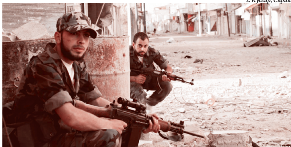
з. Кусейр, Сирия