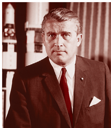
Вернер фон Браун

Группа сотрудников ракетного центра в Пенемюнде во главе с Вернером фон Брауном весной 1945 года сознательно сдалась американским войскам. При этом она вывезла в американскую зону наиболее ценные архивные материалы, среди которых была не только документация на боевую ракету А-4, но материалы по перспективным ракетам, включая ракеты межконтинентального класса А-9 и А-10.