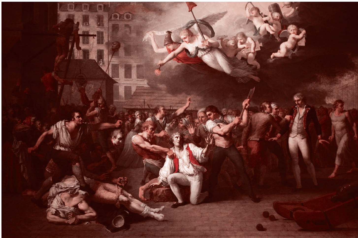
Шарль Поль Ландон. Народная месть после взятия Бастилии. 1793

Пока, повторяю в третий раз, это сделало только движение «Суть времени». Только мы это осуществили на практике и довели до конца.