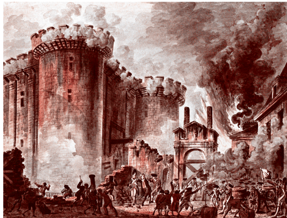
Жан-Пьер Уэль. Взятие Бастилии. 1789

25 сентября 2018 года движение «Суть времени» сдало в Администрацию Президента более миллиона подписей под обращением к Президенту РФ. В этом обращении не просто говорится о недопустимости людоедской пенсионной реформы, в нем выдвинута развернутая программа преодоления того, что, по сути, является социально-политическим и экзистенциальным кризисом, порожденным пенсионной реформой.