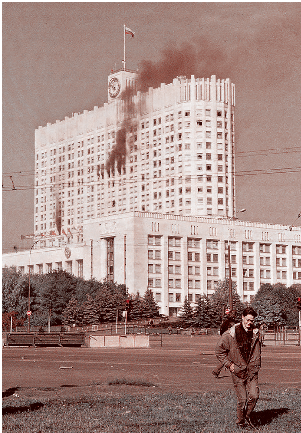
Горящий Дом Советов, 4 октября 1993 г.

Выходит, 3 октября в России — роковая дата. Теперь уже — дважды роковая. Двадцать пять лет назад в этот день ельцинская власть расстреляла народ, вставший на защиту прежней конституции и законно избранного им парламента.