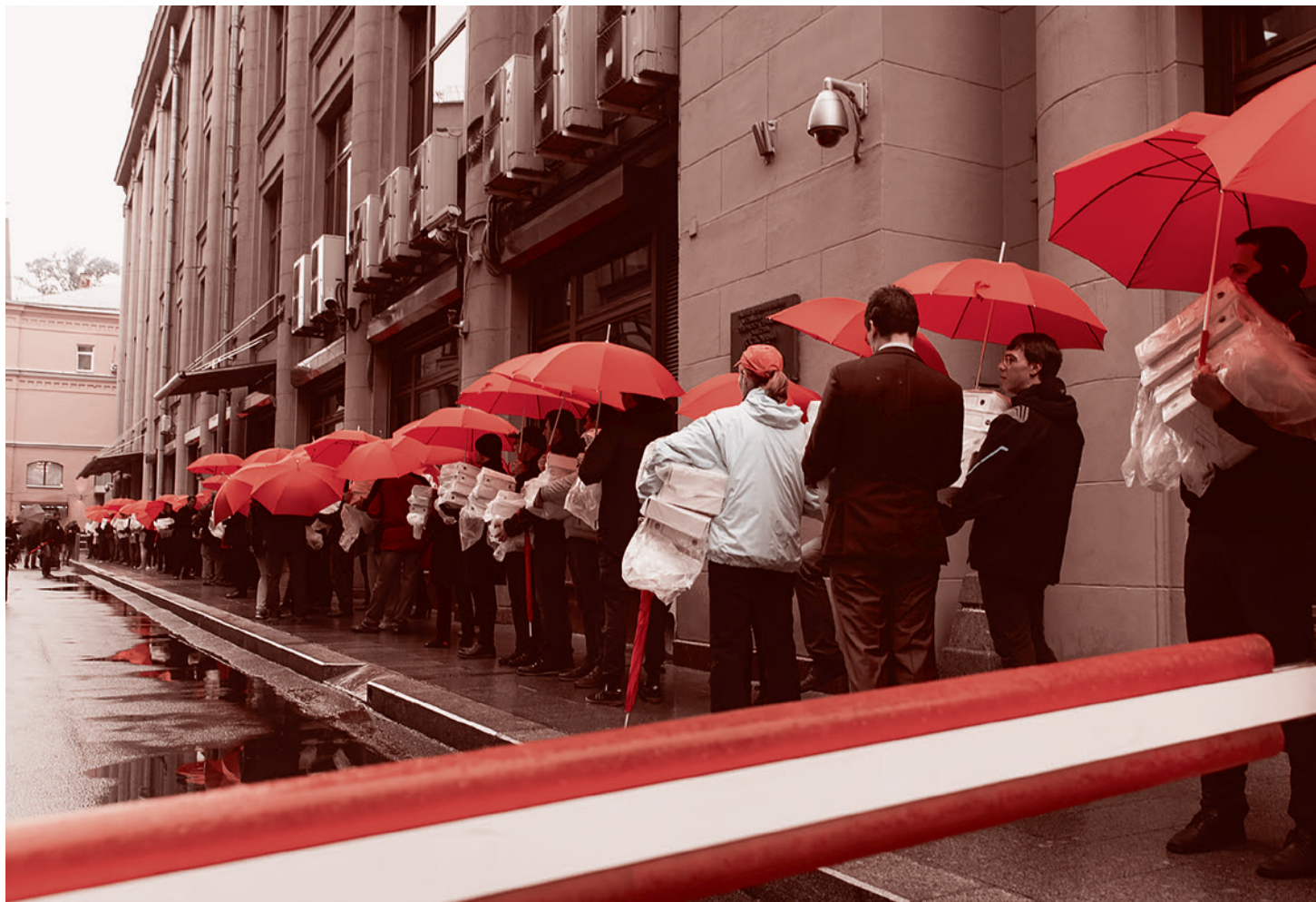
Передача более миллиона подписей против пенсионной реформы в Администрацию президента 25 сентября 2018 г.

в 50–57 лет. Для пенсионеров сохраняются налоговые льготы на землю и недвижимость.