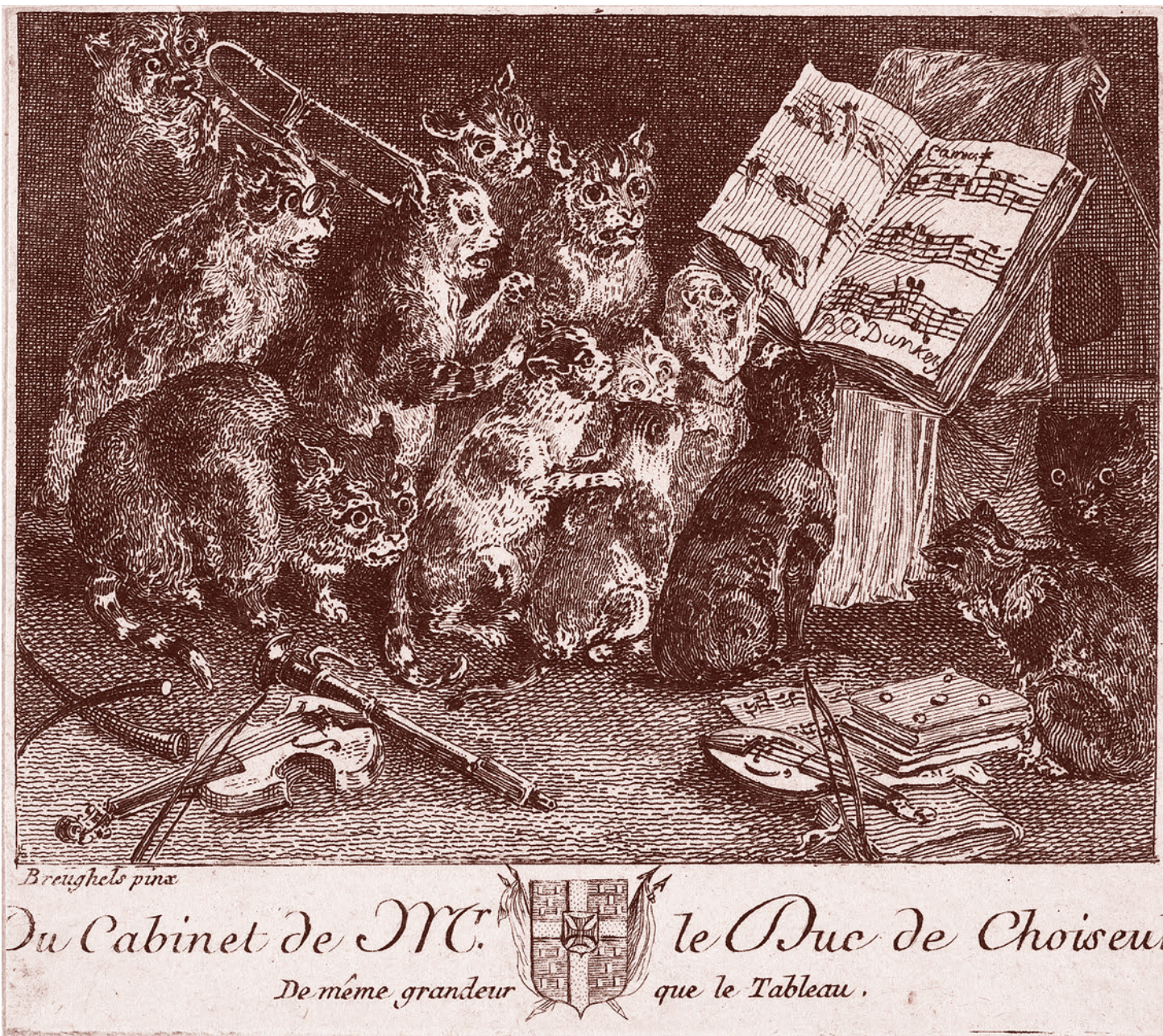
Бальтазар Антон Дюнкер, после Яна Брейгеля Старший, после Кристина ван де Пассе Старшего. Кошачий концерт

на этой Ассамблее. Я начинаю диалог прямо здесь», — заявил иранский президент.