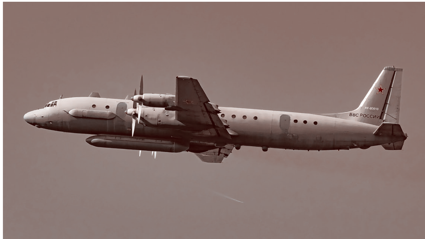
Ил-20. 2015

Израилю, несомненно, на руку ослабление враждебной ему Сирии. Поэтому Израиль в сирийском конфликте поддерживает антивластные силы — так называемых умеренных боевиков и даже боевиков ИГИЛ