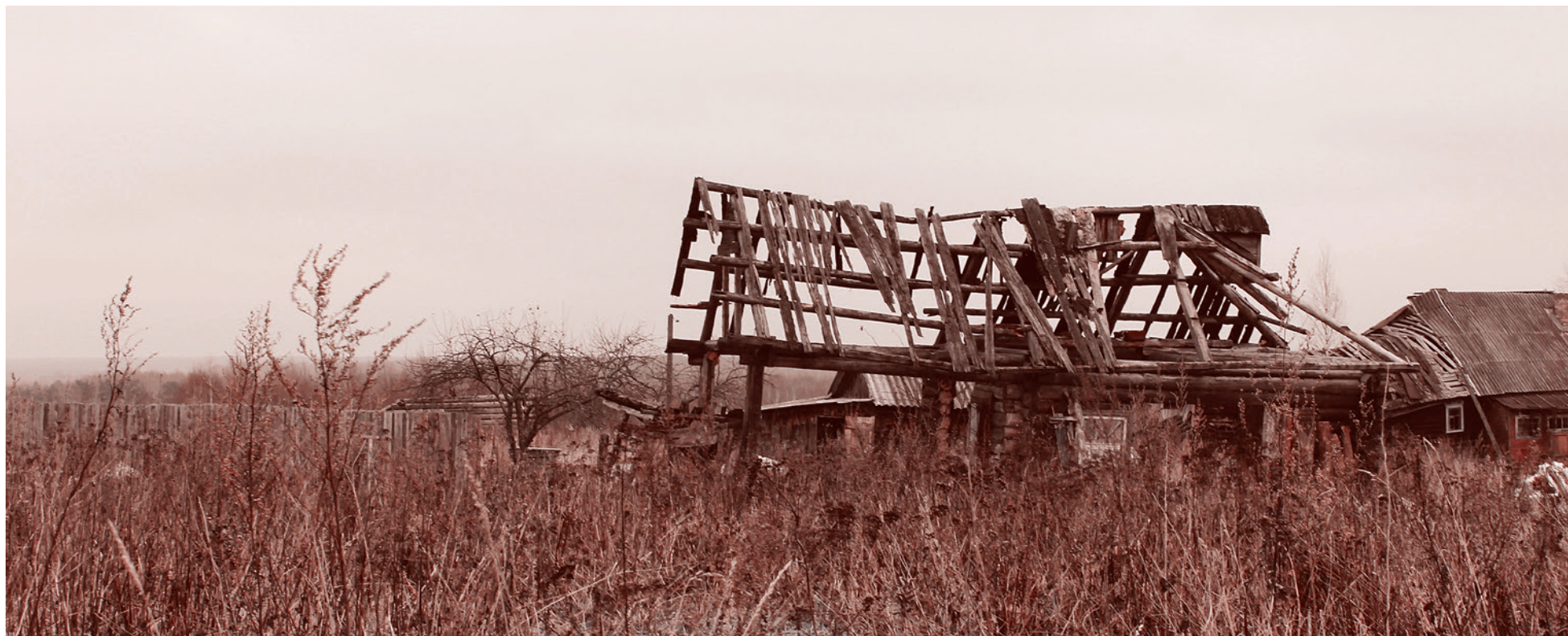
В Костромской области, 2018 г.

Через год. Впервые не засеяны поля. То есть они как бы засеяны овсом, но выросли васильки. Местные начальники: директор фабрики, главный инженер, главный электрик — стали «фермерами», взяв бывшие колхозные поля в пользование. И — результат налицо. Сосед, инвалид войны, всю жизнь проработавший трактористом, смотрит на эти поля молча, из единственного глаза стекает слеза. Потом двухдневная эйфория в августе: «Ну наконец-то порядок наведут! Сил уже терпеть нет!» — и... И всё.