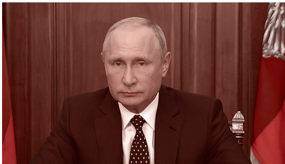
Президент обращается к гражданам России, 29 августа 2018 г.

Регулярно и подолгу бывая в российской глубинке, я видела, как это происходило. Помню самое начало. 1990 год, прошли первые демократические выборы. Деревенская соседка — пенсионерка тетя Катя смотрит телевизор, где распинаяется о фермерстве пухлощекий представитель новой политической генерации — молодой министр финансов. Мудрая тетя Катя горестно комментирует, сильно окая: «Фермеры... это кто ж на ком пахать-то будет, андел мой, ты на мне али я на тебе? Это кого ж мы навывирали! Одна романтика!» Рядом с ее домом — развалюха (забора нет как класса), там живут старая бабушка и ее внук, пацан лет пятнадцати. Внук растянул между двумя столбами веревку, повесил на нее картонку: «Частное владение». Гордая картонка положится по ветру, тоже знаменующая новую эпоху.