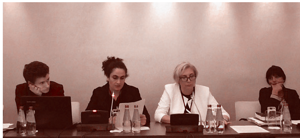
Представители РВС в ОБСЕ. Сентябрь 2018 г.

Ощущение, что мы находимся в какой-то недоброй сказке с плохим концом, усилилось, когда слово взяла представительница некой правозащитной ЛГБТ-организации и стала рассказывать о том, как в мире жестоко нарушаются права наркоманов, как их лишают права выбора той жизни, которая им нравится, и дискриминируют своим отношением к наркомании