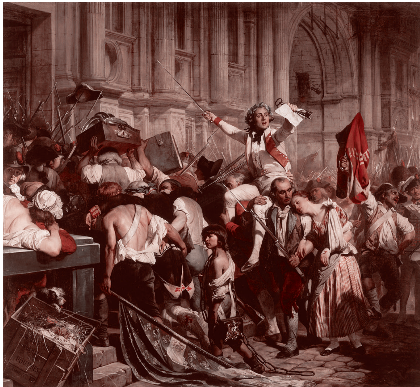
Поль Деларош. Победители Бастилии перед Ратушей. 14 июля 1789 года. 1830