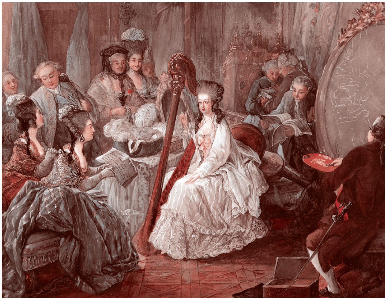
Жан-Батист-Андре Готье-Даготи. Мария-Антуанетта дает концерт на арфе. 1775

И напротив, конвульсия обезумевшей антидемократической системы является темным прологом к светлому коммунистическому протесту.