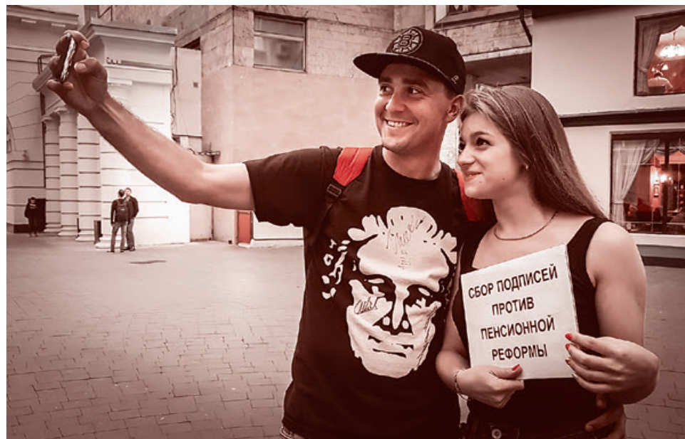
Сбор подписей против пенсионной реформы в Москве. 2 сентября 2018 г.

— Сегодня в самом конце сбора подходим к скамейке, предлагаем поставить подпись. Пожилая женщина: «А я за реформу». Вываю к совести, призываю по-