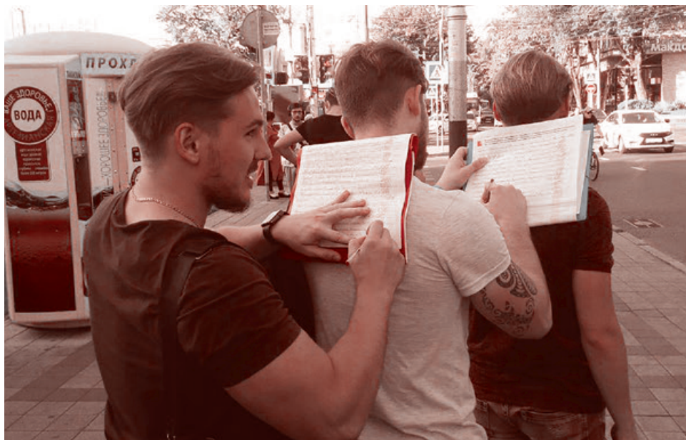
Сбор подписей против пенсионной реформы в Краснодаре. 13 сентября 2018 г.

— Исчезающий вид у нас в провинции подписался — яблочник, который против Навального. Говорит: «Мне ваша организация не нравится». Но на вопрос: «А реформа, значит, нравится?» не смог ответить никак, кроме как подписью.