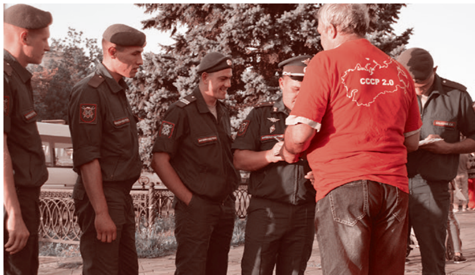
Сбор подписей против пенсионной реформы в Новочеркасске

— Меня вчера бабки «крышевали». Все выходные стояла у перехода, а рядом бабушки торговали. После субботы