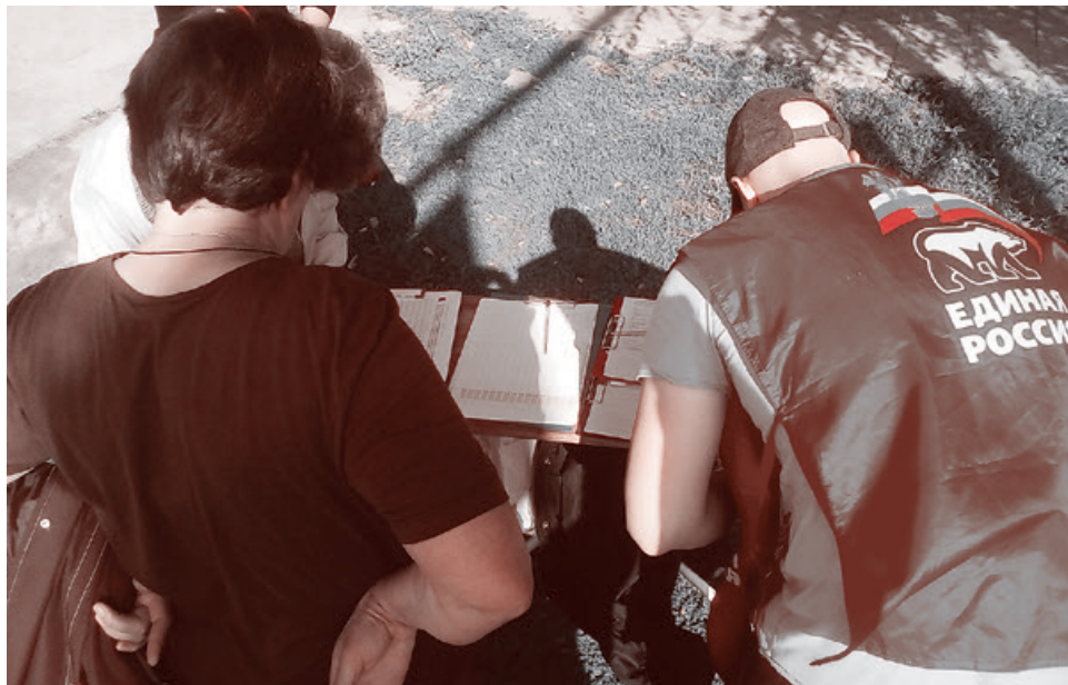
Сбор подписей против пенсионной реформы в Ульяновске. 22 сентября 2018 г.

том, пока за паспортом он к машине бежал, полиция меня расспрашивала, чего мы из Москвы сюда приехали? Это они в корочках прочитали. А тут еще люди подходить стали, активнее ставить подписи. Мужик один с наездом на полицейского стал их агитировать поставить подпись. Они отказались. Попросили нас уйти к остановке через дорогу, а то, говорят, сейчас губернатор приедет, и у него настроение портить, если мы тут стоять будем. Мы ушли. Зачем же губернатору настроение портить, у него и так в городе в этот день два митинга против пенсионной реформы.