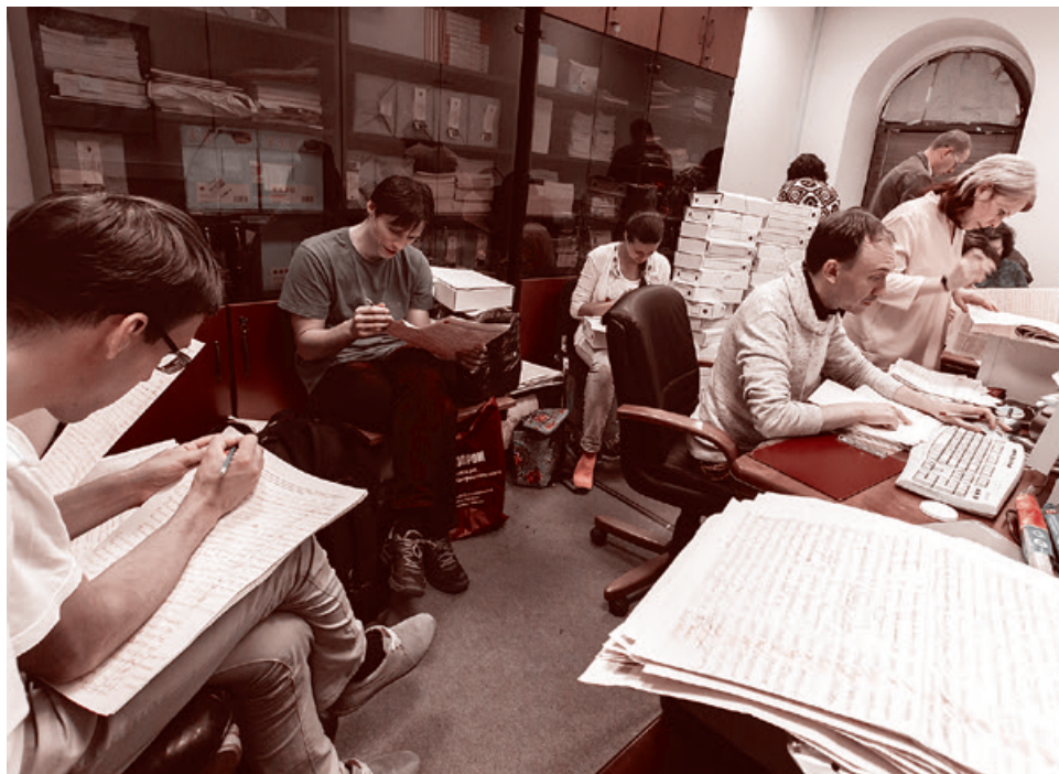
Подсчет и упаковка подписных листов для передачи Президенту

полную законную силу, под Обращением к президенту России, в котором выдвинуто много требований. Не только остановка пенсионной реформы, но и референдум с твердой и окончательной фиксацией всей степени социальности нашего государства и недопустимости подобных маневров в социальной сфере, с наказанием тех, кто это устроил и так далее. Под этим письмом главе государства мы собрали около миллиона живых настоящих подписей.