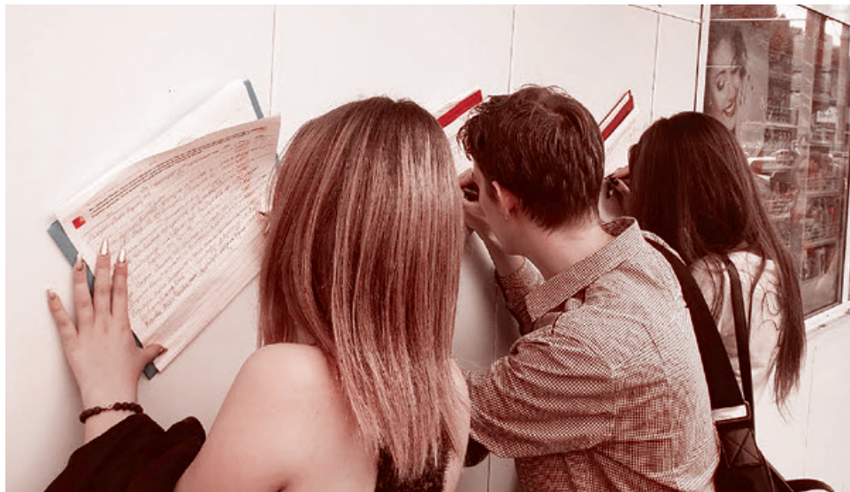
Сбор подписей против пенсионной реформы в Краснодаре. 11 сентября 2018 г.