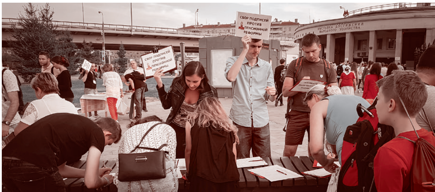
Сбор подписей против пенсионной реформы в Москве. 2 сентября 2018 г.