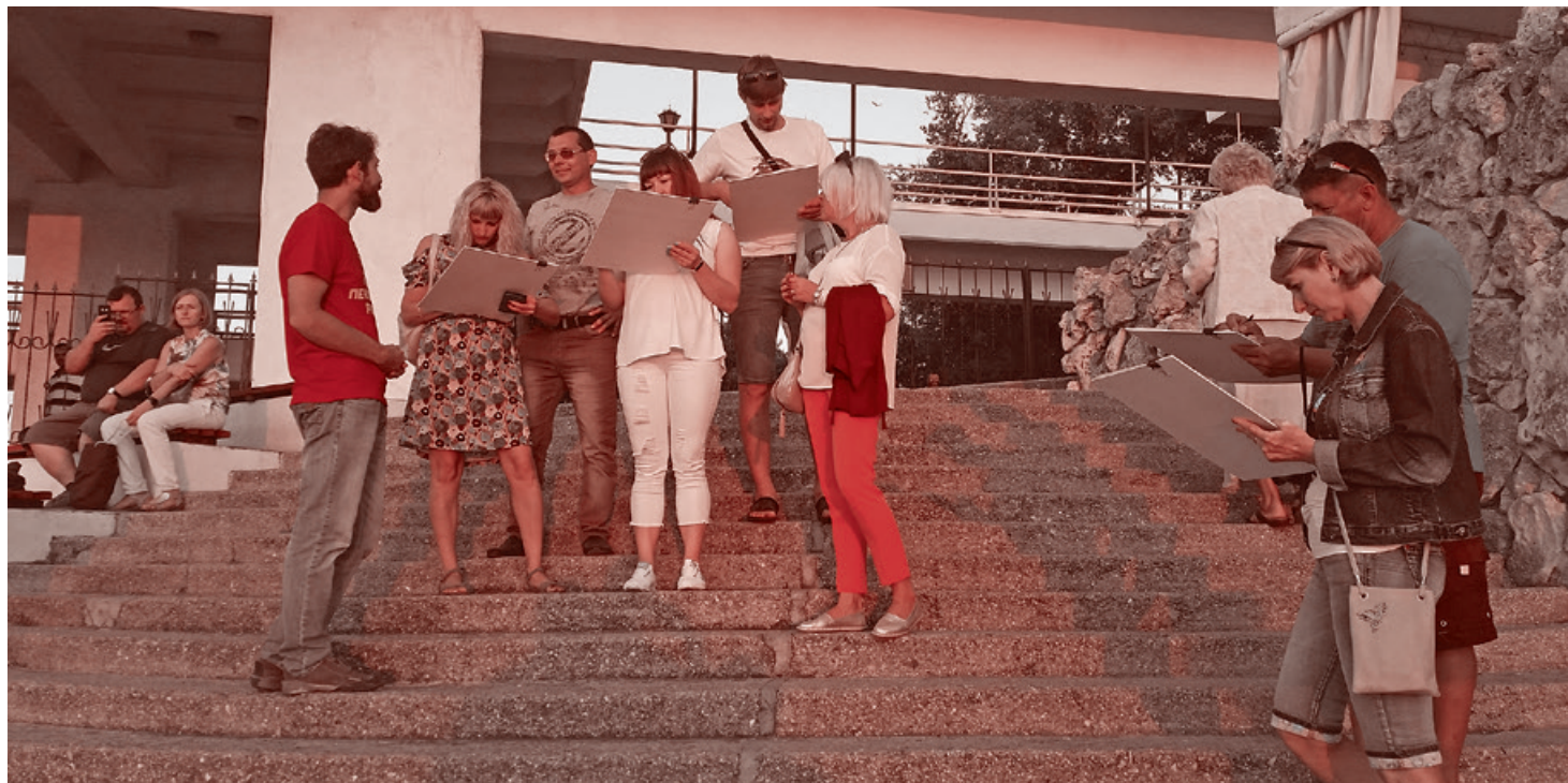
Сбор подписей против пенсионной реформы в Севастополе