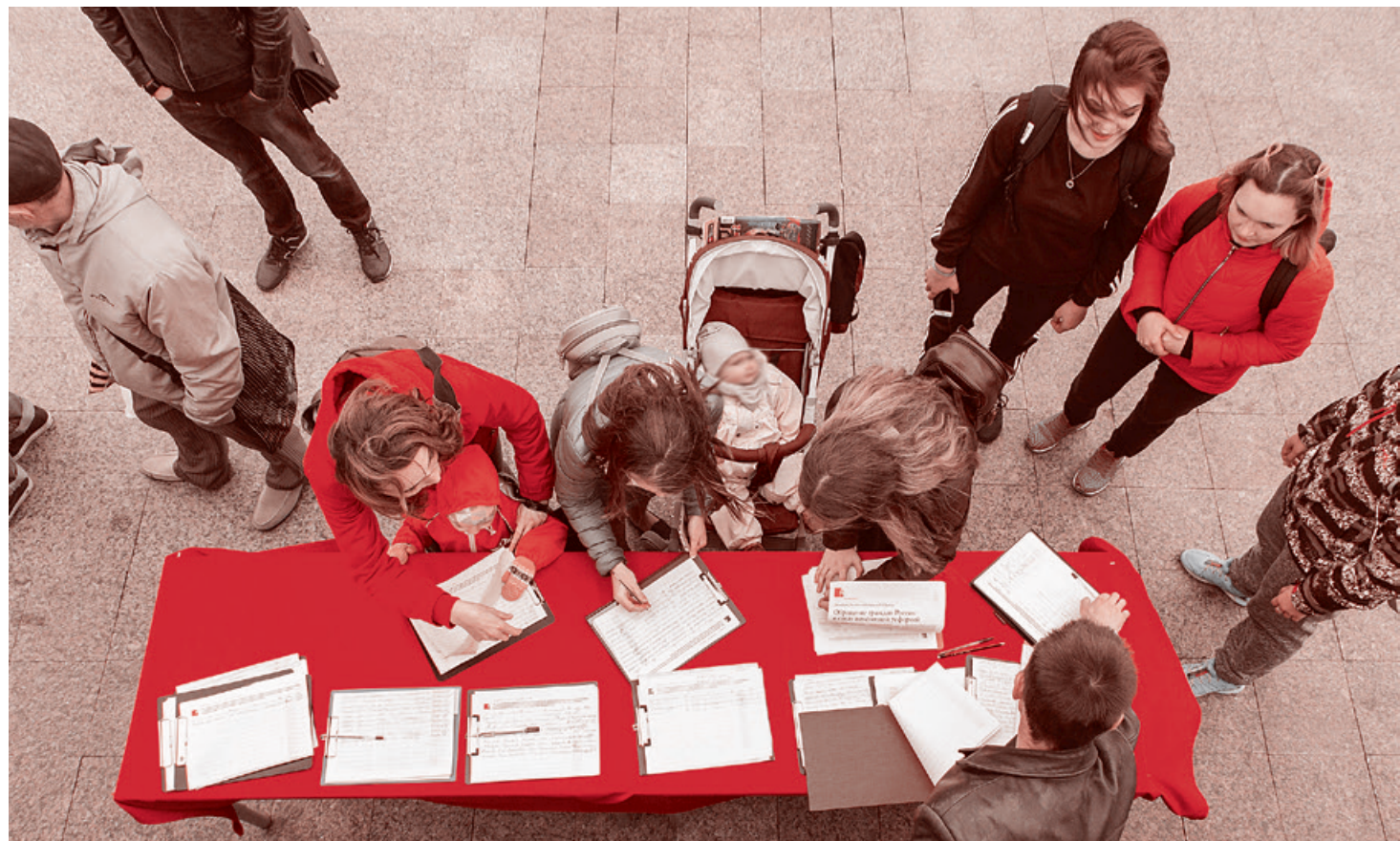
Сбор подписей против пенсионной реформы в Екатеринбурге. 22 сентября 2018 г.

— Это еще ладно, вчера мне интеллигентная дама пенсионного возраста, чуть не дрожа от гнева, говорила, что мы глупцы и приведем Россию к катастрофе. Ни одного аргумента, как именно приведем, не смогла сказать, но что мы враги страны — выдавила из себя.