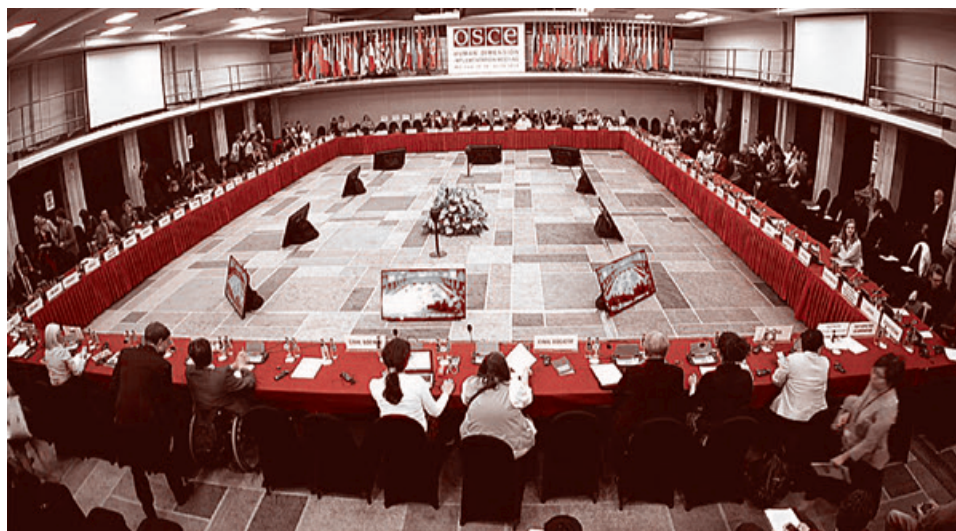
Совещание ОБСЕ по рассмотрению выполнения обязательств, посвященное человеческому измерению. 19 сентября 2018 г.

их деятельность». При этом одной из главных целей является «обеспечение демократического и гражданского контроля» за всеми службами безопасности. Каким же образом и кем будет осуществляться контроль? Об этом мы скажем ниже. Отметим, что о необходимости гражданского контроля за службами безопасности в этом документе сказано множество раз. Похоже, эта цель действительно является приоритетной для международных институтов, продвигающих гендерные подходы.