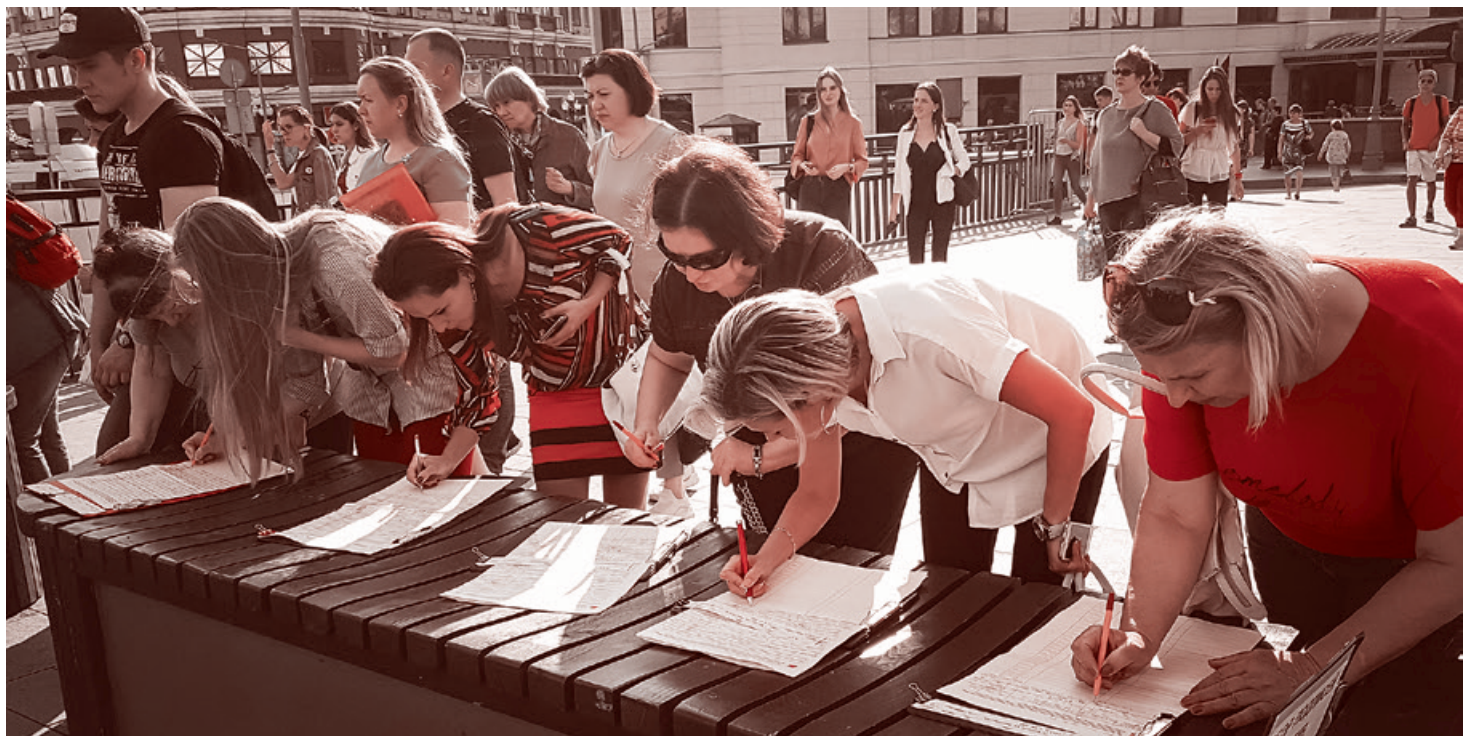
Сбор подписей против пенсионной реформы в Москве. 7 сентября 2018 г.