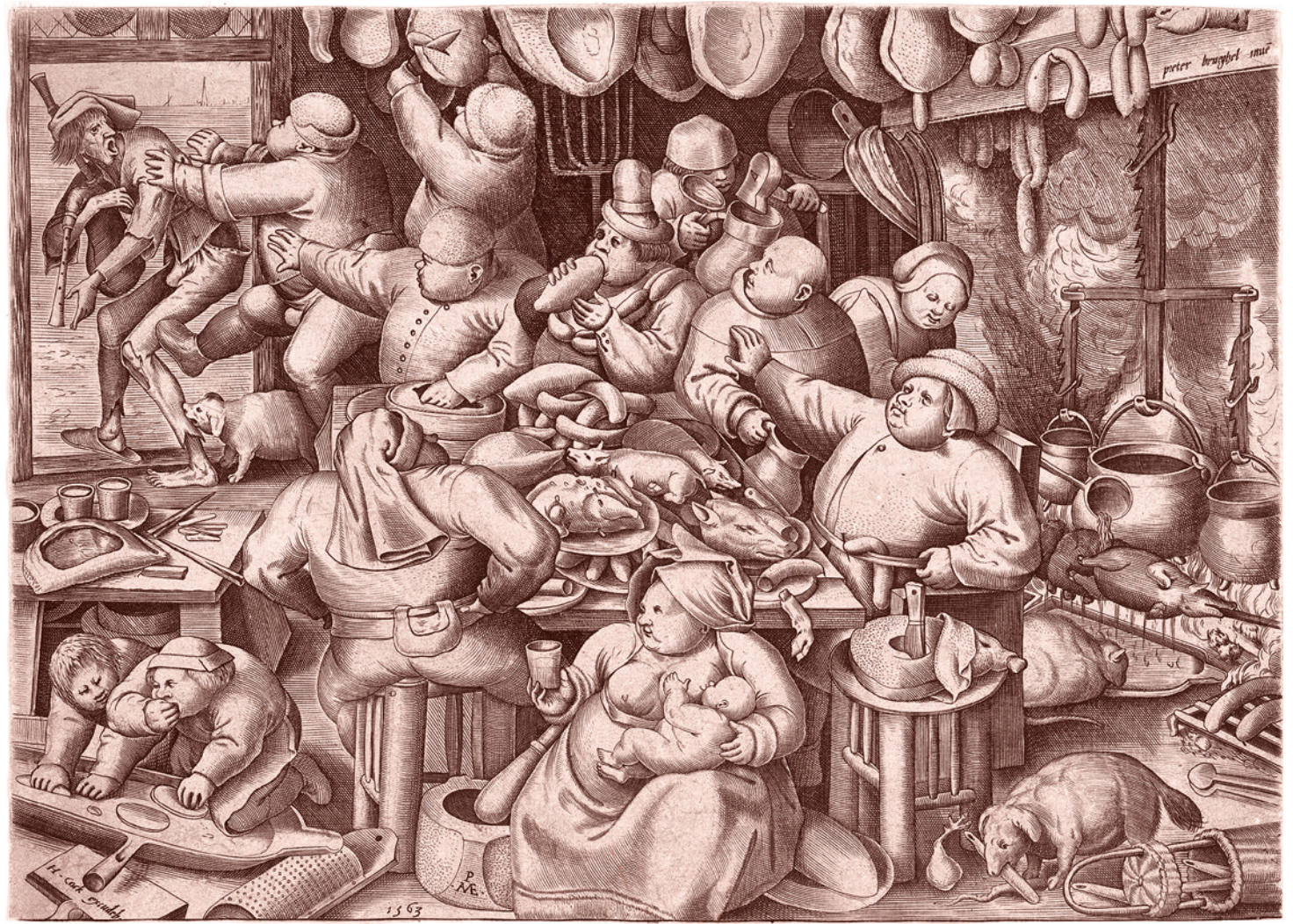
Питер Ван дер Хейден после Питера Брейгеля Старшего. Кухня тучных. 1563

Потому что, конечно, оранжевые оппозиционеры — это такая пакость, на которую народ, слава богу, и откликаться пока не будет. Но ведь это сейчас. И, уверяю вас, те, кому надо, находящиеся за пределами нашей Родины, позаботятся, чтобы вылезли из щелей более солидные оранжевые тараканы, и более хищные, и более убедительные. Кроме того, после Крыма и всего остального война Запада с Россией