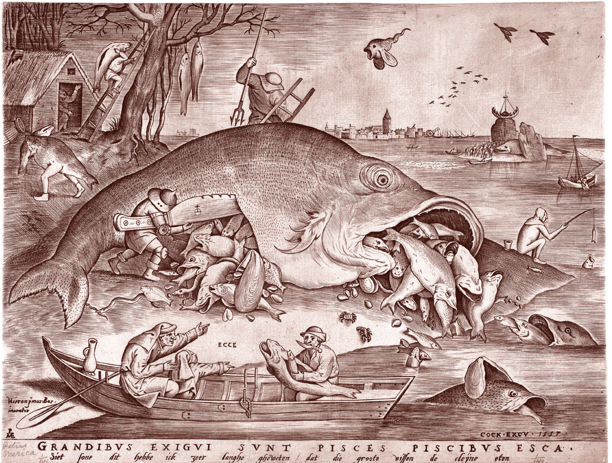
Питер Ван дер Хейден после Питера Брейгеля Старшего. Большие рыбы пожирают маленьких. 1557

Я хотел бы обсудить результаты выборов, состоявшихся 9 сентября 2018 года. Обсудить их не сами по себе, а в связи с пенсионной реформой, которая, как я все больше убеждаюсь, принесет колоссальный вред государству и обществу. Это обсуждение является предварительным, потому что нет еще окончательных результатов выборов. Но мне кажется, что оно абсолютно необходимо, потому что вскорее (да и уже) будет сделано всё, чтобы некой интерпретацией произошедшего заглушить реальность, создать вокруг этих выборов виртуальную реальность, которая настоящее существо дела будет замыливать или внутренне уничтожать, пожирать. Поэтому надо это обсуждать прямо сейчас. Но я не могу начать обсуждение без какого-то короткого введения, потому что сами по себе результаты выборов существенны, конечно, и весьма существен-