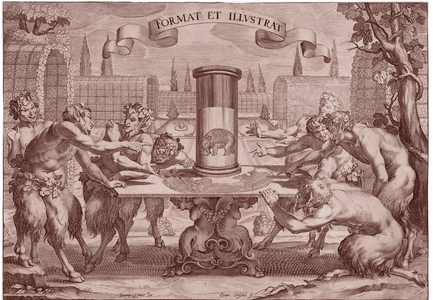
Ганс Трошель после Симона Вуэ. Сатиры любят анаморфозу слона. XVII в.

Центризмбирком и «Единая Россия» признали воздействие на голосование дискуссий вокруг пенсионной реформы. Но оказалось, что в целом правящая партия с негативом справилась.