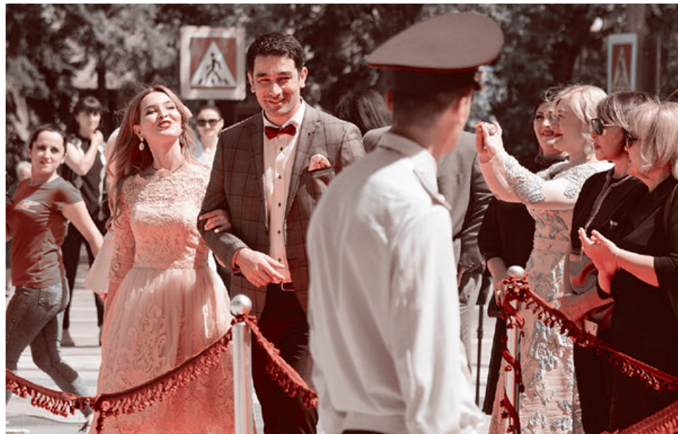
Телеведущий и актер Григорий Мамиев на открытии театра в Цхинвале