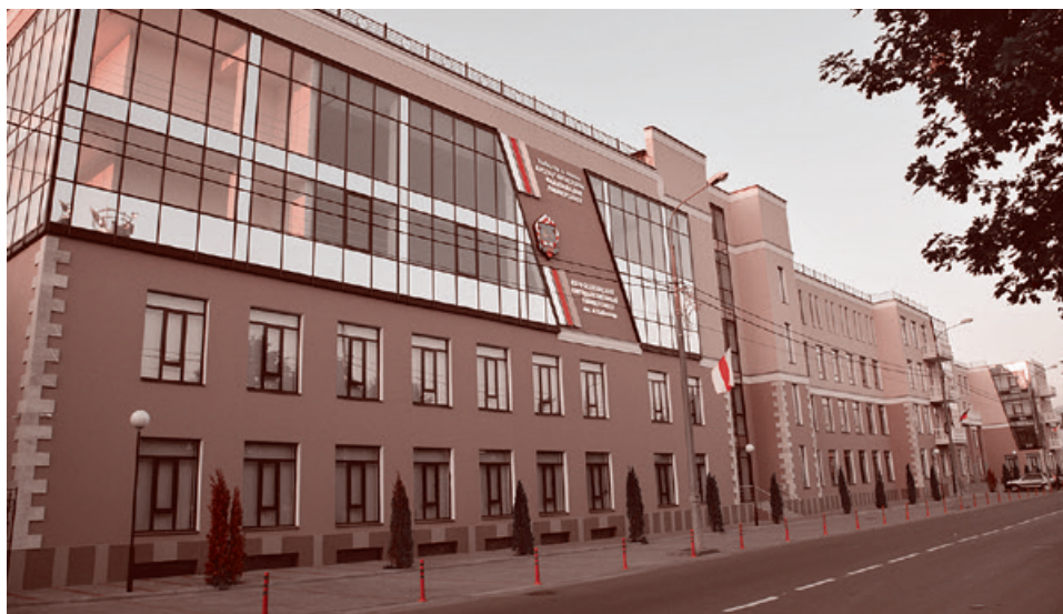
Юго-Осетинский государственный университет