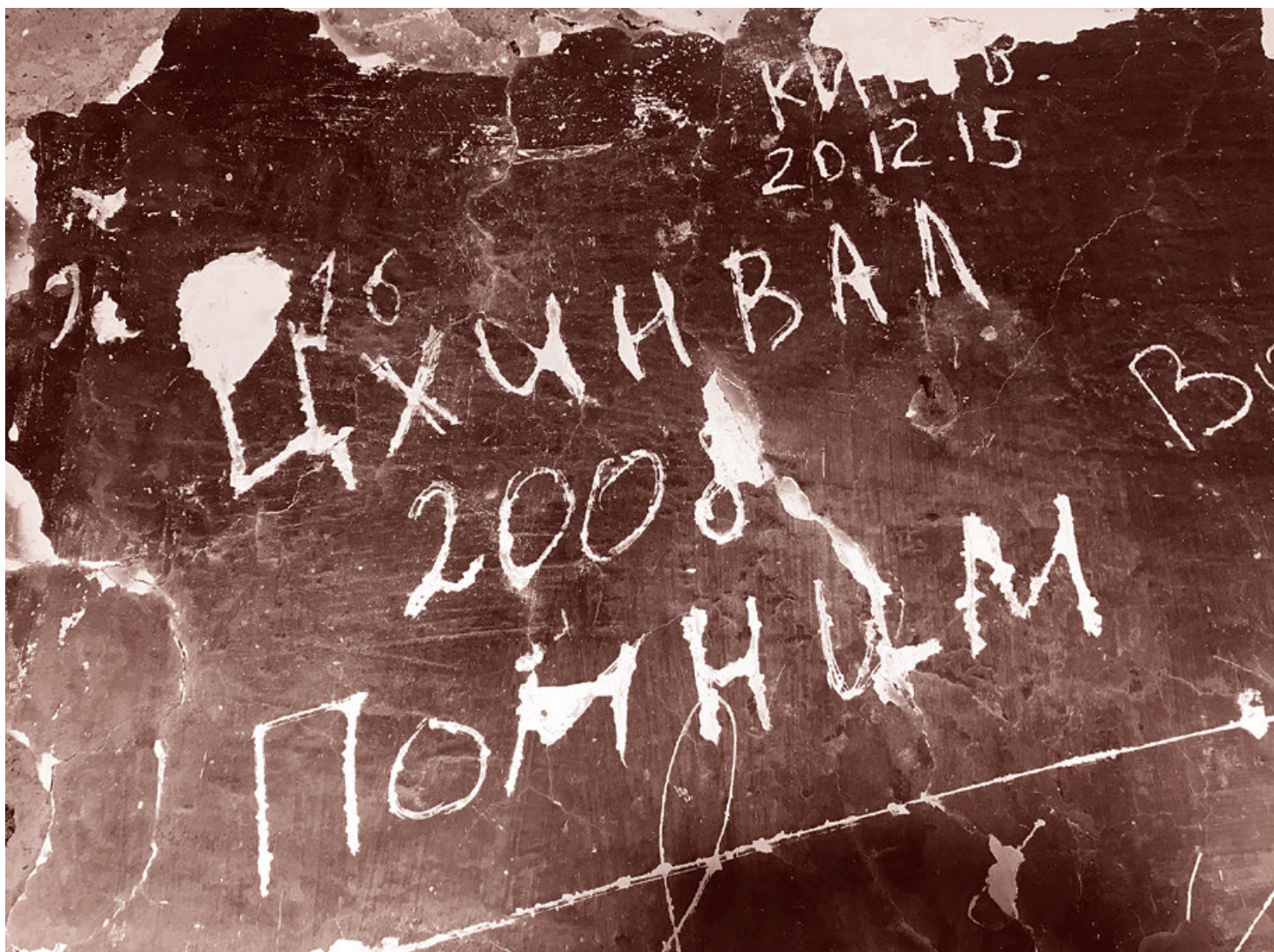
Надпись в бывшей казарме российских миротворцев

5 августа обе стороны конфликта общались об обстреле правоохранителей каждой из них. В ночь с 5 на 6 августа было зафиксировано 8 пролетов реактивных грузинских самолетов по направлению от города Гори к находящемуся на севере Южной Осетии поселку Джава. Одновременно с этим грузинская сторона продол-