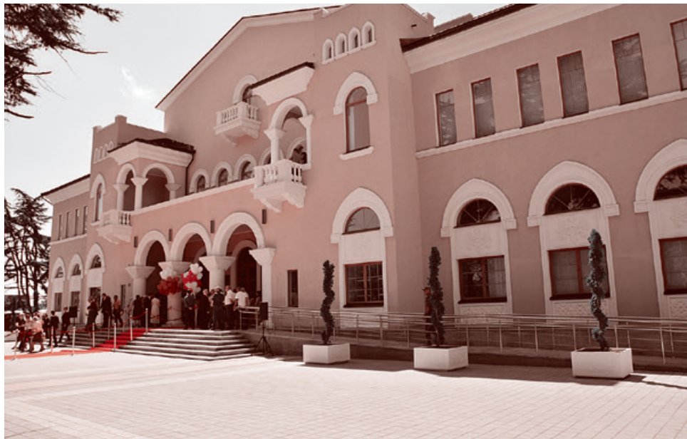
Восстановленный Государственный драматический театр в Цхинвале