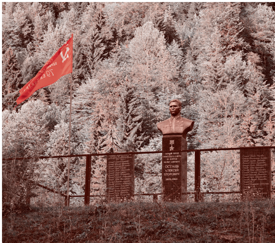
Памятники героям Великой Отечественной Войны в горах Кавказа