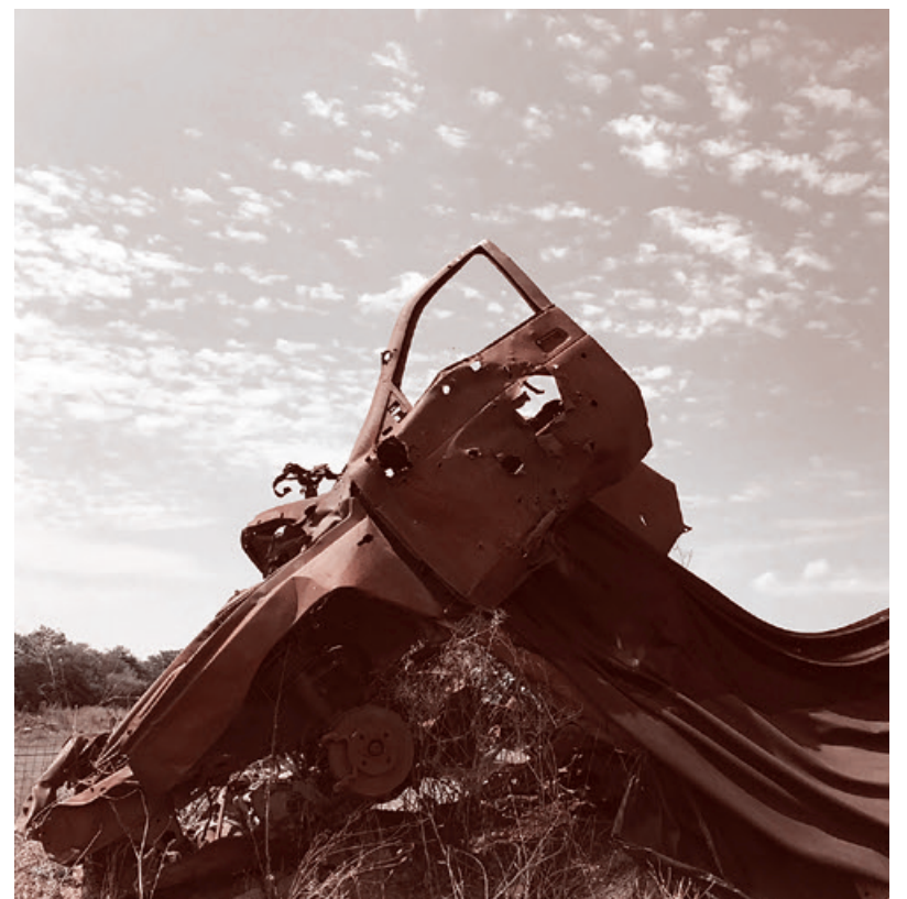
Монумент сожженных душ под Хетагурово. Остовы сожженных грузинскими войсками машин, в которых погибли дети