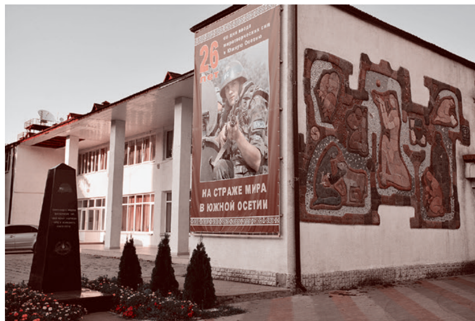
В Южной Осетии помнят российских и осетинских миротворцев, защищавших Цхинвал в августе 2008 года. Стелу памяти солдат миротворческих сил открыли в 2015 году.

В ходе практической деятельности обнаружились недостатки парламентской формы правления. В стране, где царит хаос, беспорядок, вседозволенность, парла-