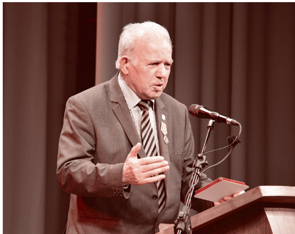
Людвиг Алексеевич Чибиров — первый президент Южной Осетии

К X веку они создали раннефеодальное государство, которое зарекомендовало себя в тогдашнем мире, установило близкие отношения с Русью на севере, а на юге его соседями были могущественная Византия и Грузинское царство. Династические и другие связи, которые установила Алания с Русью, Грузией, Византией свидетельствовали о том, что она котировалась как значимое государственное формирование.