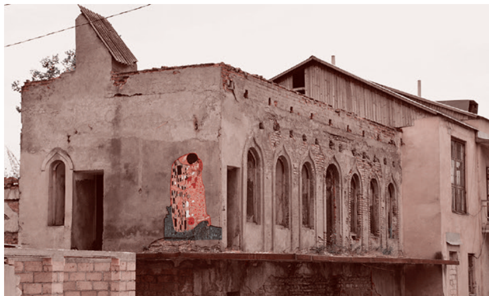
Картина Густава Климта «Поцелуй» на разрушенном здании в Цхинвале