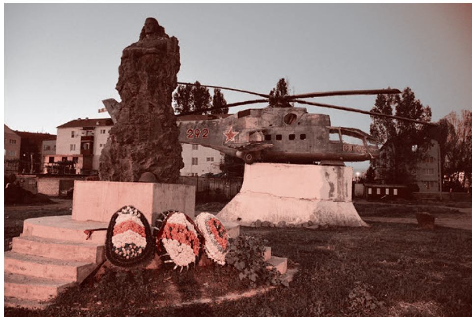
Памятник погибшим в Афганистане воинам вертолетного полка

ская армия на помощь или не идет. В этот момент что люди переживали? Не могли бы Вы вспомнить?