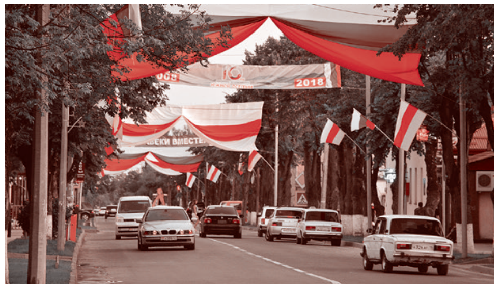
Праздничные украшения в Цхинвале

К Уастырджи обращаются не со стандартными текстами, а с тем, что на сердце, и от всей души. В этот раз — со сцены — его просили о благословении театра.