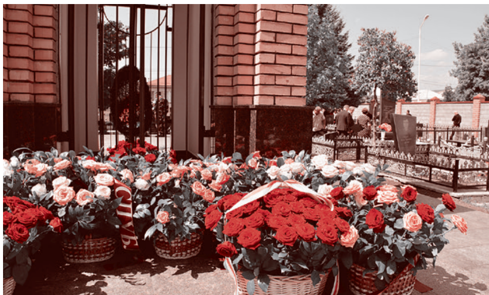
Возложение цветов на мемориальном кладбище во дворе цхинвальской школы №5