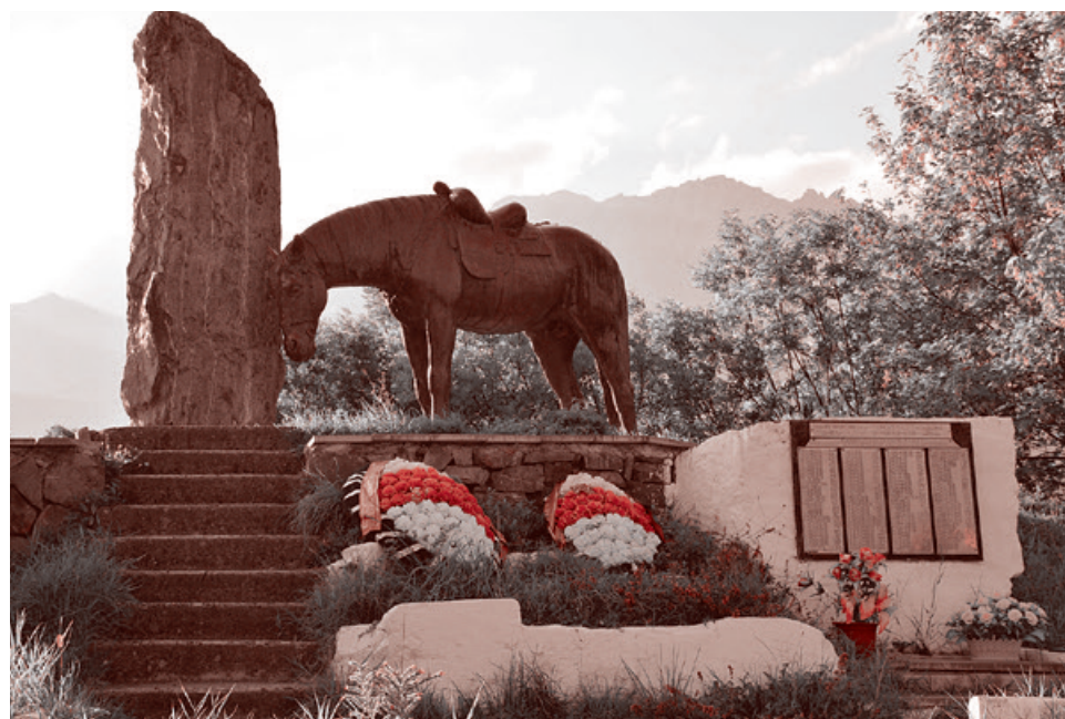
Памятник выходцам из Куртаинского ущелья, павшим за Родину в годы Великой Отечественной войны (Северная Осетия)