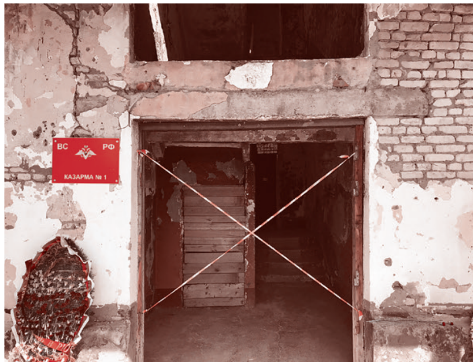
В бывшей казарме российских миротворцев

10 августа в посольство РФ была передана нота МИД Грузии, согласно которой по приказу Саакашвили с 5:00 грузинская сторона прекратила боевые действия и начала вывод своих вооруженных сил из зо-