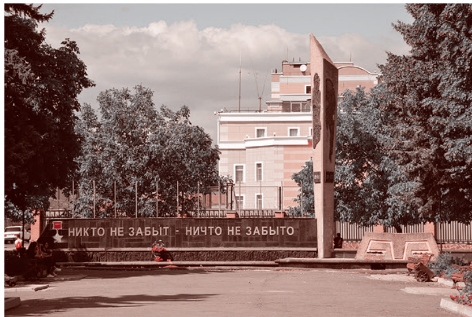
Вечный огонь в Цхинвале

Корр.: Вы сказали, что 2008 и 1992 годы сильно различались по настроению людей. Но в 2008 году были первые один-два дня, когда непонятно было, идет россий-