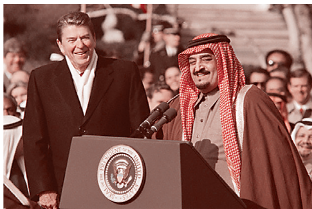
Король Саудовской Аравии Фахд и Рональд Рейган

Многие западные товары (продовольствие, детали машин, потребительские товары), импорт которых как-то помогал советской экономике держаться на плаву, теперь стали недоступными из-за высоких цен. Летом 1986 года требовалось продать в пять раз больше советской нефти, чтобы получить то же количество западногерманского оборудования, как годом раньше.