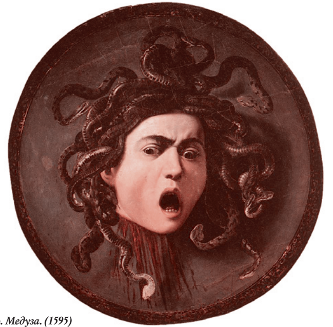
Караваджо. Медуза. (1595)

Был момент, когда советский человек по праву мог стать победителем страха. Таким моментом была Великая Отечественная война. Советский человек сумел отрубить голову горгоне Медузе фашизма