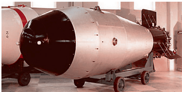
Самая мощная в мире экспериментальная бомба — «А602ЭН». Испытана 30 октября 1961 года на полигоне «Новая Земля». Расчётная мощность более 100 мегатонн тротилового эквивалента. Испытана на половинную мощность.