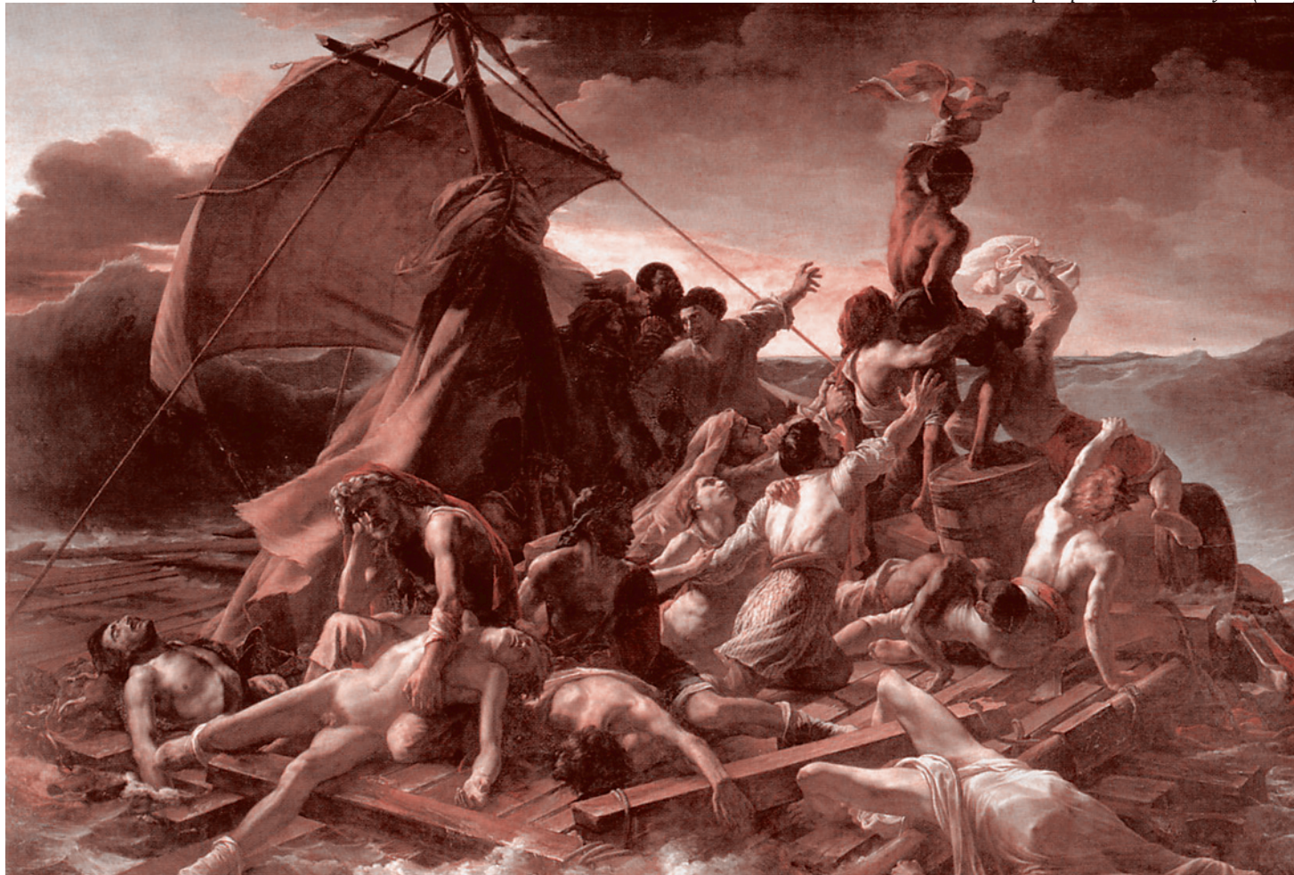
Теодор Жерико. Плот "Медузы" (1819)