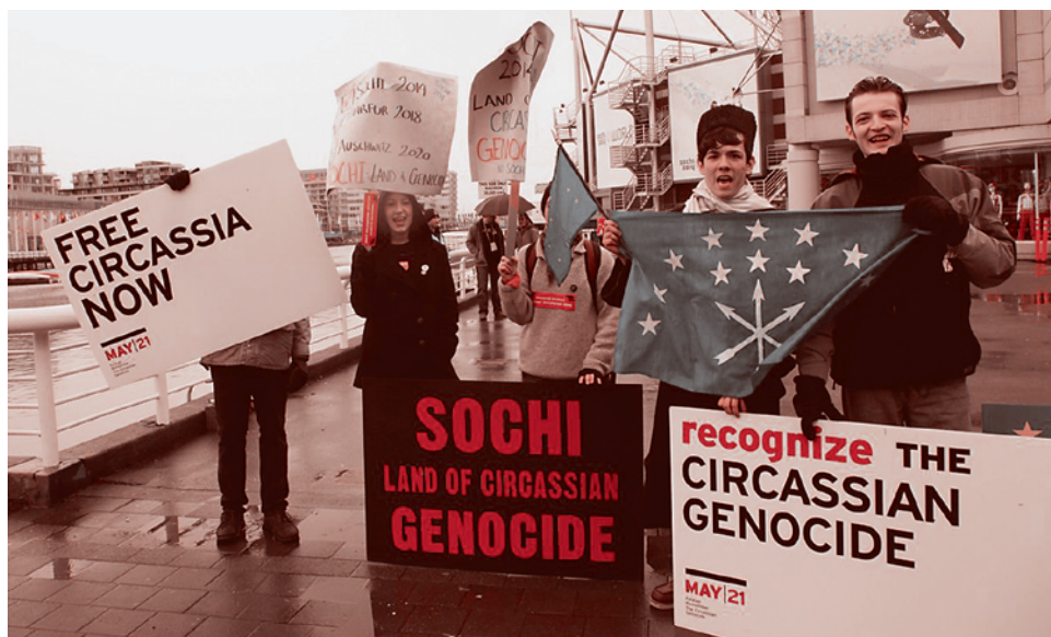
Пикет за признание геноцида черкесов в Тбилиси

Якобы уже после неудачных переговоров произошли боевые столкновения, в результате которых часть группы была уничтожена, а оставшихся в живых 9 человек переправили в Турцию.