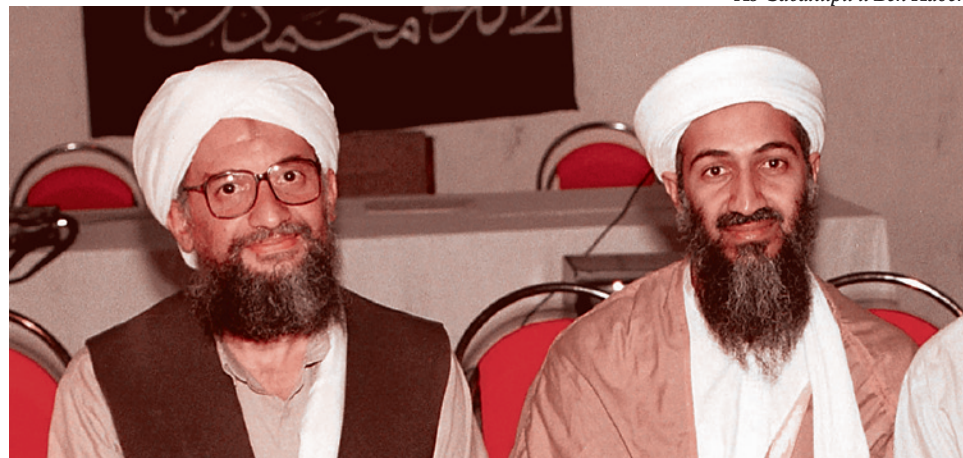
Аз-Завахири и Бен Ладен