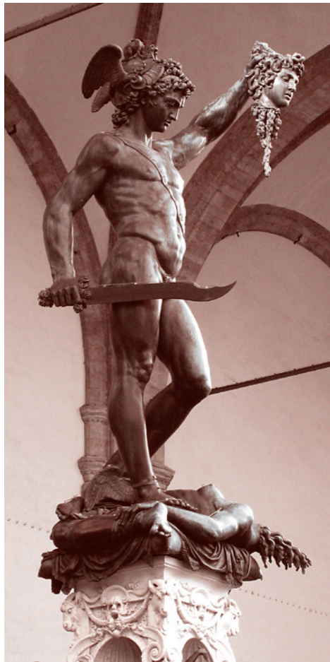
Бенvenuto Челлини. Персей

Не имеем ли мы тут дело опять с мифом о Персее? Акрисию-КППРФ кто-то сказал,