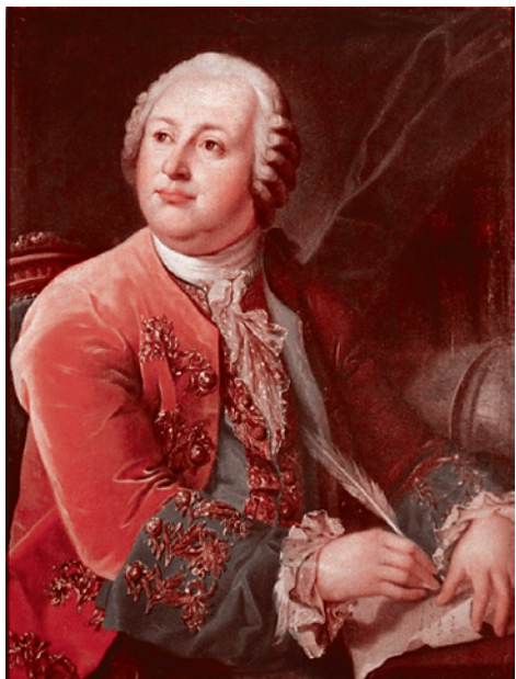
Портрет М.В. Ломоносова. Художник А.С. Миропольский. 1787 г.

Так это было во все времена у всех народов, говоривших на разных языках, поклонявшихся разным богам, по-разному понимающих смысл жизни. Где-то, например, в конфуцианском Китае, приоритет образования как средства повышения своего социального статуса был задан со всей категоричностью. А где-то даже образованному человеку трудно было преодолеть сословные ограничения. Но он ведь преодолевал их не только в Китае, где для этого были предоставлены все возможности, но и в странах, где этих возможностей предоставлено не было. В той же феодальной России, например. Не зря такое значение придавалось в России прецеденту Ломоносова. Не зря писались стихи «Скоро сам узнаешь в школе, / Как архангелский мужик / По своей и божьей воле / Стал разумен и велик». Да, сословные рогатки в феодальной России не исчезали автоматически при предьявлении представителем низшего сословия некоего высокого образовательного уровня. Но скрипя зубами высшее сословие пропускало-таки образованного представителя низкого сословия наверх. Пропускало слишком медленно, обставляя это разного рода издевательствами. И видимо, в этом одна из причин Великой Октябрьской социалистической революции. После которой сословные рогатки были сняты полностью и доступ к образовательным высотам получили все. Более того, прежде всего те, кто ранее его не имели.