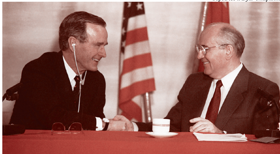
Горбачев и Буш-старший