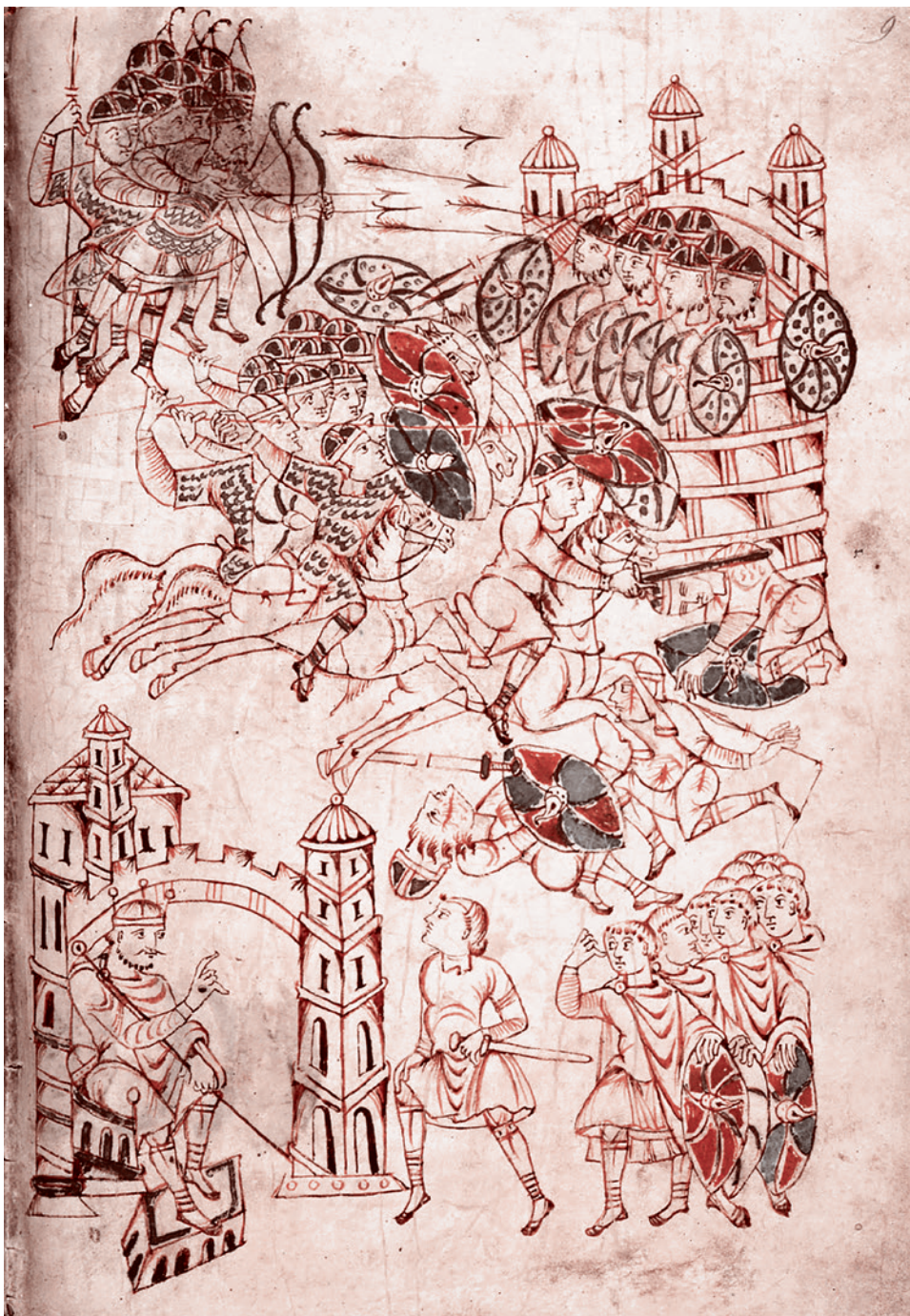
Антиох Епифан, атака на Иерусалим. Первая книга Маккавейская. Манускрипт из Лейдена. Вторая половина IX — начало X вв.

Началом восстания стало убийство Маттафией, священником из рода Хасмонеев (именно хасмонейские священники возглавили борьбу за иудейскую веру против эллинизации), особо рьяно отстаивавшим иудейскую веру, некоего еврея-вероотступника, который стал осуществлять в Иерусалимском храме это самое вероотступничество, принеся жертву на языческом алтаре. Бежав в горы после убийства этого вероотступника, Маттафия возглавил борьбу против эллинизации. В ито-