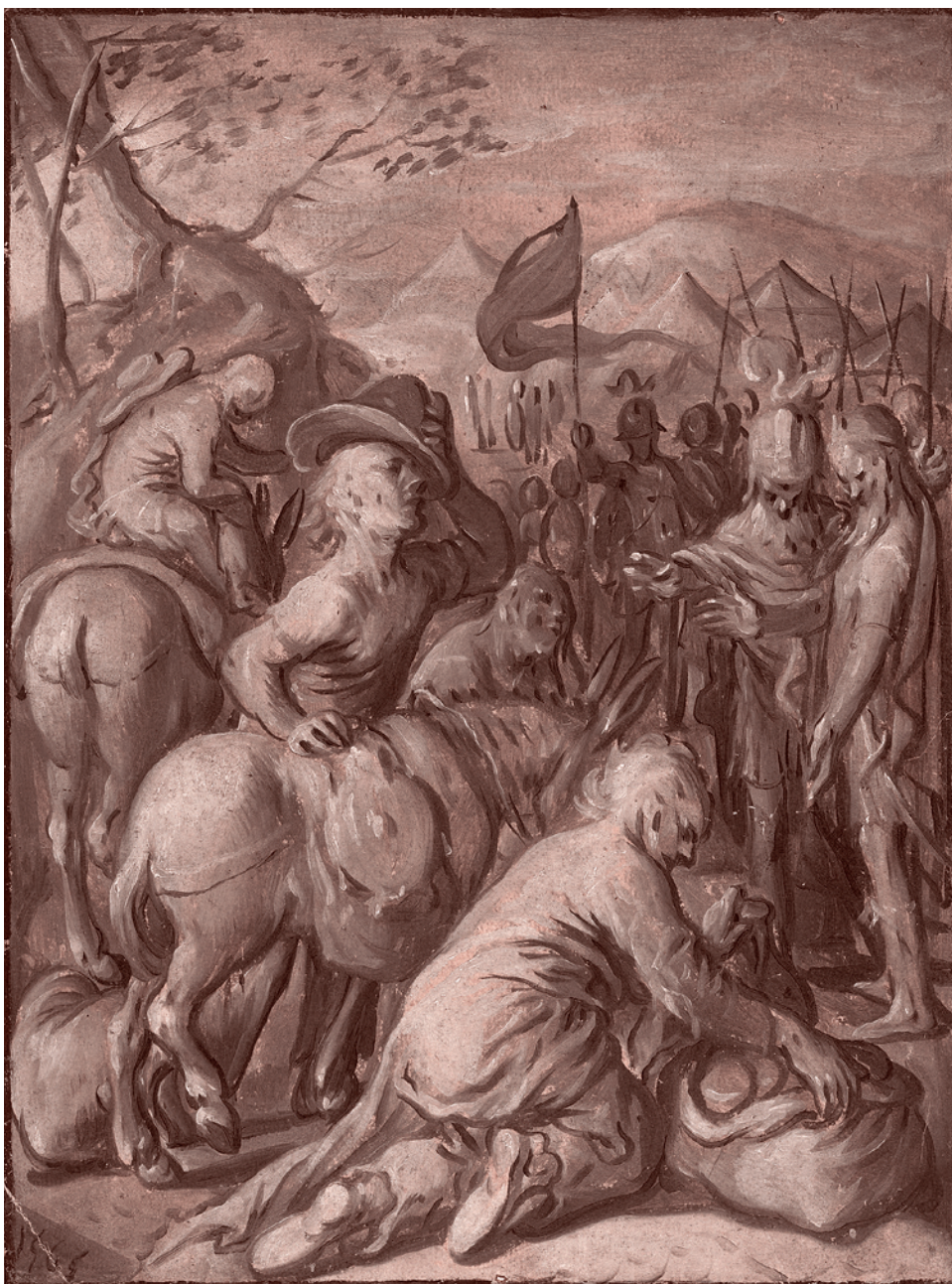
Иоахим Бейкелар. Хитрость гаваонитян. 1565

Я привожу такие длинные цитаты для того, чтобы читатель, в том числе и не проявлявший интереса к ветхозаветной истории, мог из авторитетного первоисточника, а не из моего сжатого пересказа, получить сведения по поводу масштаба богохульства, учиненного Саулом как наипрочайшим представителем колена Вениаминова.