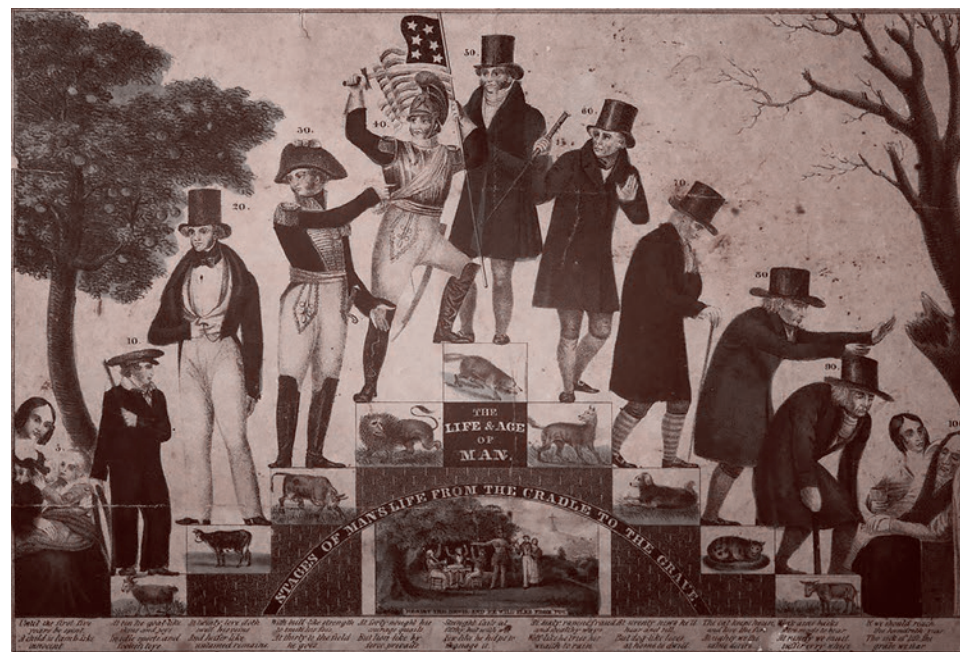
Жизнь и возраст мужчины

«Ясно, что время идет в одном направлении. Чтобы активное долголетие состоялось, необходимо заботиться о людях, начиная с момента рождения», — заключила Сковцова.