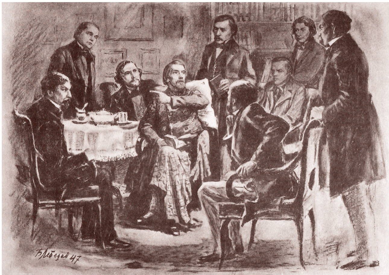
Б. Лебедев. Петербургский кружок Белинского. 1947

половина меня, лучшая, самая благородная моя часть, сошедшая в могилу».