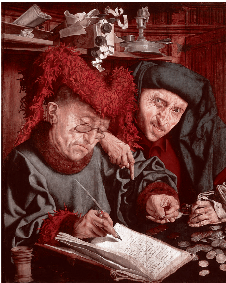
Маринус ван Реймерсвалле. Два сборщика податей. Первая половина XVI в.

В 1990 году был принят закон «О государственных пенсиях в РСФСР», по которому источником пенсионных выплат стал не бюджет, а страховые отчисления работодателей и работников. Для управления этими пенсионными отчислениями был создан Пенсионный фонд России (ПФР).