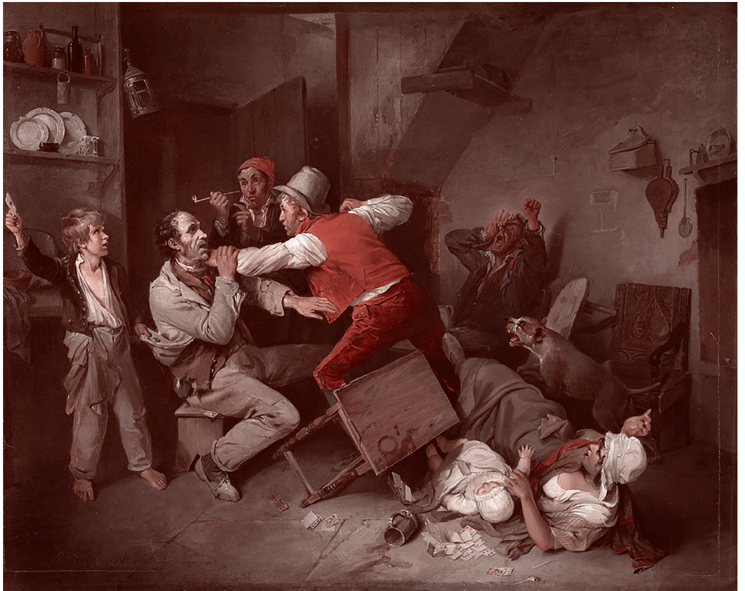
Эдвард Берд. Обман обнаружен. 1814