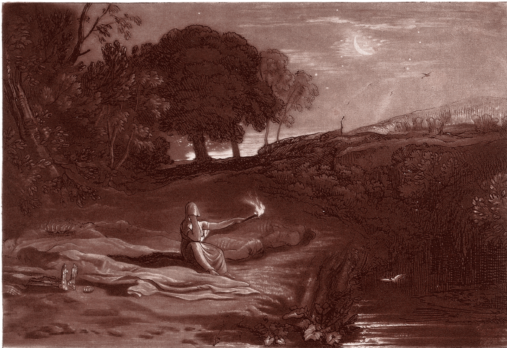
Уильям Тёрнер. Рица. Около 1807–1808. «Рица, дочь Ая, взяла покрывало печали и растелила его на камне. И от начала жатвы до начала дождей Рица сидела там день и ночь. Она не позволяла прикасаться к телам ни птицам небесным в дневное время, ни диким зверям в ночное время».