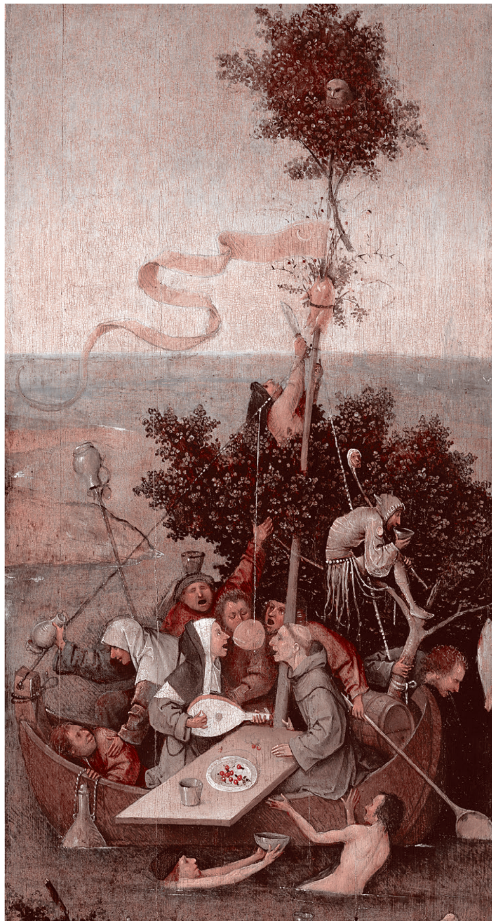
Иероним Босх. Корабль дураков. Около 1494–1510

Однако, похоже, правительство это вряд ли учло. И, похоже, почти не заметило очень нервную реакцию российских масс на стремительный взлет цен на горючее в последние месяцы. Или заметило, но по каким-то причинам отнеслось к этой реакции благодушно-спокойно.