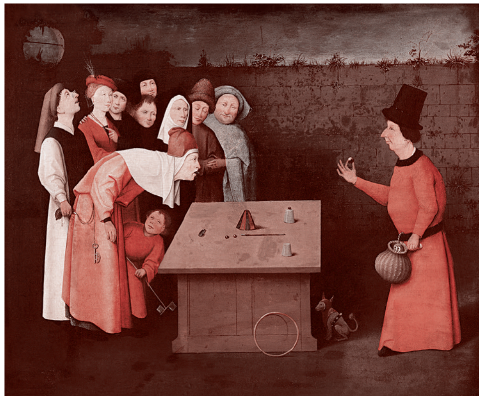
Иероним Босх. Фокусник. 1475–1502

Эта «реформа» прошла практически без серьезных социально-политических эксцессов, и в январе 2017 г. Кудрин на «Гайдаровском форуме» уверенно назвал необходимой такую же формулу увеличения пенсионного возраста для всех граждан России. Идея была сразу подхвачена высшими правительственными чиновниками. В частности, премьер Дмитрий Медведев в мае 2017 г. заявил, что «ожидаемая продолжительность жизни при выходе на пенсию в России состав-