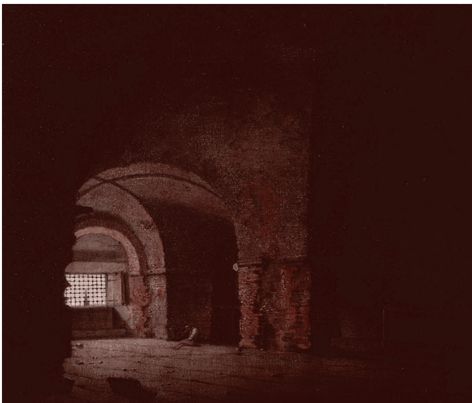
Джозеф Райт из Дерби. Заключенный. 1787–1790

«Быстрее! Быстрее, вы, свиньи!» И вот мы уже в котловане... Промерзшая земля плохо поддается, из-под кирки летят твердые комья, вспыхивают искры. Мы еще не согрелись, все еще молчат.