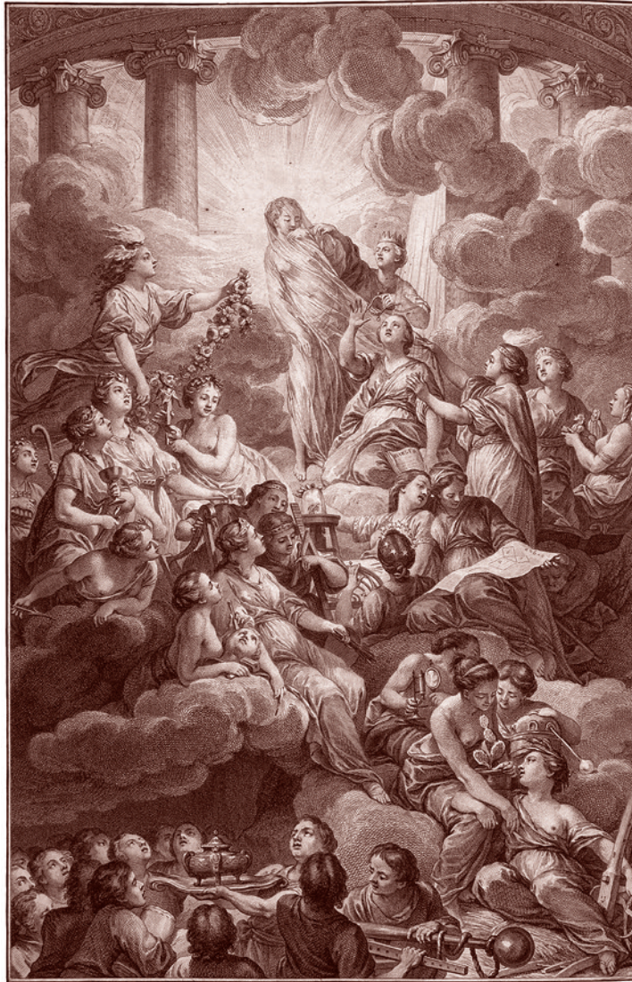
Фронтиспис «Энциклопедии, или Толкового словаря наук, искусств и ремесел» Дени Дидро. 1772

Вопрос этот заставляет его вступать в полемику с философами-эмпириками, которые, строя свои теории, при интерпретации фактов, по мнению Кассирера, делают произвольные допущения, ставя акцент