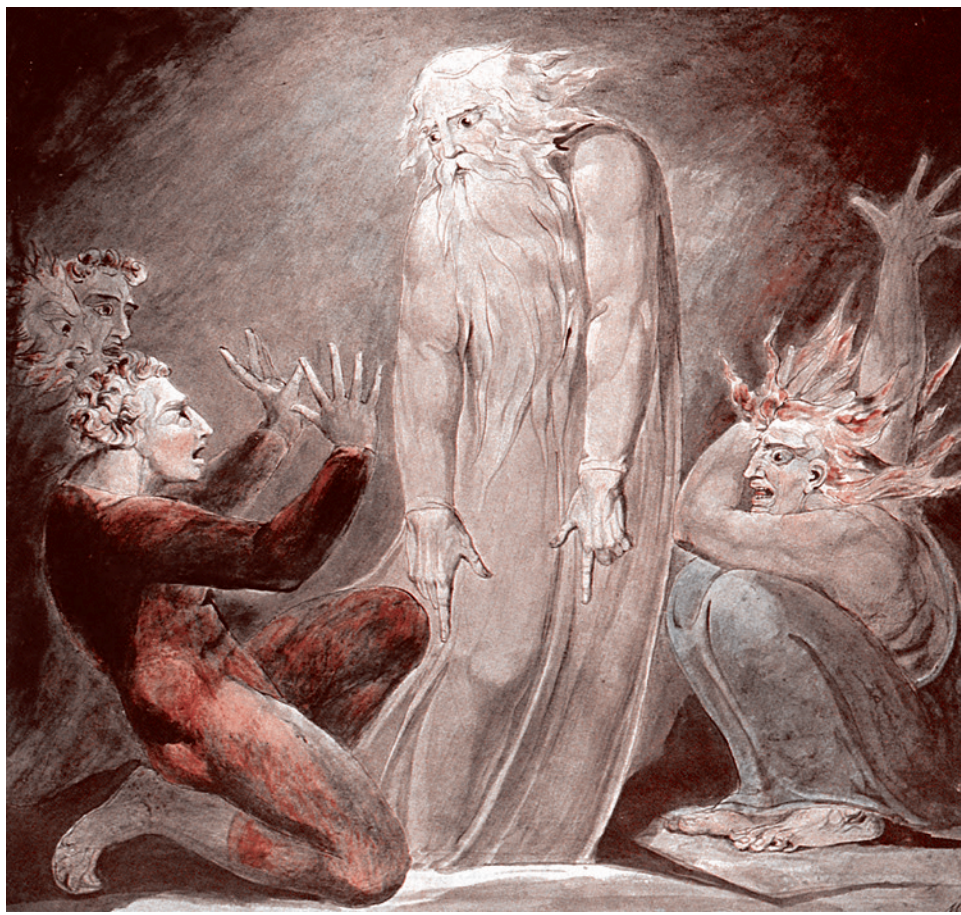
Уильям Блейк. Саул вызывает тень Самуила. 1800

Соответственно, Иосиф должен был приблизить Вениамина больше, чем других