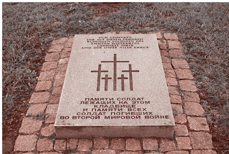
Плита с символикой Народного союза Германии по уходу за военными захоронениями на немецком военном захоронении в г. Себеж, Псковская область