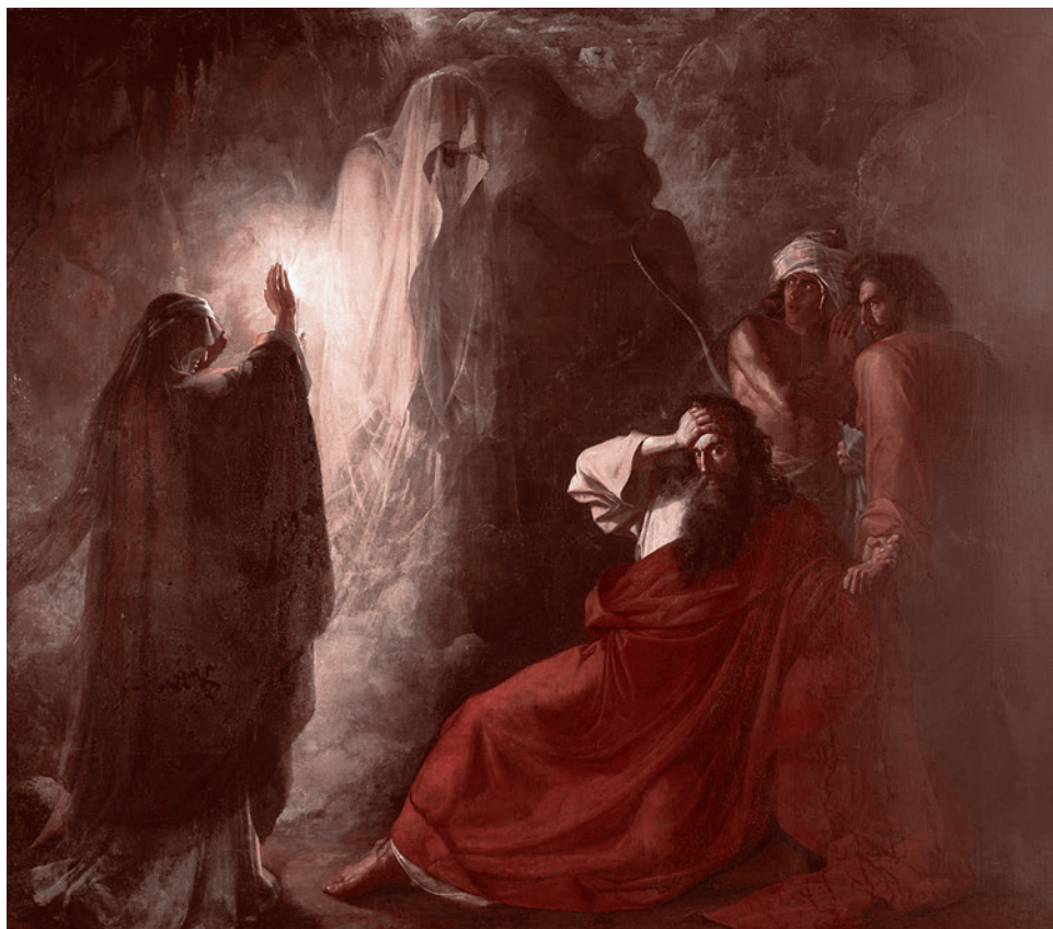
Дмитрий Мартынов. Тень Самуила, вызванная Саулом. 1857