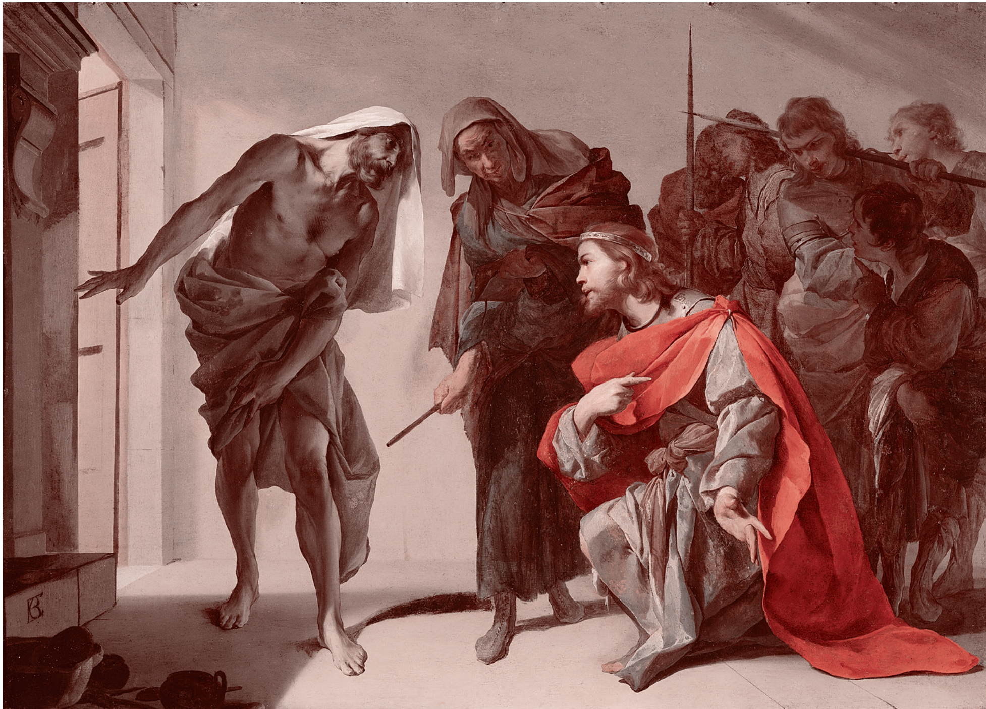
Бернардо Каваллино. Саул и тень Самуила. Около 1650–1656

П осредником в отношениях между Саулом и Господом был Самуил. Пока он выполнял эту функцию, Саул мог как-то удерживаться на плаву, избегая окончательного отпадения от Господа и его неминуемых последствий.