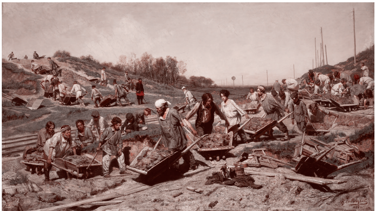
Константин Савицкий. Ремонтные работы на железной дороге. 1874

В XIX веке, когда капитализм безжалостно эксплуатировал нищих и бесправных пролетариев, когда извлечение прибыли осуществлялось, в том числе, и за счет изнурительного труда голодных детей, когда для стремительного накопления богатств использовались работорговля и пиратство, нелепо было ахать и охать по поводу какой-то там духовной смерти, осуществляемой за счет како-го-то отчуждения. И потому марксистская, коммунистическая идеология того времени не брала на вооружение идеи, сформулированные ранним Марксом в его «Экономическо-философских рукописях 1844 года», — идеи, которые, как мы видим, очень сильно связаны с фундамен-тальной концепцией Людвиг Фейербаха.