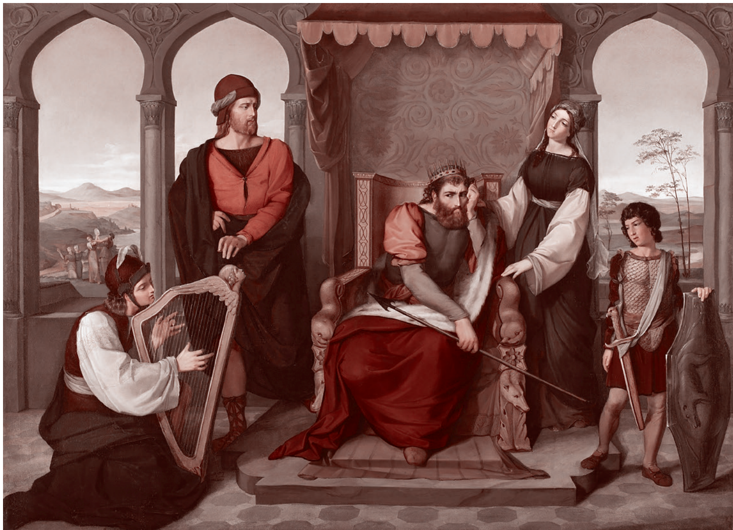
Мориц Даниэль Оптенгейм. Давид играет на арфе для Саула. 1823

Еврейские предания говорят о том, что Ионафан был очень близок к Давиду, будущему второму царю объединенного Израильского царства. В Первой Книге Царств