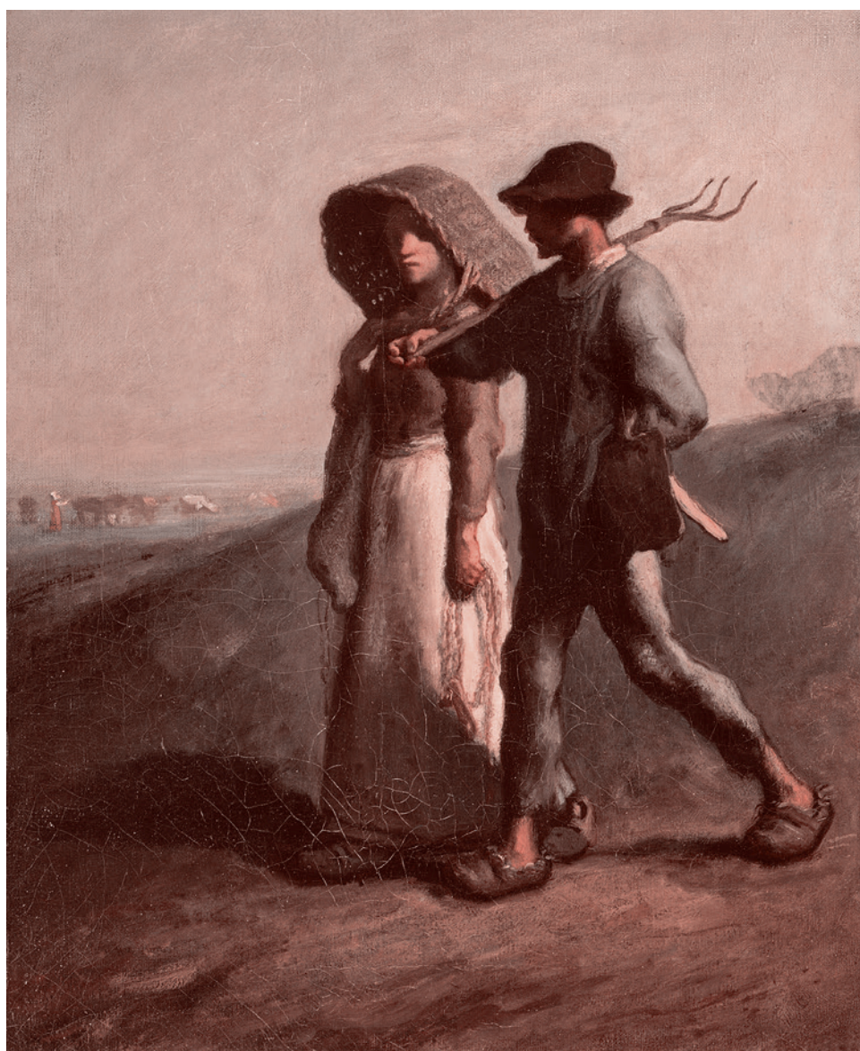
Жан-Франсуа Милле. На работу. 1851–1853

Теперь мы можем поставить на повестку дня весьма актуальный, как мне представляется, вопрос: что важнее на данном этапе развития человечества — согласие в вопросе о том, что духовная смерть — это страшная угроза, или расхождение в вопросе о том, каков источник духовной смерти?