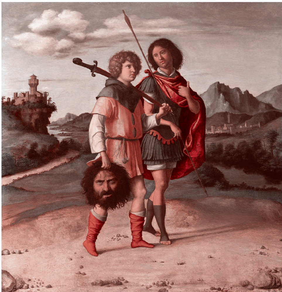
Чима да Конельяно. Ионафан и Давид с головой Голиафа. 1505

Саул, как мы уже знаем, нерадиво отнесясь к повелениям Господа, разгневал Господа своей небрежностью. В результате чего Господь повелевает Самуилу помазать на царство другого — будущего царя Давида, вифлеемлянина из колена Иуды. Вот что говорится об этом в Первой Книге Царств: