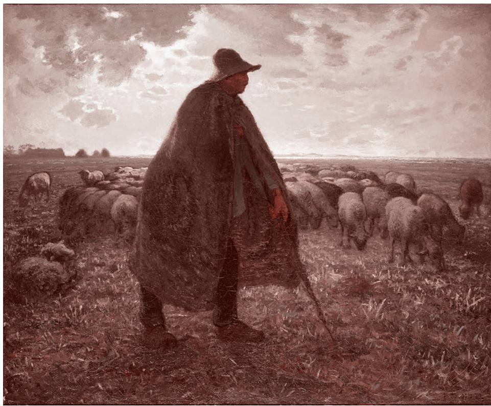
Жан-Франсуа Милле. Пастух гонит стадо. Начало 1860-х

И снова, преданный безделью, Томясь душевной пустотой, Уселся он — с похвальной целью Себе присвоить ум чужой; Отрядом книг уставил полку, Читал, читал, а всё без толку: Там скука, там обман иль бред; В том совести, в том смысла нет; На всех различные вериги, И старела старина, И старыл бредит новизна. Как женщин, он оставил книги, И полку, с пыльной их семьей, Задернул траурной тафтой.