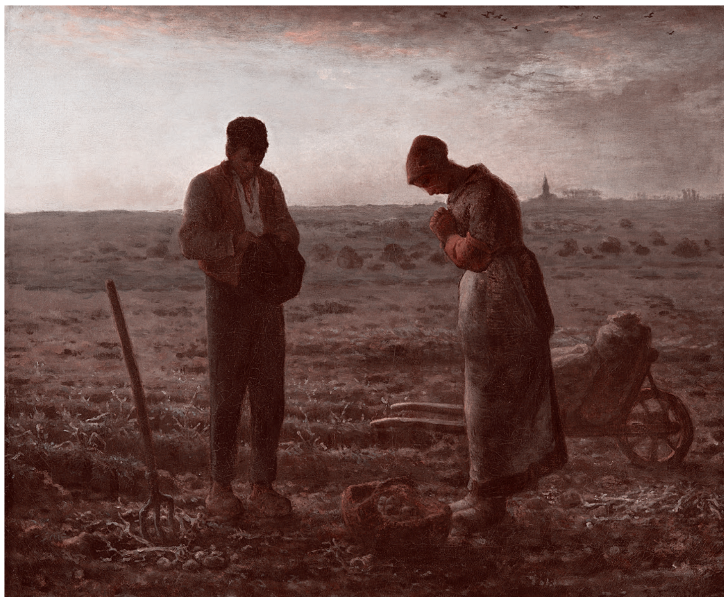
Жан-Франсуа Милле. Анжелюс (Вечерний благовест). 1857–1859