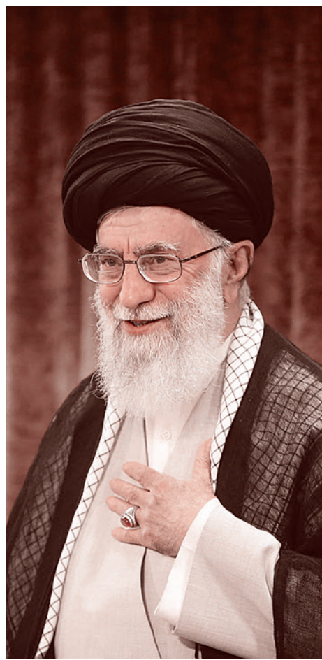
Али Хаменеи. 23 мая 2018 г.

Неудивительно, что в США давно и с огромным напряжением следят и за тем, какие союзы складываются вокруг Ирана. И за китайской политикой содействия укреплению ирано-пакистанских связей.