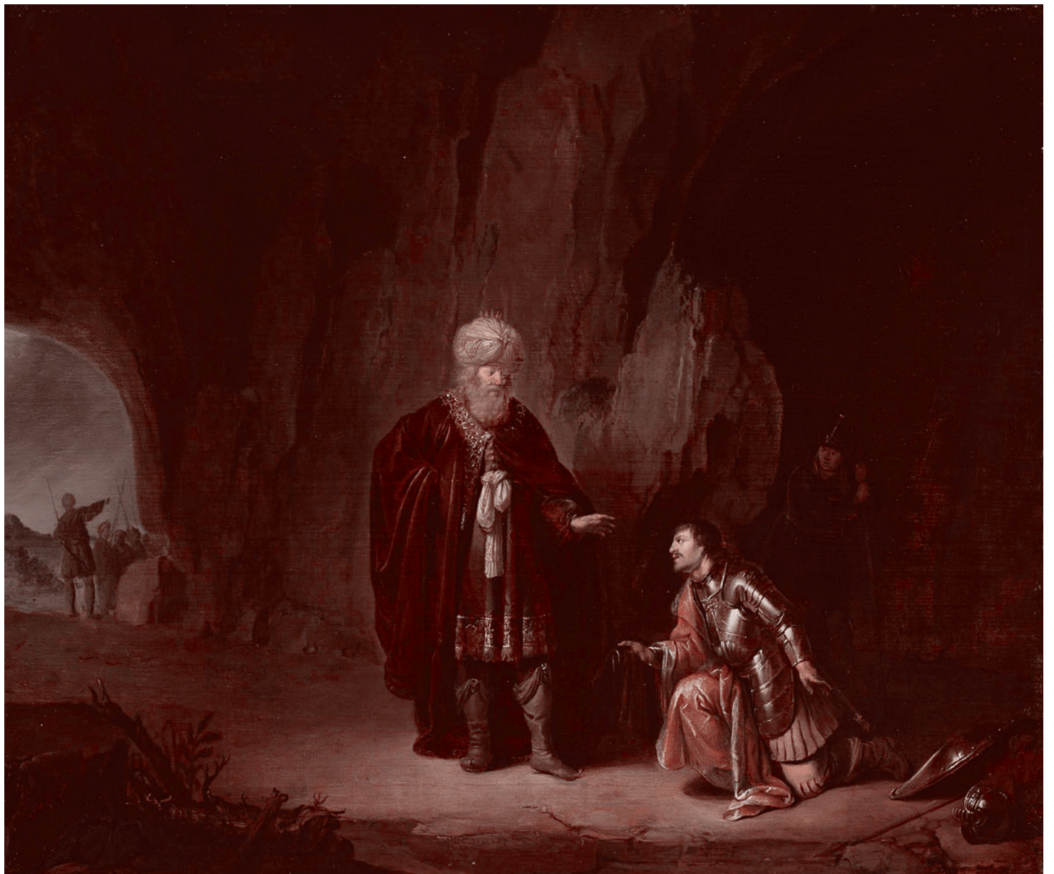
Виллем де Портер. Саул и Давид в пещере Эйн-Геди. Вторая четверть XVII в.