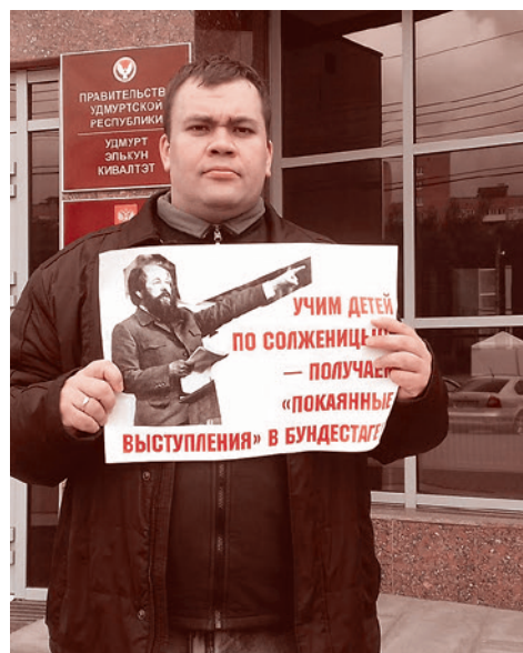
Одиночный пикет в Ижевске за изъятие Солженицына из школьной программы. 8 июня 2018

Активист удмуртского РВС провел одиночный пикет с требованием убрать произведения А. Солженицына из школьной программы. Он обосновал свое требова-