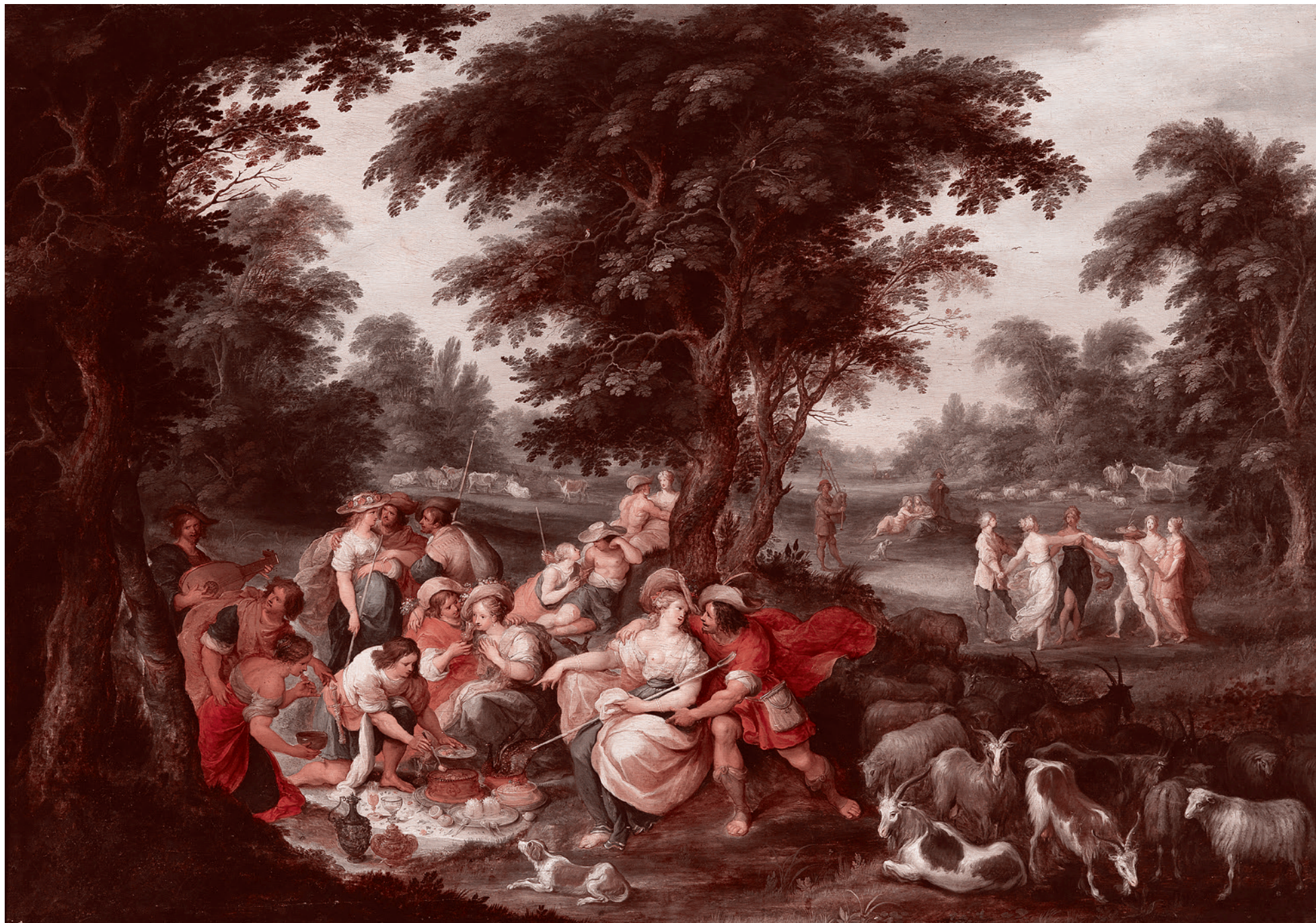
Франс Франкен Младший. Золотой век

Дальше — больше: «Там, в Париже, площади, памятники и дворцы? Не отстали и мы. Вот Крепостная площадь с гордой Екатериной II, вот триумфальные Царские ворота на подъеме от стан-