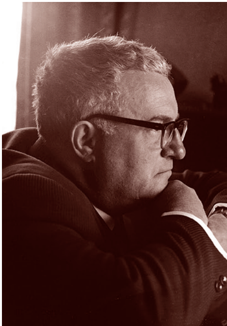
Георгий Васильевич Свиридов

Свиридов отмечает, что руководство Союза композиторов (СК) и самого Министерства культуры, где, по его убеждению, обосновались далекие от понимания музыки и не имеющие «государственного взгляда на музыкальное искусство» люди, фактически ведут к гибели. Он пишет: «Дей-