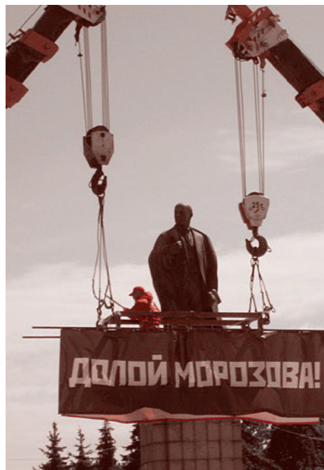
Баннер подвешенный двумя кранами на митинге КПРФ в Ульяновске. 25 мая 2018 г.

Вместо этого местное отделение КПРФ 25 мая проводит митинг, на который съезжаются представители партии из ряда городов Поволжья, что, казалось бы, само по себе совершенно нормально и правильно: Ульяновск — родина Ленина, и переименование центральной площади города не является только внутриульяновским делом. На митинге разыгрывается спектакль, при котором ряд активистов приковывают себя цепями к подъемным кранам, вывезенным на площадь. Прикованные цепями протестующие (язык не поворачивается назвать их коммунистами) сообщают, что они будут находиться в таком состоянии до тех пор, пока площадь не переименуют обратно, однако с заходом солнца спокойно расковываются и уходят домой. В тот же день группа представителей КПРФ пришла в здание городской администрации на согласованную на митинге встречу. Когда главный вход в здание оказался запечат, толпа в несколько десятков человек, руководимая первым секретарем Ульяновского обкома КПРФ,