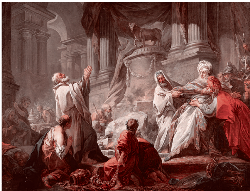
Жан Оноре Фрагонар. Иероваам, приносящий жертвы идолам. 1752

« И сказали Израильтяне Гедеону: владей нами ты, и сын твой, и сын сы-