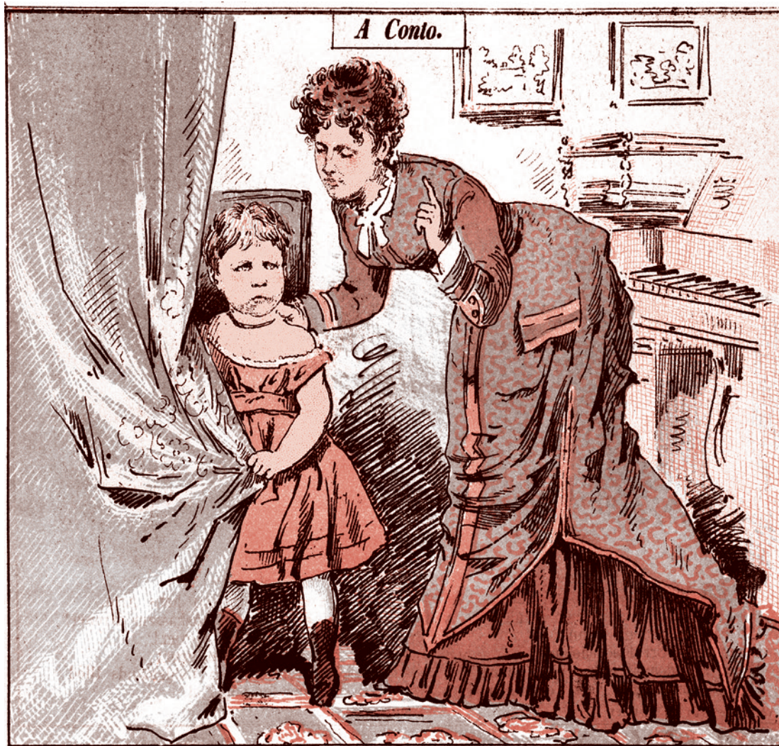
Рисунок из датского журнала «Punch». «Сегодня ты плохая девочка, поэтому не получишь шоколадку, которую тебе обещал папа!». 1877

И вот уже только после того, как слепоглухонемому ребенку насильно вложат в руку ложку и заставят ею пользоваться, после того, как под воздействием работы рук начнут возникать какие-то мысли, он начнет играть. Он уже не будет ронять