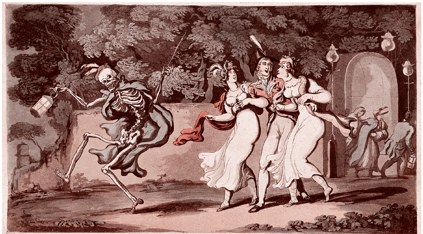
The Careful and the Careless led To join the living and the dead.

Томас Роулендсон. Пляска смерти: осторожный и беспечный. 1816