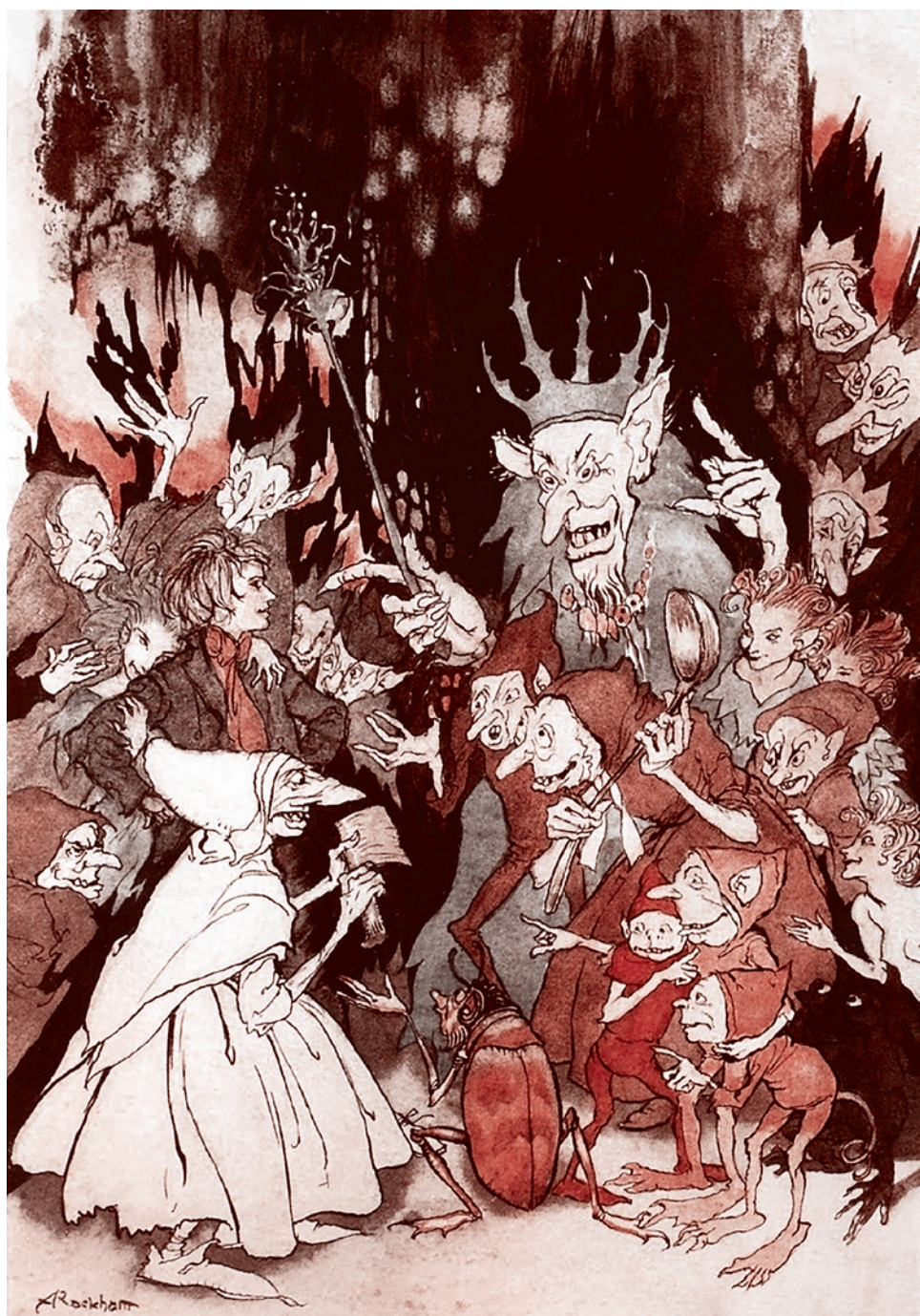
Артур Рэкхем. Пер Гюнт перед Добрским старцем. Иллюстрация к пьесе Генрика Ибсена. 1936

Я мог бы привести еще много художественных произведений, в которых говорится о вторжении мертвого в живое, об экспансии, которая осуществляется смертью для того, чтобы, умаляя живую жизнь, развивая самое себя именно внутри живого. И я вовсе не хочу сказать, что только Россия — ее писатели, поэты, музыканты, художники, ее мыслители, ее провидцы и мистики — проявляла чуткость в вопросе о соотношении жизни и смерти.