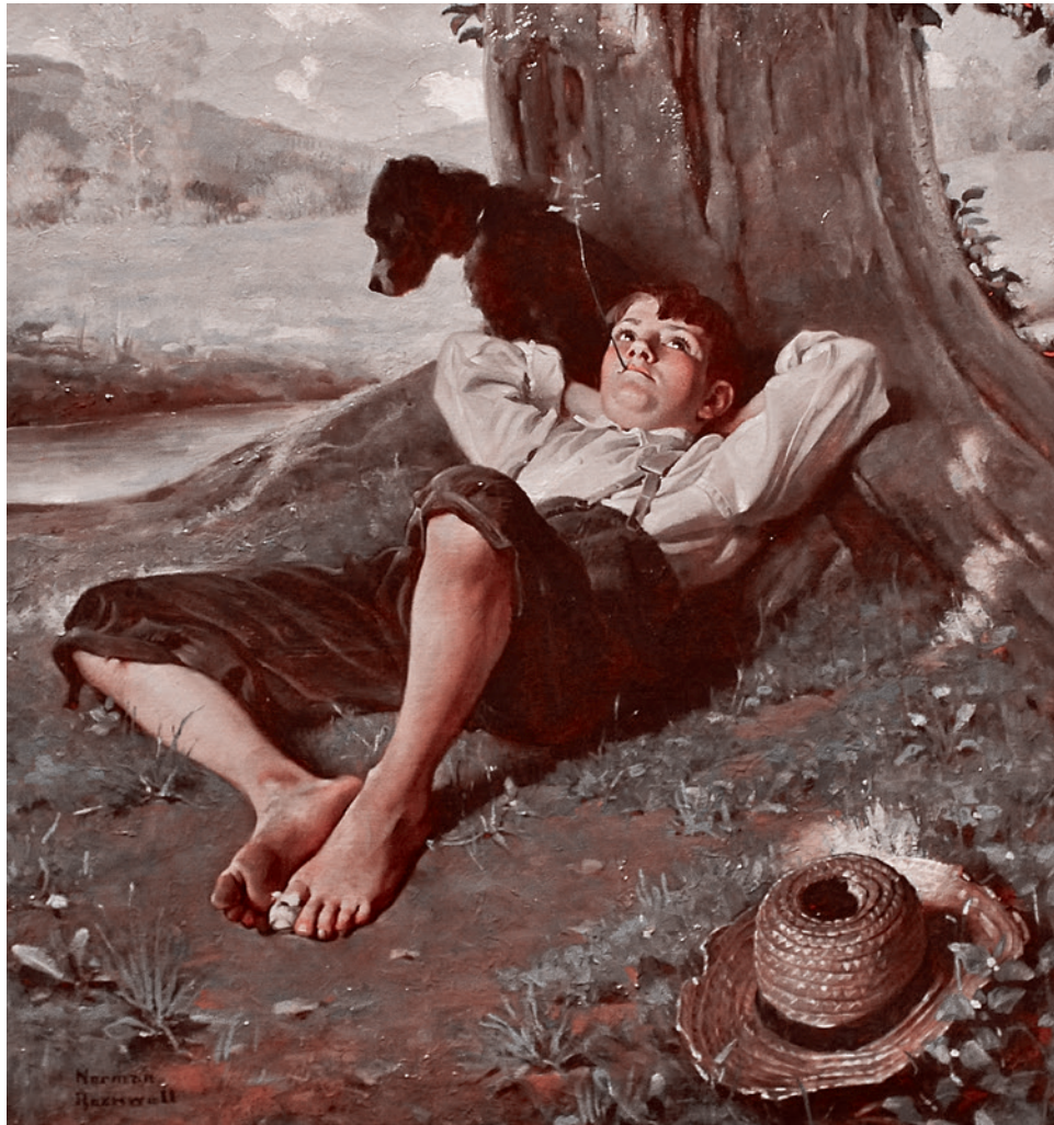
Норман Роквелл. Мечтатель. 1921

Державный пафос, демонстрация «кузькиной матери», жесткий курс на отстаивание суверенитета любыми средствами, в конце концов, пусть и невнятные, но хоть какие-то слова о «рывке», т. е. о надежде на трансформацию нынешней политической, экономической и социальной трясины, — все это, несомненно, затронуло струны души очень многих россиян (особенно тех, кто еще хорошо помнит хаос «святых девяностых»).