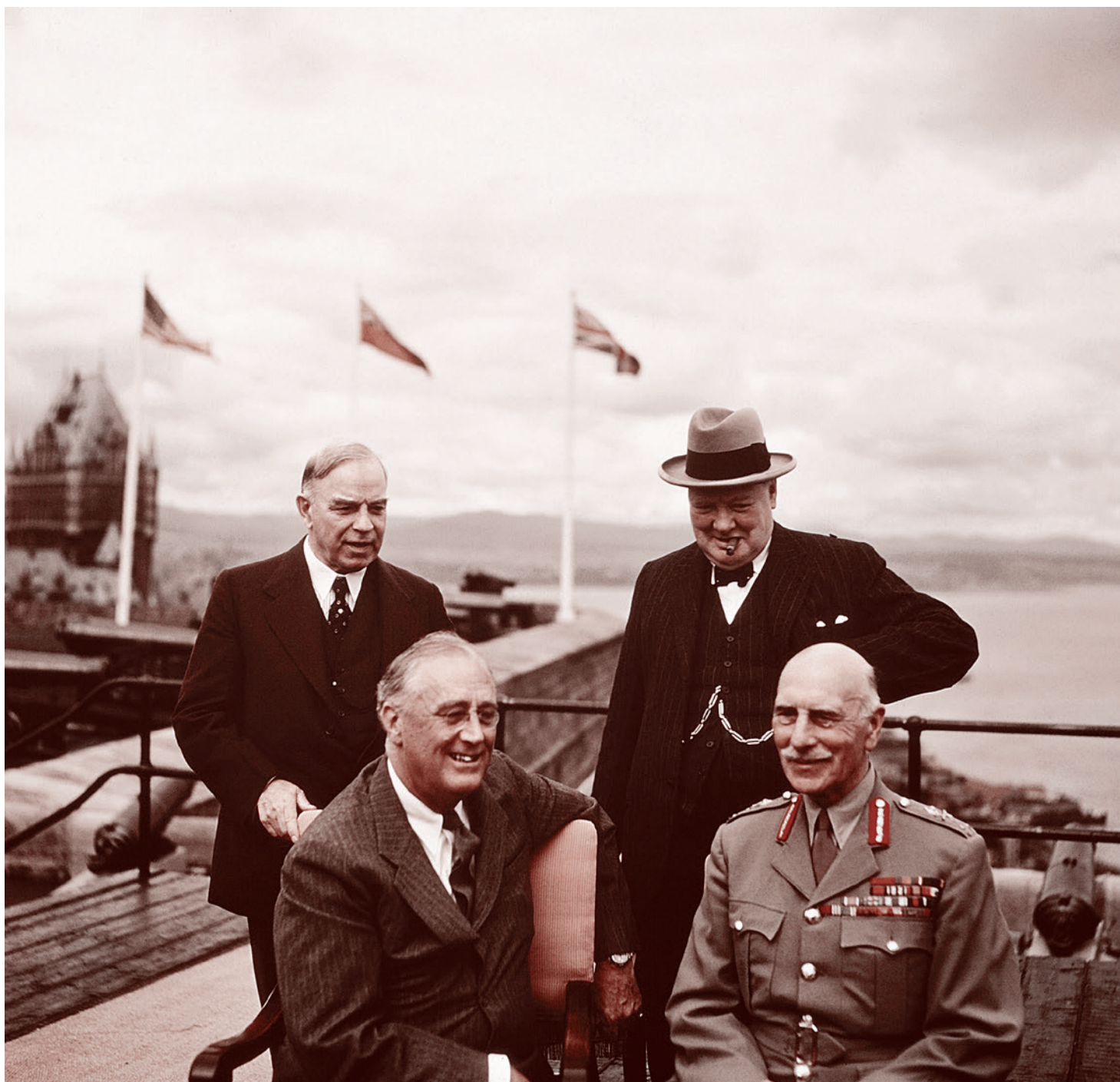
Стоят: Уильям Макензи Кинг и Уинстон Черчилль. Сидят: Франклин Делано Рузвельт и граф Атлон. Квебекская крепость. Август 1943

Нет сомнений, что именно СССР, как государство, быстро наращивающее потенциал и способное проводить собственную