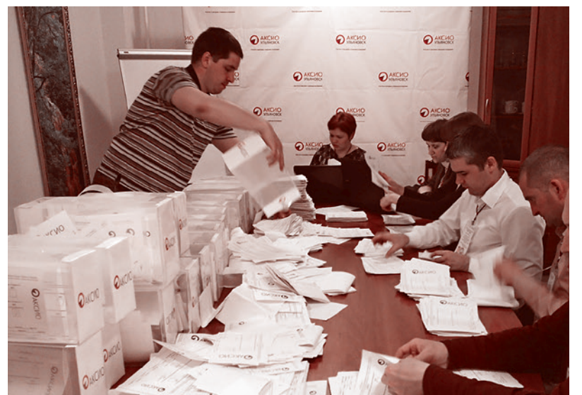
АКИСО Ульяновск. Подсчет голосов

Попытка властей продемонстрировать свои возможности и задержать ни в чем не виноватых законопослушных активистов, всего лишь проводивших социологический опрос, — это бессмысленная «акция устрашения», одновременно жалкая и преступная. Что понимали (тоже прекрасно) и сами участники плана «Перехват».