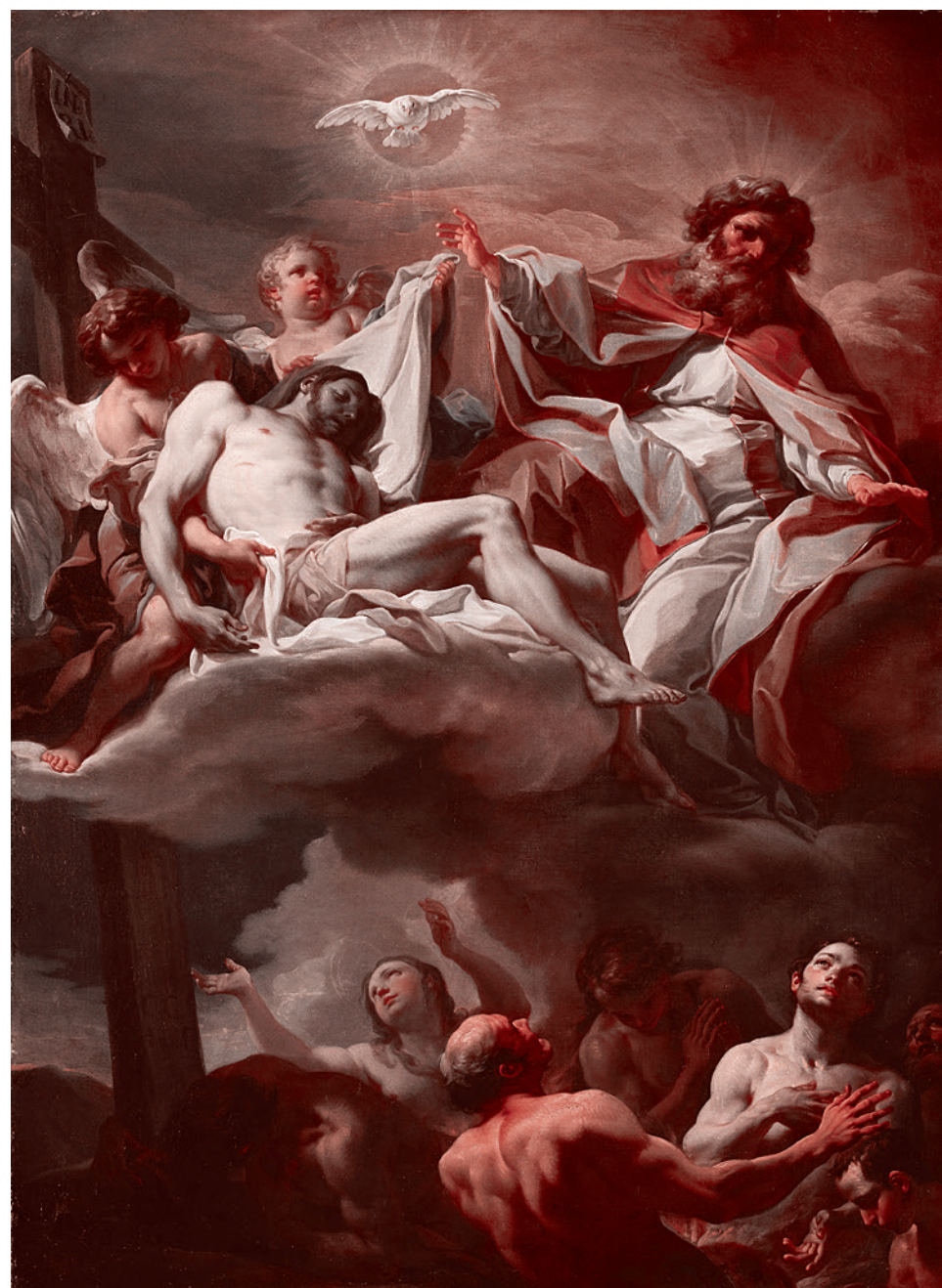
Коррадо Джаквинто. Троица и души в чистилище. Ранние 1740-е

Есть известная притча о гениальном Ньюtone, который хотел облегчить жизнь живущей в его доме кошки. У кошки как раз появились котята. Ньютон вызвал столяра и сказал: «Кошке надо дать возможность заходить в мой кабинет, но для людей дверь должна быть при этом закрыта. Поэтому сделайте в нижней части двери два отверстия — большое для кошки и маленькое для котят». Столяр изумленно спросил великого ученого: «Зачем делать два отверстия?» Ньютон ответил: «Но котята ведь маленькие, а кошка большая». Ньютон не сообразил, что маленькие котята пройдут в большое отверстие для кошки.