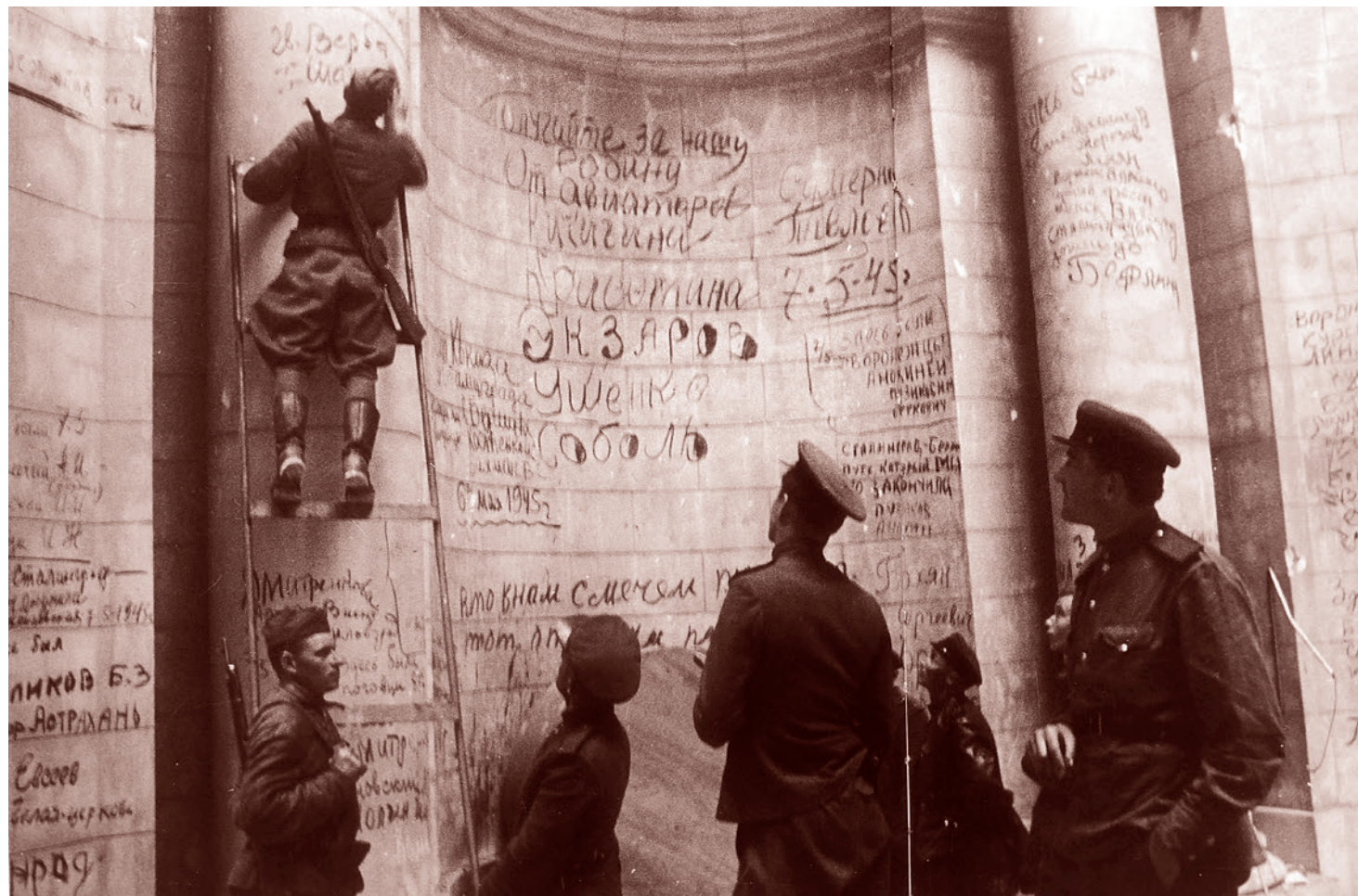
Советские бойцы и командиры оставляют победные надписи и свои фамилии на стенах Рейхстага. Май 1945