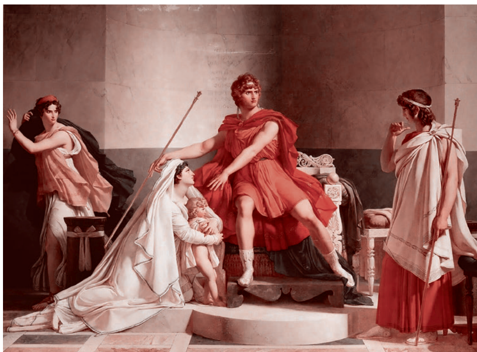
Пьер Нарсис Герен. Андромаха и Неоптолем. 1810

Потом эпироты (они же — молосцы или молосцы, сохранившие и в эпоху Пирра верность оракулу Додоны) вернули Пирра на трон, свергнув жестокого царя Алкета, который сверг отца Пирра. Это произошло в 307 году до н. э.