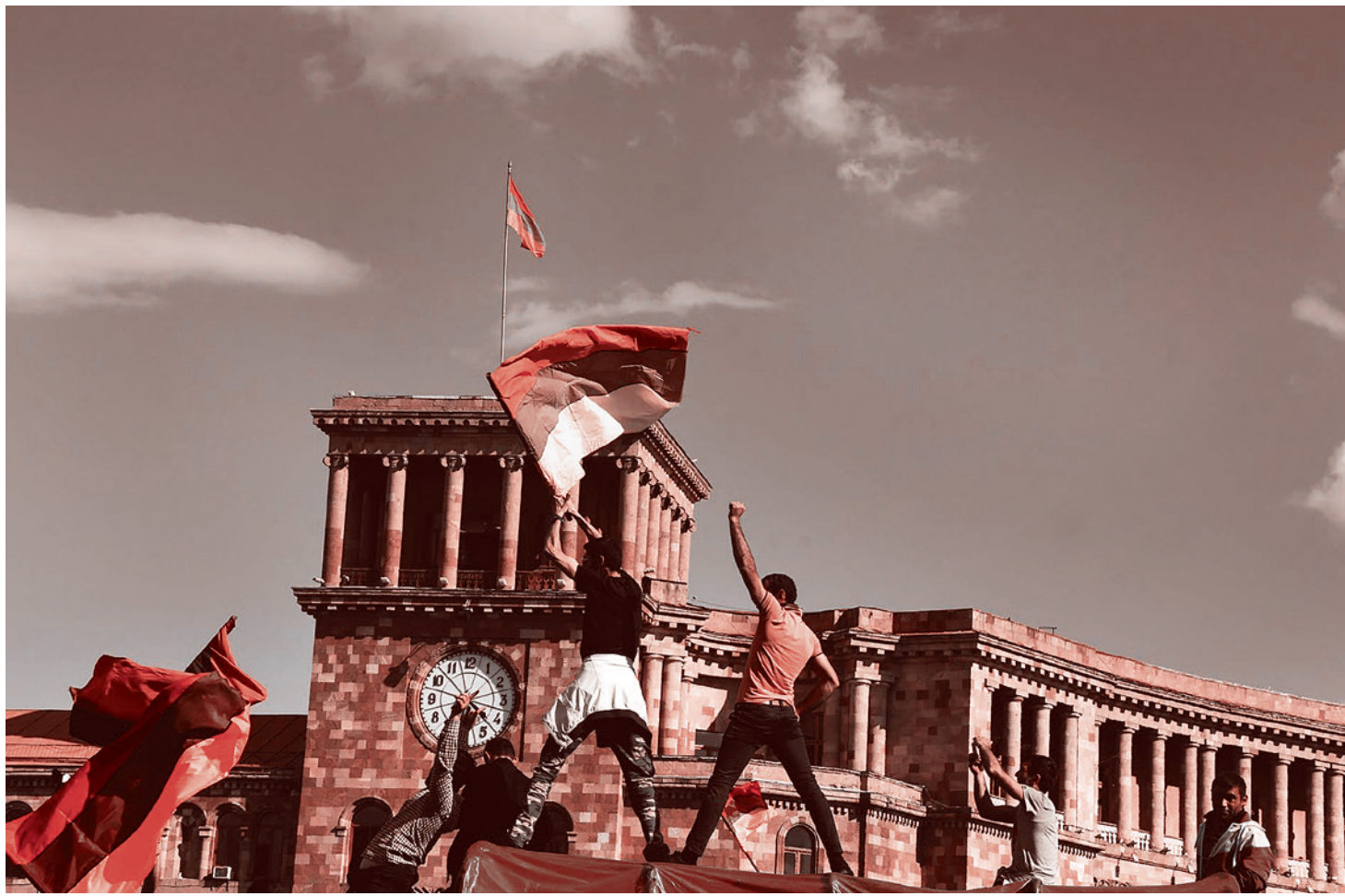
Перевоорот в Армении

11 апреля представители оппозиционного блока партий «Елк» («Выход») зажгли файеры в зале заседаний парламента Армении в знак протеста против назначения Саргсяна премьер-министром республики