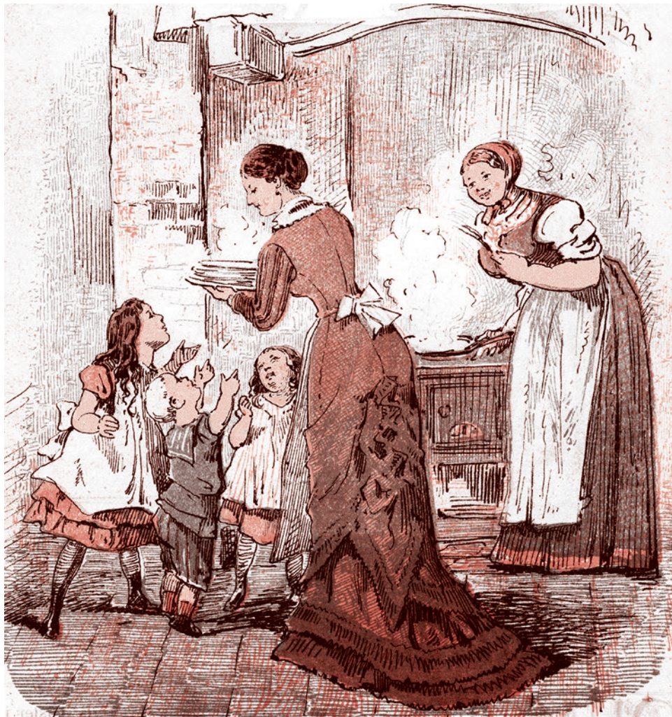
Рисунок из датского журнала «Ринсб» от 9 августа 1877 г. На кухне. «Эмма: „Мама, я хочу 4 блина!“ Тайра: „Мама! Мне нужно 5 блинов!“ Самый мелкий карапуз: „Мама! Мне надо на два блина больше, чем я смогу съесть!“»

Дети, изъятые из семей, помещаются либо в интернаты, либо в семьи, изъявившие желание стать временными опекунами таким детям.