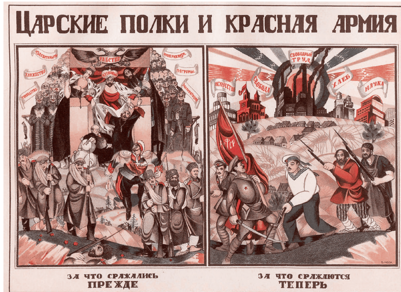
Д. Моор. Царские полки и Красная армия. За что сражались прежде, за что сражаются теперь. 1919

Для подтверждения этого тезиса достаточно взгляда на Украину — ни одна из противостоящих сторон там не согласится со своей антипатриотичностью: родину там любят все. Проблема лишь в том, что эта любовь настолько разнокачествен-