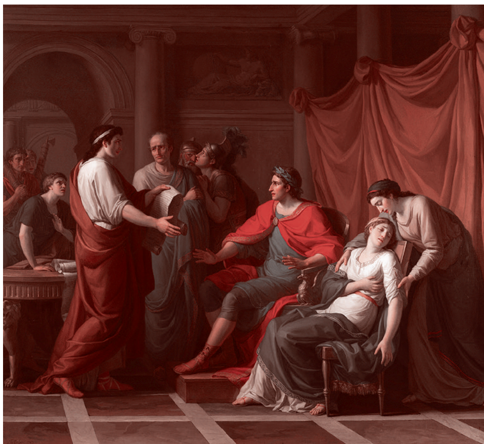
Жан-Жозеф Тайлассон. Вергилий читает Энеиду Августу и Октавии. 1787

Триба только поначалу было три. Затем, по мере завоевания римлянами Италии, количество триб сильно возросло.