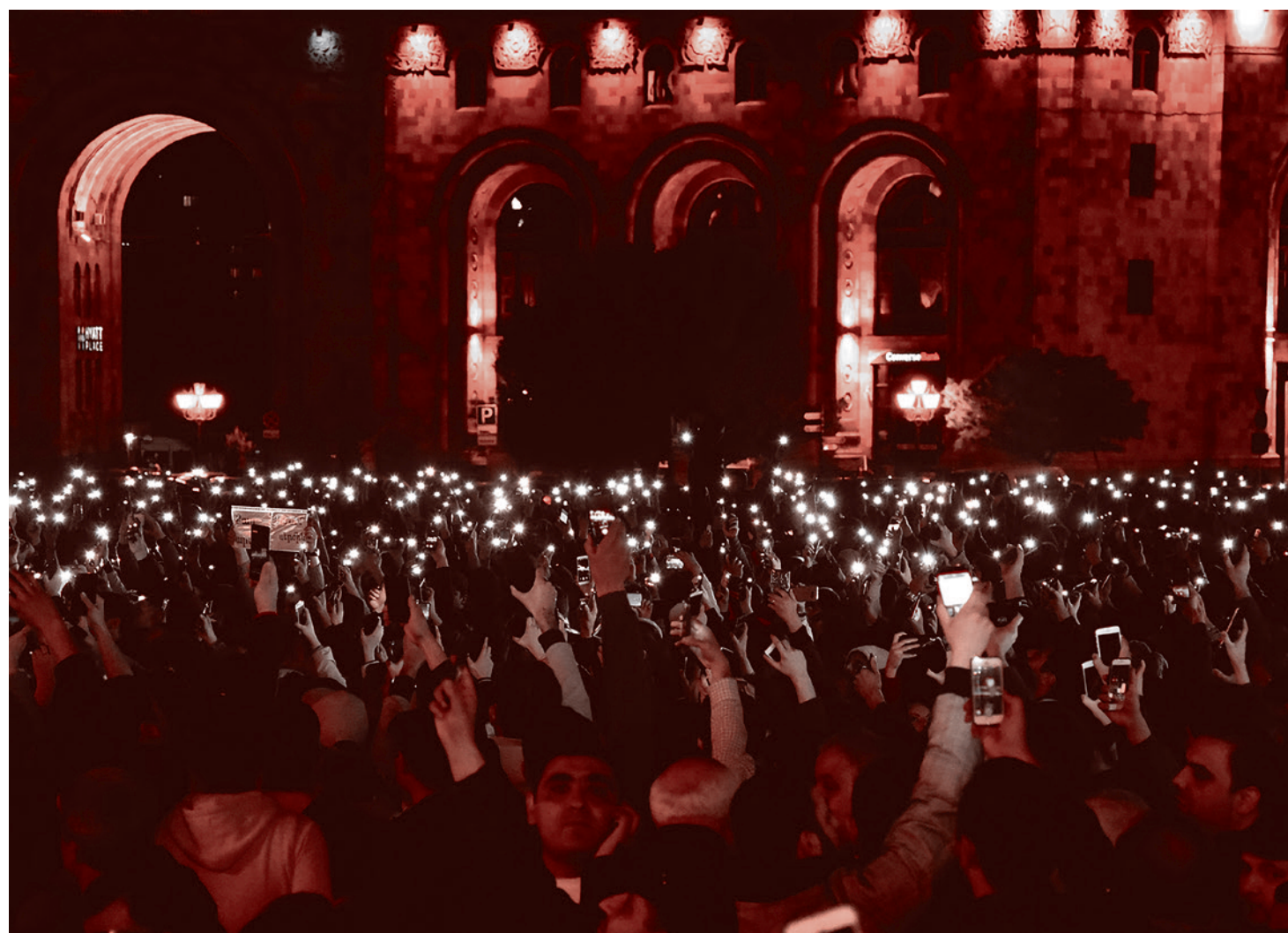
Переворот в Армении. 19 апреля 2018

Он заявил, что понимает, что некоторые представители власти в определенных случаях выступают с оторванным от реальности «гонором». «Я предлагаю всем политическим силам, обеспокоен-