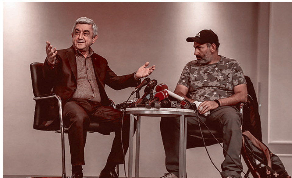
Серж Саргсян и Николом Пашинян. 22 апреля 2018 г.

Премьер Армении Серж Саргсян покинул переговоры с лидером оппозиции Николом Пашиняном. Встреча проходила в гостинице Marriott Armenia на площади Республики — главной в Ереване.