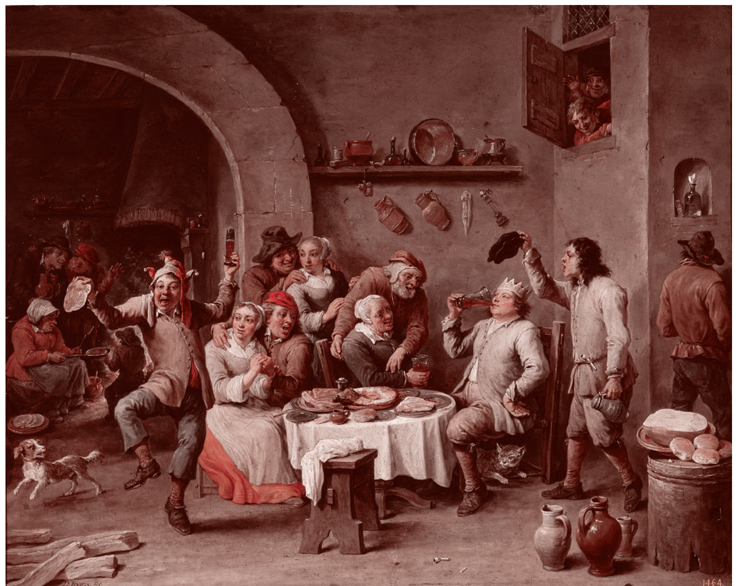
Давид Тенирс Младший. Король пьет (Двенадцатая ночь). 1634-1640