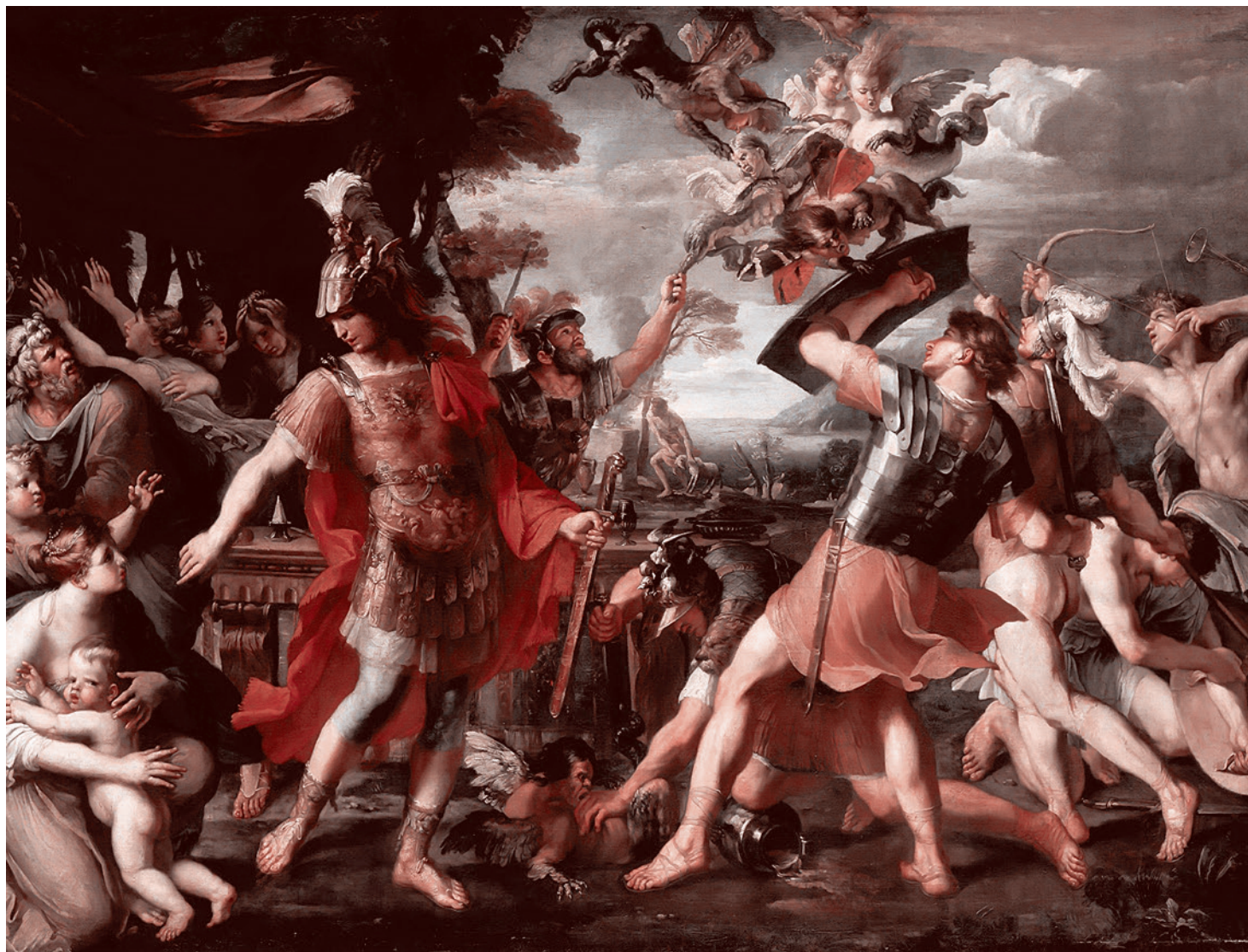
Франсуа Перье. Бой Энея с гарпиями. 1646–1647

Описывая в «Энеиде» Лавинию, дочь царя Латина, не имевшего мужского по-