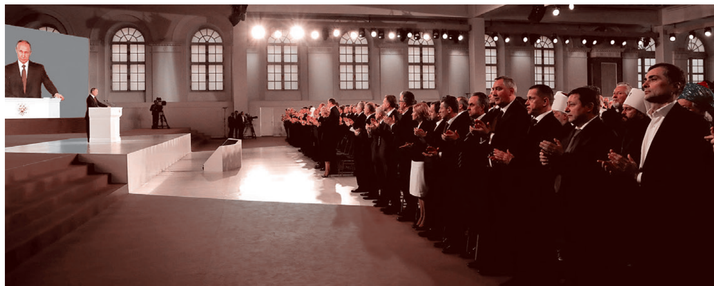
Владимир Путин обращается с Посланием к Федеральному Собранию. 1 марта 2018

Начал Путин с описания борьбы России за сохранение в силе договора по ПРО и действий США по форсированию развития американской ПРО в условиях, когда ослабленная Россия не имела возможно-