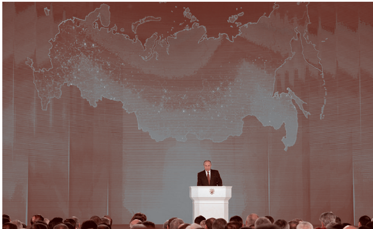
Владимир Путин обращается с Посланием к Федеральному Собранию. 1 марта 2018

транспортной артерией». Хотя и отмечает, что в советское время грузопоток по Севморпути был больше.