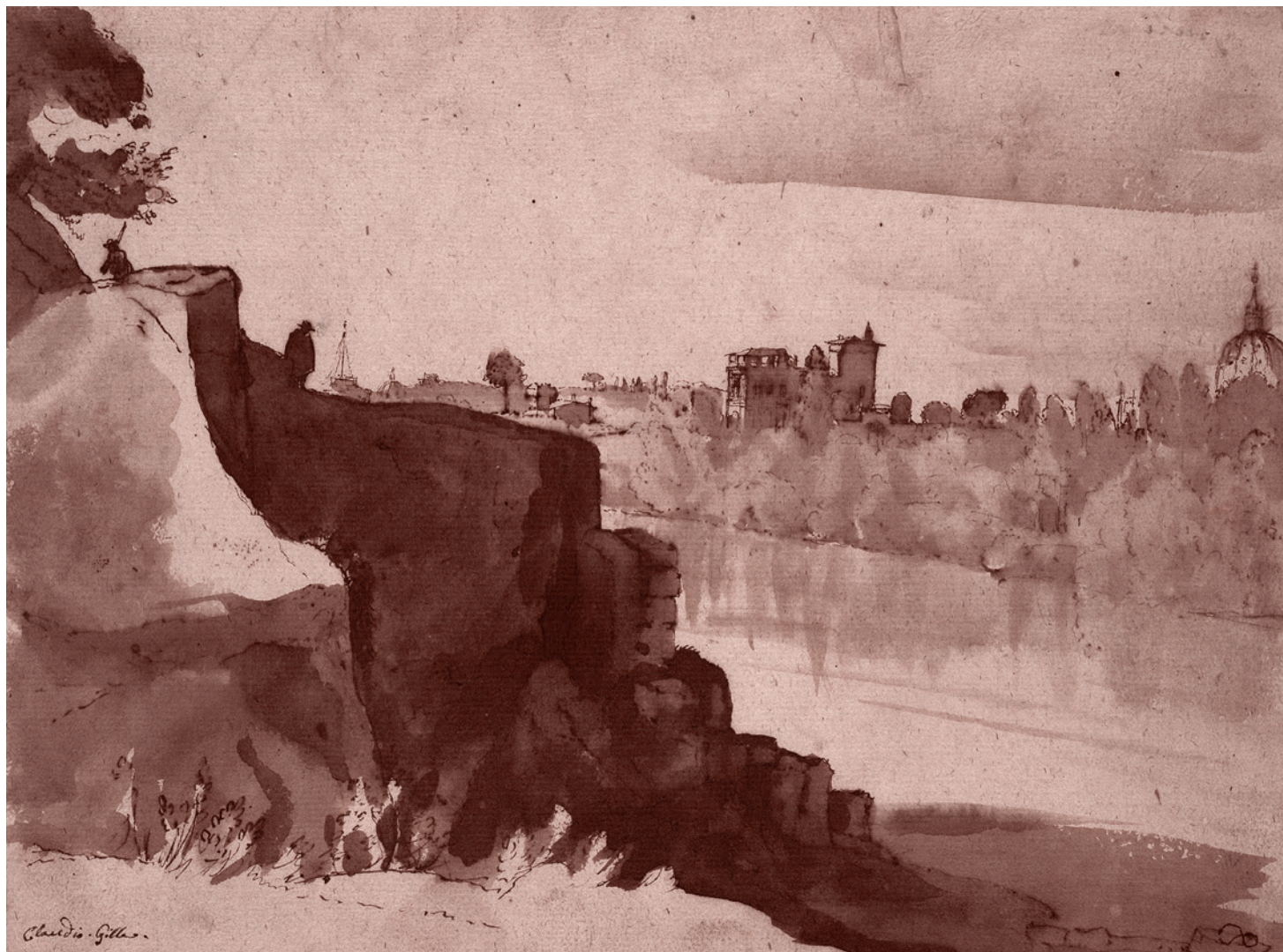
Клод Лоррен. Тибр в Риме. 1635–1640

Девятый из царей Альба-Лонги, легендарный Тиберин Сильвий, по преданию, тонул в реке Альбула, которая в его честь была названа Тибром. Слово «альбула», как считают лингвисты, имеет корень «альба», что означает белый. По преданию, Юпитер сделал Тиберина Сильвия богом и духом-покровителем реки, названной его именем.