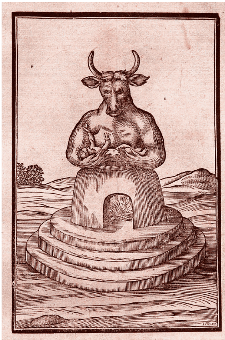
Молох. Библия Мартина Лютера, издание 1753 г.

Этот текст свидетельствует о том, что карнавал с его выворачиванием наизнанку, с его передеваниями, его апелляциями к началу, противоположному божественному, воспринимался не как дань народной культуре, а как полное еретическое, посягающее не только на власть, но и на то священное начало, без трепетного отношения к которому невозможно было существование тогдашнего общества.