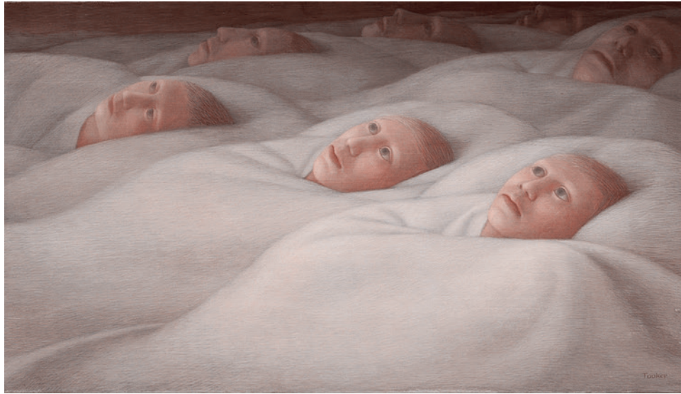
Джордж Тугер. Спящие II. 1959

Когда это произошло — смыслы существования обрушились, окончательно погребя под собою Советский Союз 1.0 и коммунизм 1.0. Именно стремительность этого обрушения, вкупе с нежеланием видеть вину простых позднесоветских граждан страны, и создает этот самый эф-