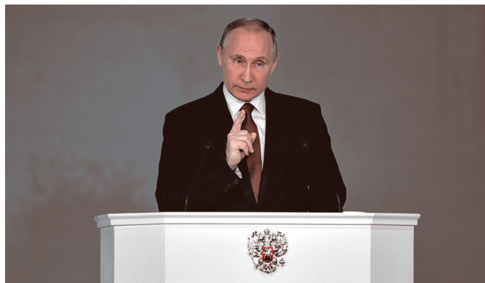
Владимир Путин обращается с Посланием к Федеральному Собранию. 1 марта 2018

Далее Путин предложил «переходить и к принципиально новым, в том числе индивидуальным, технологиям обучения, уже с ранних лет прививать готовность к изменениям, к творческому поиску, учить работе в команде, что очень важно в современном мире, навыкам жизни в цифровую эпоху». Заявил о том, что «обязательно будем поддерживать талантливых, нацеленных на постоянный профессиональный рост учителей... нам нужно выстроить открытую, современную систему отбора и подготовки управленческих кадров, директоров школ. От них во многом зависит фор-