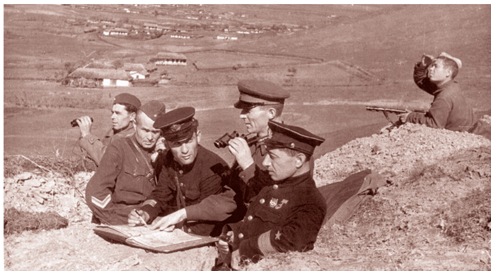
Командиры Красной армии и флота ведут наблюдение под Сталинградом. 1942

1. маневренное сражение в степях на дальних подступах к городу в июле и августе 1942 года;