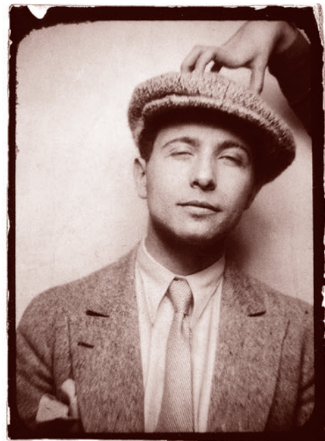
Луи Арагон. 1926–1929

Комментарий, данный Леви, таков: «Христианин на их языке означает человек, а эта поговорка, которую столько раз повторяли при мне, в их устах не более чем безнадежное выражение униженности. Мы не христиане, не люди, нас не считают людьми, мы животные, вьючные животные, и даже хуже чем животные, мы сухие ветки, флористинки, живущие первобытной, бесовской или ангельской жизнью, потому что мы должны подчиняться миру людей, находясь там, за пределами горизонта, и переносить все тяготы соприкосновения с ними. Но эта поговорка имеет гораздо более глубокий смысл, как и каждый символический образ, а именно — буквальный. <...> Христос никогда не заходил сюда, сюда не заходили ни время, ни живая душа, ни надежда, ни разум,