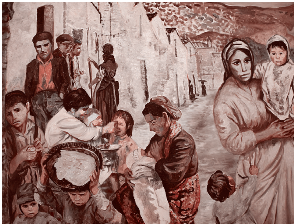
Карло Леви. Христос остановился в Эболи. Фреска (фрагмент) во Дворце Ланфранчи, Италия

От чего страдал обездоленный в эпоху рабовладения, феодализма и капитализма? Он страдал от несоответствия своего бытия тому, что в его эпоху можно было бы назвать сколько-нибудь достойным способом существования.