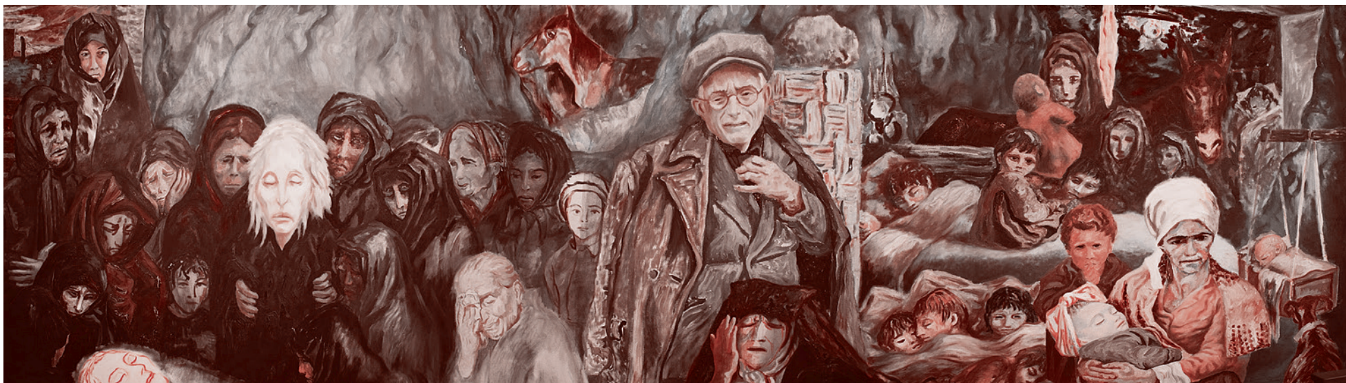
Карло Леви. Христос остановился в Эболи. Фреска (фрагмент) во Дворце Ланфранчи, Италия

Не спорю. Но на исторической или постисторической авансцене сейчас находится не это очевидное страдание от очевидного неблагополучия, а некое расчеловечивание, осуществляемое в формах, не вызывающих у тех, кто этому подвергается, прямого и яростного недовольства, а значит, и некоего вопрошания: «За что, скажите, нас подвергают подобной муке?»