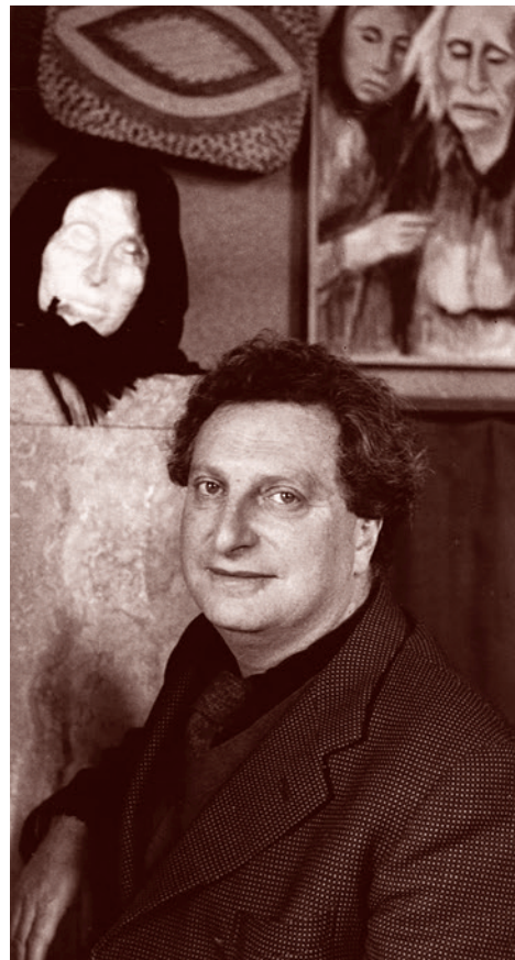
Карло Леви. 1955

Да-да, именно ждут. Причем разрываясь между жадной охотой избавителя и глубоким скепсисом, между стремлением обрести новую жизнь и боязнью потерять имеющуюся. Налицо глубокая противоречивость этих самых обездоленных. А также их глубочайшая несамодостаточность.