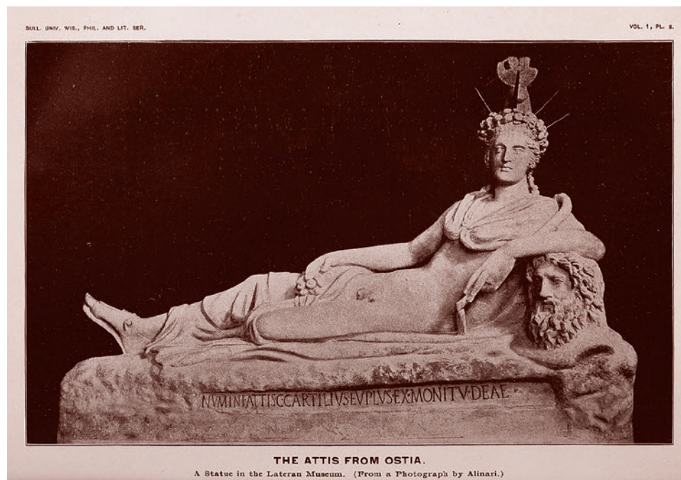
Аттис после оскпления. Фотография скульптуры в Латеранском дворце (Исторический музей Ватикана) из книги «Великая мать богов», 1901 г. издания

Совсем иначе все обстоит в религии. Тут вопрос о первообразе, то есть об образе, породившем остальное, образе первичном и потому фундаментальном, имеет решающее значение. Конечно, и тут бывают казусы. Уран породил Кроноса, но Кронос его кастрировал и утвердил свою власть, а потом сын Кроноса Зевс низверг Кроноса. Но это отдельные особые случаи. В которых всё тоже не так уж просто. Низвергнутые боги сохраняют определенное священное первородство, даже будучи низвергнутыми. Если же рассматривать вариант с Кибелой и всем тем, что порождено этим первообразом, то налицо однозначная ситуация. Именно первообраз имеет решающее значение.