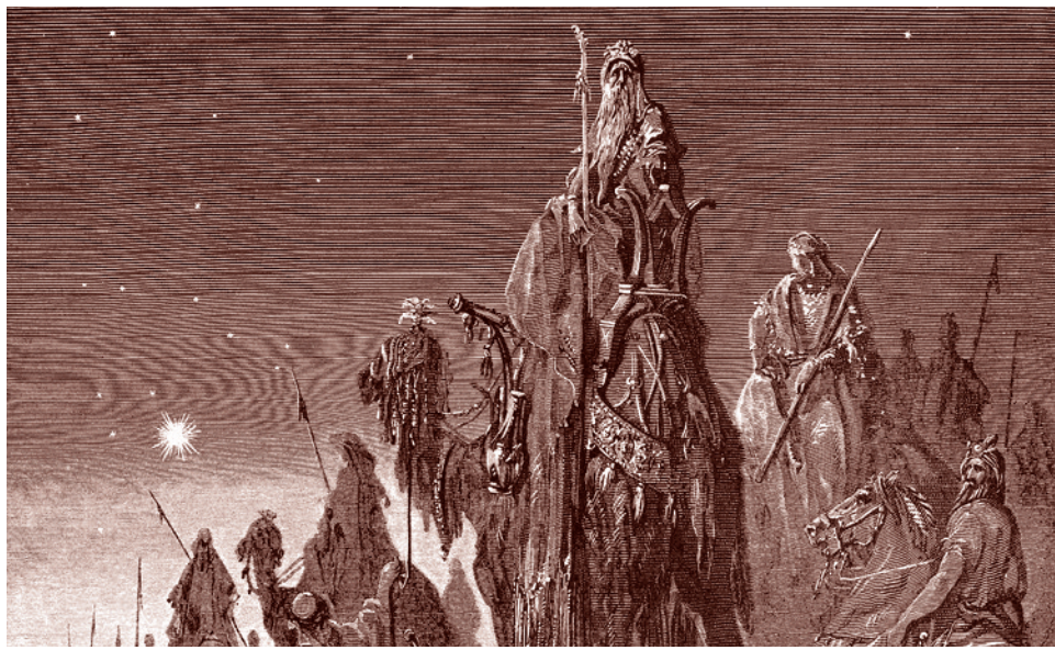
Гюстав Доре. Волхвы, ведомые звездой (фрагмент)

По прочтении этой работы я очень хорошо восстановила в памяти основные положения марксизма. Но проблема-то в том, что свою работу Маркс и Энгельс писали не для студентов — это отнюдь не монография, а сугубо критический, полемический разбор основных течений в немецкой философии того времени. И написана она как раз для творцов и апологетов этой философии, к коим я точно не отношусь. А потому, чтобы адекватно воспринять аргументы критиков теории, нужно ознакомиться с самой теорией в первоисточнике. Тем более что Кургинян в статье, по которой пишется данное сочинение, отмечает: «С Фейербахом все очень не просто», и уточняет, что это касается именно его материализма.