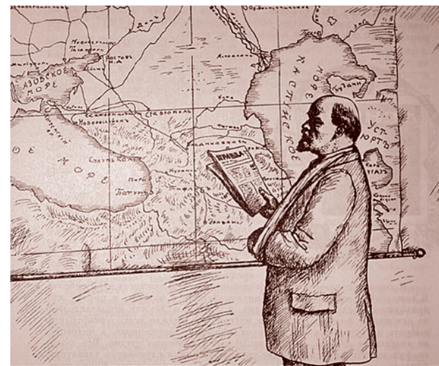
Борис Кустодиев. В. И. Ленин у карты. 1926