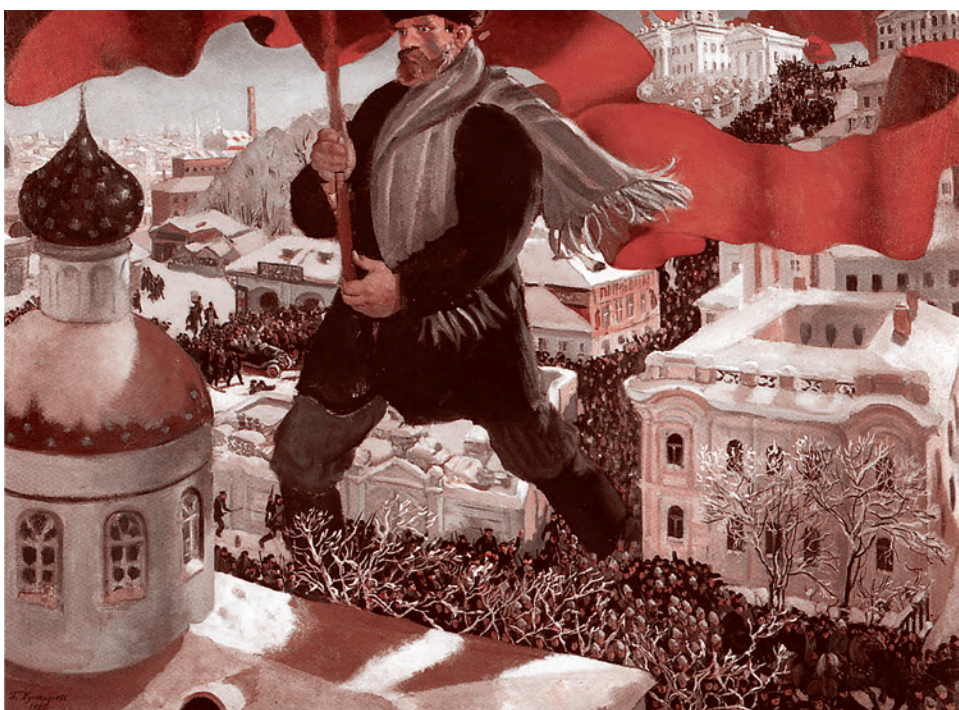
Борис Кустодиев. Большевик. 1920

Лично для меня как историка отечественного искусства чувство горечи при разговорах о «сохранении культурных кодов» России усугубляется отчетливым пониманием той опасности, которой подвергаются эти «коды» в месте, где они