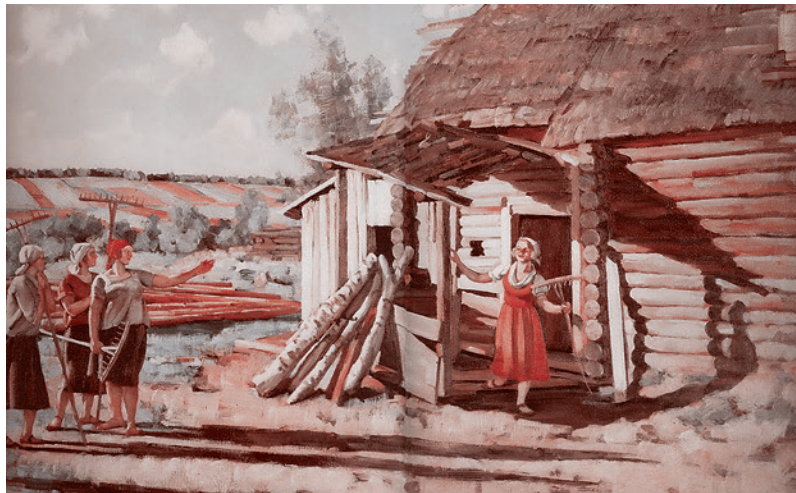
Константин Юон. Первые колхозницы. В лучах солнца. Подolino. 1928