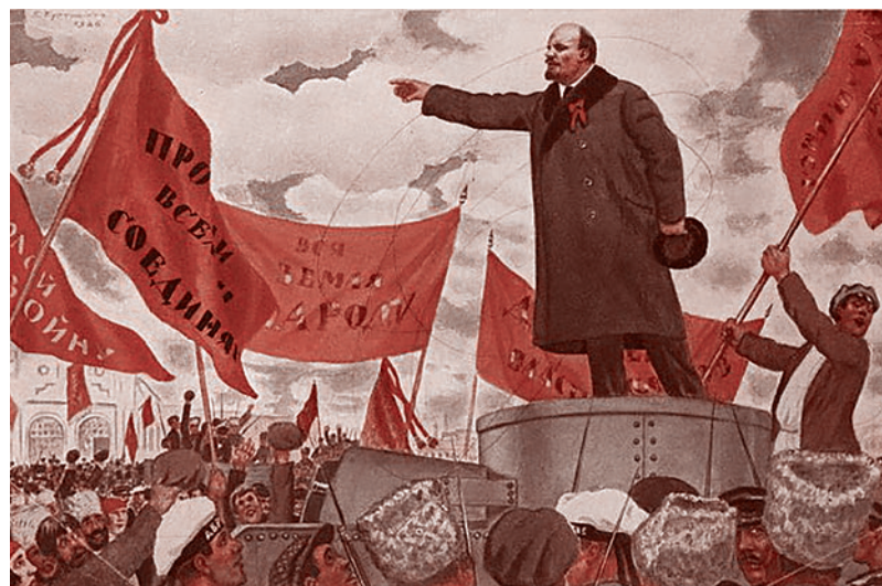
Борис Кустодиев. Преддверие Октября (речь В. И. Ленина у Финляндского вокзала). 1926