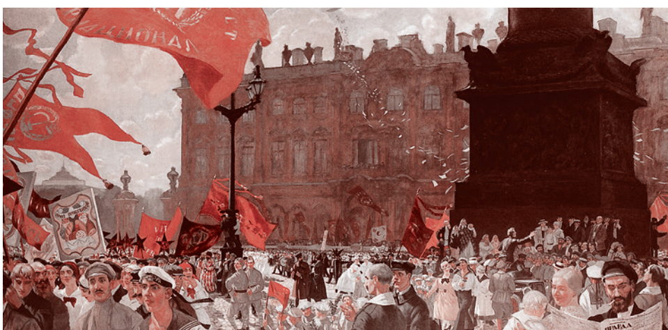
Борис Кустодиев. Праздник в честь открытия II конгресса Коминтерна 19 июля 1920 года. Демонстрация на площади Урицкого. 1921

хранятся в, так сказать, наиболее наглядном виде, а именно — в Государственной Третьяковской галерее.