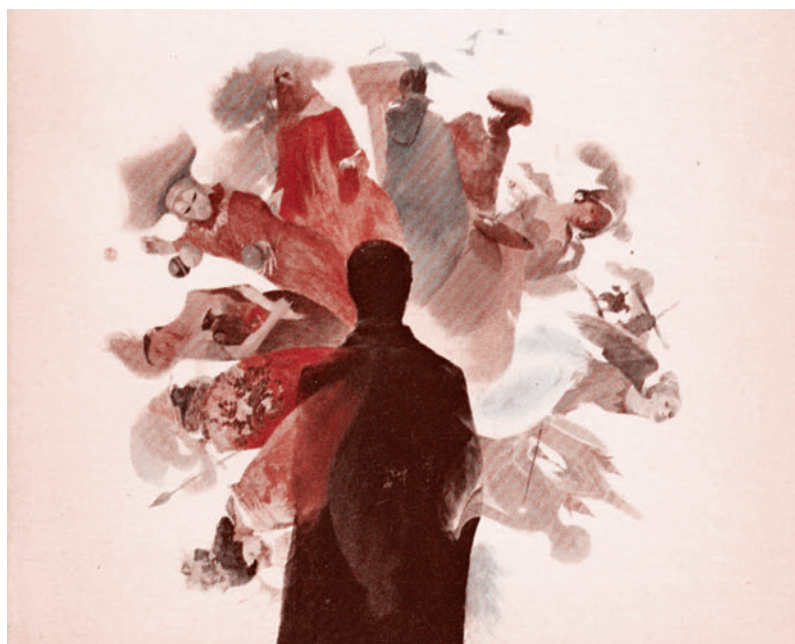
Рисунок с обложки англоязычного издания книги Германа Гессе «Путешествие в страну Востока». 1972