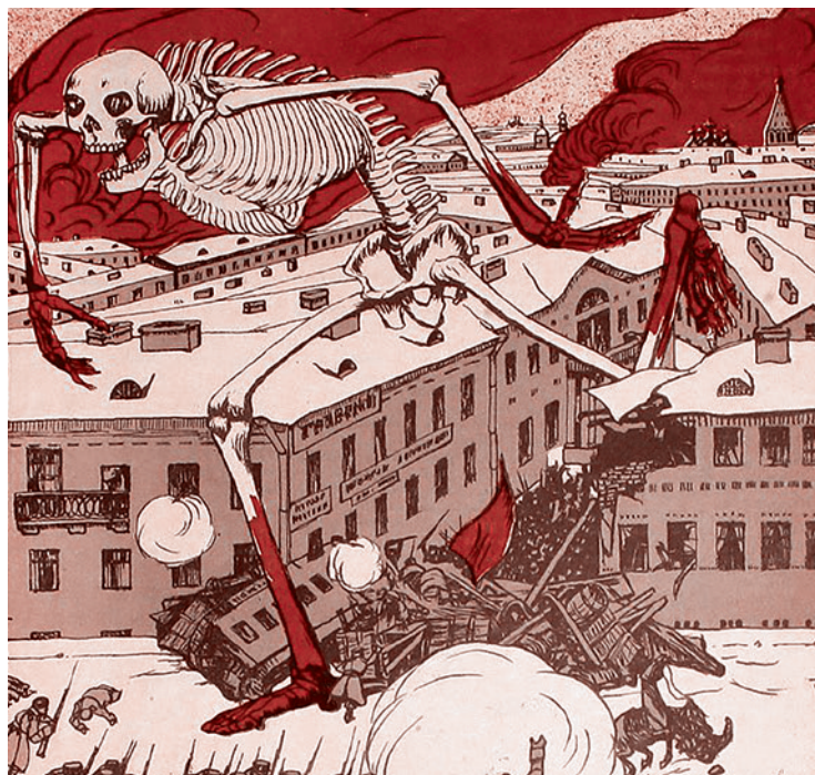
Борис Кустодиев. Вступление. 1905 год. Москва. 1905

этот художник Правды и летописец революции 1905 года был превращен чуть ли не в гламурного и вздорного царедворца.