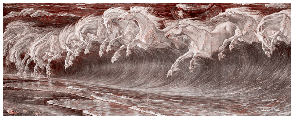
Уолтер Крейн. Лошади Нептуна (фрагмент). 1893

Проследив путь в Аркадию, он сообщает нам, что «налево от так называемого Бесплодного поля, на территории Мантиней есть гора, на ней видны остатки лагеря Филиппа, сына Аминты, и поселка Нестаны».