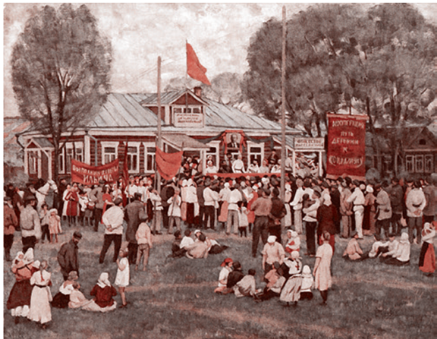
Константин Юон. Праздник кооперации в деревне. 1928