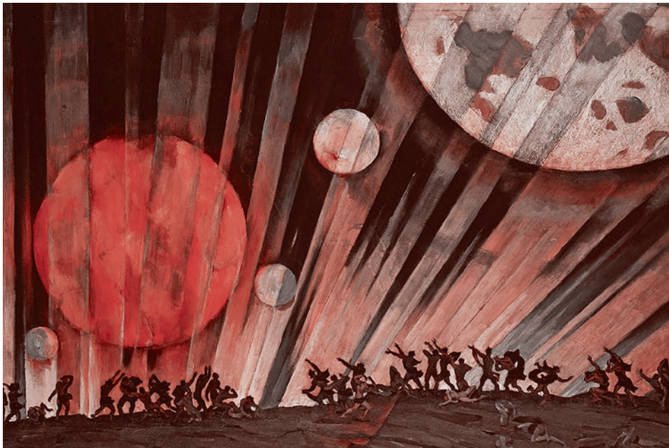
Константин Юон. Новая планета. 1921

Здесь же хотелось бы несколько более подробно обратить внимание читателей на суть манипуляции, проводимой на выставке «Некто 1917» с кустодиевским