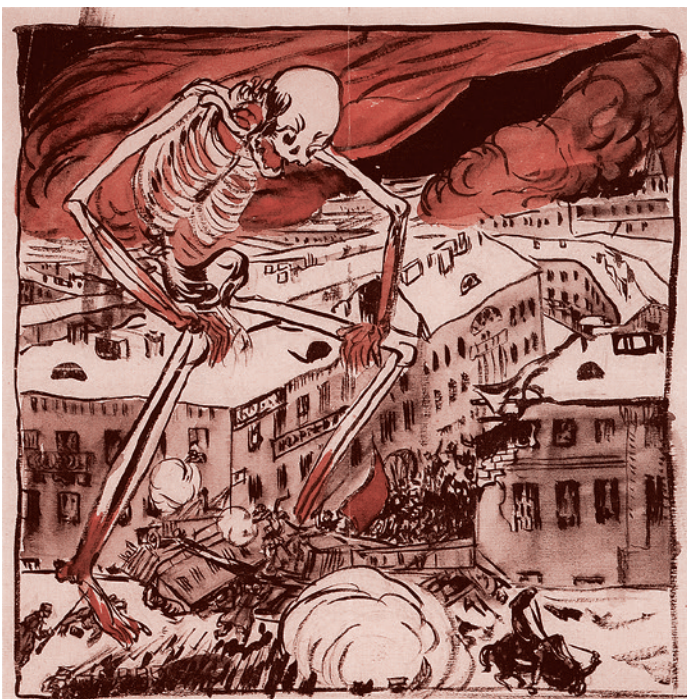
Борис Кустодиев. Вступление. 1905 год. Москва. 1905