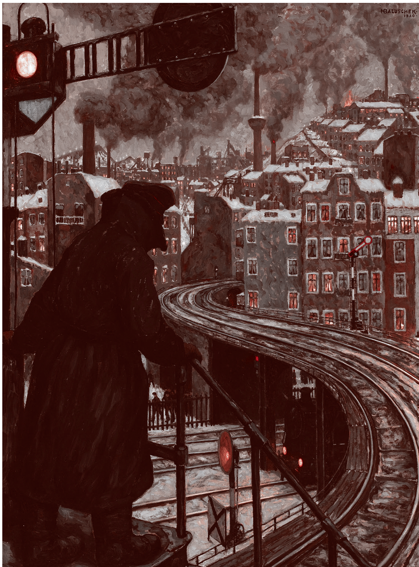
Ганс Балусшек. Город рабочего класса. 1920

Как может возникнуть этот фактор, если он внешний, то есть небытийный, а сознание формируется только бытием? Почему этот фактор, имеющий решающее значение, вообще возникнет? В силу какой закономерности, не имеющей отношения к закону, согласно которому «бытие определяет сознание» и даже противоречащей этому закону?