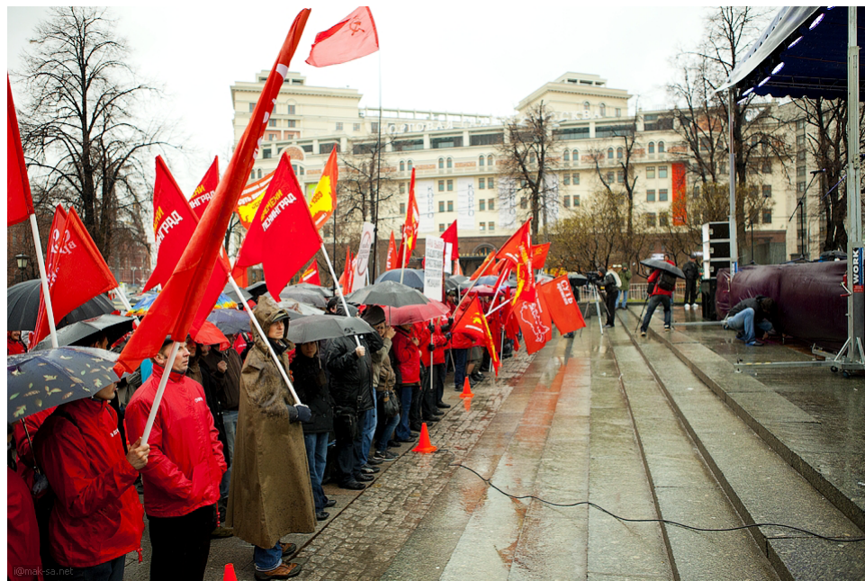
25 апреля 2013 г. Народное Собрание против введения юбальных технологий в России.

Здесь я всего лишь обращаю внимание читателя на то, что Ад для более или менее теологично мыслящих революционеров — это синоним социального дна, мира, в котором проживают жертвы эксплуатации. Луи Арагон по этому поводу написал: «Да, существует Ад! И в нем живут миллионы. / Да, существует Ад! Его свидетель ты. / Ад — это труженник колониофрелоненный». Не он один называет Адом мир, в котором живут эксплуатируемые. Это богатая политическая традиция.