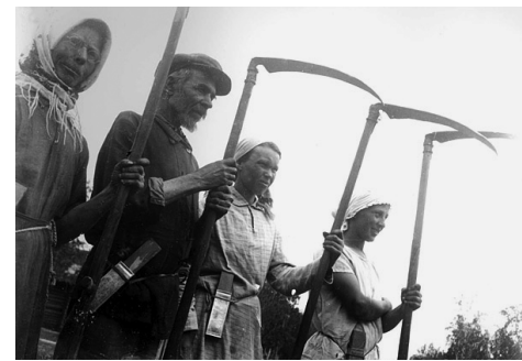
Кимры, 1930-е гг.

«Идеологическая мимикрия» — это антидиалог, диалог «шиворот-навыворот». В качестве завкафедрой Бахтин был обязан