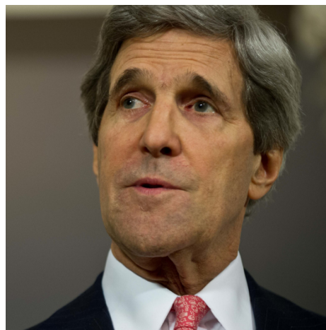
Госсекретарь США Джон Керри, 2013 г.