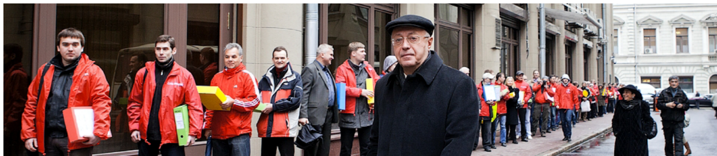
24 апреля 2013 г. Сдача подписей против ювенальных технологий в Приемную Президента РФ.