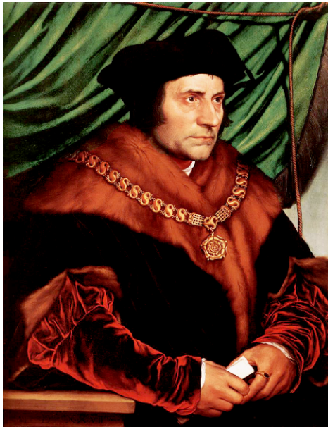
Томас Мор.

Утопия Мора, как и ставшая известной веком позже утопия «Город солнца» итальянца Томмазо Кампанеллы, были одновременно и коллективистскими, и социалистическими. Социалистическими в том смысле,