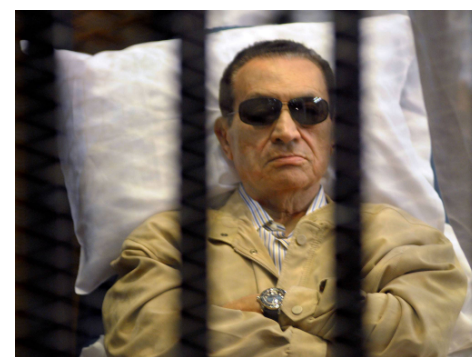
Хосни Мубарак в суде, 2013 г.

Более того, портреты высокого американского гостя жгли во время акции