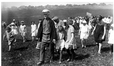
Кимры, 1930-е гг.

Характеристика из школы № 14 лаконичная: «хороший общественник». А из школы № 39 — развернутая: Бахтин назван «отличным общественником», ведущим культурно-просветительскую работу как в стенах школы (кружки), так и за ее пределами (лекции для Партийного комитета Савеловского узла Ярославской ж.д.). Мало того — искусно сочетавшим в своей педагогической работе «методическое мастерство и высокую требовательность к предмет-