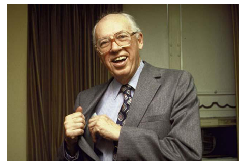
Уильям Кейси — 13-й директор ЦРУ

Однако решились на исполнение этого обещания немногие. Слишком сильно европейская торговля зависела от крупнейшего американского рынка. И очень скоро советские промышленные проекты (прежде всего, газопровод) столкнулись с сокращением