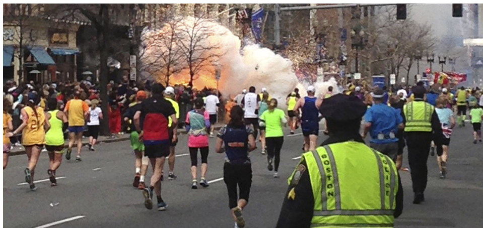
15 апреля 2013 г. Взрыв у финиша Бостонского марафона.