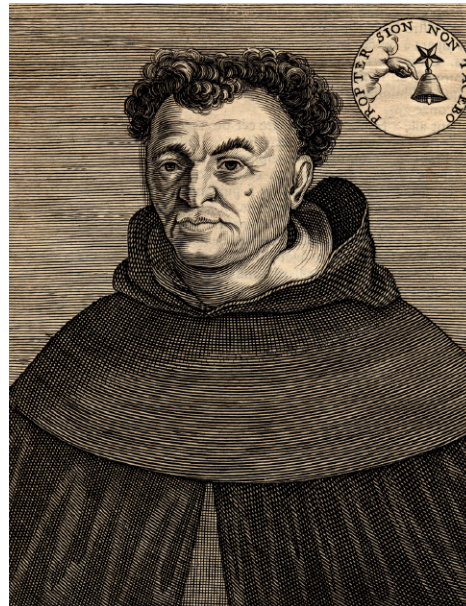
Томмазо Кампанелла.

Бабёф, в отличие от других революционных групп Французской республики, подчеркивал, что раздел имущества аристократии и буржуазии между обездоленными не способен обеспечить равенства. И что гарантии подлинного равенства заключаются только в общем труде и общем потреблении. Бабёф и его сторонники были убеждены в том, что установление коллективистского строя настоящего равенства («эгалитарного», от французского корня «равный») сможет обеспечить