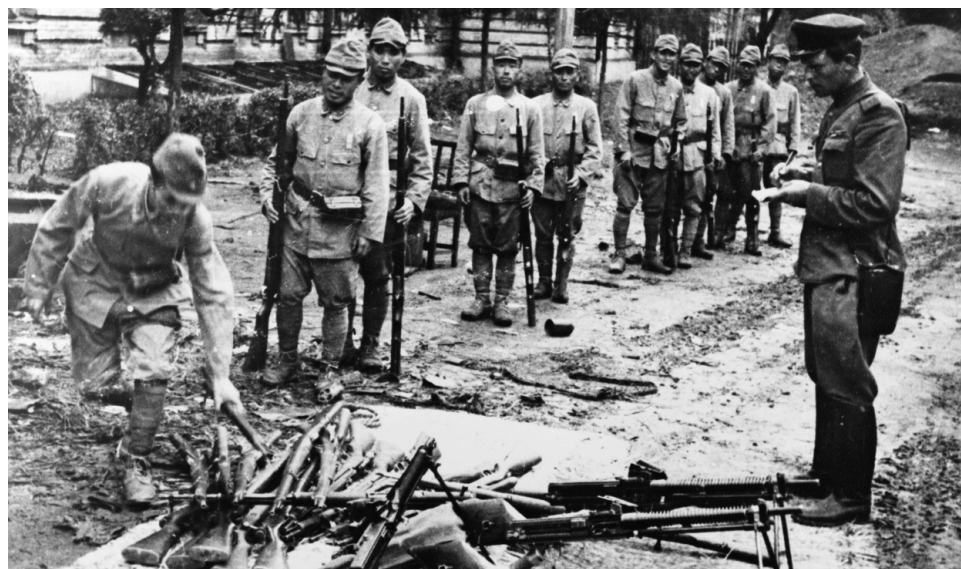
Японские солдаты сдают свое оружие советскому офицеру, август 1945 г.