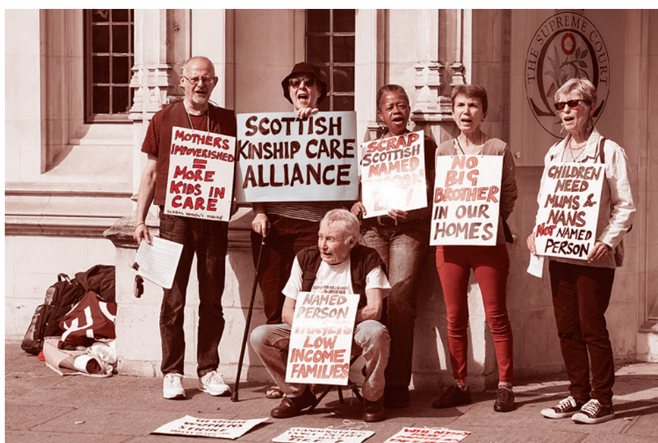
Протестующие против Named person перед зданием Верховного суда в Лондоне. 2016

Под давлением лоббистских глобалистических структур национальные государство передает — одну за другой — свои важнейшие функции. Кому передает? Неким НКО, производящим некие услуги, которые каким-то загадочным образом превращаются из услуг в диктуемые, обязательные для исполнения новые нормы жизни.