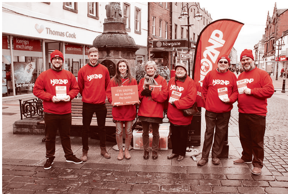
Протестующие против Named person в Фалькирке. 2016

Национальное государство всё более и более подтачивается изнутри глобалистической лоббистской суперструктурой. Оно преисполнено самоубийственным желанием уклониться от своих прямых обязанностей, касающихся всей социальной сферы и сферы семейных отношений в первую очередь.