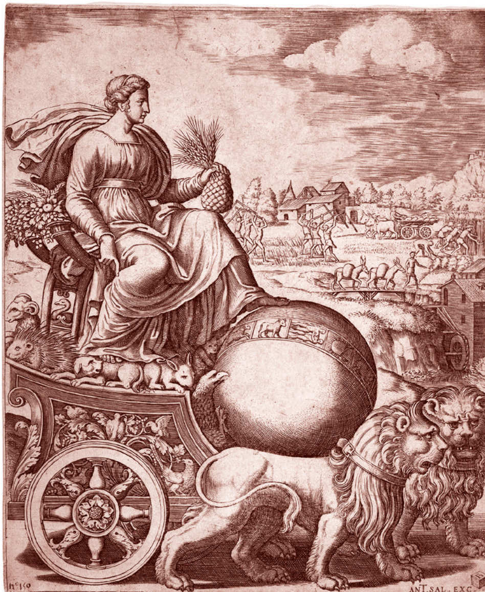
Кибела в колеснице, запряженной львами. 1530–1560

Итак, в построениях Зелинского древняя Мессения является хранительницей определенной религиозной традиции,