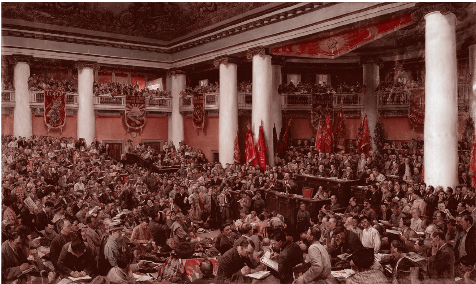
И. И. Бродский. II Конгресс Коминтерна. 1924

Сталин строил новое общество вплоть до 1953 года. То есть в течение 33 лет после речи Ленина. И что же, выходит, что он не мог построить даже фундамента? И остальные тоже? Ведь в момент, когда Ленин произносил эти слова, никакого предчувствия скорой гибели ближайших соратников у него по определению быть не могло. Он мог предположить, что они десятилетиями будут нечто строить, но в силу своих социогенетических свойств, своей личностной обусловленности жизнью при капитализме, с которым они боролись, эти люди не могут построить нового общества. Кстати, как сами эти люди должны были воспринимать слова Ленина?