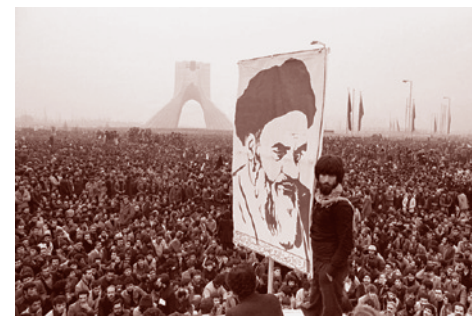
Революция в Иране, 1979 г.

В январе–апреле 1979 г. в Иране вполне лояльный к СССР шахский режим сменился радикально-исламистским режимом Хомейни, сразу объявившим СССР «вторым» (после США) «шайтаном» (то есть, дьяволом), и начавшим политические и военные провокации не только на советской границе, но и в республиках Средней Азии.