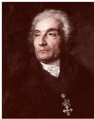
Жозеф де Местр