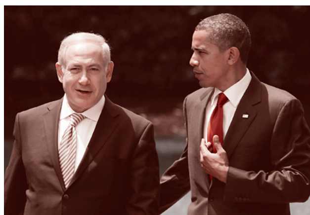
Президент США Барак Обама и премьер-министр Израиля Биньямин Нетаньяху