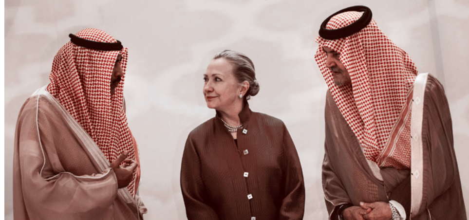
Сауд аль-Фейсал, Хилари Клинтон и Халед аль-Фейсал, март 2012 г.

Понимают ли это любители крупных инвестиций, готовые и дальше принимать у себя на территории ваххабитских проповедников? Какое место может занять Россия в таком исламско-халифатистском проекте? Да и татары — тоже?