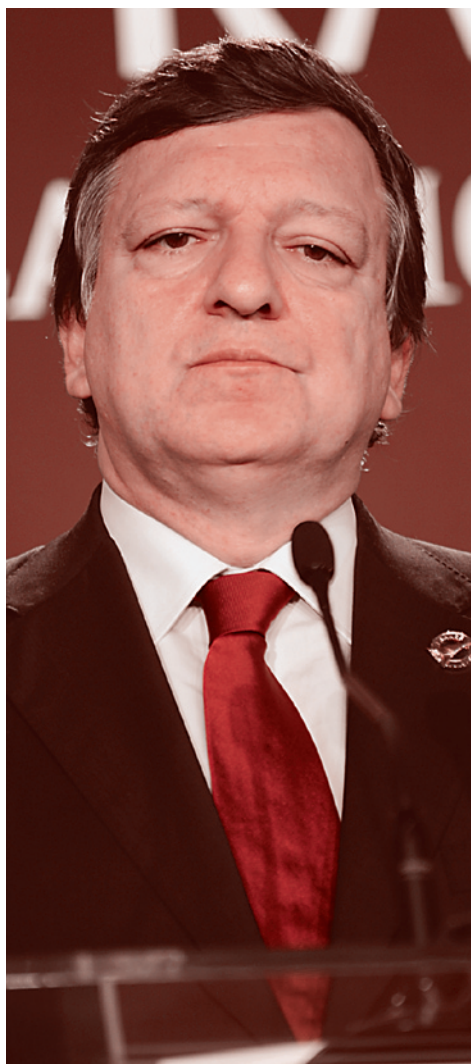
Жозе Мануэл Баррозу