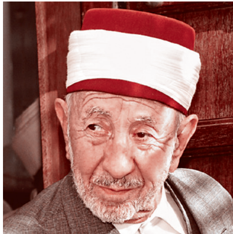
Мухаммад Саид Рамадан аль-Бути

Согласитесь, процитированный духовный наставник более чем далек от умеренности: не сближение и диалог масхабов (по аль-Бути) должно спасать исламскую веру от гибели, а смертная казнь за отступничество (ведь Карадави имеет в виду именно это и ничто другое). При этом содержание категории «отступничества» может трактоваться