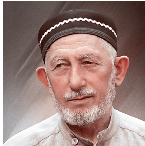
Саид Афанди аль-Чиркейский

ваться в зависимости от меры радикализма толкователя. А мера радикализма, как мы видим, уже такова, что зверски уничтожаются признанные исламские духовные авторитеты. Ведь, с самых крайних точек зрения, все, кроме радикальных ваххабитов, — отступники.