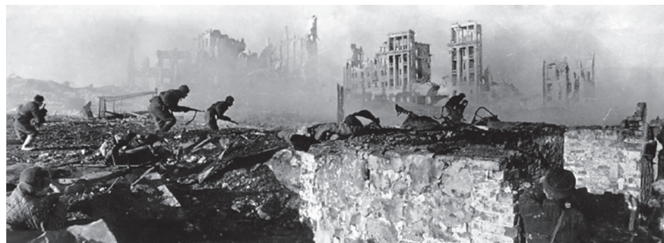
Советские солдаты штурмуют дом в Сталинграде. Декабрь 1942 г.

В 1942 году вермахт уже не мог, как в начале войны, наносить удары по трем стратегическим направлениям — сил и средств хватало лишь на одно. Новым направлением удара было выбрано южное. Разгром южной группировки советских войск и овладение Кавказом позволили бы вермахту решительно ослабить СССР, обеспечить свои войска советской нефтью, а также подтолкнуть Турцию и Японию к вступлению в войну. Затем предполагалось нанести завершающий удар на Москву и закончить войну осенью 1942 года.