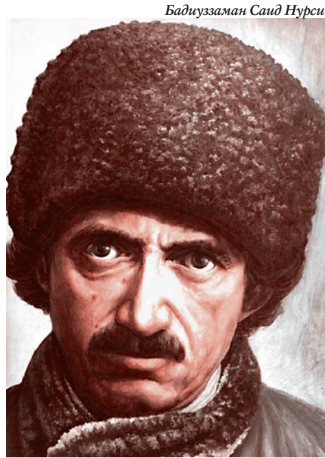
Бадиуззаман Саид Нурси