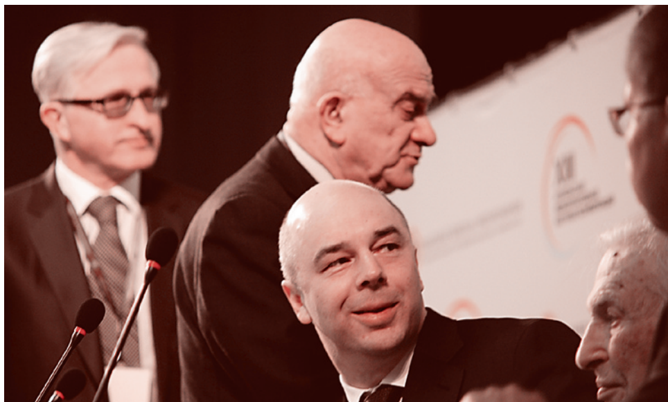
На конференции в ВШЭ обсуждают проблемы модернизации экономики и общества

«серьезные проблемы для всего общества» — чтобы приблизить и активизировать вождь-ленную перестройку-2.