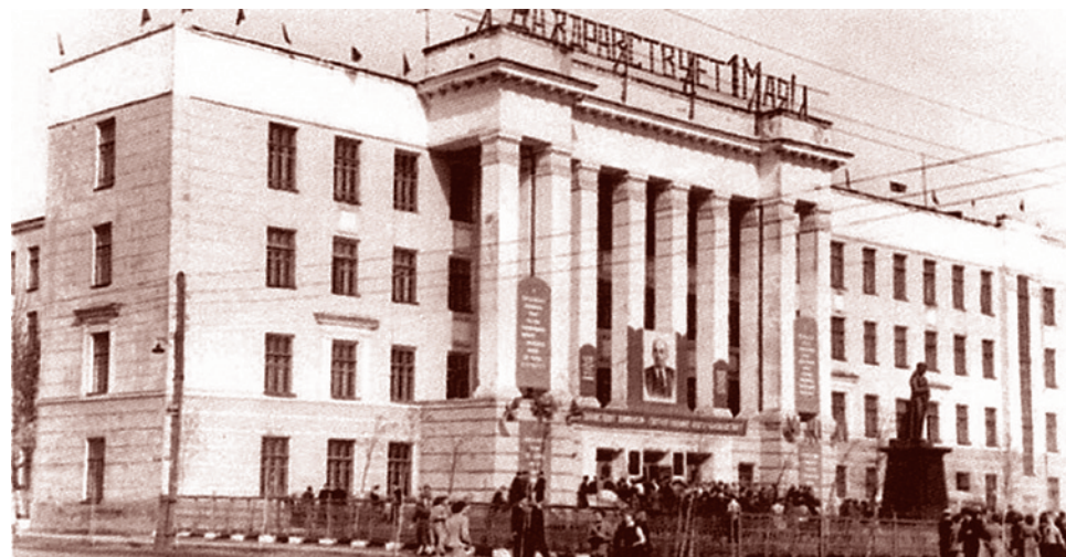
Здание Мордовского государственного университета, 1950-е годы

Возьмем, к примеру, Пигулевскую, имевшую отношение к все той же Телеме. Нина Петровна Пигулевская — крупный советский специалист по истории стран Ближнего и Среднего Востока и Византии в раннее средневековье. Пигулевская проходила с Бахтиным по делу организации «Воскресение» и получила пятилетний срок. Однако это не помешало ее последующей карьере. Отбыв срок и вернувшись в 1934 г. в Ленинград, Пигулевская в период с 1934 по 1941 г.