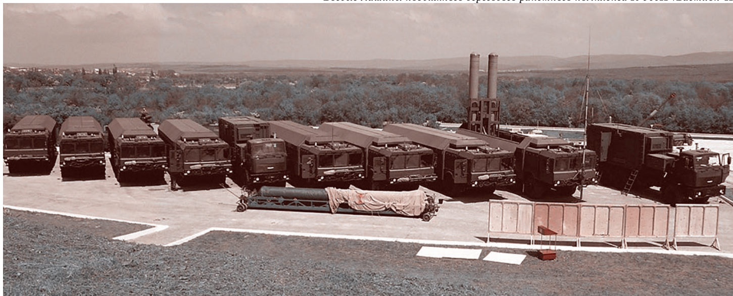
Боевые машины подвижного берегового ракетного комплекса К-300П «Бастион-П»

В 2017 году военный бюджет НОАК увеличится на 7% по сравнению с прошлым годом и составит более 1 триллиона 78 миллиардов юаней (около 156 миллиардов долларов).