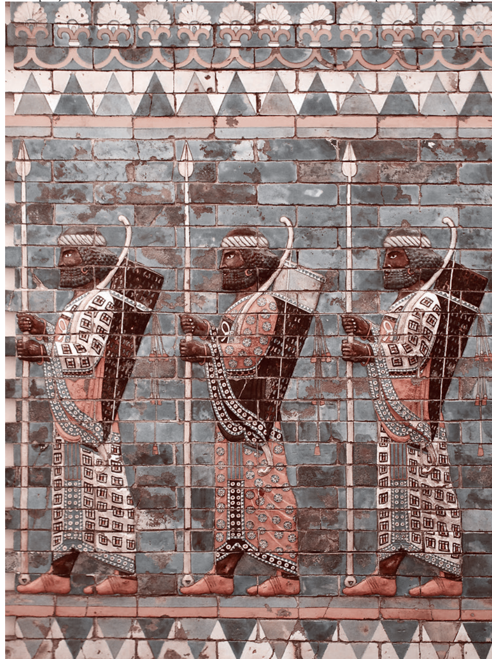
Изразцовый рельеф из дворца Дария I в Сузах. Около 510 г. до н.э., Пергамский музей, Берлин

Далее он повествует о том, как враждующие греческие города заигрывали с персами. Вот один из примеров подобного заигрывания, проводимого неким Гиппием (570–490 гг. до н.э.), афинским тираном, сыном другого тирана Писистрата (602–527 гг. до н.э.). Когда афиняне избавились от тирании Гиппия, то он, как сообщает Геродот, «прибыл в Азию и пустил все средства против афинян: он клеветал на них Артафрену (младший брат Дария, сатрап западно-малоазийской