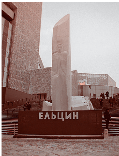
Памятник Б. Н. Ельцину в Екатеринбурге.

Обе точки притяжения ежедневно посещают сотни людей. На концерты и праздники «Ельцин-центра» собираются тысячи горожан. С другой стороны, фестиваль «Царские дни», который проходит в середине июля и приурочен к убийству царской семьи, собирает до 50 тысяч человек — столько же в Екатеринбурге выхо-