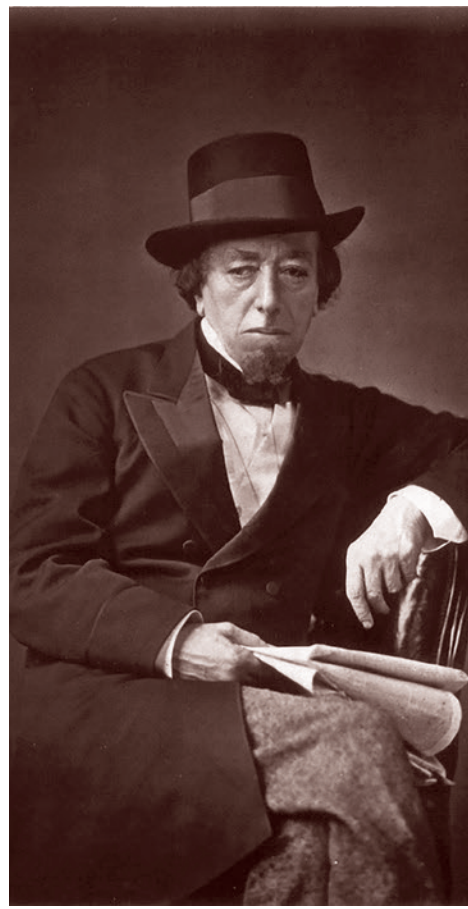
Бенджамин Дизраэли. 22 июля 1878 г.

Маркс говорит Вейдемейеру и всем своим сторонникам: « Не поддавайтесь соблазну присвоить себе чужие заслуги, не говорите, что я и вы вместе со мной открыли феномен классовой борьбы. Это, во-первых, неправда, а надо говорить правду. А во-вторых, это вместо завоевания неких ложных лавров обернется для нас огромным политическим уроном ».