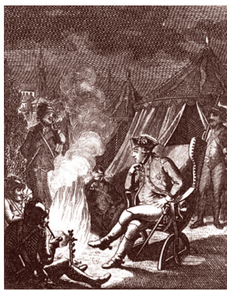
Суворов недалеко от Праги в 1794 году. 1798 г.

А вот его высказывания, которые характеризуют Суворова как человека, глубоко созвучного русским и христианским нравственным императивам.