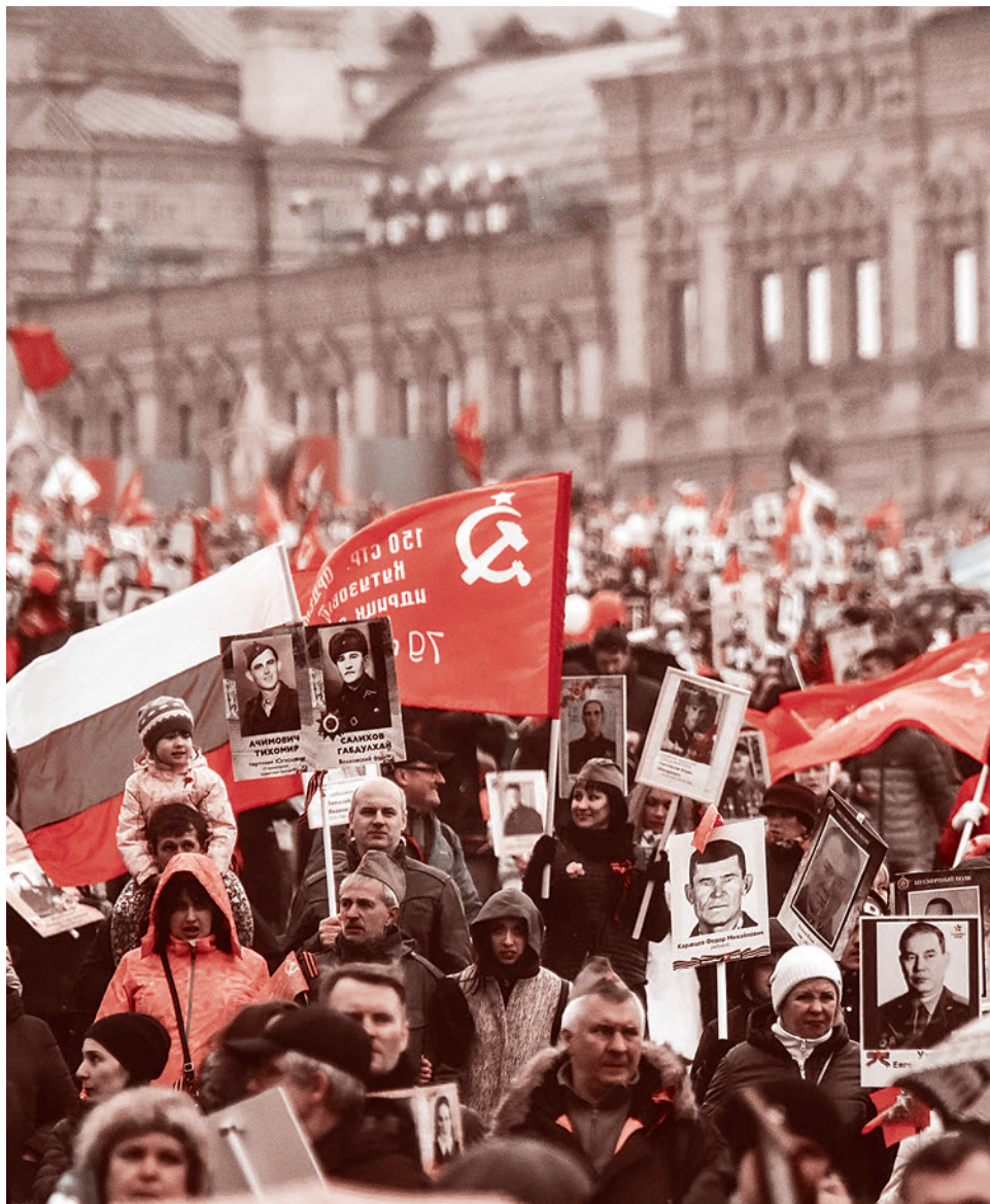
«Бессмертный полк» в Москве.

Но всмотритесь глубже. Герои войны 1812 года уж никак не объединят нас со всем миром. «Бессмертный полк» станет исключительно русским, в нем не будет