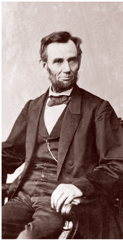
Абраам Линкольн. 8 ноября 1863 г.

Вы это слышите и отвечаете своему противнику: «Эй ты, господин марксист, мы тут реальным делом заняты, боремся с остатками общеевропейского феодализма, с прусским монархизмом, с буржуазным авторитаризмом. А ты обесцениваешь эту нашу борьбу, называя ту цель, ради которой, по нашему мнению, надо жертвенно бороться во имя спасения человечества, — фикцией. Так на кого ты работаешь, по су-