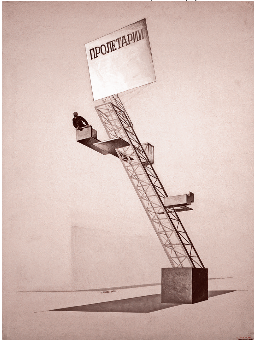
Эль Лисицкий. Эскиз трибуны для Ленина. 1920 г.

По его словам, государственный Институт национальной памяти переписывает историю Второй мировой войны в угоду действующим властям, которые хотят видеть в членах ОУН (организация, деятельность которой запрещена в РФ) «народных героев». «Сегодня многие прославляют активистов ОУН-УПА (организация, деятельность которой запрещена в РФ) как борцов за свободу. Но мало кто вспоминает об их идеологии, пропитанной антисемитизмом и ксенофобией. В своем стремлении «очистить» этнос ОУН (организация, деятельность которой запрещена в РФ) превратилась в соучастницу Холокоста. Ее члены также уничтожили порядка 100 тысяч поляков», — сказано в статье.