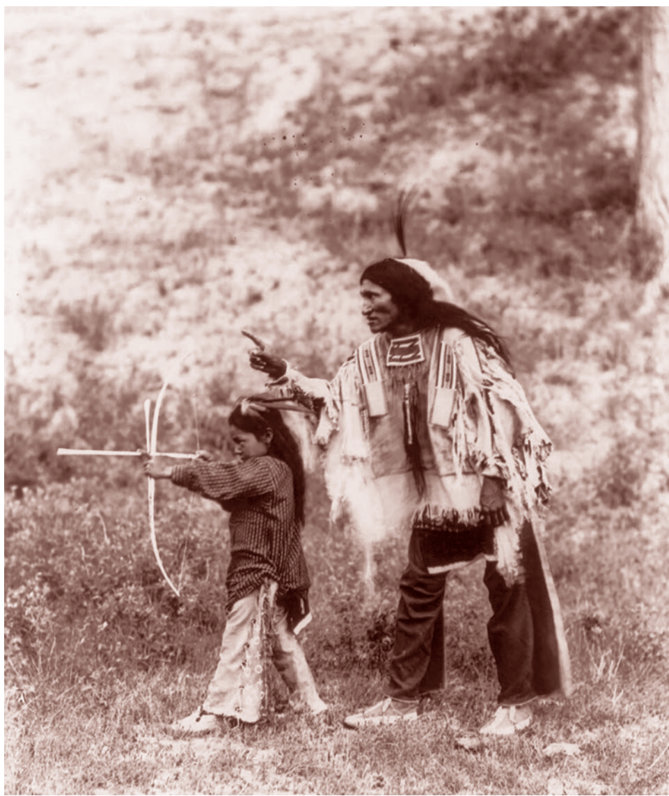
Пинаящий Медведь обучает сына стрельбе из лука. 20 июня 1900 г.

Вославляя детскость, праздничность, непоследовательность, постоянное перескакивание на качественно разные поля праздничности, объединенные лишь праздничностью как таковой, посягают на сам принцип человечности, на идею человеческого восхождения, человеческой способности к усложнению, осуществляемому и в пределах одной жизни, и за счет передачи поколенческой эстафеты.