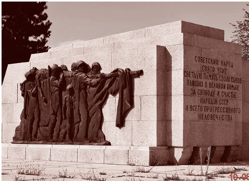
Мемориал в Маутхаузене. 2014 г.

Вокруг памятника посадили деревья, которые теперь никто не стрижет. Даже когда опадает листва, он почти не виден снаружи. Его удастся увидеть лишь тогда, когда посетитель догадается подойти к лесополосе напротив него. То есть памятник — и не случайно — спрятали в деревьях. Те, кто ведет против нашей Родины информационно-психологическую войну (ИПВ), делают свое дело профессионально. Это — лишь одно из ее проявлений. А на войне, как известно, мелочей нет.