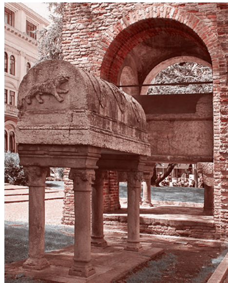
Гробница Антенора в Падуе

Эсиета-Антенора является совершенно чужим в совокупности троянских родов, которая сама по себе лишена внутренней однородности. Внутри этого неоднородного сообщества род Антенора-Эсиета, видимо, является каким-то совсем уже чужим для некоей — между прочим, достаточно нетривиальной — троянской элиты.