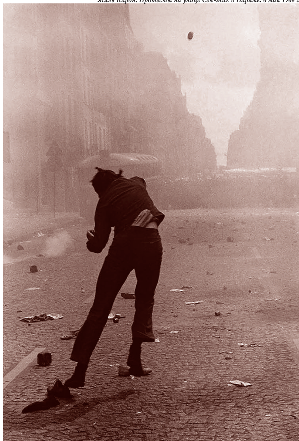
Жиль Карон. Протесты на улице Сен-Жак в Париже. 6 мая 1968 г.

Газета «Суть времени» зарегистрирована Федеральной службой по надзору в сфере связи, информационных технологий и массовых коммуникаций (Роскомнадзор) Свидетельство ПИ № ФС77-50554 от 9 июля 2012 года