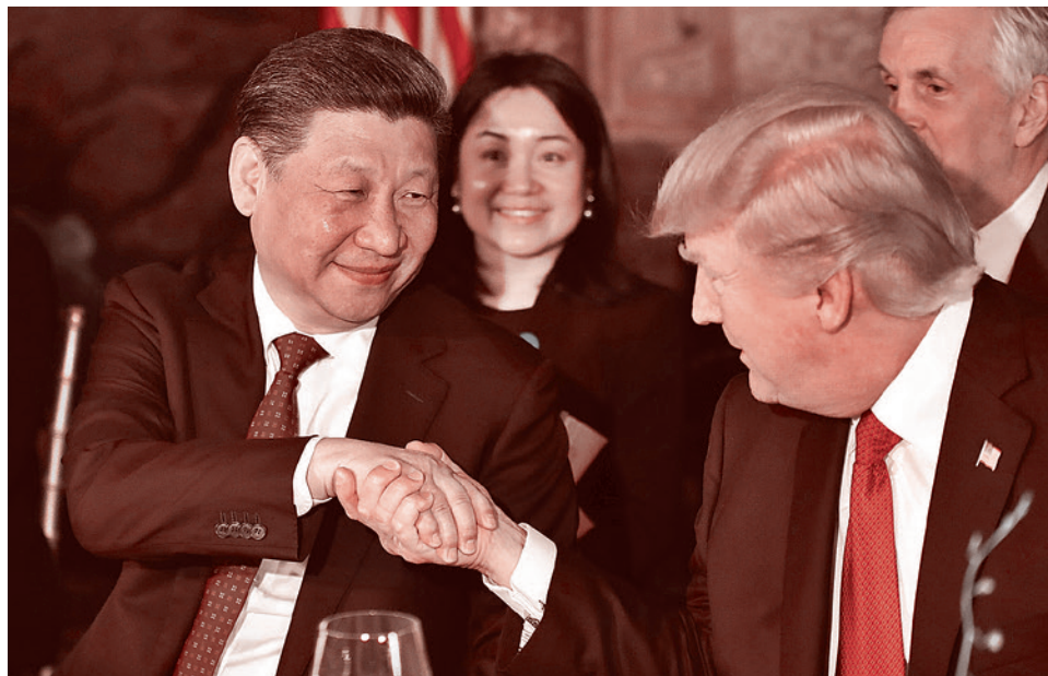
Си Цзиньпин и Дональд Трамп. 7 апреля 2017 г.

При этом он заявил, что события в Идлибе не должны остаться без последствий для Асада. «Я думаю, что произошедшее в Сирии — это позор для человечества, и он там (Асад на своем посту — ИФ), и я догадываюсь, что он там руководит делами, так что я думаю, что-то долж-