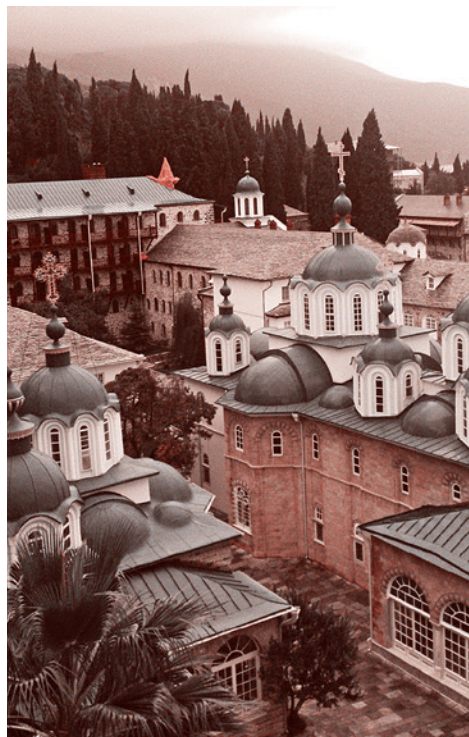
Внутренний вид Русского Свято-Пантелеимонова монастыря на Афоне

Предстоятель РПЦ выразил надежду, что при личном участии Александра Вучича «добрые отношения между нашими братскими народами будут и впредь