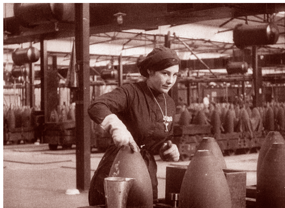
Кадр из фильма «День из жизни рабочего военного завода». Великобритания. 1917 г.

Да, нам порой сложно представить, что когда-то было всё по-другому: уж прочно в обществе укрепилось отношение к женщинам и их правам, которое сформировалось в СССР, где женщины практически наравне с мужчинами могли получить любую профессию, в том числе и военную, и при этом оставались женщинами. Сейчас, конечно, подобное отношение уже не столь укоренено, но всё же как-то подсознательно воспринимается нашими согражданами как подобающее.