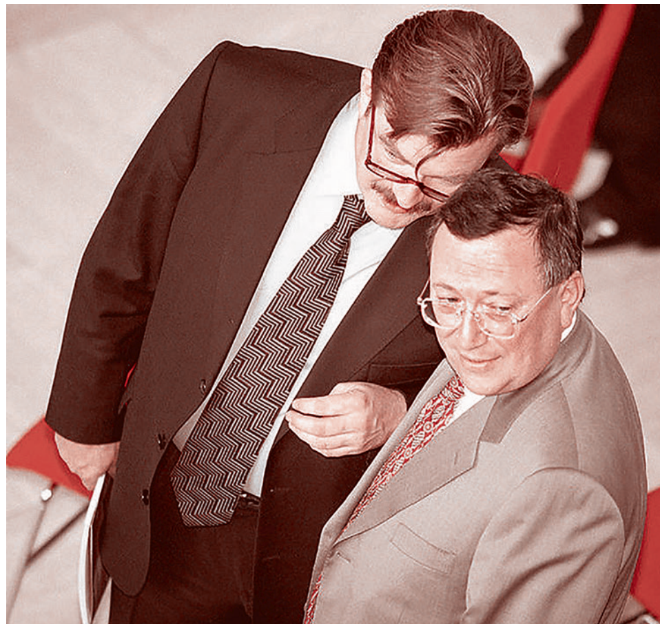
Евгений Киселев и Владимир Гусинский

Зачумление России используют против Трампа. Видите ли, его представители — о ужас! — соприкасались с русскими, и теперь они зачумлены. А как они могли не соприкоснуться? Они соприкасаются еще