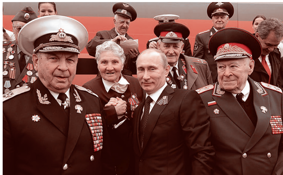
Филипп Денисович Бобков (справа) на военном параде на Красной площади в ознаменование 67-й годовщины Победы в Великой Отечественной войне. 9 мая 2012 г.

и с англичанами, израильтянами, китайцами, представителями исламских народов и так далее. Почему это всё не в счет? Потому что русские для тех, кто атакует Трампа, — это синоним абсолютной зачумленности.