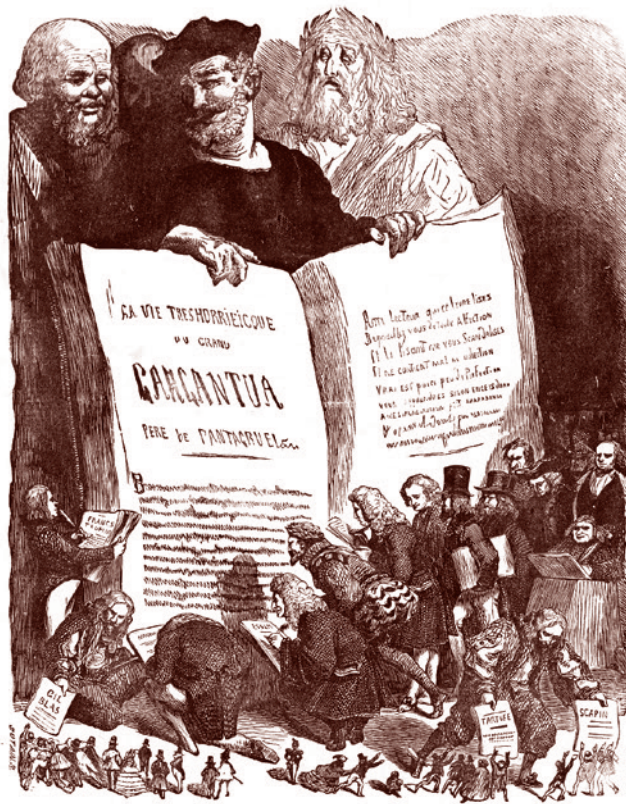
Гюстав Доре. Повесть о преужасной жизни великого Гаргантюа, отца Пантагрюэля. 1854 г.

Читатель ознакомился с классическим рондо. Кстати, рондо — это не только поэтическая, но и музыкальная форма, основанная на определенном повторении и как бы круговом движении, порождая таким повторением.