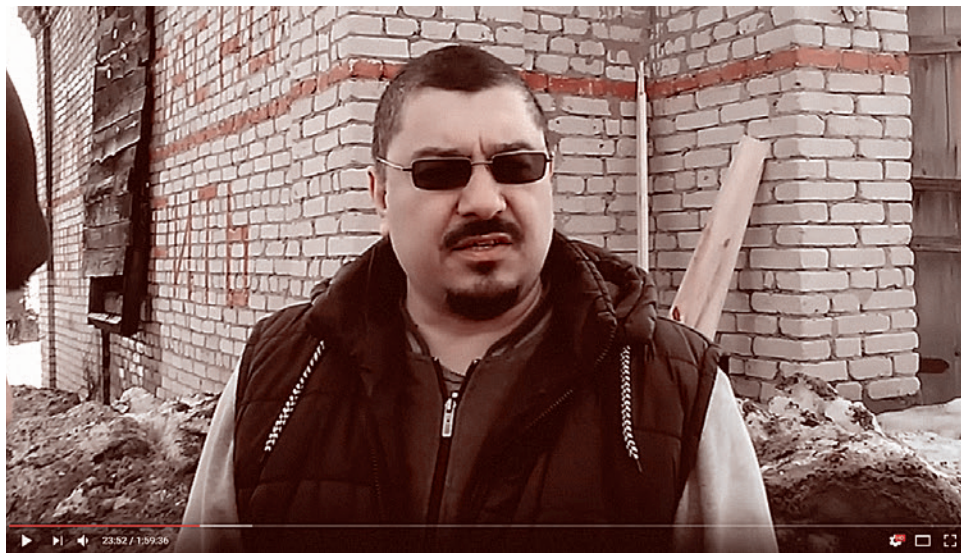
«Архангельский гость». Кадр из 115-го выпуска передачи «Смысл игры»

Бал правит бешенство, лишенное ис- торической страсти. Оно наполнено безу- мынными словами, безумными действиями, оно начинено тупой криминальной контр-