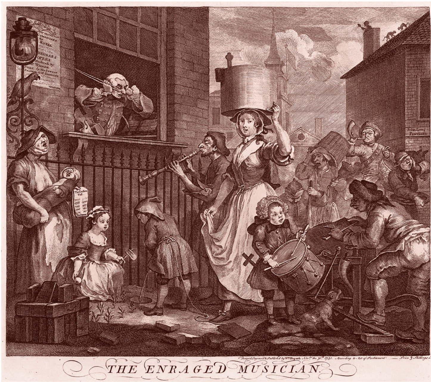
Уильям Хогарт. Взбешенный музыкант. 1741 г.

Крючков работал вот здесь (в Экспериментальном Творческом Центре — прим. ред.), а вовсе не в организации Гусинского (где работал Ф. Д. Бобков в 90-е годы — прим. ред.). Либо организация Гусинского на самом деле была организацией Филиппа Денисовича Бобкова, но тогда он отвечает за всё, что там творилось, за всё, что творил Гусинский, — за его телепередачи,