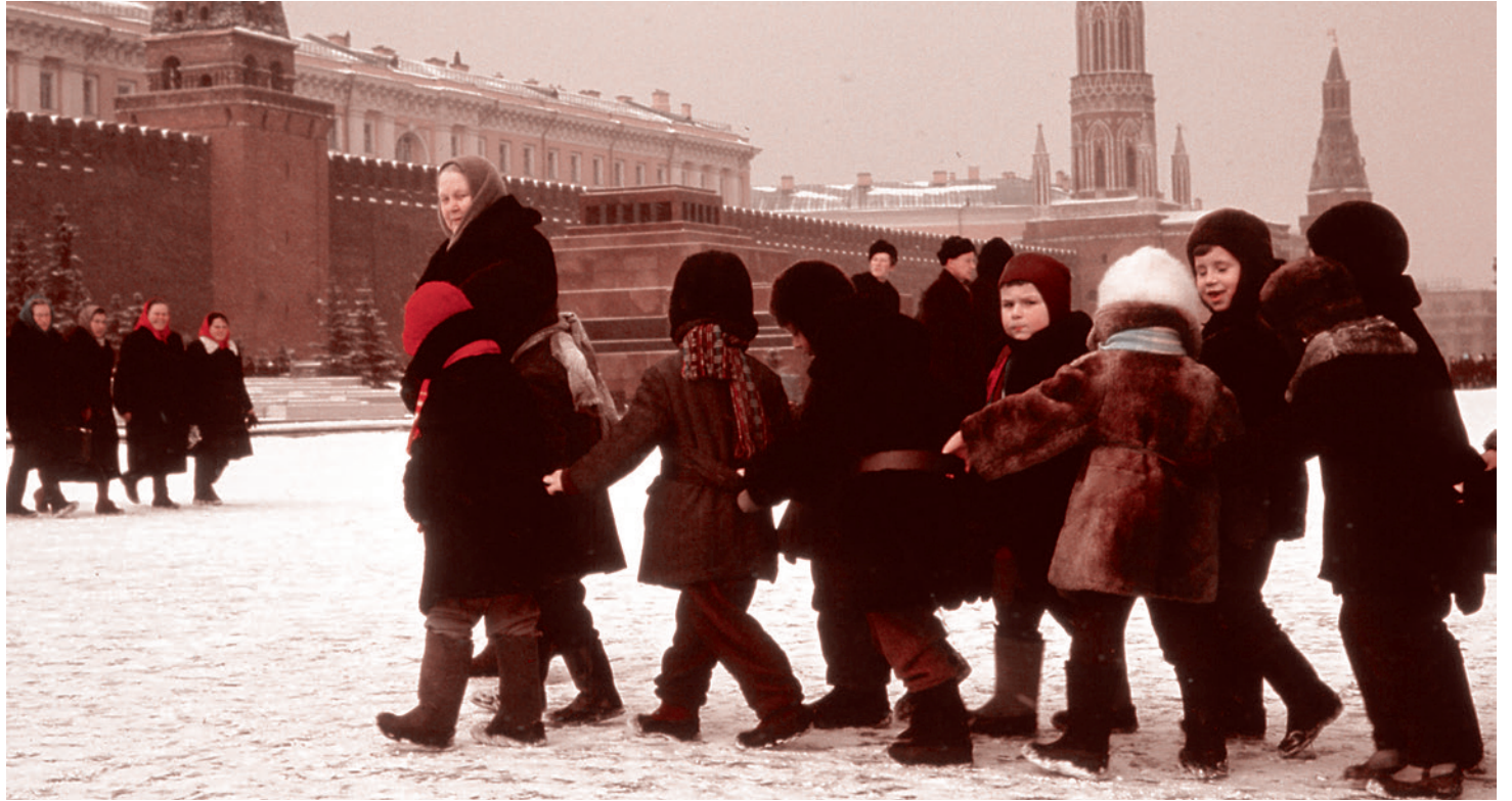
Томас Хаммонд. Дети на Красной площади. 12 марта 1964 г.

Народ смотрел на «хозяев жизни» с ненавистью. Следует, однако, отметить, что ничего конструктивного, системообразующего народная ненависть не породила. Народ не стал отстаивать в массе своей свои права как граждан и людей, а продолжал с надеждой смотреть в телевизор, ожидая, когда «хозяева жизни» нажрются, наворуются и поделятся, наконец, со страной и народом жирными кусками, отхваченными во время разграбления огромного наследия Советского Союза. Про этот аспект требуется писать отдельно и подробно. Этому аспекту посвящен учебник «Мобилизация», но в данном случае я лишь зафиксирую этот факт. Идеи справедливого общества, растоптанные самими людьми во время перестройки, неуклонно