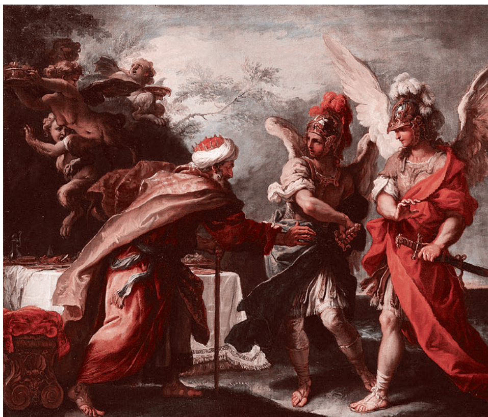
Себастьяно Риччи. Финей и сыновья Беора. Около 1695 г.

А где традиция, там и иррациональность. А также некая нерациональная