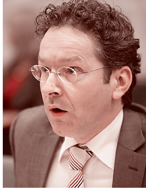
Президент Еврогруппы Йерун Дейсселблум

тем самым, пряча прибыль от полного налогового обложения.