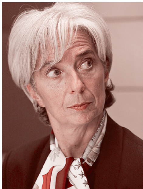
Директор-распорядитель МВФ Кристин Лагард

В декабре 2012 г. завершились сложные переговоры между Россией и Кипром по дополнительному Протоколу к Соглашению об избежании двойного налогообложения.