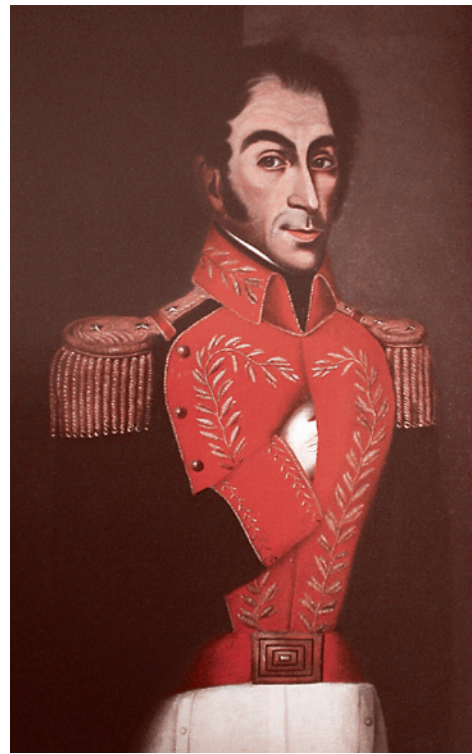
Портрет Симона Боливара. Хуан Лобера, 1827 г.

После прихода к власти Чавеса в Венесуэле сложился настоящий культ Боливара. В 2000 году Чавес переименовал Венесуэлу в Боливарианскую Республику Венесуэла. В июле 2010 года Уго Чавес, стремясь доказать, что Боливар умер не от туберкулеза, а был убит колумбийскими олигархами, провел эксгумацию и экспертизу останков Боливара. Версия Чавеса не нашла прямого подтверждения, но ученые сказали, что будут дальше изучать причины смерти генерала. Скелет Боливара был перезахоронен в огромном мавзолее, напоминающем парус, построенном в центре Каракаса. Именно здесь может быть в итоге похоронен и сам Чавес, которому власти Венесуэлы посмертно вручили копию шпаги Боливара.