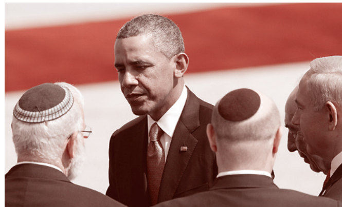
Обама в Иерусалиме, 21 марта 2013 г.

Итак, возможна даже интернационализация конфликта. Вероятность такой интернационализации невелика. Но она впервые после 1991 года не равна нулю. А это привело бы к неслыханной эскалации исследуемой нами мироустроительной (а точнее, миропереустроительной) практики.