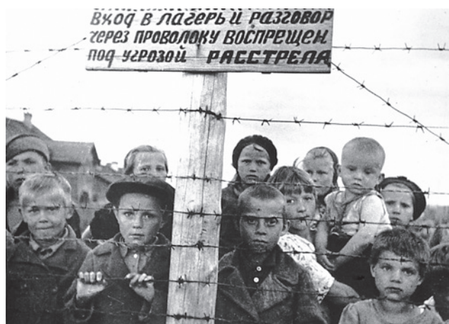
Дети-узники финского концлагеря №6 в Петрозаводске. 1944 г.