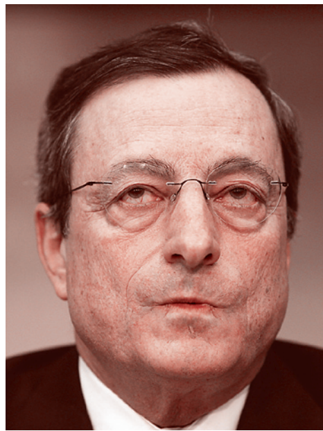
Председатель Европейского ЦБ Марио Драги

11 марта в прессе появились слухи о том, что Минфин РФ сделал Кипру предложение: выдать кредит в 5 млрд евро в обмен на предоставление всех данных о российских вкладчиках кипрских банков. Подтверждений не последовало, но нервозности всем сторонам «войны вокруг Кипра» эти слухи добавили. Многие СМИ начали обсуждать вопрос о том, чем Кипр готов платить за такую щедрость. И появились предположения, что платой станет допуск российских корпораций к освоению крупнейшего кипрского газового месторождения «Афродита».