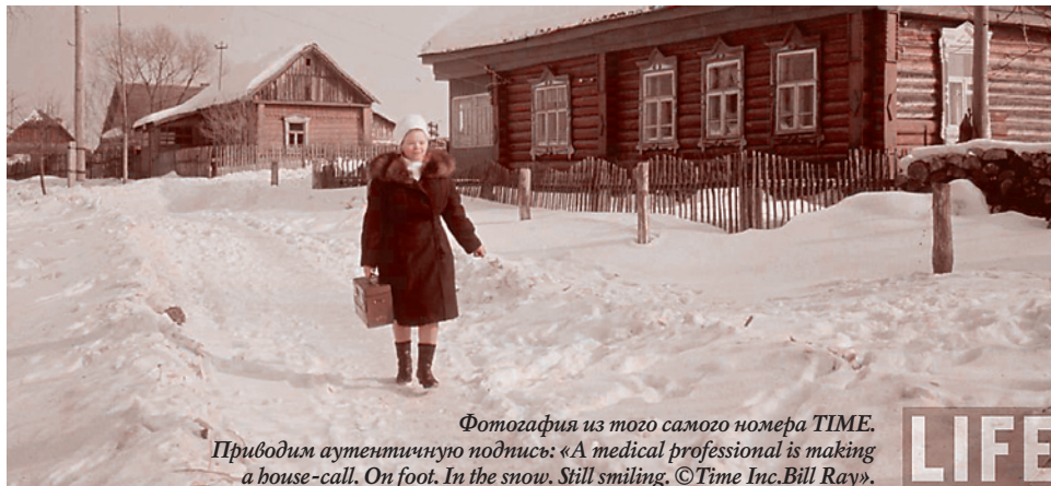
Фотография из того самого номера TIME. Приводим аутентичную подпись: «A medical professional is making a house-call. On foot. In the snow. Still smiling.».

Миф №1. Тотальная политизация в СССР сдерживала развитие медицинской науки, которая развивалась изолированно от мировой, нередко в ложном направлении. Советские врачи не знали не только о современных подходах к лечению, но и о новых