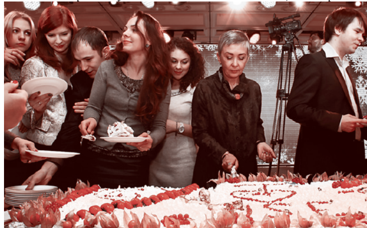
Юбилейная встреча выпускников Высшей школы экономики, 24 декабря 2012 года.