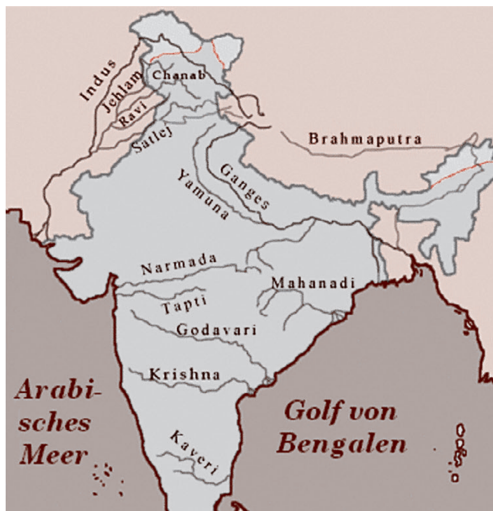
Карта 3. Основные водные проблемы

В итоге США не только сняли с Индии все санкции за испытания ядерного оружия и отказ страны от присоединения к Договору о его нераспространении, но и поддержали в 2016 году заявку Индии на вхождение в такой элитный круг ядерных держав, как Группа ядерных постав-