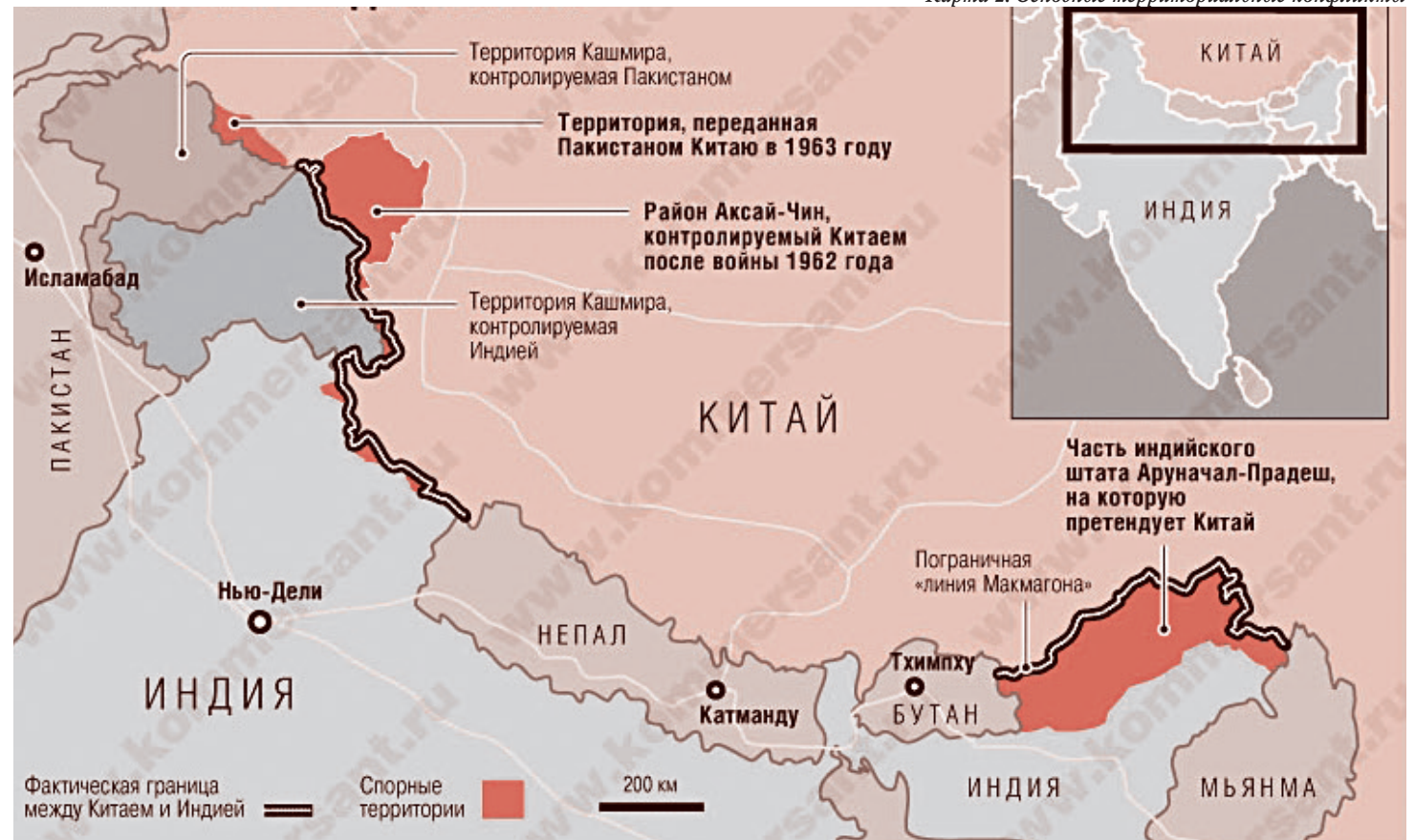
Карта 2. Основные территориальные конфликты

В 2008 году госсекретарь США Кондолиза Райс и глава МИД Индии Пранаб Мукерджи подписали в Вашингтоне второе, более широкое, соглашение о сотрудничестве в ядерной энергетике. Соглашение предусматривало обязательство Индии по-