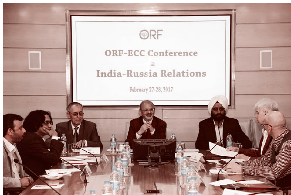
Фото 1. Открытие конференции

Наши отношения с Индией в очень большой степени базировались на высокой заинтересованности СССР в становлении