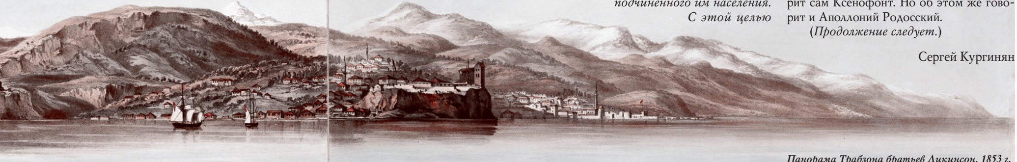
Панорама Трабзона братьев Дикинсон. 1853 г.