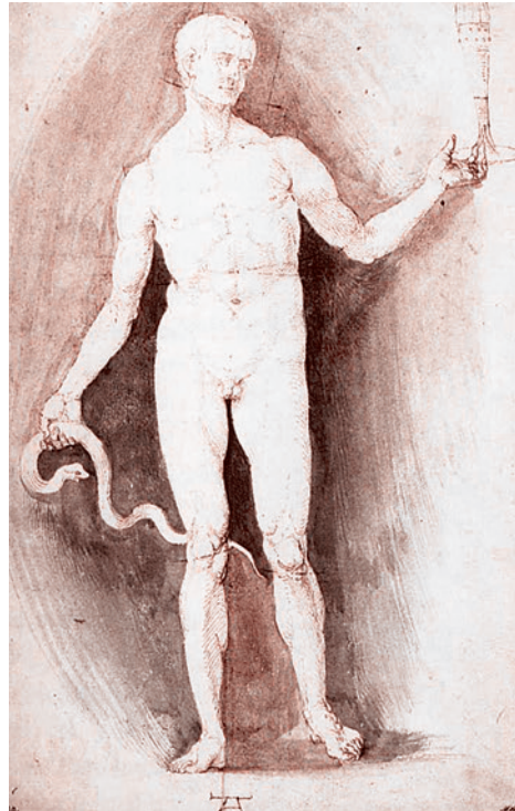
Альбрехт Дюрер. Обнаженный с кубком и змеей (Асклепий). 1500 г.