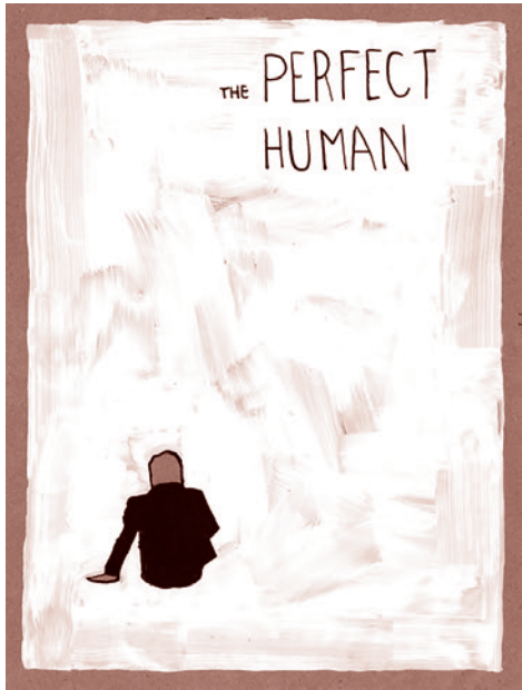
А. Николс. Иллюстрации по мотивам фильма Йоргена Лета «Совершенный человек». 2013 г.

Художники раньше обычных людей улавливают некие импульсы «волнения общества». Что-то носится в воздухе, никто в слова это неясное «не-что» облечь не может до поры до времени. И лишь художникам под силу выразить через образы нервные биения эпохи. Таких посылаемых импульсов носится в воздухе множество. Но признание профессионалов, а также гранты и призы получают лишь определенные направления. С помощью поддержки особых тем глобальная элита может «лепить» будущее для всей планеты.