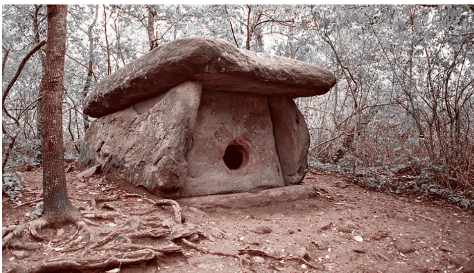
Дольмен на Кавказе

Констатируя это обстоятельство, исследователь далее говорит о том, что Кавказ, в отличие от хаттов с их матриар-