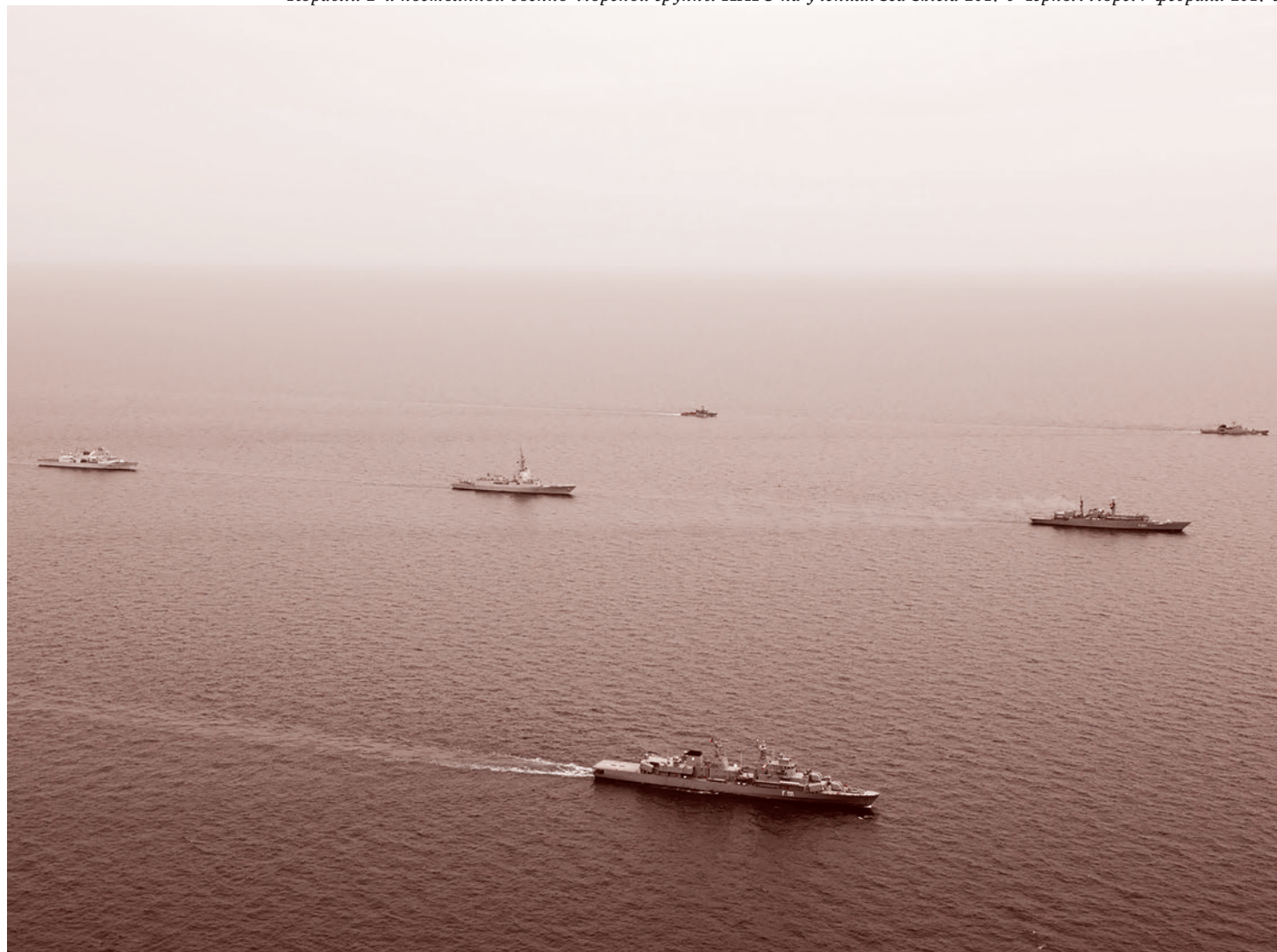
Корабли 2-й постоянной военно-морской группы НАТО на учениях Sea Shield 2017 в Черном море. 9 февраля 2017 г.

Так что радикальная часть «Меджлиса крымскотатарского народа» (организация, деятельность которой запрещена в РФ) во главе с Р. Чубаровым и М. Джемилевым уже представляет интересы исламистов, украинских ультраправых организаций, своих хозяев в Киеве и на Западе, но не интересы крымско-татарского населения полуострова.