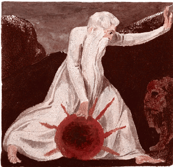
Уильям Блейк. Уризен, творящий Вселенную. Малая книга гравюр. 1796 г.