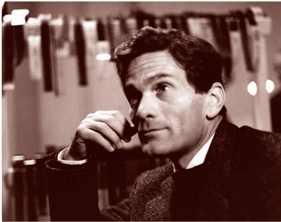
Пьер Паоло Пазолини. 1964 г.

1 февраля 1975 года, отвечая на выступление Франко Фонтини, комментировавшего текст из журнала Il Politecnico , в котором предлагалось провести разгра-