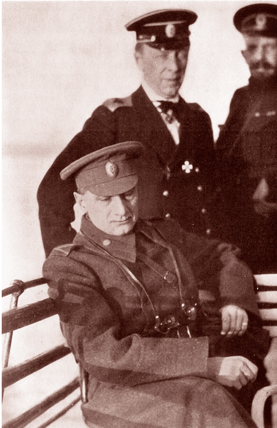
Колчак сидит. Сентябрь 1919 г.