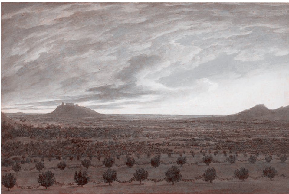
Джон Роберт Козенс. Вид из Мирабеллы. Эвганские холмы. 1782 г.

Отделив автохтонных пруссов от немецкого пруссачества, поработившего автохтонные народы по несправедному благословию лжевадыки христиан римского папы и тем самым противопоставив автохтонных пруссов немецкому пруссачеству (читай — предшественникам Фридриха Великого), Ломоносов далее пишет о близости автохтонных пруссов и тех варягов-россов, которые не варяги вообще, а именно россы.