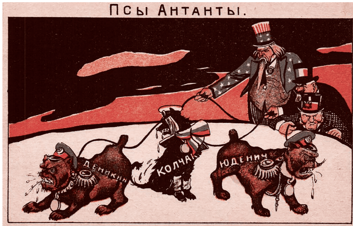
Открытка «Псы Антанты»