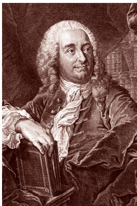
Жан-Мартин Бернигерот. Портрет Христиана фон Вольфа (фрагмент). 1755 г.

Одна из загадок — окружение Елизаветы. Фаворит А.Г. Разумовский... Станный скромный фаворит. И отношение к нему — трепетно-женское, не такое, как должно быть у разгульной властительницы. То же самое с И.И. Шуваловым. Со всем скромный человек, в отличие от своих