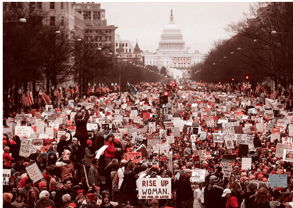
Протестующие на улицах Вашингтона. 21 января 2017 г.

В соцсетях также обратили внимание на то, что Трамп фактически процитировал в своей речи Бэйна — злодея из вселенной DC Comics. В фильме «Темный рыцарь: Возрождение легенды» антигерой говорит: «Сегодня мы возвращаем власть вам — народу». Трамп действительно повторил эту фразу почти слово в слово.