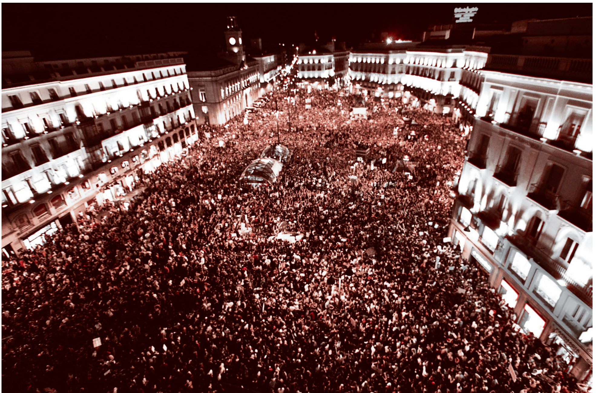
Митинг сторонников движения 15М на площади Пуэрта-дель-Соль в Мадриде. 15 октября 2011 г.

23 марта 2011 года в мадридском центре технологий и инноваций Medialab-Prado прошла конференция, под названием «#Redada 6: Гражданские права, активизм в интернете». Разбирались следующие темы: «Усиливают ли социальные сети активизм? Необходимо ли выйти на улицы тысячам граждан для политических перемен и спровоцировать социальные дебаты?»