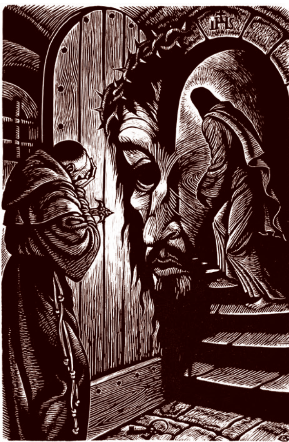
Фриц Айхенберг. Иллюстрация к главе «Великий Инквизитор» романа «Братья Карамазовы» Ф. М. Достоевского

«Великий пророк твой в видении и в иносказании говорит, что видел всех участников первого воскресения и что было их из каждого колена по двенадцати тысяч. Но если было их столько, то были и они как бы не люди, а боги. Они вытерпели крест твой, они вытерпели десятилетия лет голодной и нагой пустыни, питаясь акридами и кореньями, — и уж, конечно, ты можешь с гордостью указать на этих детей свободы, свободной любви, свободной и великопленной жертвы их во имя твое. Но вспомни, что их было всего только несколько тысяч, да и то богов, а остальные? И чем виноваты остальные слабые люди, что не могли вытерпеть того, что могучие? Чем виновата слабая душа, что не в силах вместить столь страшных даров? Да неужто же и впрямь приходил ты лишь к избранным и для избранных? Но если так, то тут тайна и нам не понять ее. А если тайна, то и мы вправе были проповедовать тайну и учить их, что не свободное решение сердца их важно и не любовь, а тайна, которой они повинуются должны слепо, даже мимо их совести. Так мы и сделали. Мы исправили подвиг твой и основали его на чуде, тайне и авторитете. И люди обрадовались, что их вновь повели как стадо и что с сердцем их снят наконец столь страшный дар, принесший им столько муки. Правы мы были, уча и делая так,